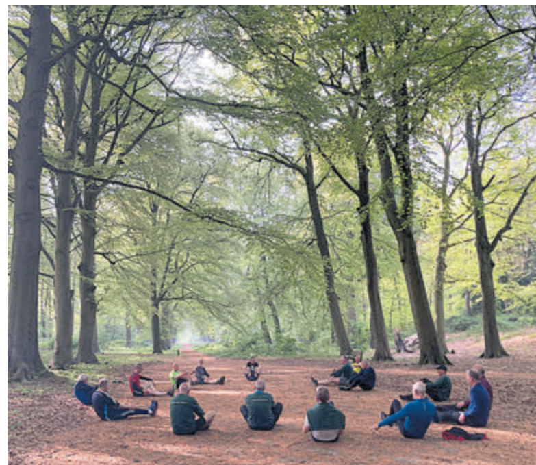
De trimmers omgeven door een groen Groenendaal.

Kom vrijblijvend een proeftraining meedoen op de zaterdagmorgen tegen acht uur in Groenendaal op de parkeerplaats naast de tennisclub en doe lekker mee.