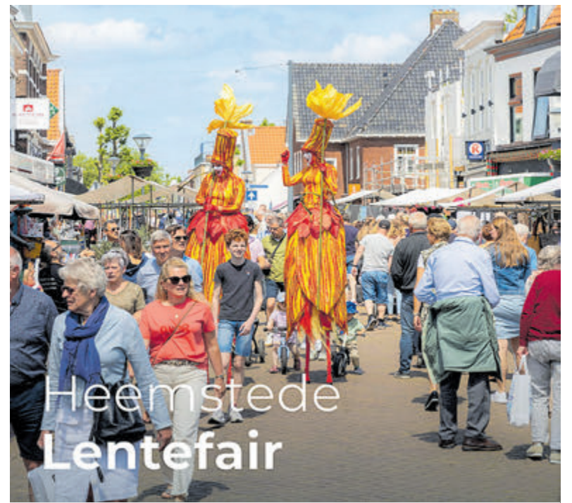
Gezellige Lentefair in WCH.

Kortom, er is voor iedereen wel wat te zien of te doen. Alvast veel plezier!