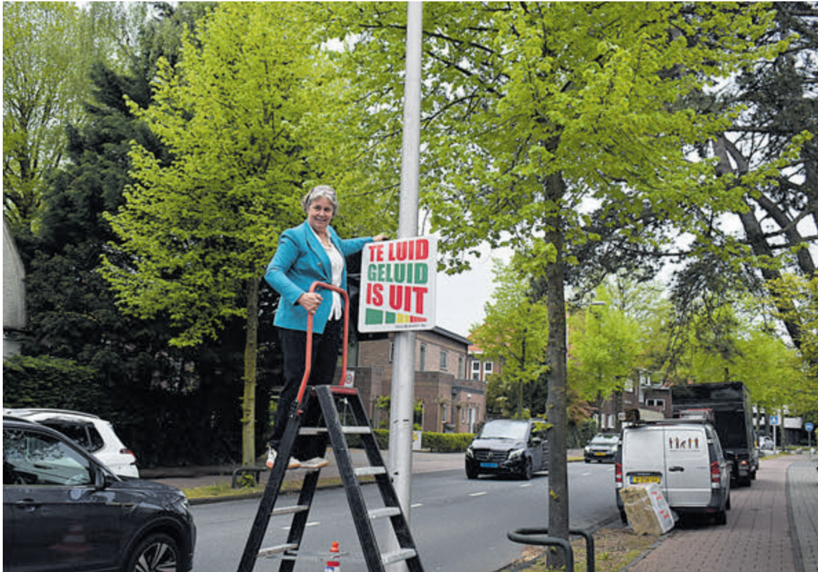
Onthulling bord.