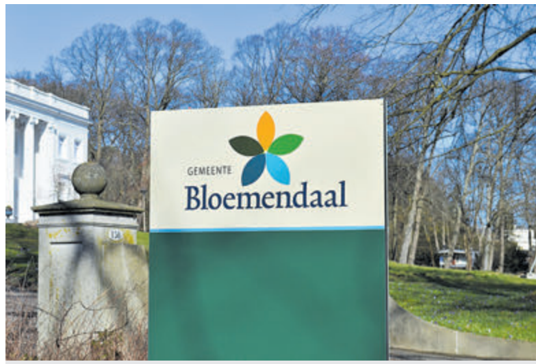
Bloemendaal koploper met slechts geïsoleerde huizen.