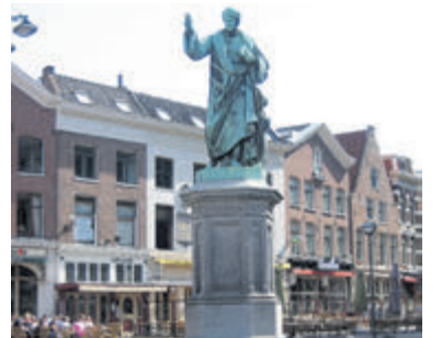
Standbeeld Laurens Janszoon Coster.