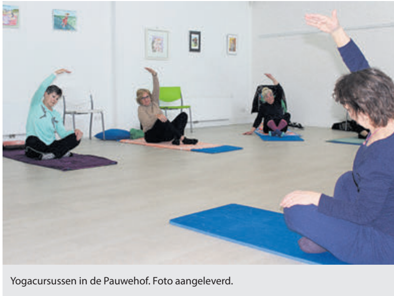
Yogacursussen in de Pauwehof. Foto aangeleverd.