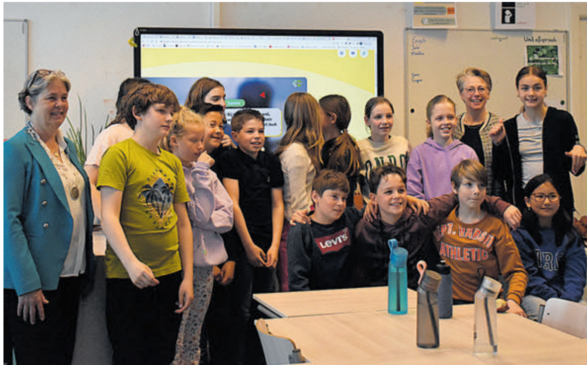
In de klas op De Molenwerf.

Alle inwoners wordt gevraagd na te denken over een nieuwe traditie of misschien wel meerdere tradities. Inloggen op tradities.heemstede.nl wijst direct naar de site waarop u uw idee kunt aangeven. De tijd om suggesties kenbaar te maken is kort, voor 4 juni moeten de ideeën binnen zijn. De gemeente kijkt dan eerst naar de haalbaarheid. Tussen 19 juni