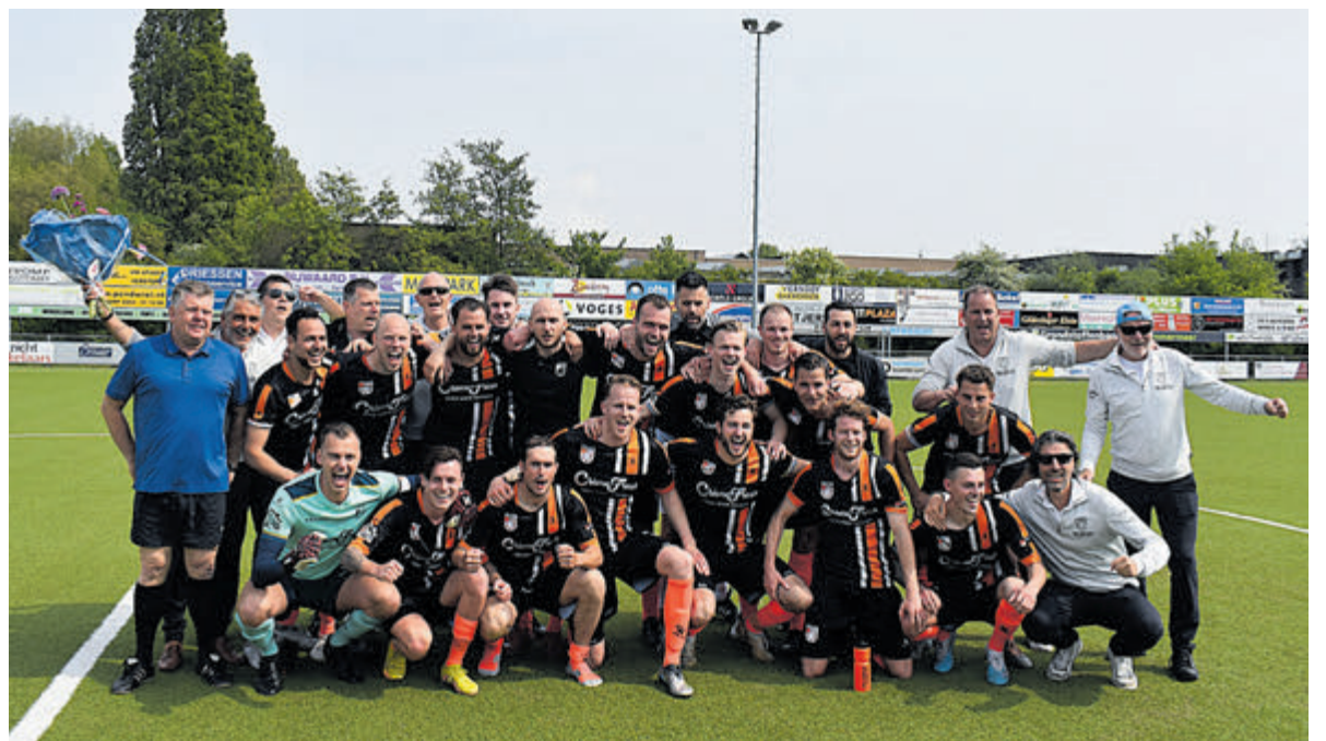
Het kampioensteam.

Het duel begon in een wat gezapig tempo, waarbij HBC het meeste in balbezit was. De eerste kans voor HBC liet op zich wachten tot de 21e minuut. Topscorer Arno Dijkstra kopte een bal recht in de handen van de Hillegom doelman Tom Tebbens. Het tempo ging wat omhoog, waarna het spel zich vooral op de helft van Hillegom afspeelde. Een van de spelmakers van HBC, Jeroen de