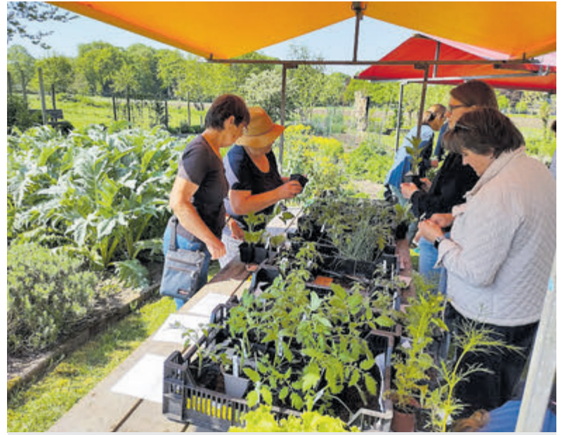
Een drukte van belang op de Moestuinmarkt van KIMT.

uit de pan rijzende prijzen van groenten en fruit is zo'n moestuin natuurlijk een prachtig zelfvoorzienend projectje voor velen, misschien mag je het zelfs een noodzaak noemen. En nog leuk om te doen, je eigen biologische groenten zien opgroeien. Er was zelfs een kraam met schapenwol. Naast de moestuinplantjes, was er veel aanwezig voor de inwendige mens. Er waren zelfgebakken taarten en er was koffie thee en limonade. Tevens was eraan de kids gedacht, die bloemzaadbolletjes konden maken. Altijd wat te doen bij KIMT!