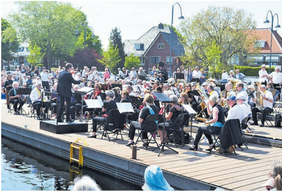
De Haven van Heemstede werd opgeluisterd met gezellige muziek.

Allerhande muziek kwam voorbij, waarvan het in groten getale gekomen Heemstedse publiek met volle teugen genoot. "Gezellig zo'n concert in de buitenlucht, met je dorpsgenoten zo onder elkaar", klonk het regelmatig.