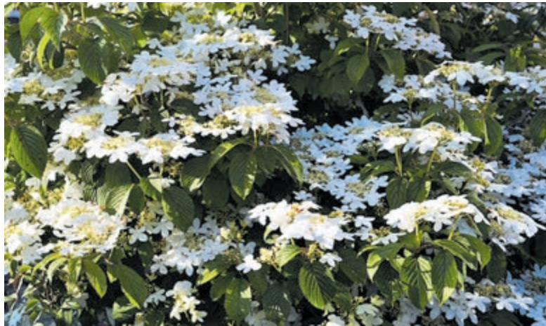
Tijd voor een Lentefair in deze bloeiende meimond.

Vogelenzang - Aan de Deken Zondaglaan voor de COOP in Vogelenzang vindt op zaterdag 21 mei een Lentefair plaats. Deze fair wordt gehouden van 10.00 tot 17.00 uur. Er zullen diverse kramen staan met de meest uiteenlopende artikelen, zoals kleding, sieraden, creatieve cadeaus, geschenken van hout, laser snijwerk, kaarsenhouders en lampen, auto-tjes en beelden. Ook kan de inwendige mens versterkt worden met onder andere versgebakken olie-bollen. De organisatie hoopt op veel gezelligheid en mooi weer. Voor informatie kan men terecht bij info@ac-media.nl .