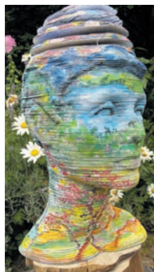
Werk van Francisca Janssen.