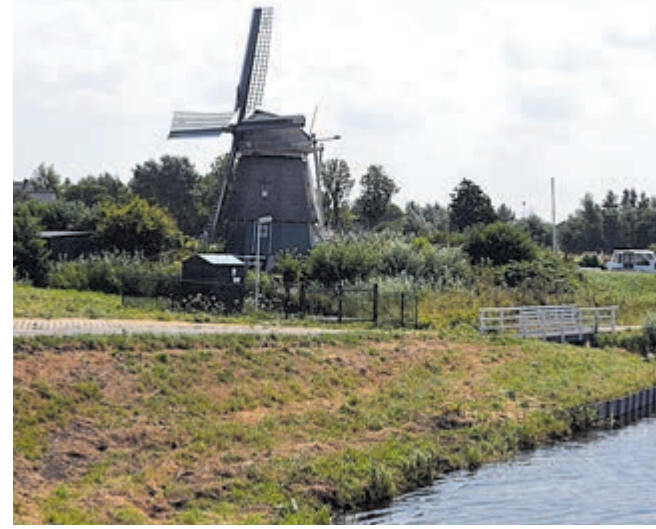
Molen de Hommel.

Voor kinderen is gratis een molenbouwplaat op te halen. Kijk op www.molens.nl voor meer informatie over de deelnemende molens met de adressen.