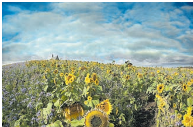
Werk van Chris Timmers.

De Nature Art Fair is zaterdag 18 en zondag 19 mei, beide dagen van 11 - 18 uur. Entree is € 10,- p.p. (online voorverkoop € 7,50) en is inclusief museumtoegang. Jeugd t/m 14 jaar gratis entree. Het adres van het museum is Kudelstaartseweg 1 in Aalsmeer (tegenover de watertoren). Meer informatie: www.natureartfair.nl .