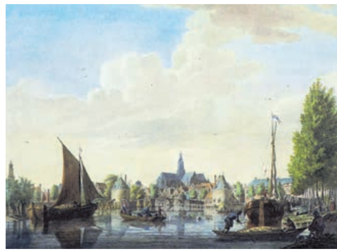
Gezicht op Grote Kerk met Catharijnebrug over het Spaarne ter hoogte van de Koudenhorn.

De fietsexcursie start op zaterdag 18 mei om 9 uur en volgt de weg van het water. De tocht begint bovenop de zoetwaterbel van de jonge duinen en eindigt bij het boezemgemaal in Spaarndam. Onderweg is er aandacht voor voormalige blekerijen, bierbrouwers en buitenplaatsen. Ook de