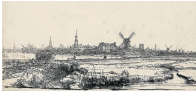
Rembrandt van Rijn - Gezicht op Amsterdam vanaf de Kadijk, 1640 (uit collectie Teylers Museum).