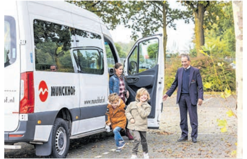
Munckhof is op zoek naar chauffeurs voor leerlingenvervoer in meerdere regio's.

naar de klant toe. In je handelen staat veiligheid van jezelf, je klanten en medeweggebruikers voorop! De werktijden zijn veelal in de vroege ochtenduren en middaguren. Om beroepsmatig personen te vervoeren heb je een chauffeurskaart taxi nodig. Heb je deze niet, dan vergoedt Munckhof de opleiding ter waarde van 1200 euro. Kijk voor meer informatie op http://werkenbij.munckhof.nl en solliciteer direct!