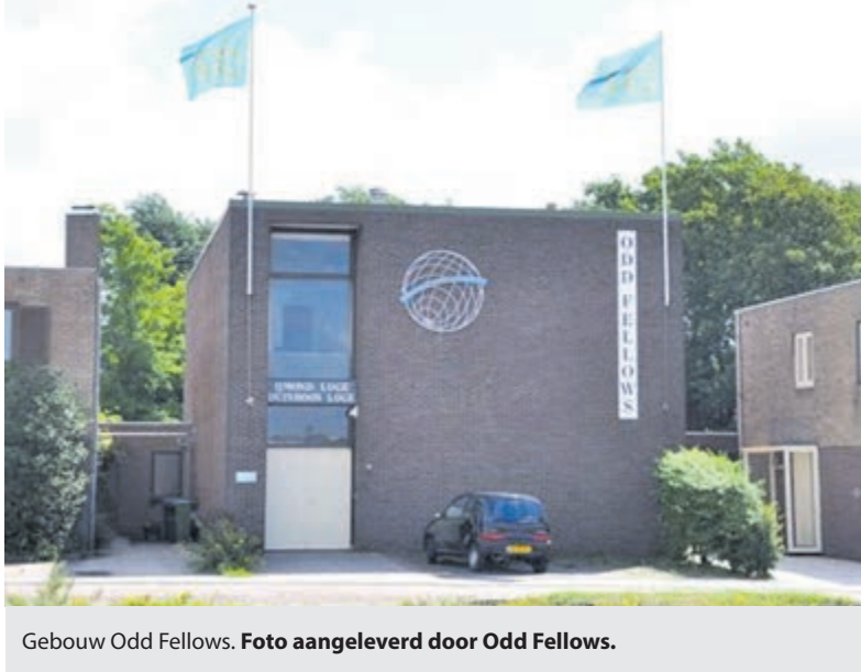
Gebouw Odd Fellows.