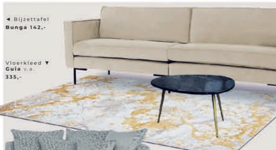
◀ Bijzettafel Bunga 142,-