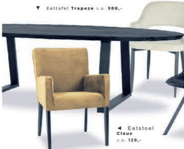
▼ Eettafel Trapeze v.a. 988,-