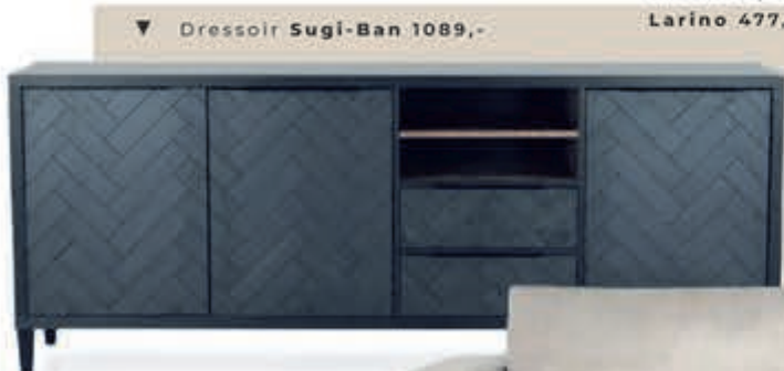
▼ Dressoir Sugi-Ban 1089,-