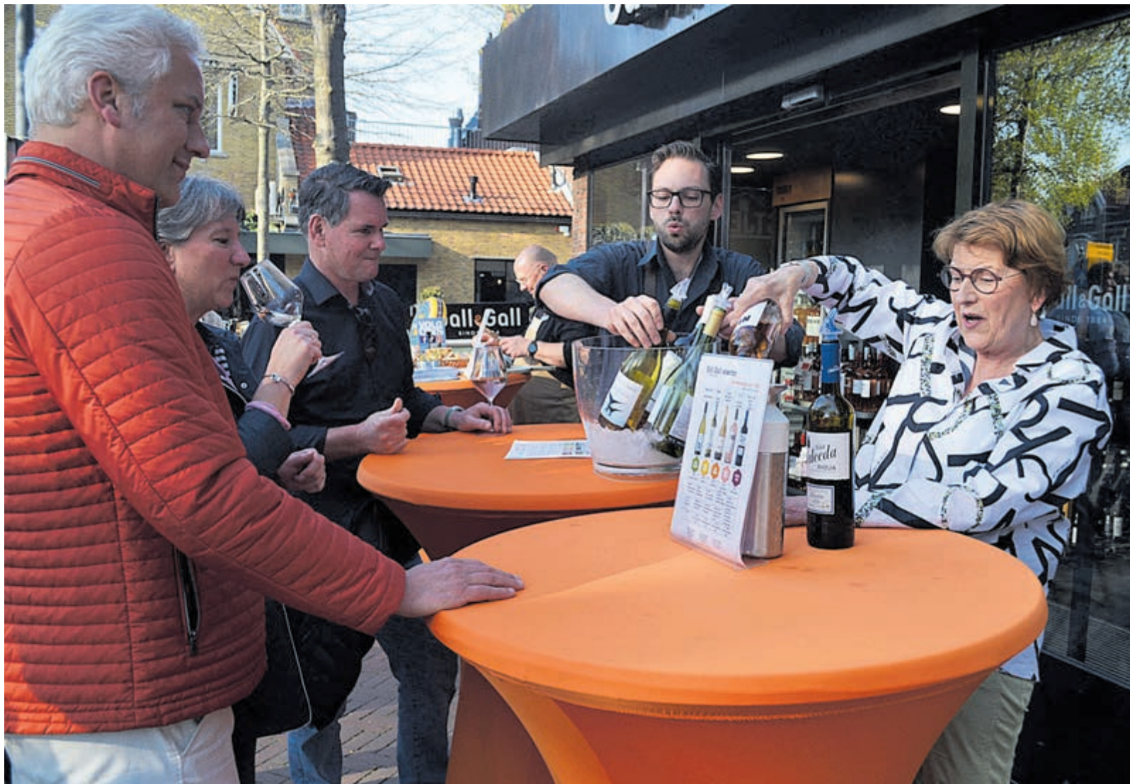
Ongedwongen gezelligheid in Winkelcentrum Heemstede.

Kwaliteitslagerij van der Werff Kijk voor onze advertentie op pag. 5