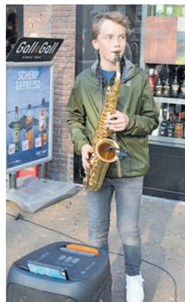
Ook jonge muzikanten in WCH.

en een disco. Zo luisterde Rudolf Krueger bij de Oosterlaan de sfeer muzikaal op, stond een groot podium ter hoogte van Boekhandel Blokker waar The Busquitos een spetterend optreden verzorgden, speelde de band Jabb bij de Iepenlaan, de Teisterband ter hoogte van Meaz Reyngoud en stond bij Chocolaterie/IJssalon Van Dam een DJ heerlijke dansmuziek te draaien. Lopend door de winkelstraat zorgde harmonie De Muggenblazers voor een extra vrolijke (borrel)noot. Ook de Heemstedse horecagelegenheden maakten het extra gezellig, waardoor de terrassen overvol zaten. Na de Wijnloop deed het feestelijke Bloemencorso door de winkelstraten nog als toetje een extra duit in het zakje. De inwoners die de Heemstede sprak waren zeer te spreken over dit evenement, een mooie opsteker voor WCH. Kortom: laat brood, bloemen en wijn uw vrienden zijn, dit evenement is zeker voor herhaling vatbaar: bis bis en chapeau! Elders in deze krant nog meer foto's van deze dag.