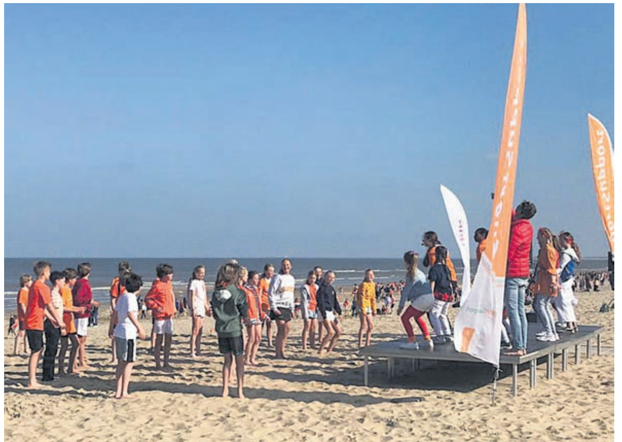
Heerlijk weer tijdens de Koningsspelen.