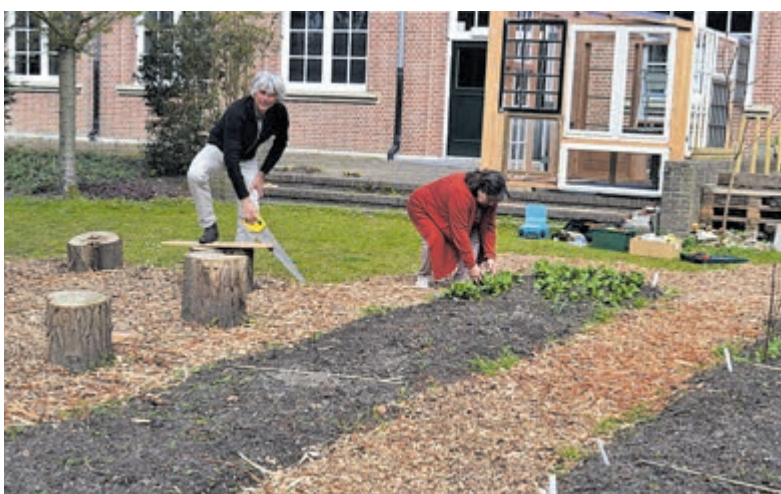
De moestuin op Hageveld.

Er wordt niet alleen op het terrein van college Hageveld geaaid voor de bijen, maar de school beschikt ook over een fraaie ecologische moestuin, waar de scholieren op duurzame wijze gewassen leren verbouwen. Een mooi initiatief waar buiten groente ook nog groene vingers gekweekt worden. Want wie zaait zal uiteindelijk oogsten. Chapeau!