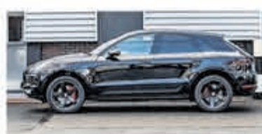
Porsche Macan 3.0 S € 43.900,-