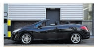
Peugeot 308 CC 1.6 VTi Sport Pack €7.900,-