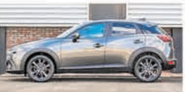
Mazda CX-3 2.0 SAG SkLGT €21.900,-