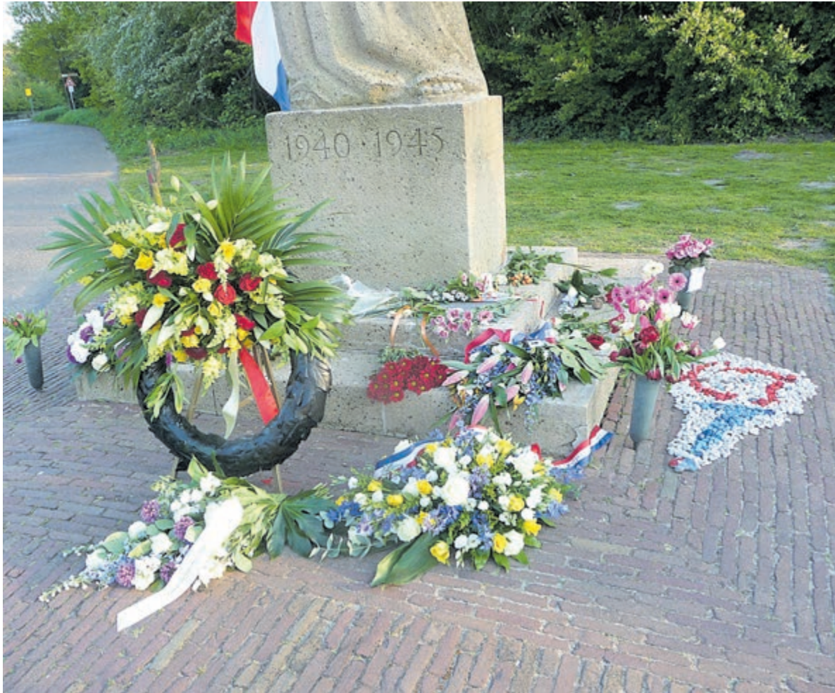
Bloemen bij Vrijheidsmonument in Groenendaal.