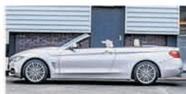
BMW 4-serie Cabrio 420d High Executive €22.50,-