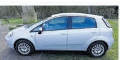
Fiat Punto 1,2 Pop €5.450,-