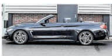
BMW 4 Serie 430i Cabrio €49.950,-