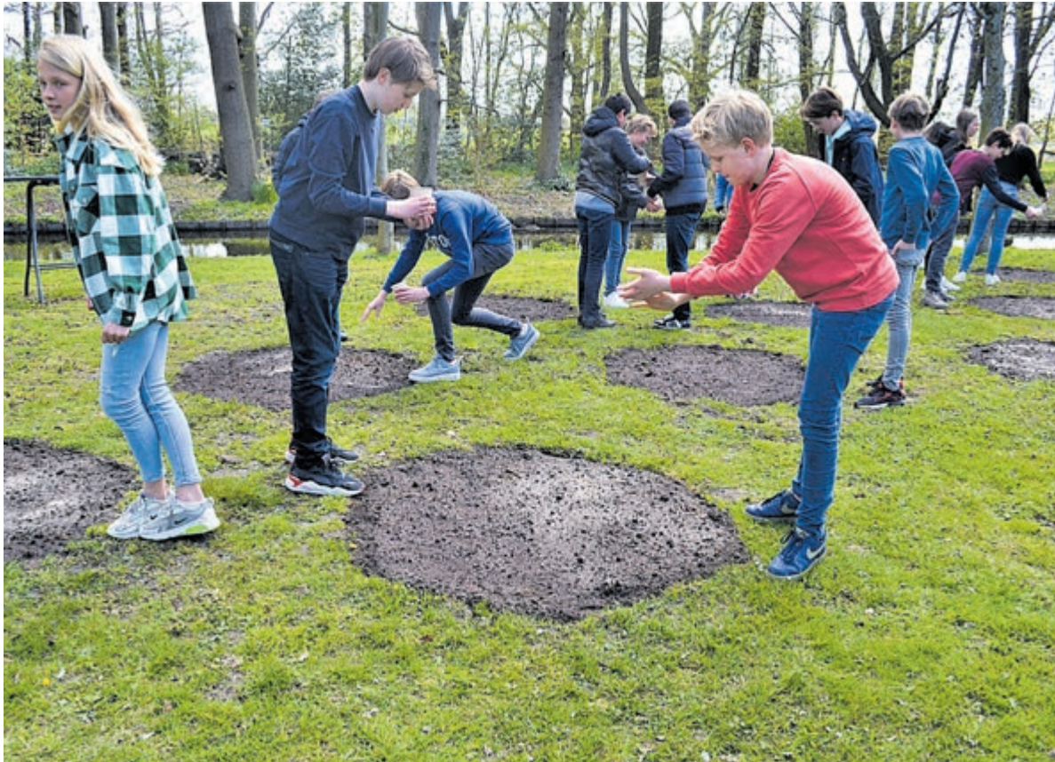
Scholieren van Hageveld aan de slag met inzaaien.