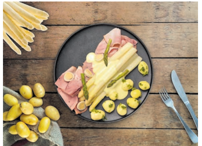
Asperges.