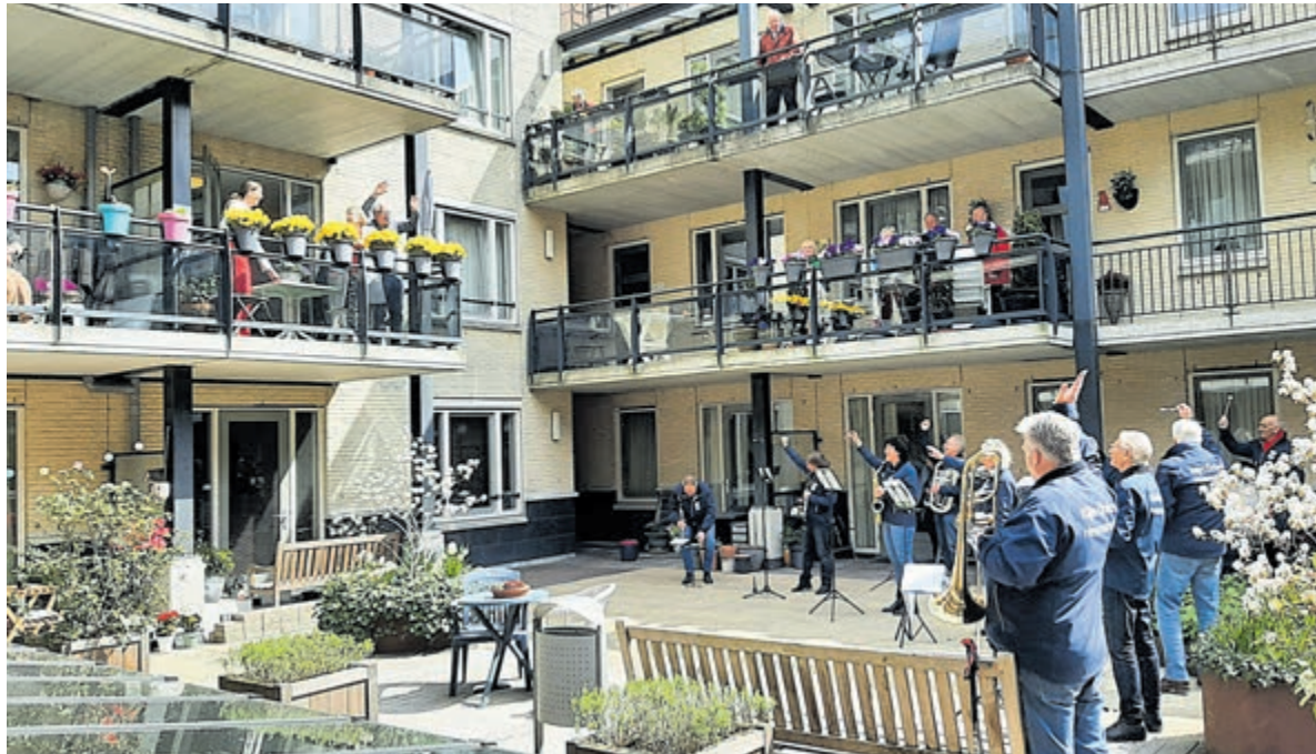
Huwelijksaubade door Harmonie St. Michaël.