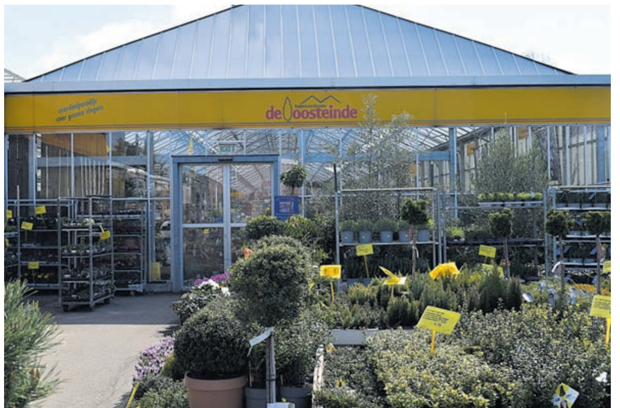
Impressie van de winkel.