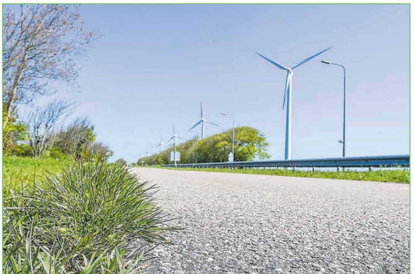
Asfalt dat kan worden hergebruikt. Eén van de maatregelen die de provincie gaat nemen.

In totaal gaat de provincie met zo'n 40 projecten aan de slag om duurzaamheidsmaatregelen toe te voegen. Het gaat daarbij aan de ene kant om investeringsprojecten, zoals bijvoorbeeld het tegengaan van wateroverlast, sedumdakbedekking van abri's, toepassen van hergebruikt beton en het plaatsen van filters op machines om stikstof op te vangen. Aan de andere kant gaat het om onderhoudsprojecten, bijvoorbeeld de extra aanplant van groen en het stimuleren van meer inzet van elektrisch materieel. Het budget geeft de provincie