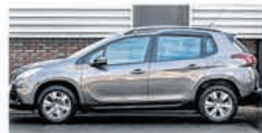
Peugeot 2008 1.2 PureTech Active €14.900,-