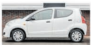
Suzuki Alto 1.0 Comfort EASSS €4.950,-