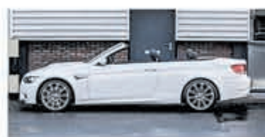
BMW M3 cabrio M3 M DCT €34.900,-