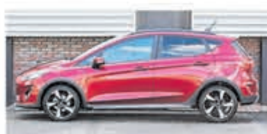
Ford Fiesta 1.0 EcoB. Active € 18.950,-