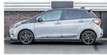
Toyota Yaris 1.5 Hyb. Executive €17.900,-