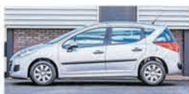
Peugeot 207 SW 1.4 XR €4.450,-