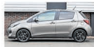
Toyota Yaris 1.5 Full Hybrid Dyn. €13.900,-