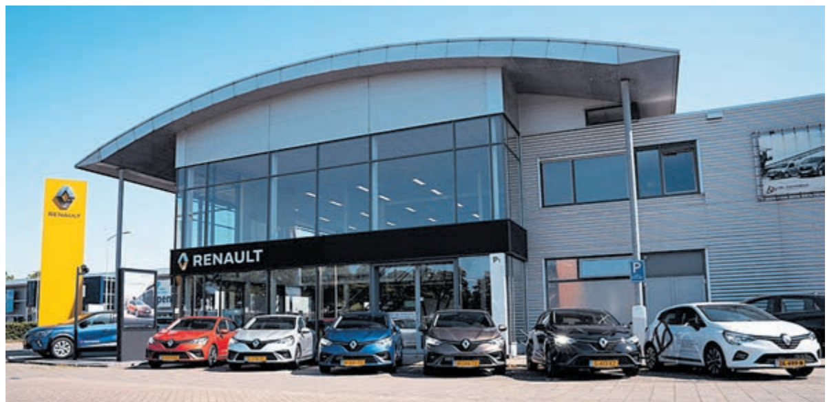
Renault Velsersbeek.

Ook de Renault Clio en de Renault Captur zijn zuiniger dan ooit. Ze zijn verkrijgbaar als (plug-in) hybrid, LPG (bi-fuel) én benzinemotor. Milieuvriendelijk rijden was nog nooit zo eenvoudig. Maak een afspraak in de showroom of plan een proefrit op locatie. Het team van Renault Velsersbeek houdt zich uiteraard aan de landelijke richtlijnen van het RIVM en de GGD. Graag tot ziens in de showroom.