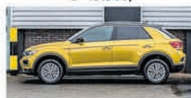
Volkswagen T-Roc 1.5 TSI €26.900,-