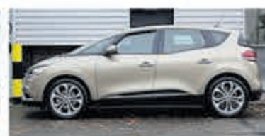
Renault Scenic TCe 115 Zen Navigatie/Trekhaak € 19.900,-