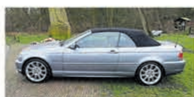
BMW 3 SERIE 330Ci Cabrio Executive €9.950

Turenhout de occasiondealer van Heemstede en al meer dan 40 jaar uw vertrouwde onderhoudsadres.