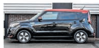
Kia e-Soul ExecutiveLine 64kWh €24.750,-