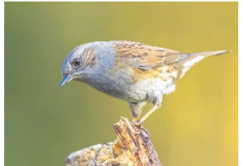
De heggenmus ( Prunella modularis ).

Het wijfje broedt de eieren in 13 weken uit. Een heggenmus heeft gemiddeld twee tot drie broedsels. Soms legt de koekoek een van haar eieren in het nest van de heggenmus. De heggenmus broedt ook deze eieren gewoon uit.