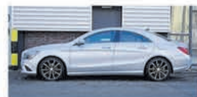
Mercedes-benz CLA-klasse 180 Ambition € 17.900,-