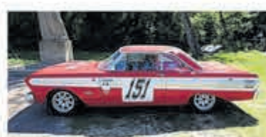
Ford USA Falcon FUTURA SPRINT €79.000,-