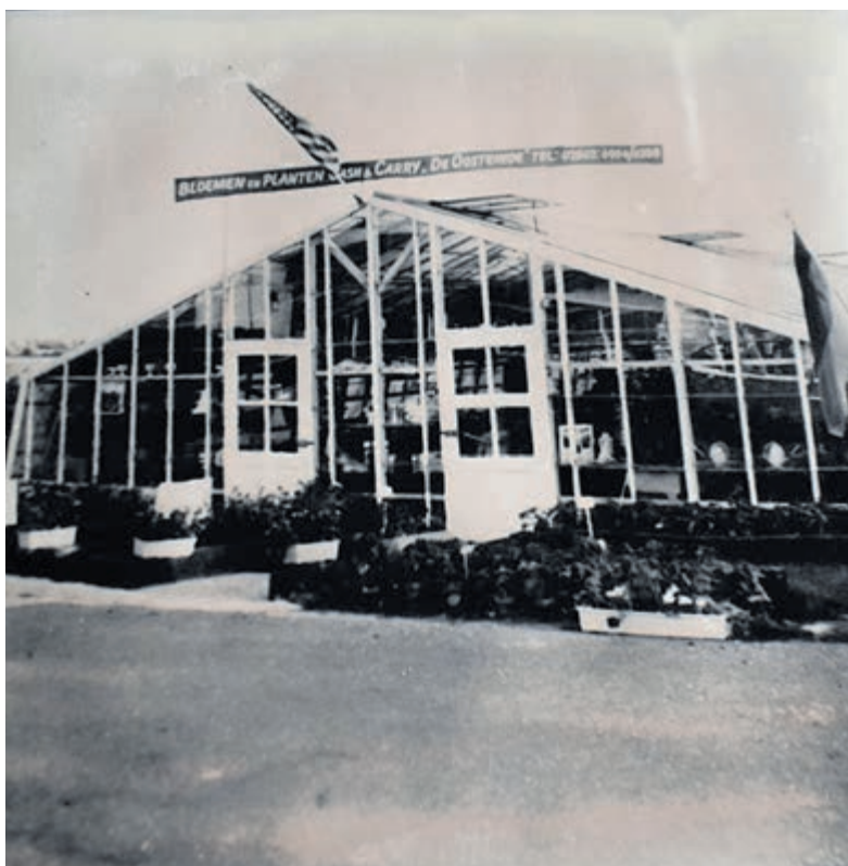
De eerste kas in 1971.