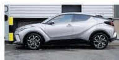
Toyota C-HR 1.8 Hybrid Executive € 26.900,-