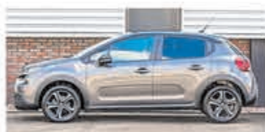
Citroen C3 1.2 PT S&S Feel €16.450,-