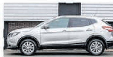
Nissan Qashqai 1.2 Tekna + €16.950,-