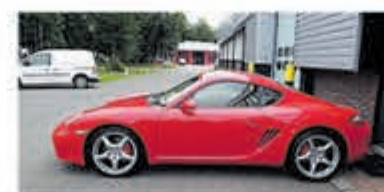
Porsche Cayman S Tiptronic Uniek € 32.950,-