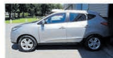
Hyundai ix35 2.0i CVVT StyleVersion 4WD €9.750,-