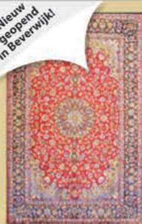
Nergens zo voordelig