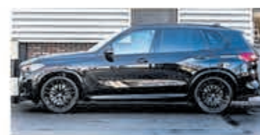
BMW X5 xDrive45e High Exec. €82.500,-