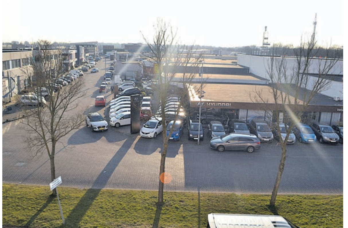
Hyundai Velsersbeek.

Meer info via www.hyundai.com/nl/dealer/velserbeek.html of op tel.nr. 023-5132944.