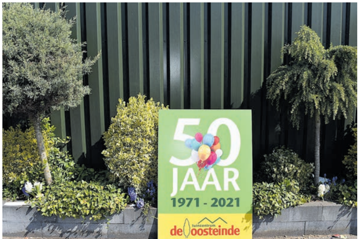
Reclamebord 50 jaar.