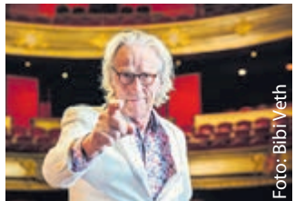
Freek de Jonge