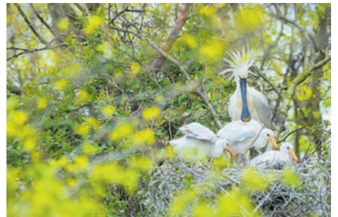
Lepelaars met jongen.

Regio - Landschap Noord-Holland heeft een speciale wandel- en fietsroute gemaakt voor iedereen die de lepelaars wil zien. De routes lopen door de natuur in de buurt en langs de lepelaarkolonie. De wandelroute is 10 of 14 km lang en de fietsroute 23 km. In de bomen van het natuurgebiedje De Liede aan de rand van Haarlem broedt dit jaar weer een bijzondere kolonie lepelaars. Dit is een van de allerbeste plekken in Nederland om de prachtige witte vogels van dichtbij te zien. Het wel en wee van de lepelaars is te volgen via de webcams van Beleef de Lente (Vogelbescherming Nederland). De wandelroute is 10 of 14 km lang en de fietsroute 23 km.