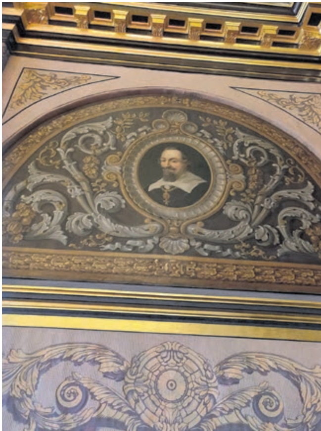
Portret van Adriaan Pauw door Andries de Haen en Nicolaas Willingh.

Na het overlijden van Pauw is hij opgevolgd door de jonge, geleerde en talentvolle Johan de Witt, die zich zou ontwikkelen tot een staatsman van formaat en in het rampjaar 1672 met zijn broer Cornelis, door dronken lieden van de Haagse schutterij jammerlijk is vermoord. Vergaderingen van de aanvankelijk 17, later 7 gewesten van de Nederlanden werden