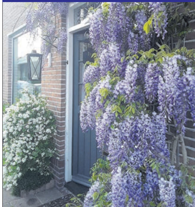
Heemstede - Helma Kuiper uit Heemstede stuurde deze foto in van deze mooie bloeiende blauwe regen. Een prachtig gezicht zo in de straat.