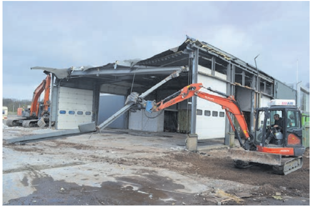
De sloop van de oude panden is begonnen.