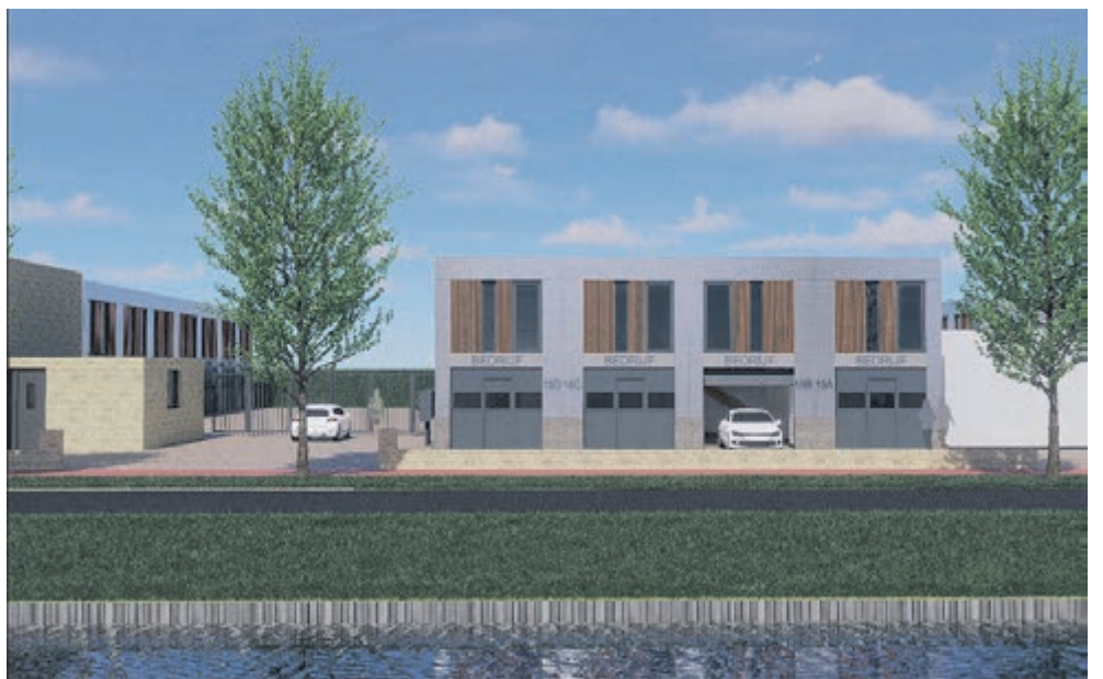
Beeld van hoe de nieuwe bedrijfsunits eruit gaan zien. Beeld aangeleverd.

Heeft u interesse in deze moderne duurzame bedrijfsunits? Voor meer informatie kunt u terecht bij Janus Makelaardij op tel. nr. 0255-547577, per e-mail op: makelaardij@janusmakelaardij.nl. Website: www.janusbedrijfsmakelaardij.nl.