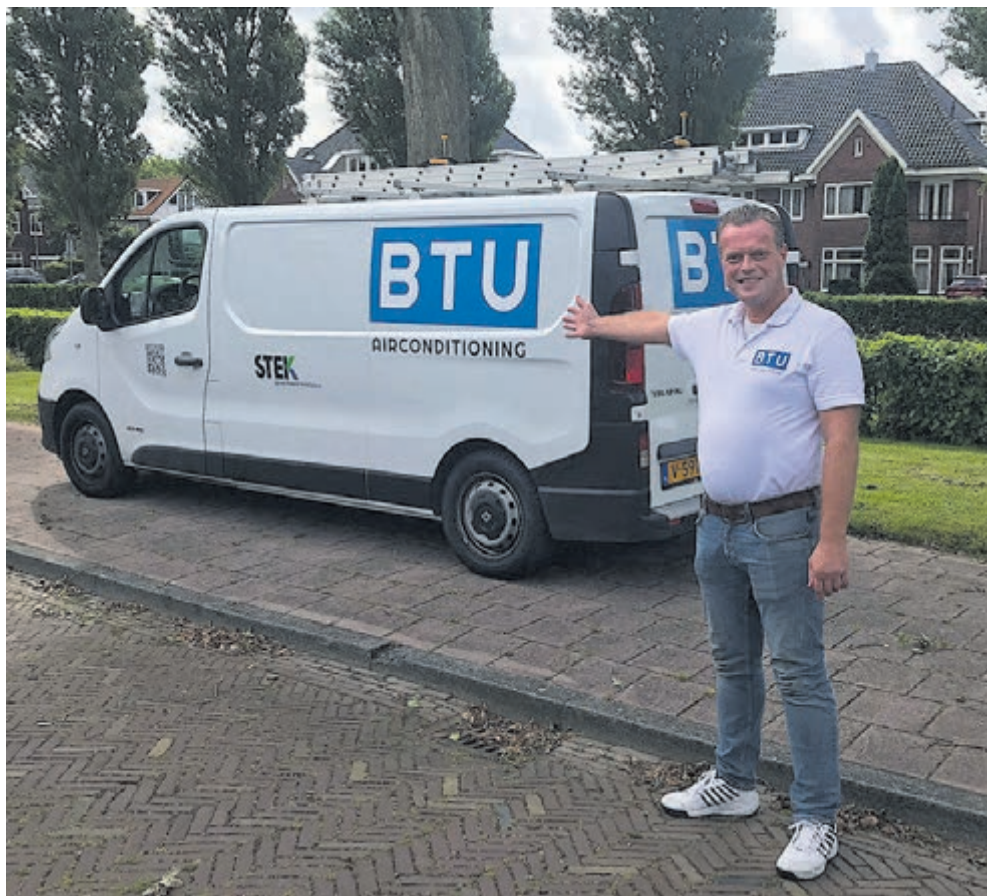
Tekst + foto: Joke van der Zee

Wilt u meer weten? Neem dan contact op met BTU Airconditioning, Heemstedse Dreef 102, Heemstede, tel.: 023-7853748 of via de website: www.btu-airconditioning.nl .