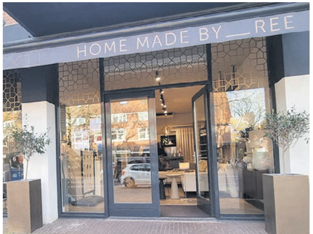
Woonwinkel Home Made By _REE. Foto aangeleverd door Home Made By _REE

BINNENWEG 89-91 | 2101 JE HEEMSTEDEN | T 023 528 64 79 INFO@HOMEMADEBY-REE.NL | WWW.HOMEMADEBY-REE.NL