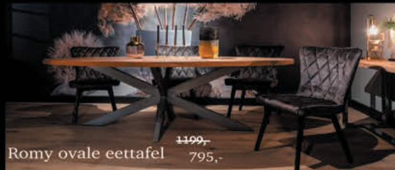
Romy ovale eettafel 1199,- 795,-