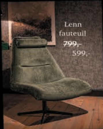
Lenn fauteuil 799,- 599,-