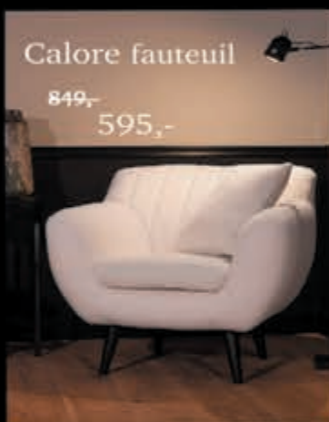
Calore fauteuil 849,- 595,-