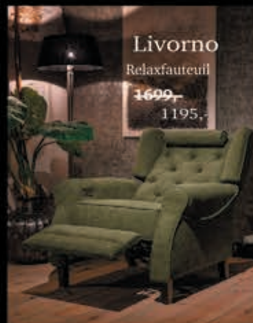
Livorno Relaxfauteuil 1699,- 1195,-