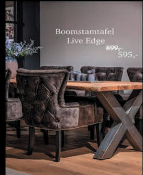
Boomstamtafel Live Edge 899,- 595,-