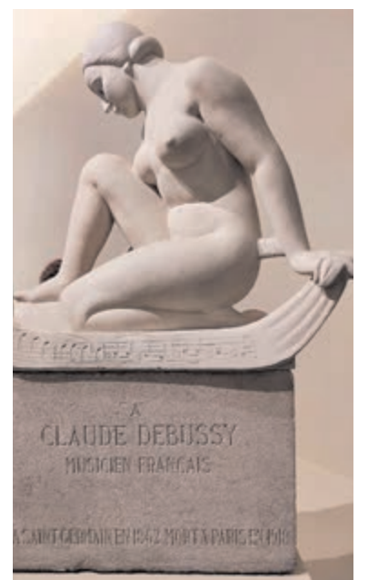
Beeld van Maillol gewijd aan componist Claude Debussy.