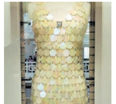
Originele creatie van de onlangs overleden Spaanse couturier Paco Rabanne.

Het thema industrie en textiel komt ruimschoots tot uiting in de uitgebreide keramiek, glas- en modedcollectie van het museum. Zo zijn er onder andere glaswerk van Lalique, bijzondere en opmerkelijke keramieke kunstwerken (van onder meer Pablo Picasso) en een creatie van de onlangs overleden Spaanse couturier Paco Rabanne te bewonderen.