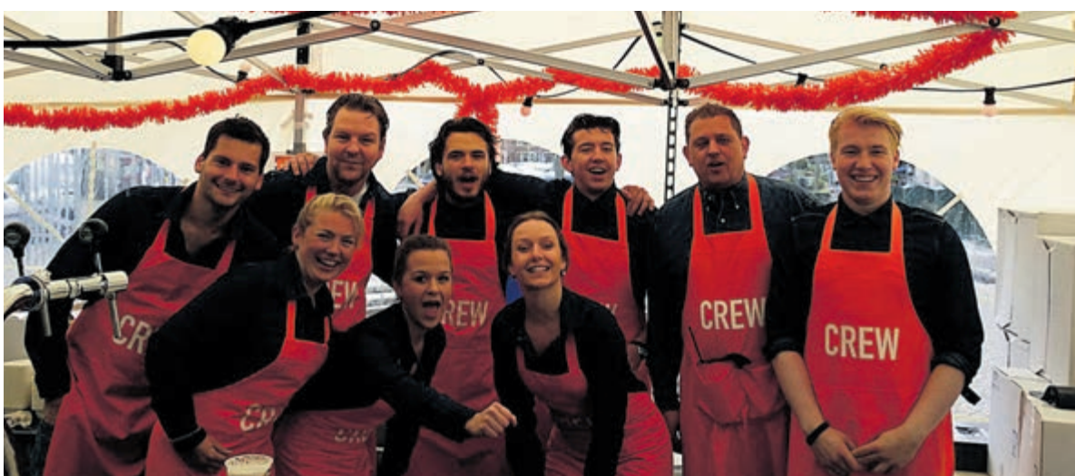
De crew van Le Cheval Blanc heeft er zin in.