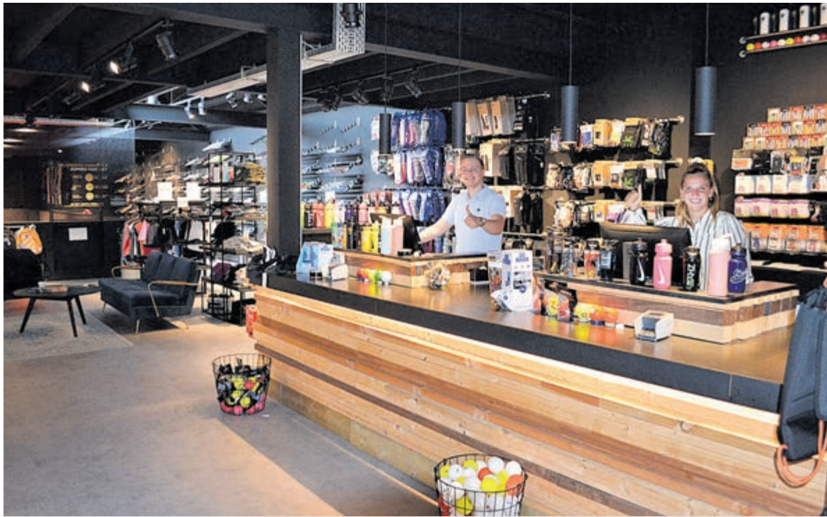
Welkom bij Jumbo Hockey Heemstede.

Jumbo Hockey behoort tot de Jumbo Food Groep, bekend van onder meer de Jumbo Supermarkten en La Place. Jumbo Hockey heeft nu zeven winkels in Nederland. Naast deze Jumbo Hockeywinkels bestaan er nog de winkels van Jumbo Golf: speciaalzaken gericht op de golfsport. In Brabant zijn er echter drie combishopps van Jumbo Hockey- en Golf. Ook Amsterdam heeft een golfstore waar nu een hockeywinkel inzit. In Heemstede is het filiaal louter gericht op hockeyitems, omdat hiervoor veel ruimte benodigd is. Deze zaak is in