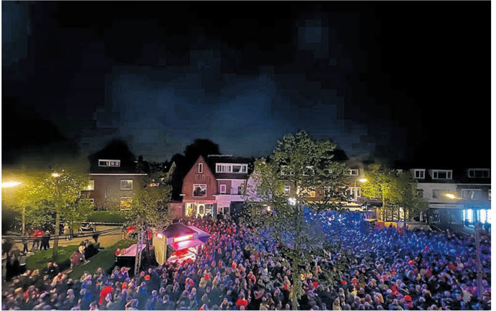
Koningsnacht Jan van Goyenstraat 2022. Foto's aangeleverd.

De buurtbewoners worden van tevoren uitgebreid geïnformeerd. Mochten naar aanleiding hiervan nog vragen rijzen, dan kan uiteraard even bij de Groene Druif binnengelopen worden. Uiteraard zullen andere ondernemingen zoals Brasserie Boudewijn, Skinpoint en de Praktijk gewoon bereikbaar zijn tijdens dit mooie evenement.