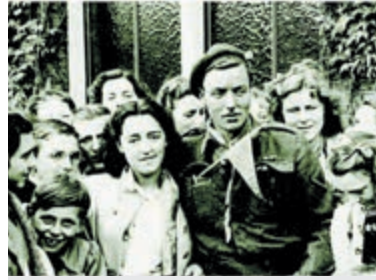
Canadese soldaat omringd door Heemstedse meisjes en kinderen.

De tentoonstelling is geopend op elke zaterdag en zondag in de periode van 16 april tot en met 6 mei, van 12 tot 16 uur, en op vrijdag 5 mei van 12 tot 17 uur. De toegang is gratis. Zolang de voorraad strekt is de speciale uitgave van HeerlijkHeden 'Tweede Wereldoorlog en Bevrijding' uit 2020 tijdens de openingsuren gratis voor bezoekers verkrijgbaar.