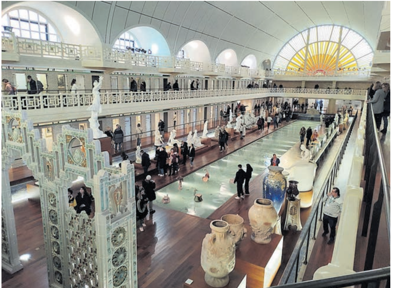
Interieur van La Piscine van bovenaf genomen.

La Piscine is een waar walhalla voor de kunstliefhebber in de brede zin des woords. De voormalige badhokjes op de begane grond en eerste verdieping zijn thans vitrines waar allerhande kunst wordt getoond alsmede in de vleugels om het bad heen. Aan weerskanten van het oorspronkelijke bad zijn de mooiste sculpturen in veelzijdige stijlen uit diverse kunststromingen te zien. Zoals klassieke beelden uit 'le fin de siècle', eind 19de eeuw. Werken zoals 'Le Buste de Dalou' van Auguste Rodin (1883) en 'L'Homme Penché' (1886) door Camille Claudel, een beeld dat is geïnspireerd op het werk van de meester Rodin, vermaard om zijn werken 'De Denker'.