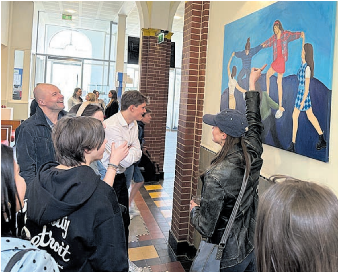
Kunst door Hageveldleerlingen.

Maar dat is ook juist wat kunst behelst. Kunst heeft door de eeuwen heen voor veel meer dan schoonheid alleen gezorgd. Het gaat verder dan oogstrelend zijn alleen, het is ook een middel om het gesprek aan te gaan. Dit is wat de creaties van de kunstenaars van morgen in Hageveld ademen, een gedurfde stap voor hen en voor de aanschouwer soms een bliksemschicht. Dinsdag 4 april werd in de grote zaal van het college de eindexpositie van een groep leerlingen geopend, jonge kunstenaars die het vak Kunst Beeldende Vorming volgen. Hun presentaties lopen uiteen van schilderijen, tekeningen, samengestelde objecten, fotografie en nieuwe media.