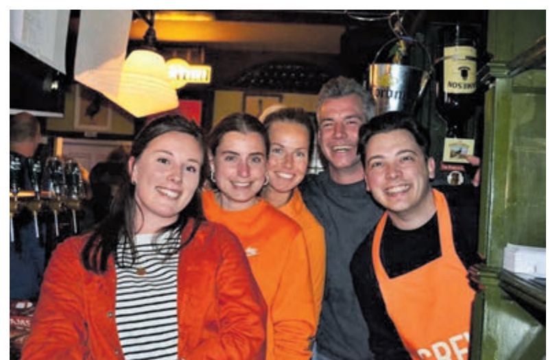
De crew van de Groene Druif is er helemaal klaar voor.