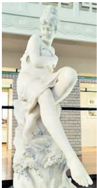
'In Riva al Mare' uit 1891 van de Italiaan Cesare Lapini.

Het zwembad sluit echter definitief haar deuren (als zwembad) in 1985. In juli 1992 tekenden de Franse overheid en Roubaix een overeenkomst, waarin de collecties van het voormalige nationale museum worden overgedragen aan de stad Roubaix. Het museum ontvangt van andere nationale Franse musea, met name het Musée d'Orsay, het Musée National d'Art Moderne en het Fonds National d'Art Contemporain aanzienlijke depots. Het voormalig zwembad wordt verbouwd tot museum en 'La Piscine, musée d'art et d'industrie André Diligent' (vernoemd naar de Franse politicus die in Roubaix is geboren) opent uiteindelijk haar deuren in oktober 2001. De kunstverzameling van La Piscine werd door nieuwe depots, giften of aankopen aanzienlijk vergroot. Het museum had daarom al snel de noodzakelijke uitbreiding nodig om al deze collecties te kunnen herbergen. Na 18 maanden van werkzaamheden en een sluiting van zes maanden, om alles te installeren, opende La Piscine opnieuw haar deuren in oktober 2018, met meer dan 2000 m2 extra ruimte.