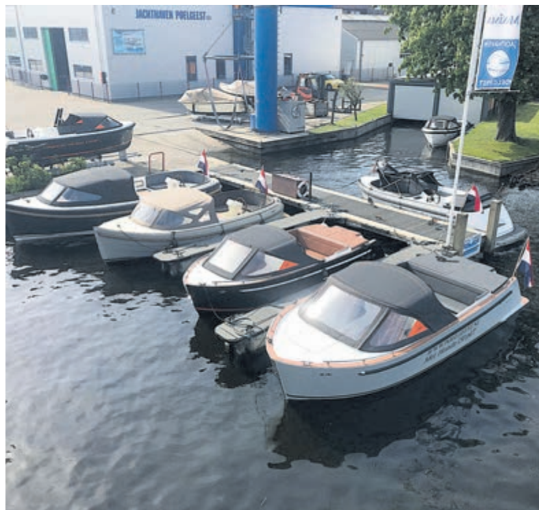
Ruime voorraad bij Poelgeest.