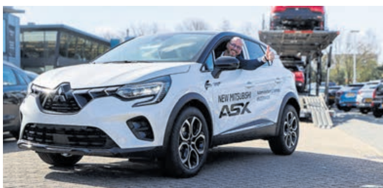
Ervaar wat de nieuwe ASX u te bieden heeft.

Automobielbedrijf Tinholt, Klompenmakerstraat 43, Velsbroek.