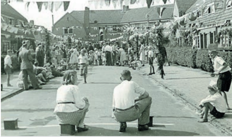
Bevrijdingsfeest op het Heemstedeplein in 1945.