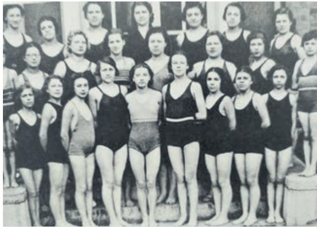
Oude foto uit jaren dertig van een dameszwemteam in La Piscine.