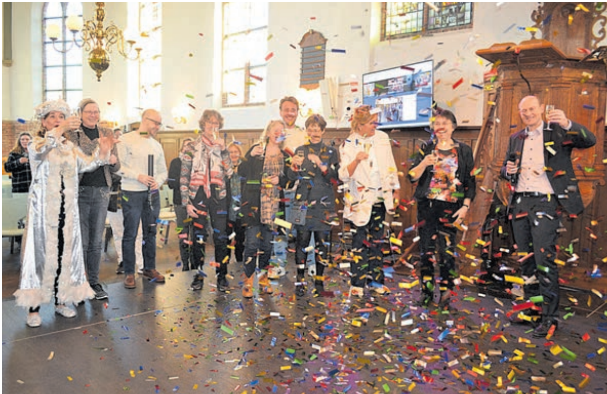
De feestelijke opening van het digitale platform BeleefHeemstede.nl in de Oude Kerk.