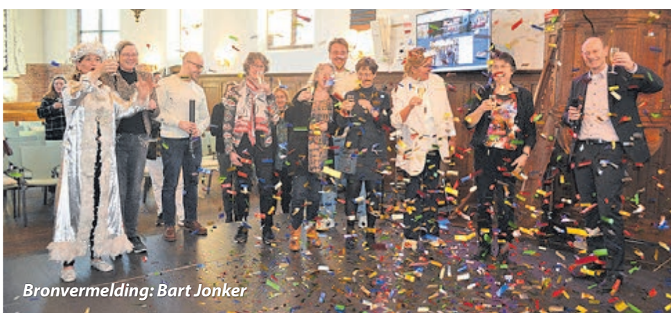
Bronvermelding: Bart Jonker

Kijk op werkenbijheemstede.nl/vacatures . Solliciteren kan tot en met zondag 27 maart.