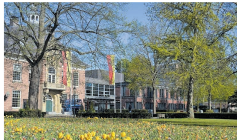
Raadhuis Heemstede.

De volledige onderzoeksresultaten zijn te vinden op www.heemstede.nl/burgerpeiling . De resultaten worden later ook gepubliceerd op: www.waarstaatjegemeente.nl .