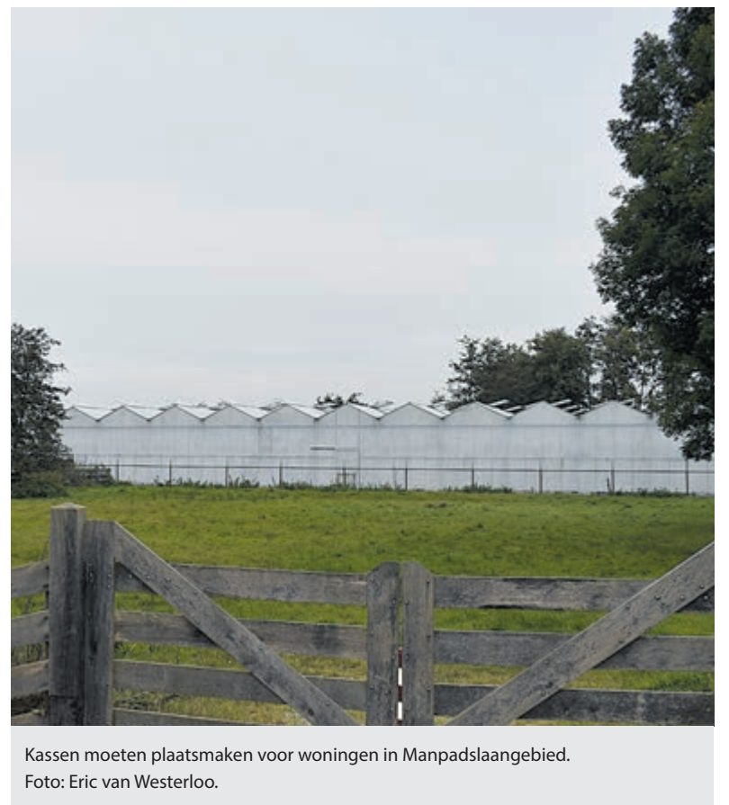
Kassen moeten plaatsmaken voor woningen in Manpadslaangebied.

Daar loopt Roosendaal niet voor weg. Voor wat meer inzicht gaf hij aan dat de gehele Rivierenwijk net zo groot is als het Manpadslaangebied en daar 600 woningen staan. Er is dus nog steeds geen definitief plan voor het gebied. Of, hoeveel, het type en voor welke doelgroepen gaat worden gebouwd blijft ongewis. De nieuwe gemeenteraad mag zich nu opnieuw buigen over dit enorme dossier.