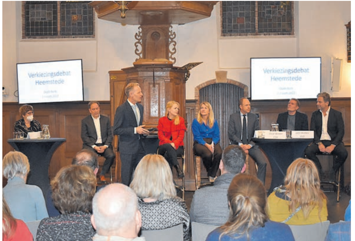
De lijsttrekkers uit de Heemstedse politiek op een rij.

Het volgende en laatste debat is op 10 maart 20.00 uur in het gemeentehuis.