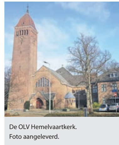
De OLV Hemelvaartkerk.

supermarkt te koop is. Echter met nadruk geen kleding of speelgoed. De voedselbankcommissie van de Hemelvaartkerk zorgt er voor dat alle goederen bij de Voedselbank Haarlem terecht komen. Ook gezinnen in Heemstede, Vogelenzang en Bennebroek maken er gebruik van. De eigen caritascommissaris van de kerk zal met een startdonatie een ferme aftrap geven. Door prijsstijgingen van producten en diensten is een groeiend aantal mensen afhankelijk van de voedselbank. Een mooie manier om de medemens bij te staan.