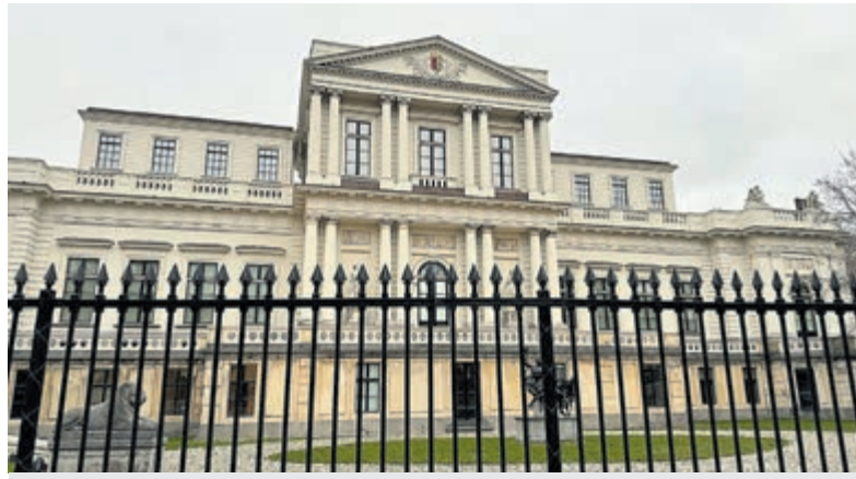
Het provinciehuis Paviljoen Welgelegen in Haarlem.

Terug naar de provincie. Zij heeft een uiteenlopend takenpakket. Een hoofdrol in de bepaling van uitbreiding van steden en dorpen: waar komen bedrijventerreinen en waar kantoor-