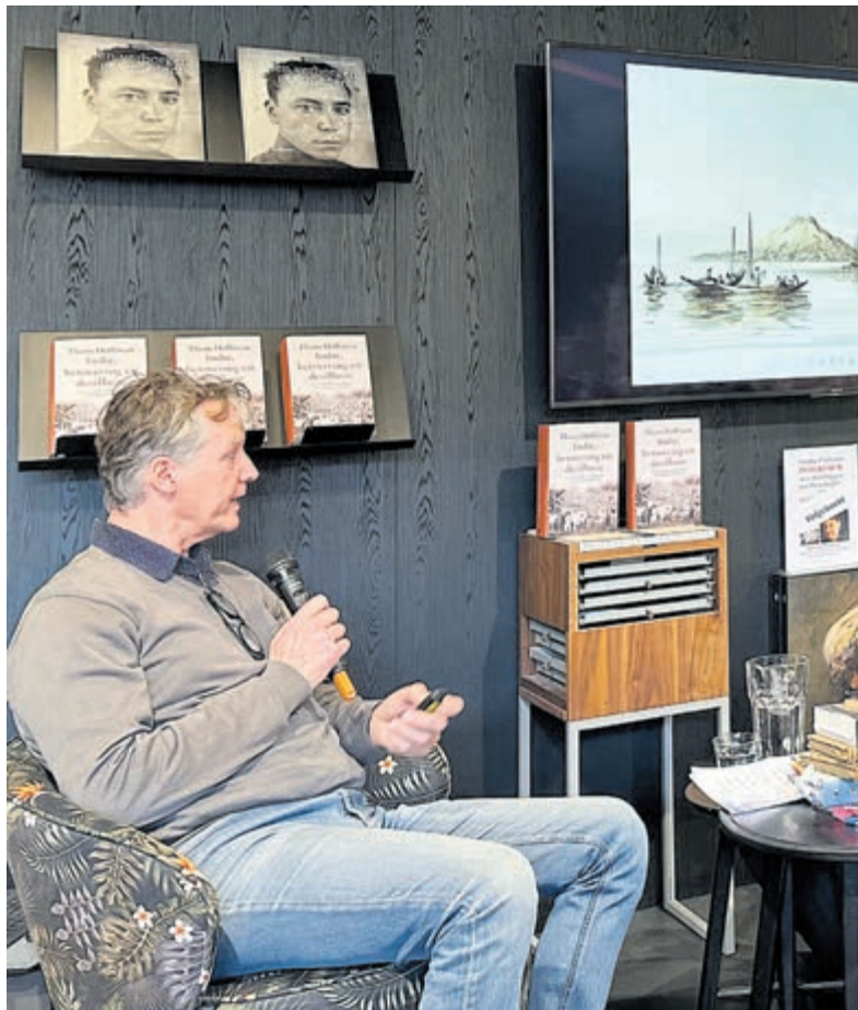
Thom Hoffman bij Boekhandel Blokker.