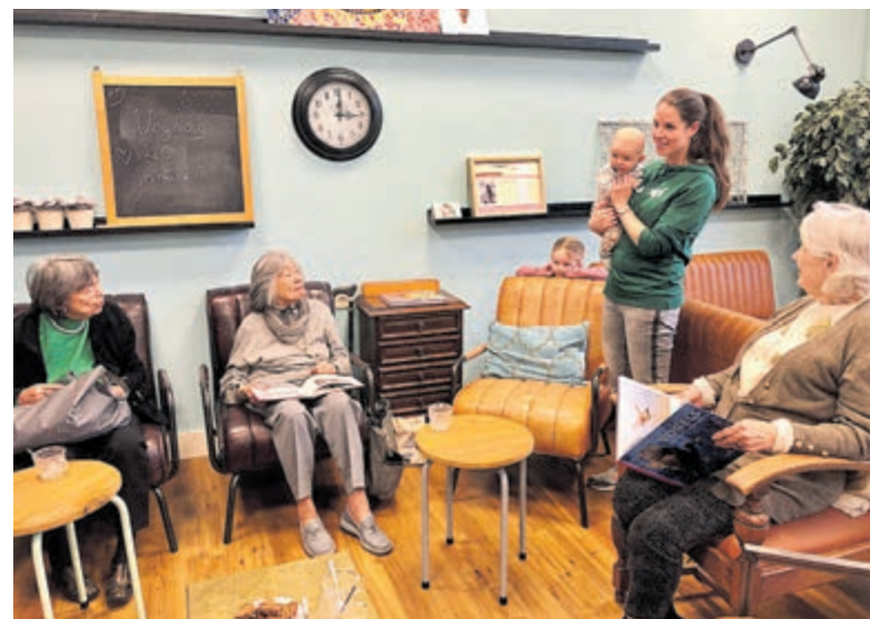
Vrolijke Vrijdag in de Molenwerf.