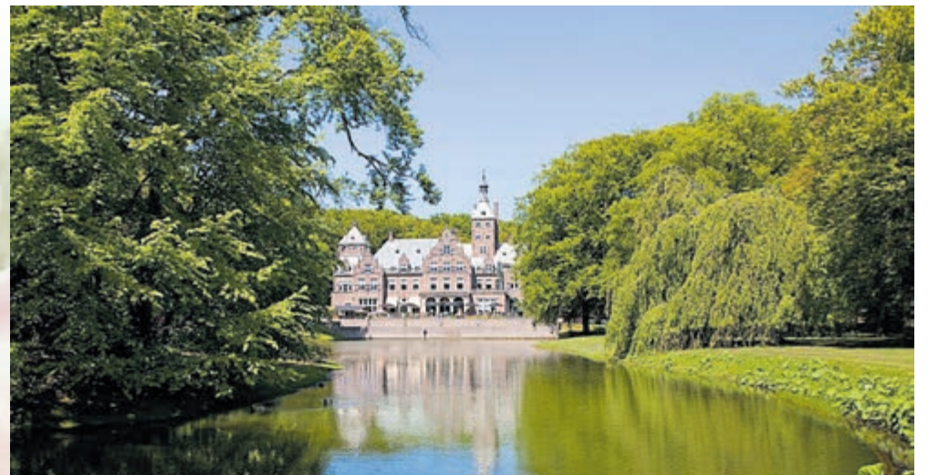
Landgoed Duin & Kruidberg.

Dé buitenplaats van Amsterdam, stad, strand, natuur en zee, alles is vlakbij. Het voormalig grootste woonhuis van Nederland is gevestigd in Santpoort-Noord. Het Landgoed beschikt over 75 hotelkamers, een culinair Restaurant, een Conferentiecentrum, verschillende stijl-zalen, Koetshuis Nova Zembla, het Souterrain & de Bar. In de aangrenzende vleugel bevindt zich Spa & Wellness 't Princenbosch.