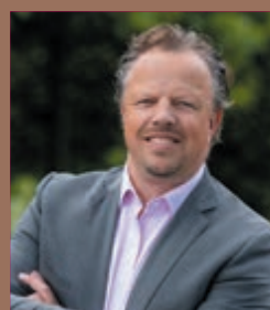
Alexander van der Pijl Dunweg Uitvaartzorg