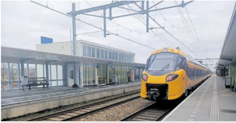
De 'Wesp'. (12 februari 2023).

Heemstede - Voor veel treinliefhebbers is het allang geen geheim meer dat NS flink bezig is met de aanschaf van nieuwe treinen. In Heemstede komt veel treinverkeer langs, maar treinen, zoals de Sprinter en de Apekop (mat 64 voor de kenners) komen niet meer voorbij op station Heemstede-Aerdenhout), hooguit nog terug te vinden in het Spoorwegmuseum of als speciale versie vanuit clubverband. 'Vreemde' treinen (Beneluxtrein, Hoge Snelheidstrein) komen alleen langs wanneer de Schiphollijn niet in gebruik is om wat voor reden dan ook. Gertjan Stamer (bekend van o.a. Facebookpagina 'Station Heemstede-Aerdenhout') is zo'n treinen- en stationliefhebber, die bijna dagelijks wel op het station te vinden is en anders wel ergens in Nederland/België/Duitsland op stations staat te fotograferen. Ook nieuwsfeiten omtrent 'ons'