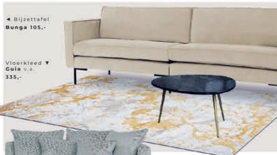
◀ Bijzettafel Bunga 105,-