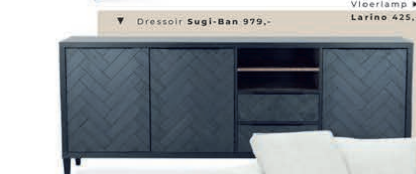
▼ Dressoir Sugi-Ban 979,-