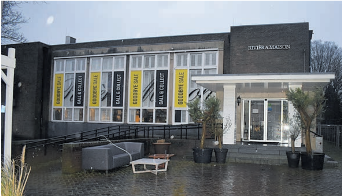
Het voormalig postkantoor. Foto Eric van Westerloo.