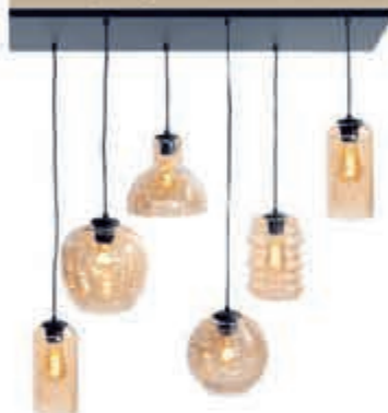
◀ Hanglamp Fantasy 417,-

Verkrijgbaar in meer dan 3600 verschillende kleuren en bekleding.