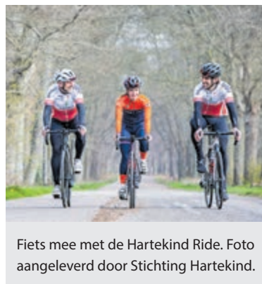
Fiets mee met de Hartekind Ride.

Stichting Hartekind financiert wetenschappelijk onderzoek om de overlevingskansen en kwaliteit van leven van hartekinderen verbeteren.