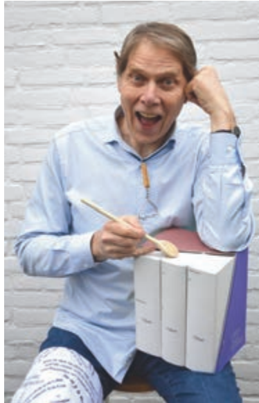
Wim Daniëls.

Nederland kent Wim Daniëls vooral van zijn columns bij 'Spijkers met Koppen', zijn talloze boeken over taal en zijn taalbeschouwingen, waaronder de roemruchte bespreking van het Koningslied. Ook is hij een graag geziene gast in de talkshows. Sinds enkele jaren speelt hij voor volle zalen cabaret- en toneelvoorstellingen. Een avondje in de keuken van Wim Daniëls, dat is "vermakelijk en interessant", aldus de Volkskrant over zijn programma 'Associëren'.