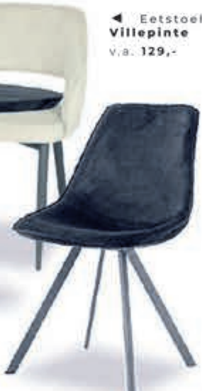
◀ Eetstoel Villepinte v.a. 129,-