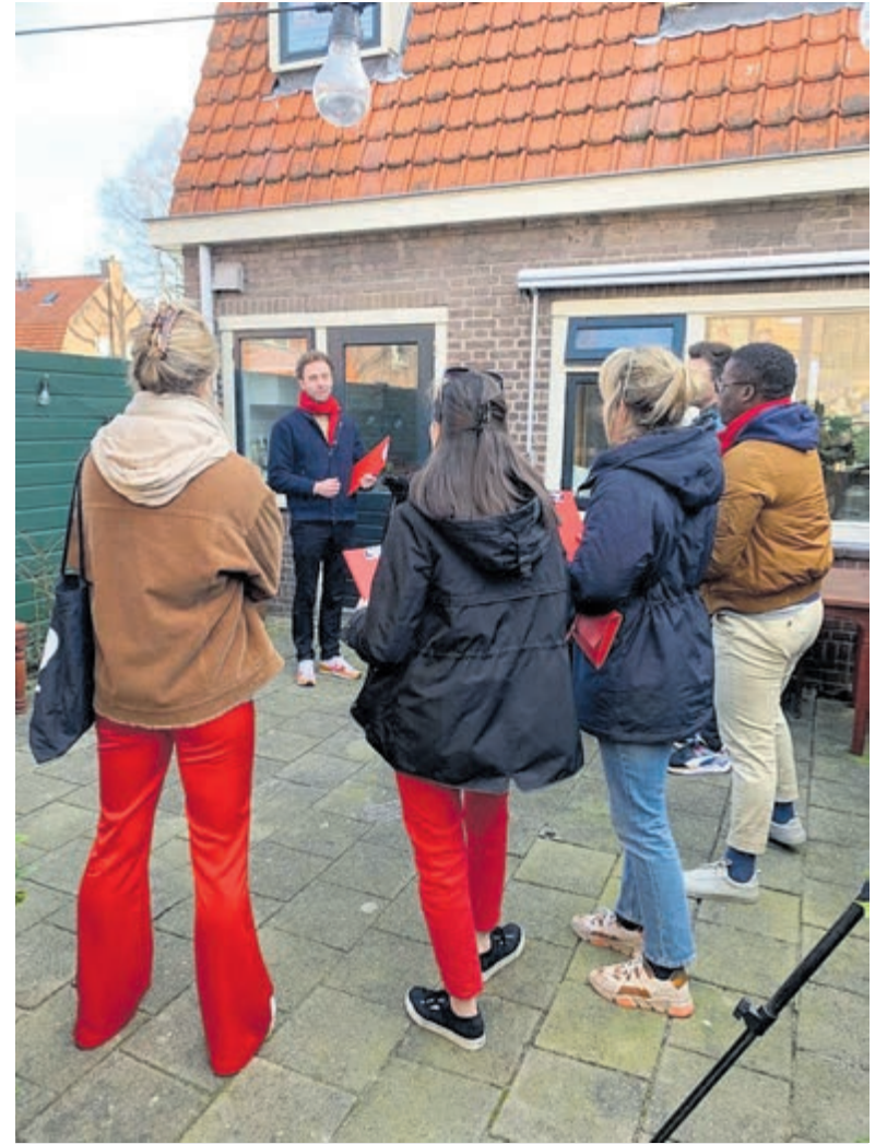
PvdA kandidaten actief in de wijken.

De partijen zijn in eerste instantie verantwoordelijk om zorgvuldig de antecedenten van de kandidaten te controleren. Kennelijk is dat hier niet gebeurd. Een unieke zaak voor politiek Heemstede komt zo tot een einde.