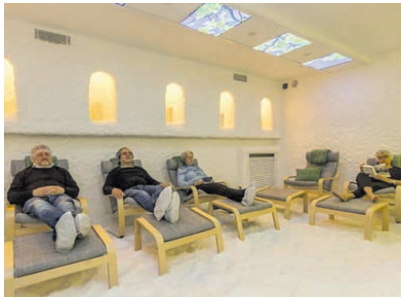
Behandeling bij HaloClinic.

Zoutkamers zijn ontworpen voor een natuurlijke en effectieve behandeling van chronische ademhalings- en huidproblemen. Zij zijn gebaseerd op de natuurlijke genezende eigenschappen van de oude zoutgrotten. Goed om te weten: een behandeling