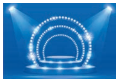
T/m 25 januari geen voorstellingen van Podia Heemstede.

mediakanalen en per mail wordt u geïnformeerd over de actuele stand van zaken.