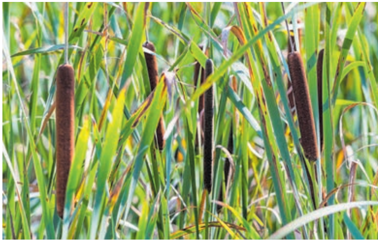
Kleine lisdodde (Typha angustifolia).

De breedte van het blad is 0,5 tot 1 cm breed. In tegenstelling tot de grote lisdodde waarvan de vrouwelijk aar donkerbruin in de bloeitijd van kleur is, is de vrouwelijke (bloem) aar van de kleine lisdodde geelachtig tot groenachtig van kleur.