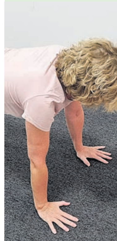
Gym in Museum Haarlem.

Er is geen enkele logische reden de musea gesloten te houden. Voor en achter de schermen werkt de Museumvereniging aan de lobby om de musea zo snel mogelijk open te laten gaan. Deze krijgt van alle kanten hulp aangeboden, verschillende musea zijn al acties begonnen. Zo wisten het Drents Museum en Museum Coevorden al flink de aandacht te trekken. Graag willen Museum Haarlem, in aansluiting op die acties en die van de theaters (Theater Kapsalon) op deze woensdag ook collectief van ons laten horen met De Museum Gym.