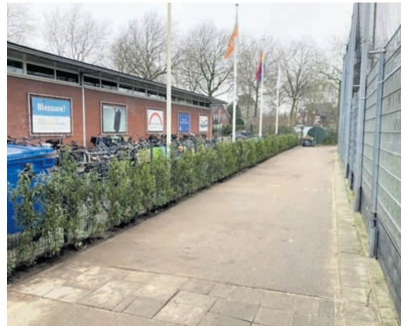
Hockeyvereniging MHC Alliance vergroent haar terrein.

beuk en Portugese laurier. Hiermee is een belangrijke stap gezet naar meer aandacht voor groen op de hockeyclub. Deze actie werd lokaal gesteund door Aris Tuinbureau die het ontwerp van de aanplant op het terrein heeft gemaakt en Nijssen Tuin Heemstede die de beplanting heeft geleverd. Ook de gemeente Heemstede heeft hieraan een bijdrage geleverd door voor de graafwerkzaamheden zorg te dragen.