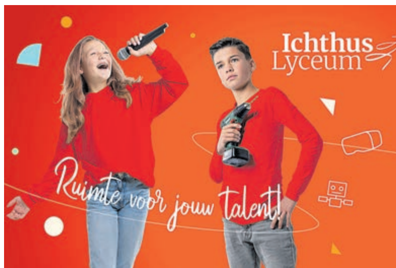
Bezoek de Ichthus Open Dag Livestream.

Het Ichthus Lyceum in Driehuis is een moderne school voor havo, atheneum en gymnasium, met een erkend Technasium. De school is gelegen in een rustige buurt tegenover NS station Driehuis.