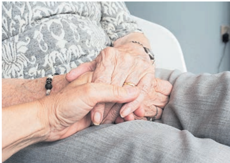
Een op de vijf mensen zal te maken krijgen met een haperend brein.

onder het genot van een lunch in de foyer van de Luifel. Aanmelden is verplicht en kan via: www.wijheemstede.nl , info@wijheemstede.nl of 023 - 5483828.