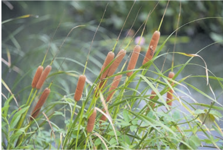
De grote lisdodde (Typha latifolia).

Heemstede/Bloemendaal – Nadat we in deze rubriek een watervogel en een vissoort besproken hebben, richten we ons deze week op een plantensoort aan de waterkant. Een van de herkenbare plantensoorten aan onze waterkant met de karakteristieke 'sigaar' is de lisdodde. De lisdoddefamilie (Typhaceae) kent verscheidende soorten wereldwijd. Nederland kent twee soorten: de grote lisdodde (Typha latifolia) en de kleine lisdodde (Typha angustifolia). Beide soorten worden hier besproken. In de volksmond worden lisdoddes ook wel 'doelen' of 'duilen' genoemd.