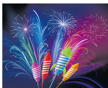
Er geldt op dit moment een vuurwerkverbod.

hulpdiensten ontlast. Lees meer over deze regionale actie op: www.velsen.nl/velsen-organiseert-vuurwerkinleveractie . Tijdens de jaarwisseling 2021-2022 is het afsteken van klein vuurwerk, zoals sterretjes en knalerwten (categorie F1), alleen toegestaan als dit geen overlast veroorzaakt voor de omgeving. Iedereen van 12 jaar en ouder mag dit vuurwerk het hele jaar door kopen en afsteken.