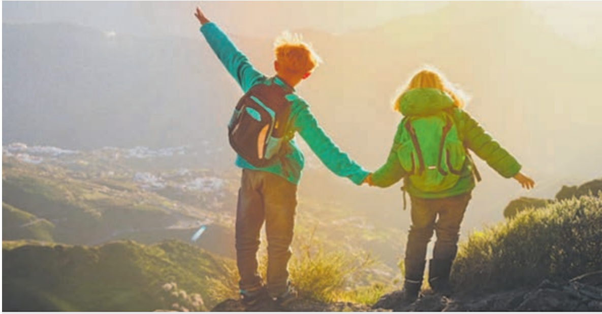
Wandelen in de bergen.