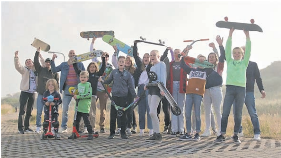
In Wijk aan Zee zijn ze klaar voor de nieuwe skatebaan.