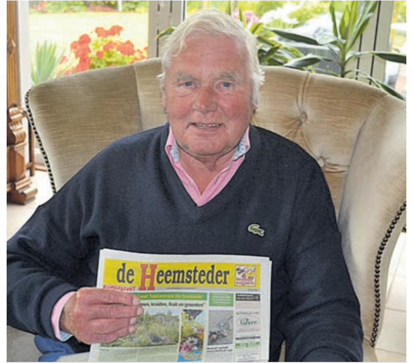
Correspondent Ton van den Brink overleden.