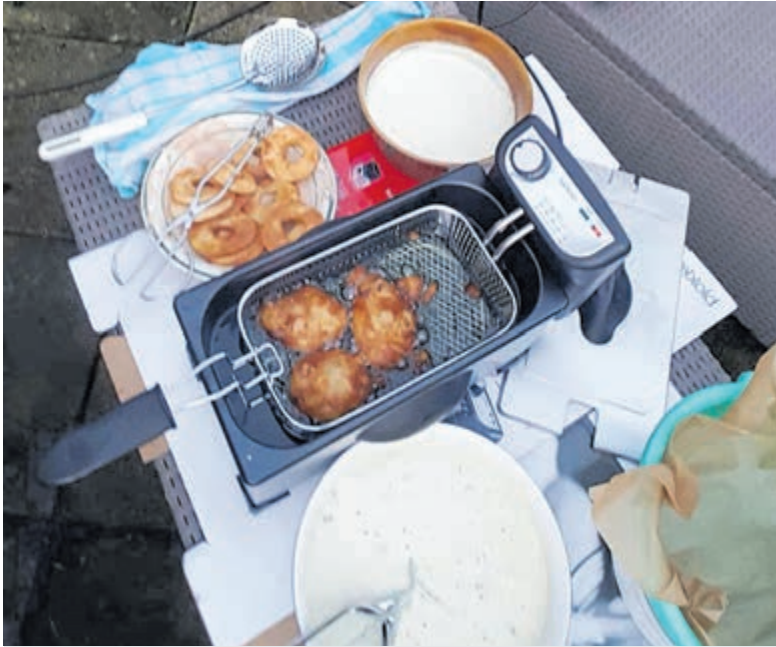
Thuis oliebollen en appelflappen bakken in frituurvet.