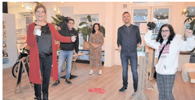
SBS6-opnamen op Plein1 voor tv-programma 'Helden van nu'.