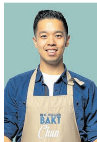
Heemstedenaar Chun.