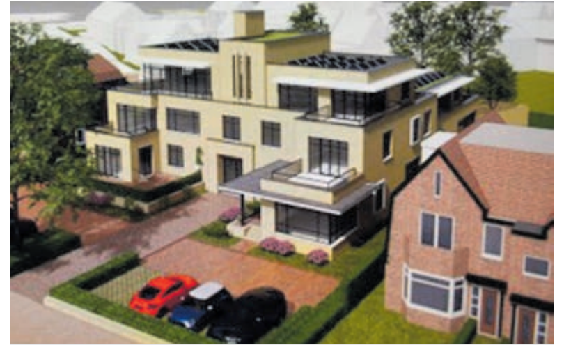
Nieuw ontwerp oude postkantoor.