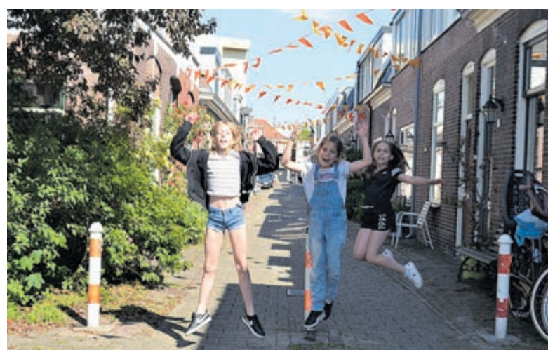
Kastanjelaan eerste straat in Heemstede in EK-voetbalsferen.