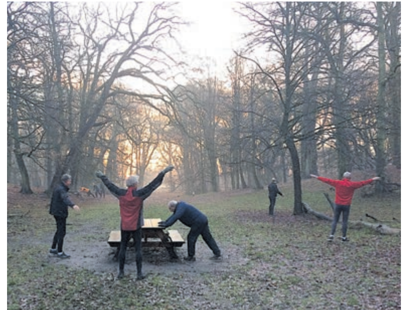
Trimmen met zonsopkomst.

rennend, maar ook allerlei oefeningen in de heerlijke buitenlucht met een groep mensen (op corona-afstand), waar vooral de gezelligheid hoog in het vaandel staat. Presteren is niet belangrijk, in beweging zijn wel. Lijkt het u wat? Kom dan een keer geheel vrijblijvend op zaterdagmorgen naar de parkeerplaats bij de tennisclub in het Groenendaalse Bos (voorbij het restaurant). Kom op tijd, want we starten echt om acht uur.