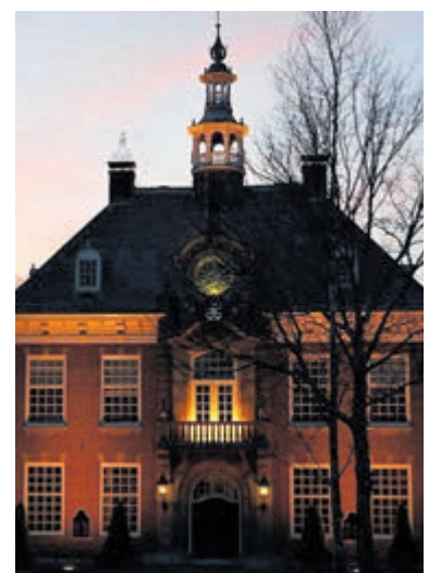
Raadhuis Heemstede.

Wat: Nieuwjaarsconcert Philharmonie live te zien op NH Nieuws Wanneer: zaterdag 1 januari van 15.00 uur tot 16.15 uur. Waar: TV-kanaal NH Nieuws (Ziggo kanaal 707/KPN kanaal 509). Meer informatie: www.theater-haarlem.nl/nieuwjaarsconcert .