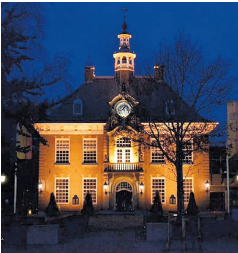
Raadhuis Heemstede.