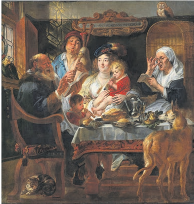
Jacob Jordaens. Zo de ouden zongen, zo piepen de jongen, ca. 1640 - 1645. Olieverf op doek, 211 x 189 cm.

In de kerstvakantie worden er rondom de tentoonstelling Thuis bij Jordaens, speciale activiteiten voor kinderen georganiseerd. Tijdens de rondleiding ontdekken zij welke grapjes Jordaens, Frans Hals en andere kunstenaars vroeger in hun schilderijen maakten. Deze kindertour zit vol verhalen en leuke opdrachten om samen te doen die kinderen anders laten kijken naar de schilderijen. Met de schilderworkshop kruipen kinderen in de huid van de beroemde schilders uit Haarlem en Antwerpen en maken ze zelf een portret met de 'losse toets', de schilderij van Jordaens en Hals. Alle activiteiten zijn te reserveren via: www.franshalsmuseum.nl/ agenda.