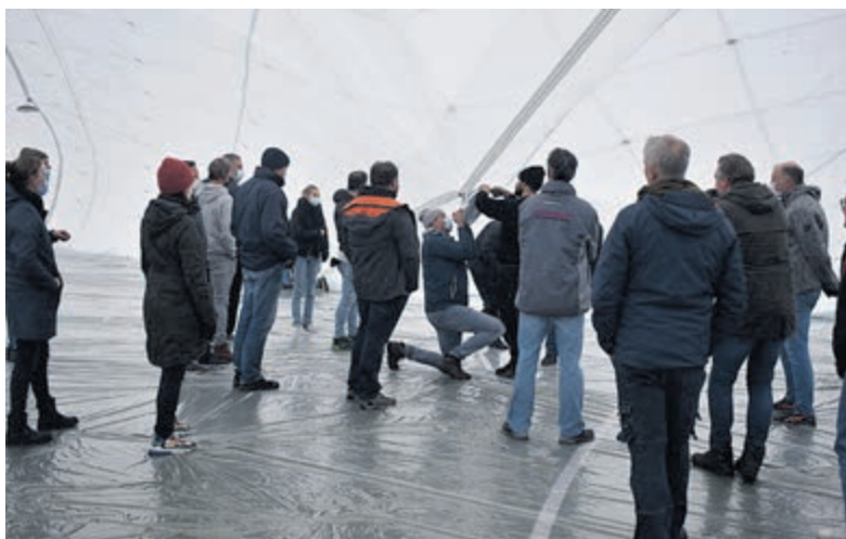
De blaashal wordt opgezet.

een 30-tal van deze hallen bij Hockey- en tennisclubs. Ook zijn er enkele als voetbalhal in gebruik. De firma Polyned uit Steenwijk plaatst veel van deze hallen zo ook bij Alliance. Er komt over het bestaande kunstgras een speciale vloer, ook die gaat er weer uit in februari. De hal wordt verdeeld in twee speelvelden die elk +/- een kwart normaal veld beslaan. Alliance verwacht dat vooral de jeugd, door te spelen in een kleine ruimte, hun techniek met sprongen vooruit ziet gaan. De hoogste jeugdelftallen spelen al op divisieniveau en dat wil men graag zo houden. De enorme hal zal niemand, die het sportcomplex bezoekt, kunnen ontgaan.