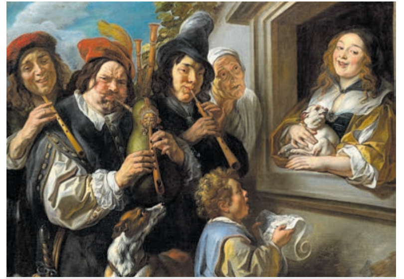
Jacob Jordaens: Serenade, c. 1640-1645 Olieverf op doek, 115 x 157,5 cm.

Aan de hand van een aantal herkenbare thema's zoals geloof en vrolijkheid wordt in de tentoonstelling een uitgebalanceerde selectie aan werken uit de collectie van The Phoebus Foundation gepresenteerd. Zo kunnen bezoekers ontdekken hoe Jordaens elementen van huiselijk leven toevoegde in bijvoorbeeld