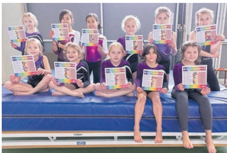
De turnsters tonen trots hun speciaal ontworpen diploma met hun stickers.

Alle turnsters gingen met een mooi diploma en veel stickers met een voldaan gevoel weer naar huis.