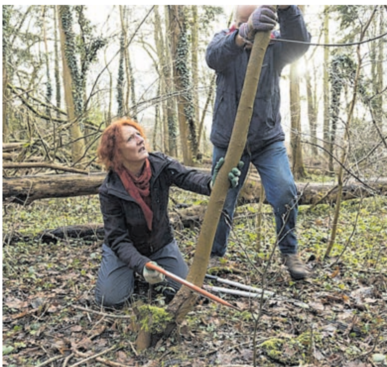
Werkdag IVN.

De Hartenkamp was ooit een van de mooiste buitenplaatsen van het land. Vanaf het huis gezien, aan de overkant van de Herenweg, ligt het gebied dat we nu weer Overplaats noemen. Het is een interessant loofbos rond een fraaie vijver. In het voorjaar valt er volop te genieten van bloeiende stinsenplanten en in het najaar groeien er veel paddenstoelen. Het is er rijk aan vogels. Regelmatig laat de zeldzame appelvink zich hier zien. Hier op de Overplaats gaan vrijwilligers een deel van het oude hakhoutbos afzetten. En takkenrillen worden gemaakt. Broedvogels, paddenstoelen, mossen en de stinsen-