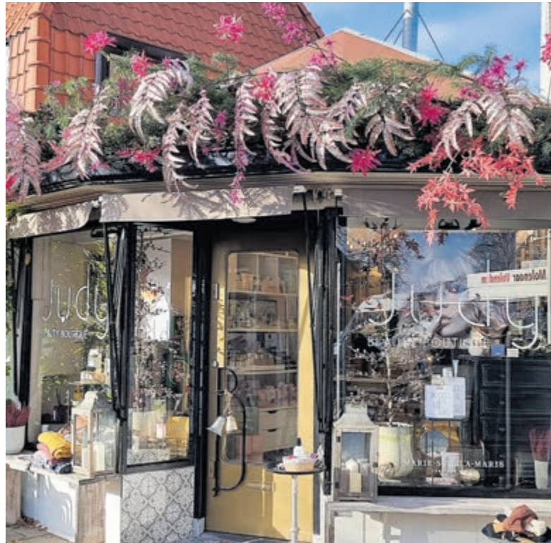
Judy Beauty Boutique in de Jan van Goyenstraat.