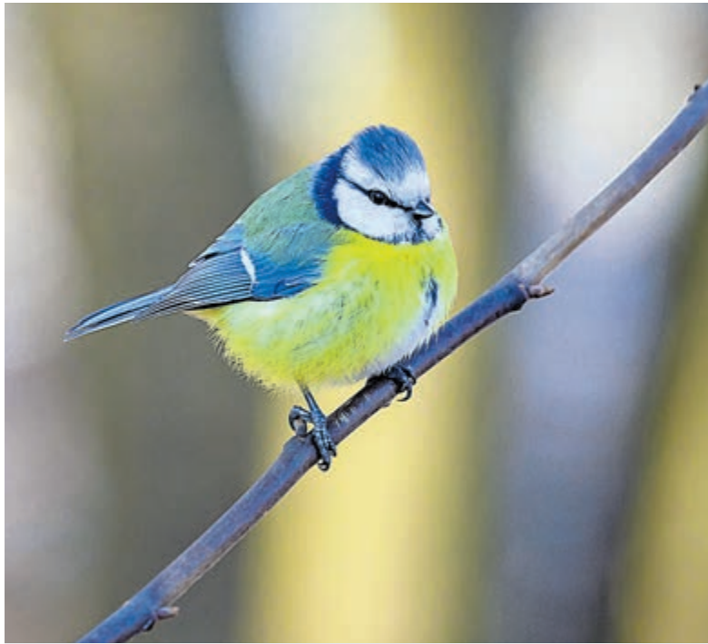
De pimpelmees ( Cyanistes caeruleus ).

De pimpelmees heeft een kobaltblauwe kap op de kruin en ook dit blauw op de vleugels en staart. Mannetjes zijn net iets uitgesprokener van kleur dan de vrouwtjes. Pimpelmezen zijn minder luidruchtig dan de koolmees, maar vrij brutaal en overheersen andere mezen op de voedertafel. Wel is de pimpelmees vaak de eerste vogel die waarschuwt voor gevaar, bijvoorbeeld bij aanwezigheid van een kat. Ze zijn tamelijk intelligent en kunnen goed kleuren onderscheiden. Zo ging het verhaal in Groot-Brittannië rond over melkflessen met een dop van folie voor de