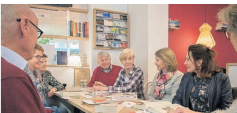
Leesclub.