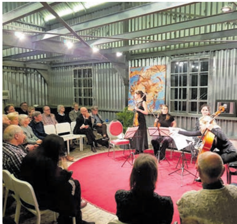
Intieme setting Kunstfort.

Kijk voor het hele programma, data, tijdstippen en kaarten op: www.cruquiusconcerten.nl/ .