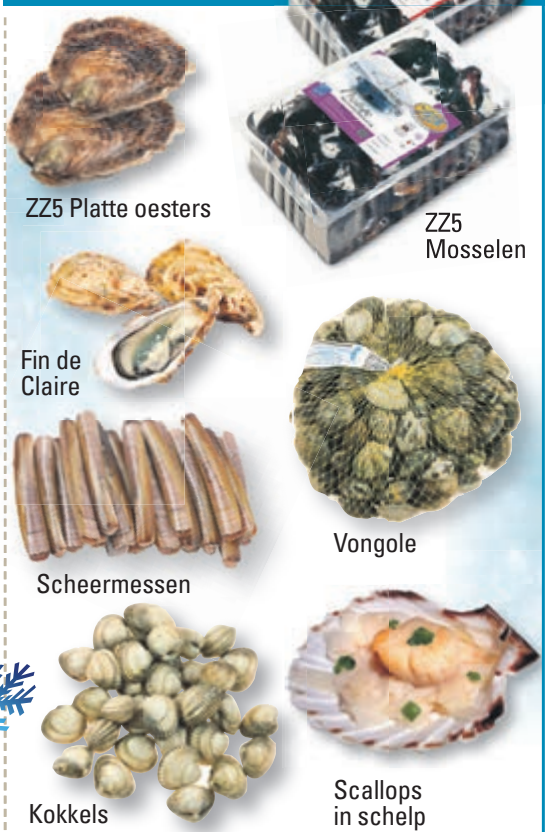
ZZ5 Platte oesters