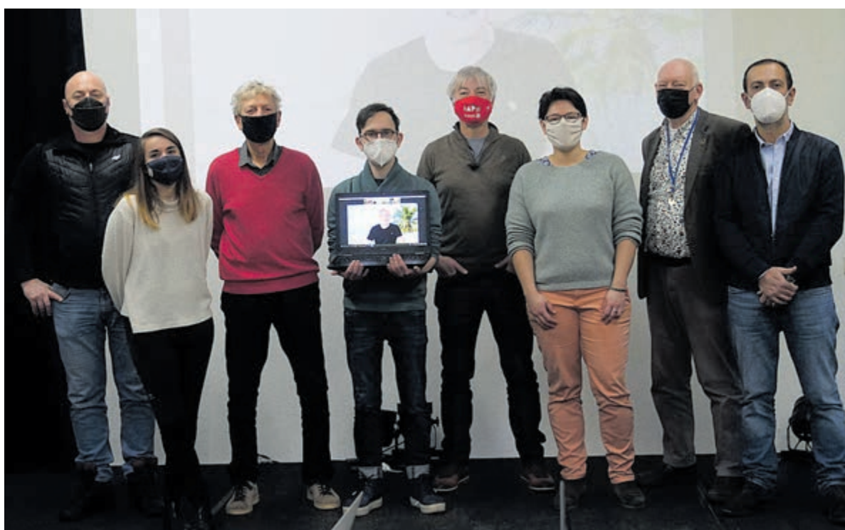
Trans Nationale Meeting.