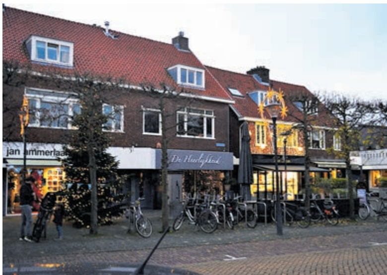
Raadhuisstraat in betoverende kerstsferen.

Kies je allermooiste foto of foto's uit (maximaal 4 per deelnemer) en plaats die op Facebook. De actie loopt tot en met 31 december.