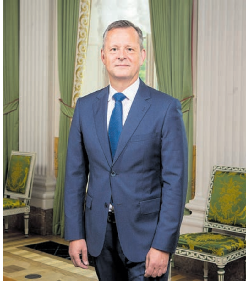
Commissaris van de Koning Arthur van Dijk.

Tijdens het gesprek met de gemeenteraad worden pitches gehouden, onder andere over regionale samenwerking, inwonersparticipatie, bestuurscultuur en omgangsvormen.