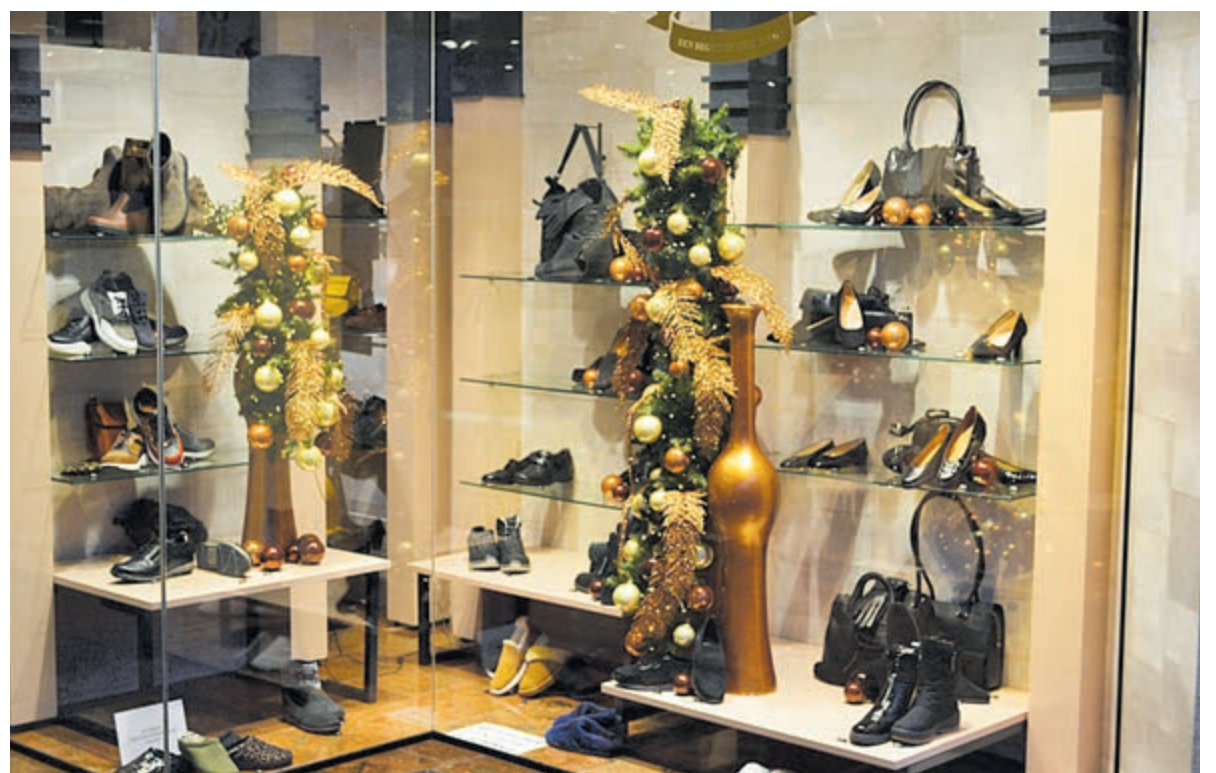
Een van de fraaie kerstetalages van Kaptein Schoenen en Lederwaren.

Mariska noemt reistas en -koffers, maar ook toilettaasjes, pantoffels,