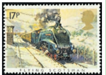
Britse postzegel.

Santpoort-Noord - In verband met de corona-maatregelen zal de grote veiling van de Postzegel Vereniging Santpoort plaatsvinden op zaterdag 18 december in Het Terras, Dinkgeverlaan 17, Santpoort-Noord, aan-vang 9.30 uur. Aan bod komen ca. 200 kavels, die men voor de veiling kan bezichtigen. Iedereen is van harte welkom. Voor inlichtingen kunt u bellen naar 023-5382274.