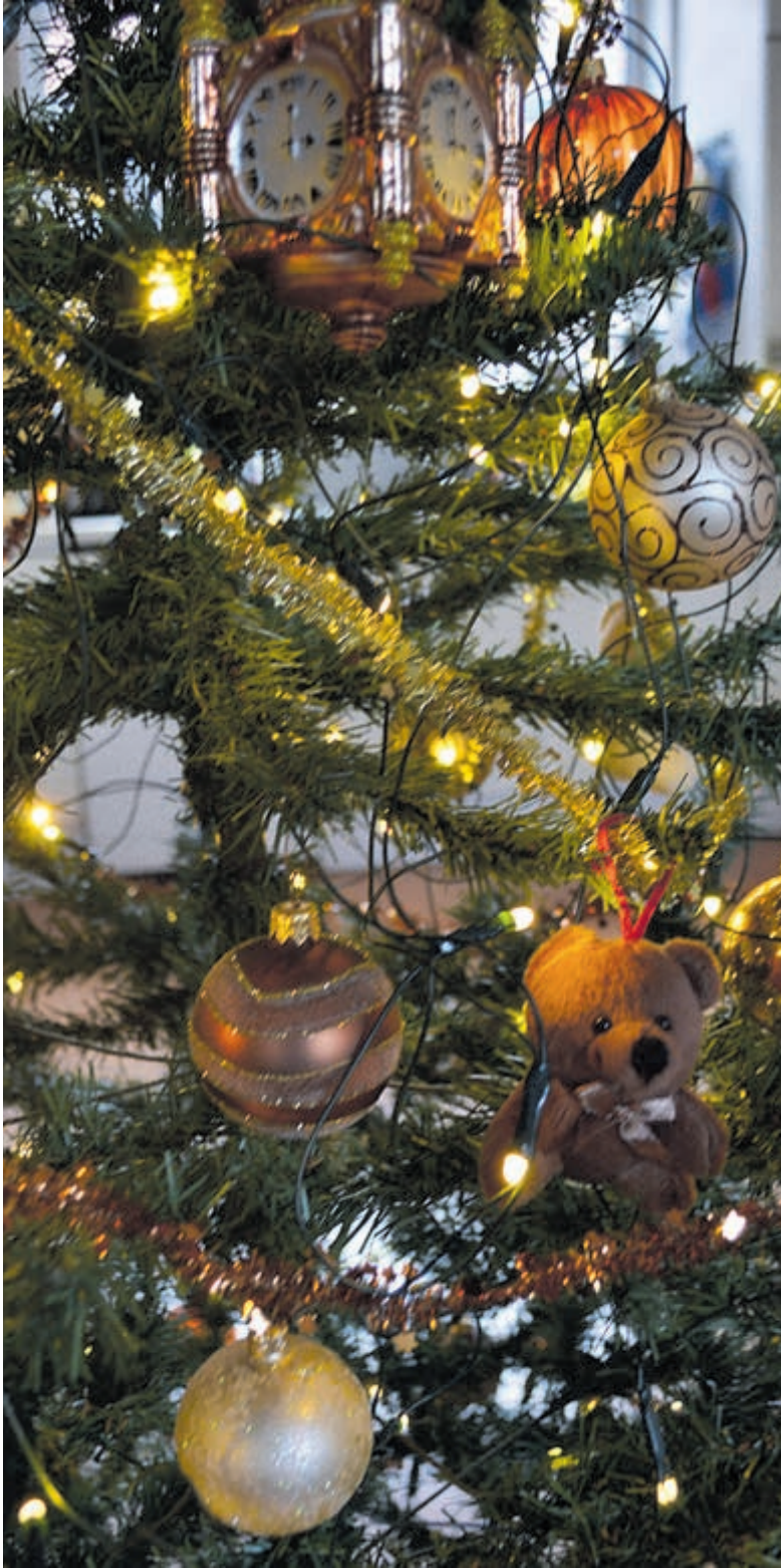
Versierde kerstboom.

Tuincentrum de Oosteinde jureert de inzendingen en stelt als hoofdprijs een cadeaubon beschikbaar van maar liefst 100 euro, te besteden aan kamerplanten. Alvast met het oog op januari, want dan is het kerstboom eruit en kamerplant erin! De mooiste inzendingen krijgen een plekje in onze krant. De winnaar wordt bekendgemaakt in januari. Over de uitslag wordt niet gecorrespondeerd. Heel veel succes en veel plezier!