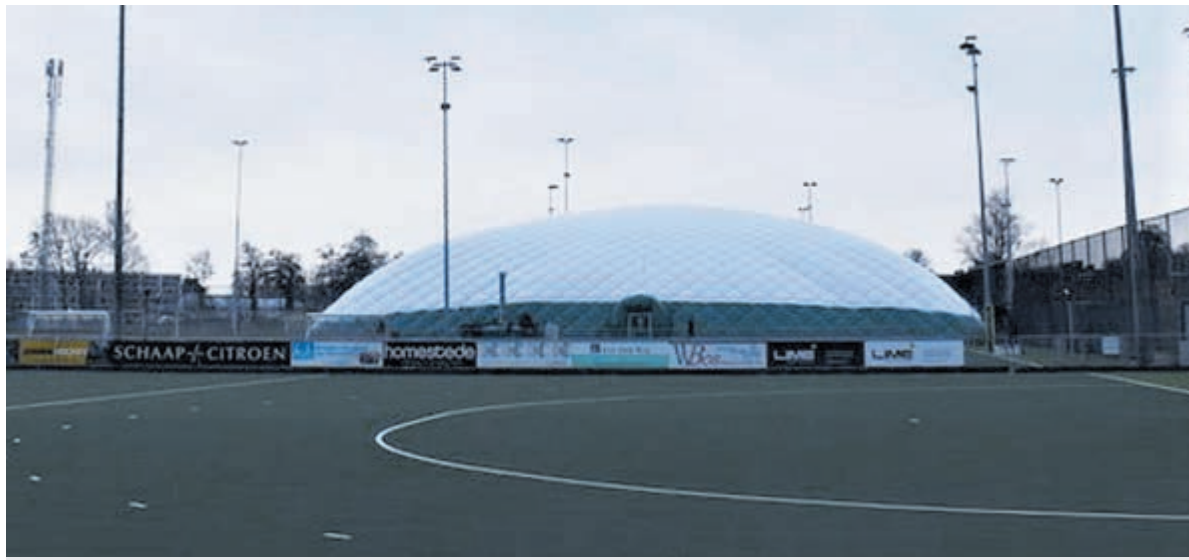
De gerealiseerde blaashal van Alliance.