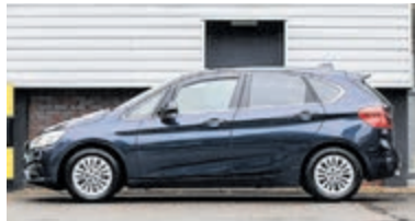
BMW 2-serie Active Tourer 218i Luxury € 14.950,-