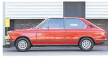
BMW 2002 1802 Touring € 14.950,-