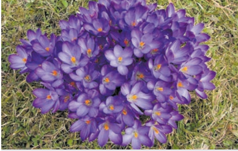
Wilde krokus.