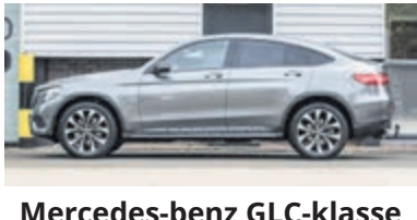
Mercedes-benz GLC-klasse Coupe 250 4MATIC Premium € 49.950,-