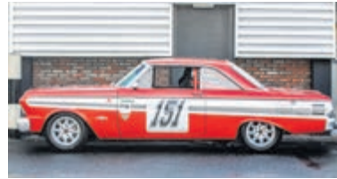
Ford Usa Falcon FUTURA SPRINT € 79.000,-