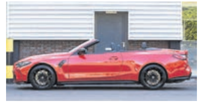
BMW 4-serie Cabrio M4 xDrive Competit € 159.000,-