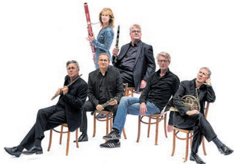
Het Hexagon Ensemble.

Stichting Muzenforum organiseert ieder jaar van september t/m april acht zondagochtendconcerten. Diversiteit in het aanbod staat voorop: van solisten tot ensembles en zowel instrumentaal als vocaal. Op de website www.muzenforum.nl vindt u meer informatie over het concert.