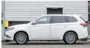
Mitsubishi Outlander 2.4 PHEV S-Edition € 28.950,-