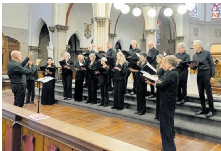
Ensemble Sola Re Sonare. Foto aangeleverd.

Het concert zal ongeveer een uur duren. Na afloop bent u van harte welkom in de Pauwehof, waar Glühwein en hartige hapjes verkrijgbaar zijn. Komt u ook?