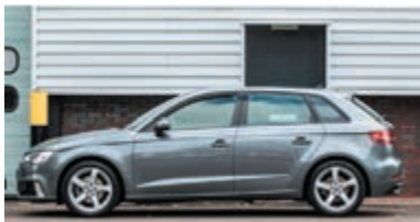
Audi A3 Sportback 35 TFSI CoD ProL. € 25.900,-