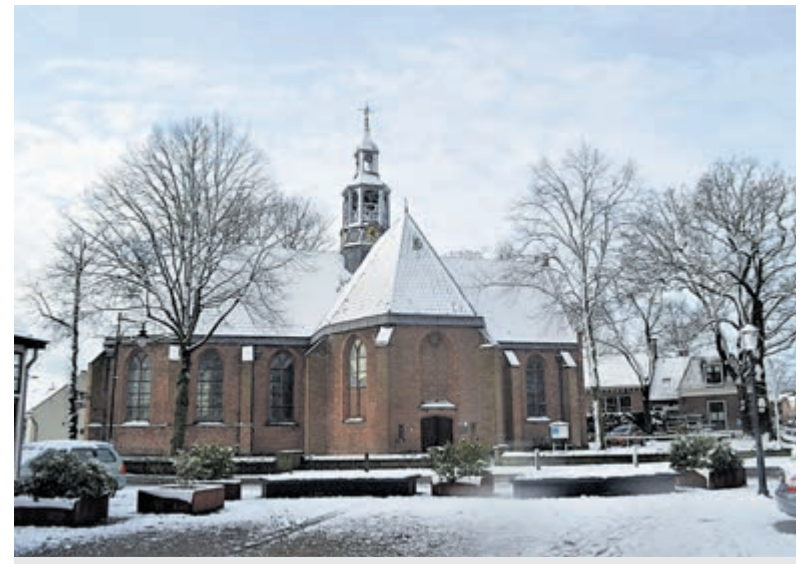
De Oude Kerk op het Wilhelminaplein in sfeervolle kerstferen.