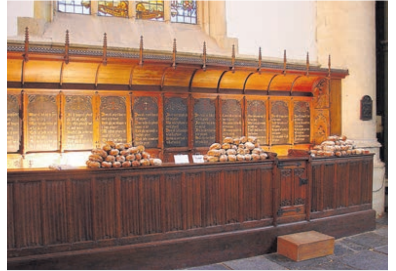
Broodverkoop in de monumentale broodbank in de Grote of St.-Bavokerk.

Gemiddeld één op de elf kinderen groeit op in armoede. In Nederland gaat het om ongeveer 220.000 kinderen die opgroeien in een huishouden met een laag inkomen. Armoede is niet alleen weinig geld