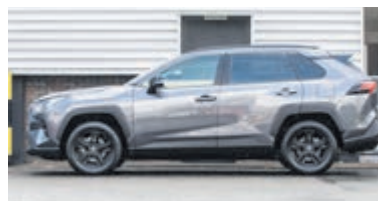
Toyota RAV4 2.5 Hybrid Dynamic € 36.900,-