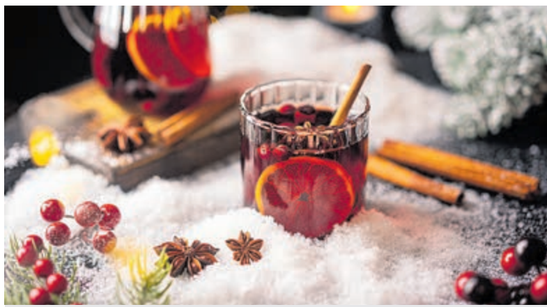
Ook Glühwein op Midwinterfeest.

Klein Groenendaal, Wilhelminaplein, tel. 06-22904311, in deze periode dagelijks geopend.