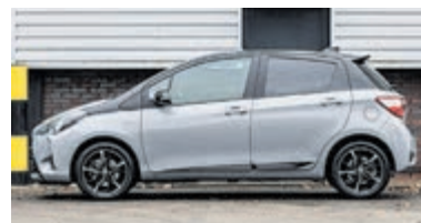
Toyota Yaris 1.5 Hyb Bi-Tone Plus € 17.750,-