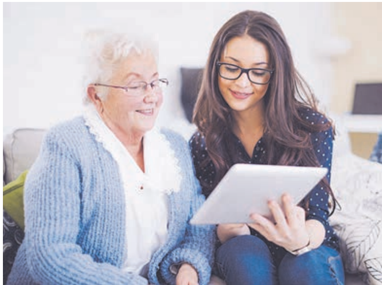
Themaspreekuur in bibliotheek.