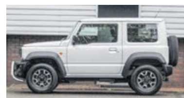
Suzuki Jimny 1.5 Stijl € 36.950,-