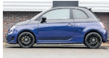
Fiat 500C 1.4 T-Jet Abarth Ela € 15.900,-