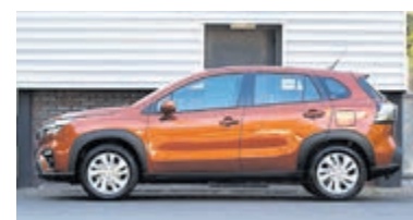
Suzuki S-Cross 1.4 B.jet Comfort SH € 28.900,-