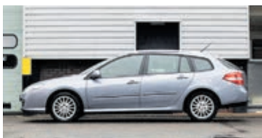
Renault Laguna Estate 2.0 16V Expression € 4.450,-