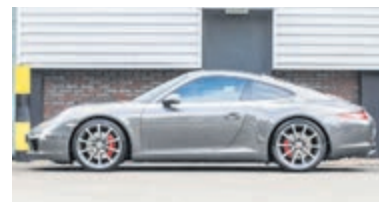
Porsche 911 3.8 Carrera S € 84.900,-