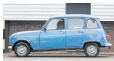
Renault R 4 R 4 € 4.950,-