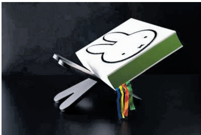
Nijntje XXL.

Voor beide lezingen geldt: toegang gratis, reserveren gewenst via info@boekhandelblokker.nl /of 023-5282472/ app 06-18336320.