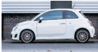
Fiat 500 1.4-16V Abarth € 11.950,-