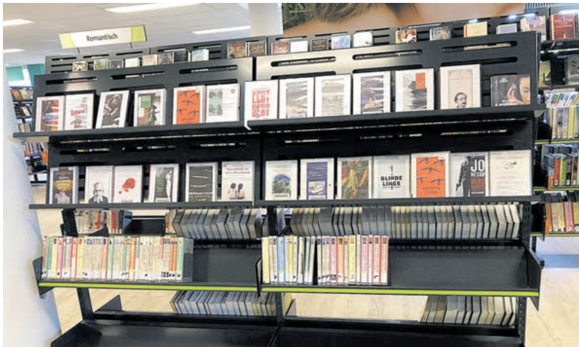
Bibliotheek Bloemendaal en boekverkoop.