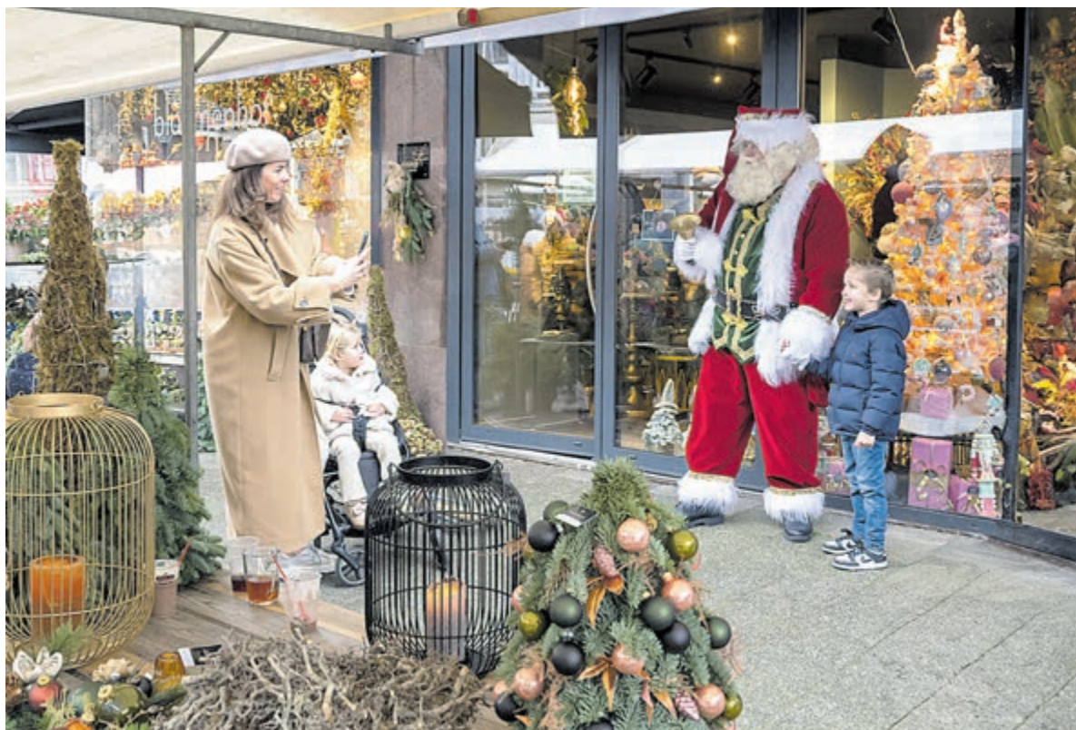
Winterfair in winkelcentrum Heemstede.

Kosten: € 7,50. Aanmelden kan via info@wijheemstede.nl , belt u 023 - 548 38 28 of bij de receptie van de Luifel.