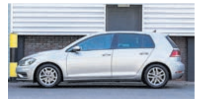
Volkswagen Golf 1.5 TSI Highline € 20.900,-