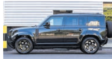
Land Rover Defender 2.0 P400e 110X SE € 99.999,-