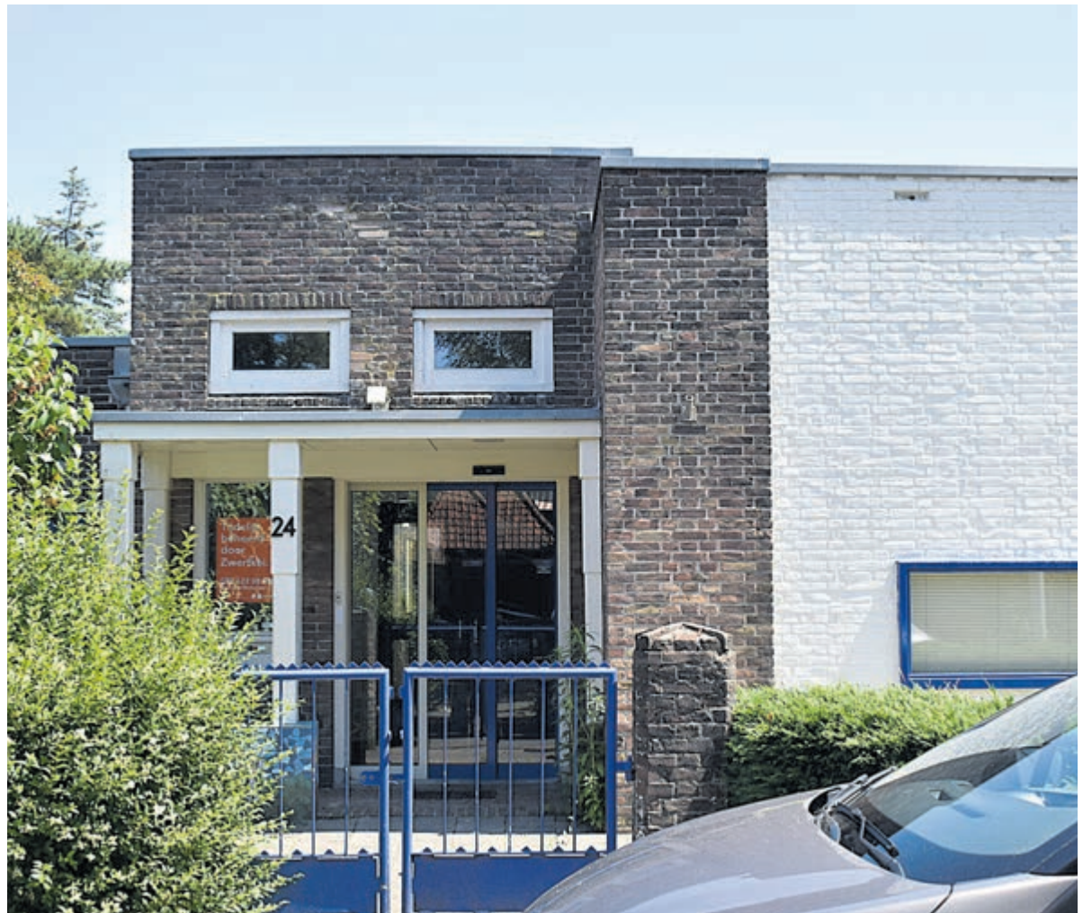
Het pand nr. 24 aan de Lieven de Keylaan.

Marloes Derks (D66) wilde het trambuisje dat tegenover het huidige gebouw staat waar mogelijk betrekken bij de plannen. De buurt zou daarbij ook een invulling kunnen voorstellen zoals dat een aantal jaren geleden ook al eens is gedaan. Wethouder Grummel neemt dit idee mee in de plannen. De voltallige commissie gaat akkoord met de drie plannen zoals door het college is voorgesteld. Wel vraagt men aandacht voor de communicatie/participatie richting de bewoners. Tegen het voorjaar 2024 zullen de plannen een meer definitieve karakter krijgen en kan er worden besloten. Onzekerheid onder de bewoners blijft bestaan. Zij hopen de zorgen samen met de gemeente een plek te kunnen geven. Hoe e.e.a. voor de gemeente financieel uitpakt, zal ook in het voorjaar duidelijk moeten worden.