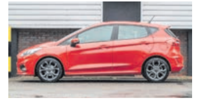
Ford Fiesta 1.0 EcoB. Active € 17.900,-