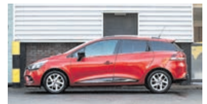
Renault Clio Estate 1.2 TCe Zen. € 15.950,-