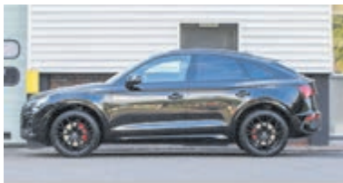
Audi Q5 Sportback 55 TFSI e S edition € 74.950,-