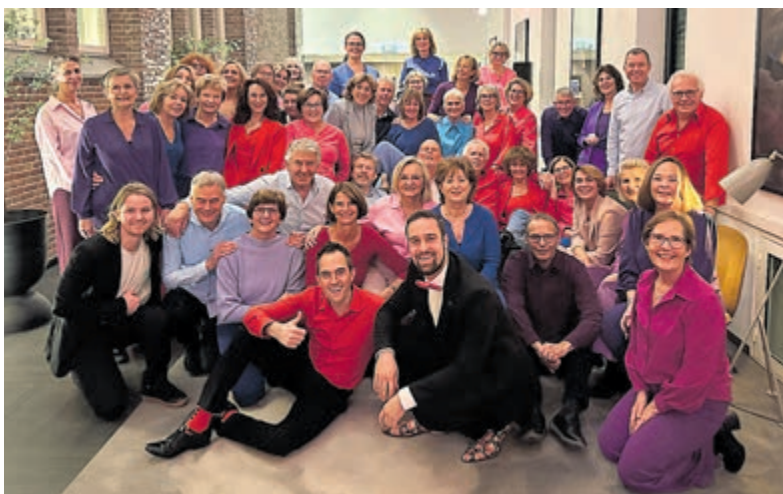
Het Voorwegkoor.