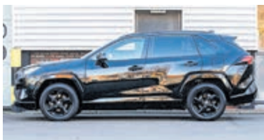
Toyota RAV4 2.5 Hybrid AWD Executive € 37.900,-