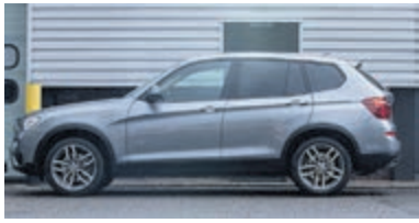
BMW X3 xDrive20i Hi.Ex.xL. € 27.900,-