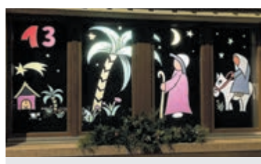
Voorbeeld van versierd kerstraam.

nemende adressen zijn te vinden op www.welzijnbloemendaal.nl en er liggen flyers bij Welzijn Bloemendaal en de bibliotheek, beiden aan de Kerklaan 6 in Bennebroek.