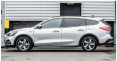
Ford Focus Wagon 1.0 EcoB. Tit. Bns € 24.900,-