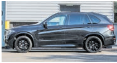
BMW X5 XDrive40e M Sp. Ed. € 54.900,-