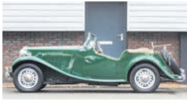
MG TD Roadster € 28.950,-