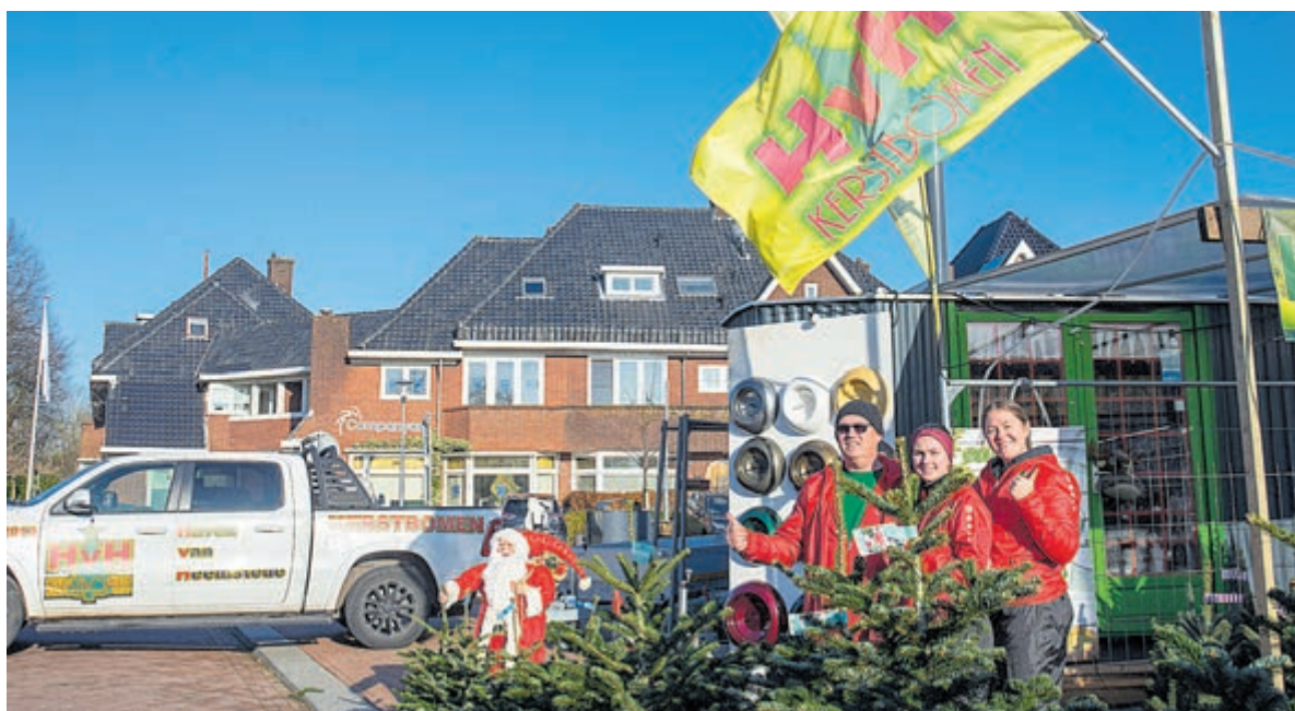
De kerstbomenverkoop van de Haven van Heemstede is al 10 jaar een begrip in Heemstede en omgeving.