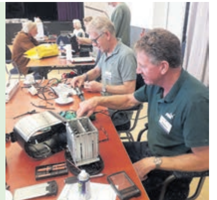
Repaircafé Vogelenzang.

De locatie is Dorpshuis Vogelenzang aan de Henk Lensenlaan 2. Voor informatie: mail naar repaircafevogelenzang@yahoo.com of bel 06-53561413.