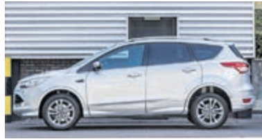
Ford Kuga 1.6 Titanium Pl. 4WD € 16.950,-