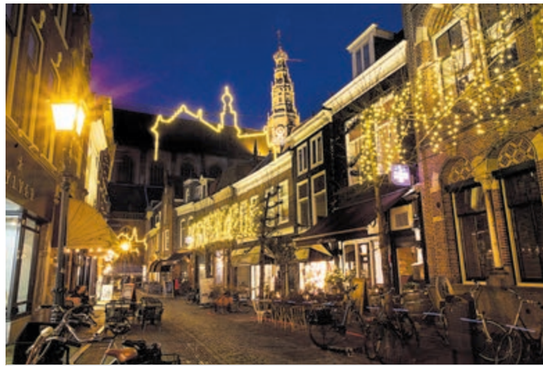
Advent in de Bavo.

De adventsopenstelling wordt georganiseerd door de diaconieën van de Protestantse Gemeente Haarlem-Centrum en Evangelisch-Lutherse Kerk Haarlem, de Oecumenische werkgroep 'De Grote Kerk door de Week', en de Vereniging Vrienden van de Grote Kerk. Mede mogelijk gemaakt door financiële bijdragen van Stichting Jacobs Godshuis en J.C. Ruijgrok stichting.