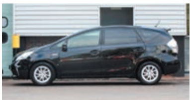
Toyota Prius Wagon 1.8 Aspiration 96g € 16.700,-