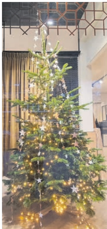
De woonwensboom in de etalage van Home Made By_REE.

Heemstede - Home Made By_REE op de Binnenweg 89-91 in Heemstede heeft een woonwensboom in de etalage staan. In deze kerstboom mag jij jouw interieurwens voor 2024 ophangen! Durf jij in het nieuwe jaar te kiezen voor een eyecatcher van behang op je muur? Of wil jij dat de warmte beter in huis blijft door een mooi gordijn voor je raam te hangen? Droom jij weg bij het idee van een heerlijk zacht tapijt onder je voeten als je 's ochtends uit bed stapt? Of wens je een stijlvolle zithoek met een comfortabele bank en bijpassende woonaccessoires? Hang jouw interieurwens op in de WOONWENSBOOM in de winkel op de Binnenweg 89. Hiermee maak jij kans op een cadeaubon t.w.v. € 250,00 te besteden bij REE. Met een ruim assortiment aan verf, behang, raamdecoratie, vloerbedekking, meubels en woonaccessoires kan jouw interieurwens zomaar uitkomen in 2024. De winnaar wordt in januari bekendgemaakt.