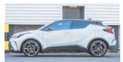
Toyota C-HR 2.0 Hybrid Bns GR S € 32.700,-