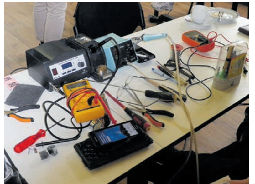
Reparaties in Repaircafé Overveen.

Benieuwd naar de cybercrime-aantallen in jouw gemeente? Bekijk dan de volgende pagina: www.vpngids.nl/onderzoek/cybercrime-2022-forse-stijging-over-afgelopen-zes-maanden/ .