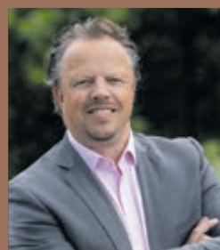
Alexander van der Pijl Dunweg Uitvaartzorg