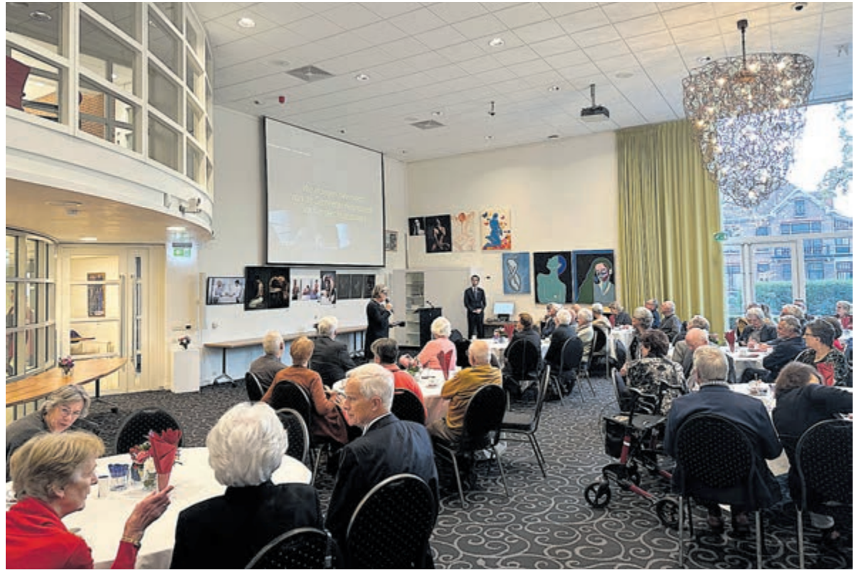
De 50-jarige bruidsparen in de Burgerzaal.

De middag werd afgesloten met een drankje en geanimeerde gesprekken, maar niet voordat de hele groep op