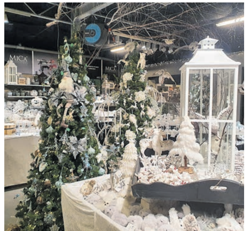
Lekker in de kerstfeer komen? Dat lukt uitstekend bij Welkoop!