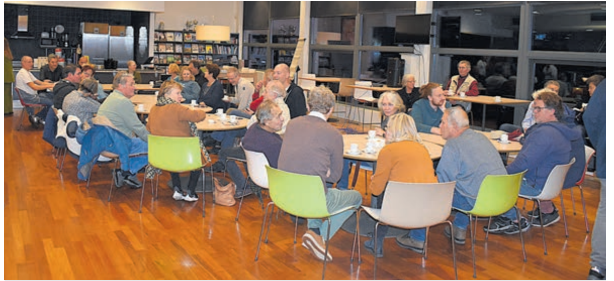
Begrip van de bewoners.

decor, met schurende liedjes en sketches met een absurd- humoristisch randje, delen ze over hun onzekerheden en ervaringen. Ze voeren de kwetsbare gesprekken die ze zelf zo hebben gemist. Want hoe kan je vergelijken of leren als iedereen zijn seksleven geheimhoudt? Een voorstelling voor iedereen die het gesprek over seks en intimiteit niet altijd durft te voeren, voor wie nieuwsgierig is om zijn eigen relatie tot seks te verdiepen of voor wie gewoon fan is van de liedjes en creativiteit van de twee. Een avond vol herkenbaarheid, (plaatsvervangende) schaamte, bevrijdende relativering en hilarisch ongemak.