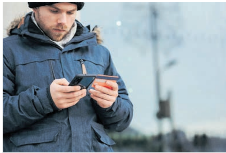
Cybercrime kan ook gebeuren via je mobieltje.

Aalsmeer staat onderaan de lijst met 1,6 aangiftes van online criminaliteit per 10.000 inwoners.