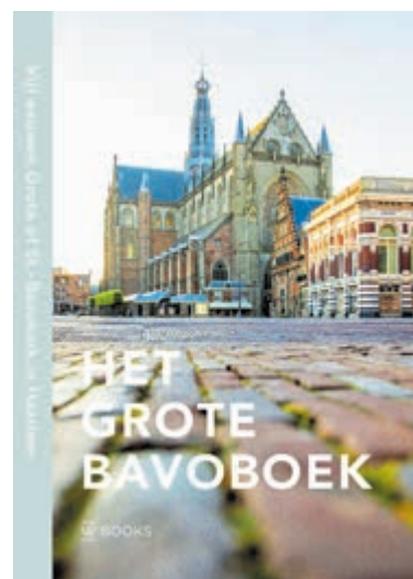
Het Grote Bavoboek. Beeld aangeleverd.

Het Grote Bavoboek is het ultieme boek over een Haarlemse icoon en hét naslagwerk over de magnifieke Oude Bavo. Koen Vermeij e.a. (red), Het Grote Bavoboek. Vijf eeuwen Grote of St.-Bavokerk in Haarlem. €59,95, ISBN 978 94 625 8419 8. Verkrijgbaar bij de boekhandel.