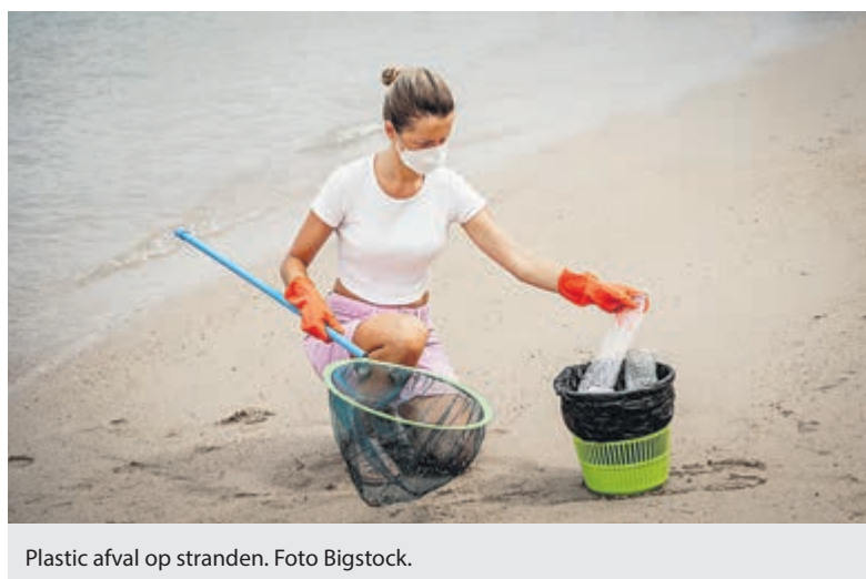
Plastic afval op stranden.

Wethouder Henk Wijkhuizen: “Het is belangrijk om jongeren bewust te maken van de schadelijkheid van zwerfafval en ook de mogelijkheden