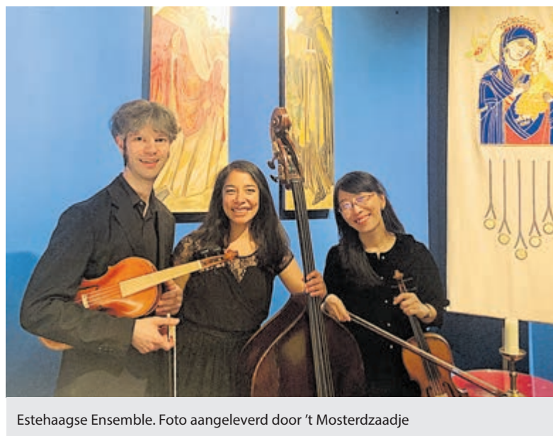
Estehaagse Ensemble.

mentale madrigaal (meerstemmig lied). De naam 'Estehaagse Ensemble' is een woordspeling op 'Esterhazy', het paleis waar Haydn werkte, en 'Haagse', verwijst naar de stad waar ze wonen. Het ensemble kent verschillende samenstellingen. Zij treden op door heel Nederland en speelden o.a. bij de opening van het parlement in de Ridderzaal.