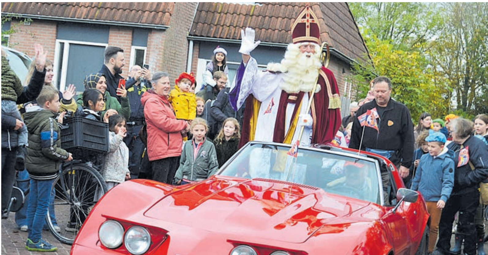
Andere paardenkracht in de rode bolide van de Sint.