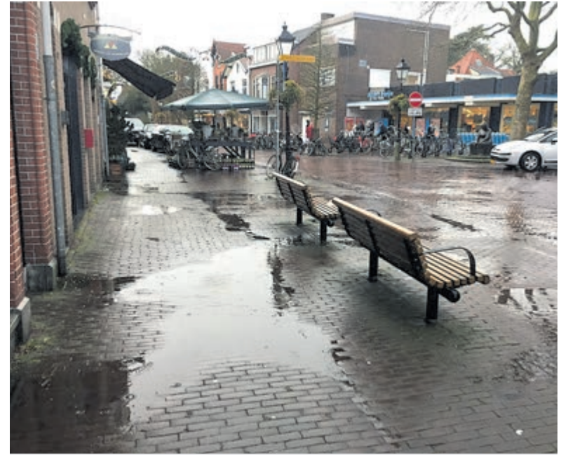
Herbestrating vanwege heftige regenbuien.

De ondernemers zijn zo reëel hun wensen voor de korte termijn te beperken tot het omzetten van de Parkeermeters in een blauwe zone die dan ook moet gelden in een gedeelte van de zijstraten. Verder hopen de winkeliers dat ongeveer de helft van de fietsenrekken worden