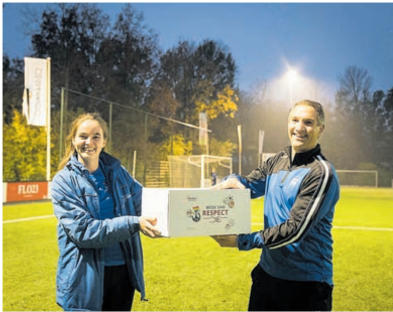
Overhandiging van de respectbox.