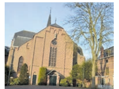
De Sint Jozefkerk (I) in Bennebroek.

als locatie beschermd wonen voor mensen die ondersteuning en begeleiding nodig hebben.