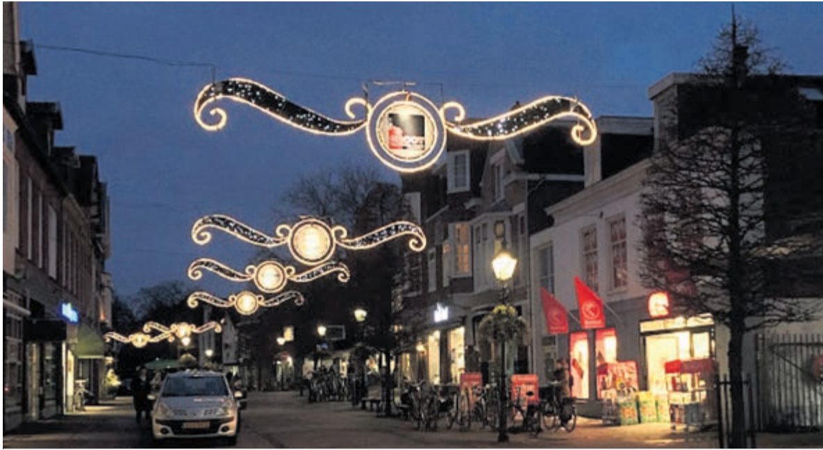
In de decembermaand zijn de winkelgevels te donker.