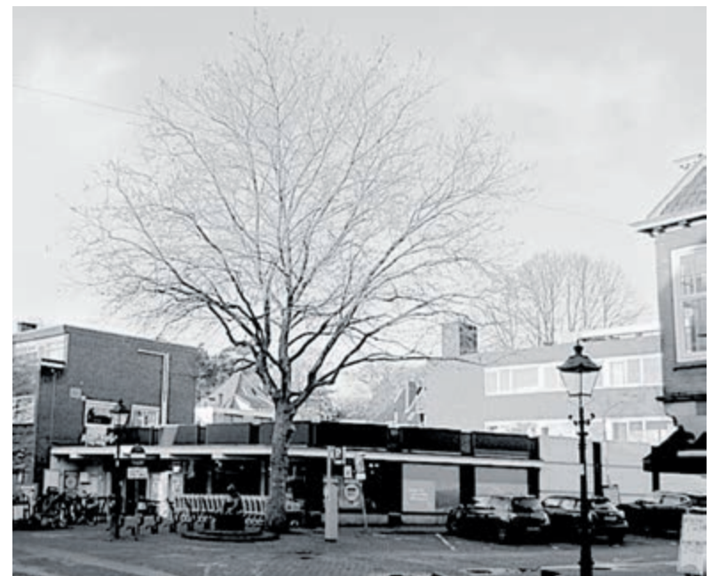
De mooie plataan voor AH moet blijven behouden.

vervangen door rekken, zgn. fietsnietjes. Nu de regenbuien steeds heftiger worden, dringen de ondernemers ook aan op korte termijn plaatselijke herbestrating zodat je kan winkelen zonder natte voeten.