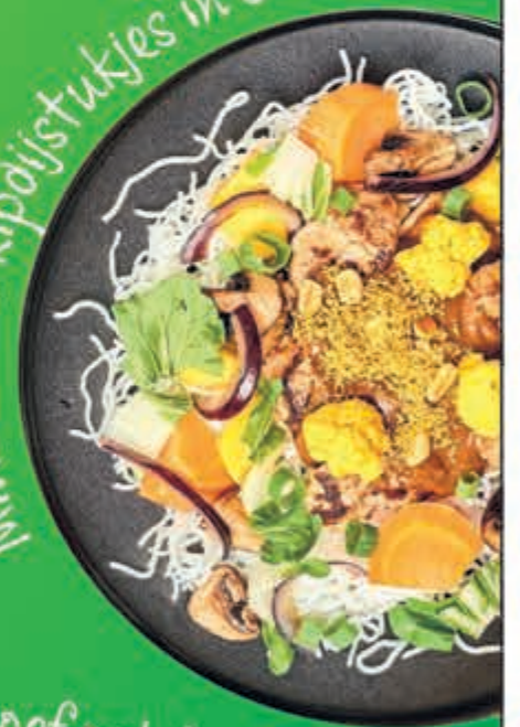
Milhoen met kipdijstukjes in satésaus