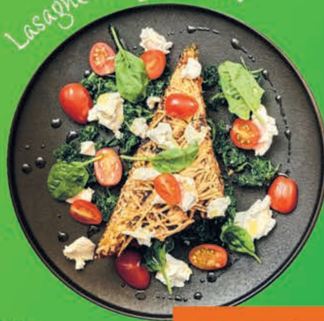
Lasagne met geitenkaas