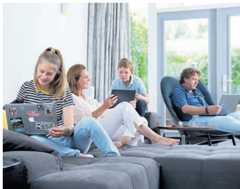
Sneller internet door glasvezelaansluiting.

Meer informatie op de website gavoorglasvezel.nl , waar eveneens een postcodecheck gedaan worden om te zien of het adres in aanmerking komt voor het aanbod.