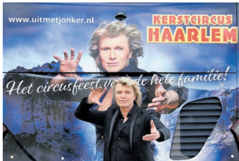
Hans Klok - illusionist én spreekstalmeester.

Tussen een keur aan internationale circusartiesten zal Hans met behulp van zijn knappe assistentes verbluffend verdwijnen en verschijnen: "Met publiek rondom is circus altijd weer het meest uitdagende podium", vertelt de winnaar van de Zilveren