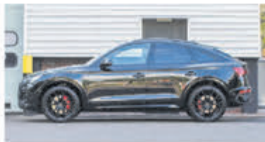
Audi Q5 Sportback 55 TFSI e S edition € 79.950,-