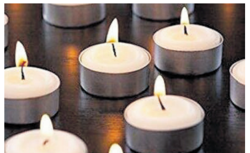
Herdenken in De Kapel.