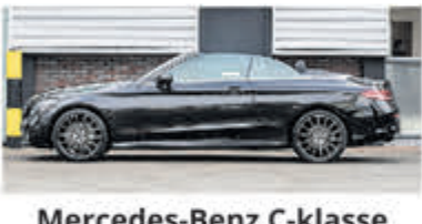
Mercedes-Benz C-klasse 220 d Cabrio Premium Pack € 39.900,-