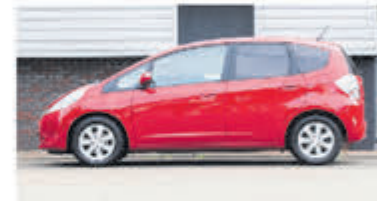
Honda Jazz 1.4 Hybrid Elegance € 11.700,-