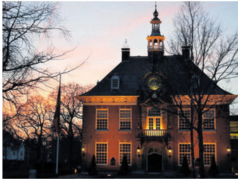
Raadhuis Heemstede.

Een amendement van HBB om de verhoging van de 1 miljoen OZB niet