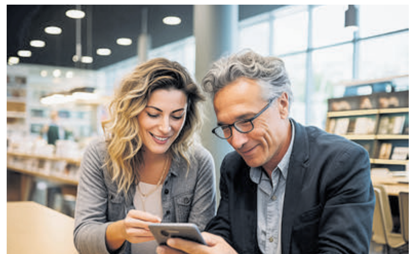
Taal en digitale vaardigheden vergroten.

Bij de Bibliotheek Haarlem Noord ben je elke maandag van 10 – 12 uur welkom om te werken aan je taal- en digitale vaardigheden. Het spreekuur is volledig gratis en zonder afspraak: je kunt zo naar binnen lopen. Onze medewerkers helpen je en de koffie en thee staan voor je klaar.