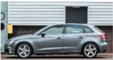
Audi A3 Sportback 35 TFSI CoD ProL. € 25.900,-