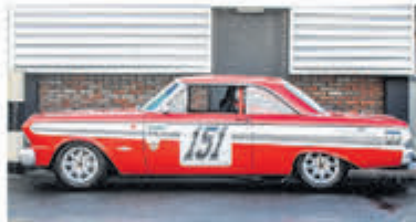
Ford Usa Falcon FUTURA SPRINT € 79.000,-