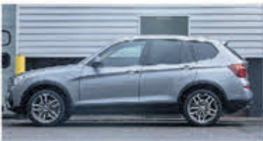
BMW X3 xDrive20i Hi.Ex.xL. € 27.900,-