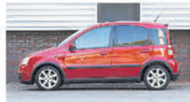
Fiat Panda 1.4 16V Sport € 4.450,-