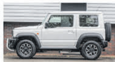
Suzuki Jimny 1.5 Stijl € 36.950,-