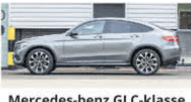
Mercedes-benz GLC-klasse Coupe 250 4MATIC Premium € 49.950,-