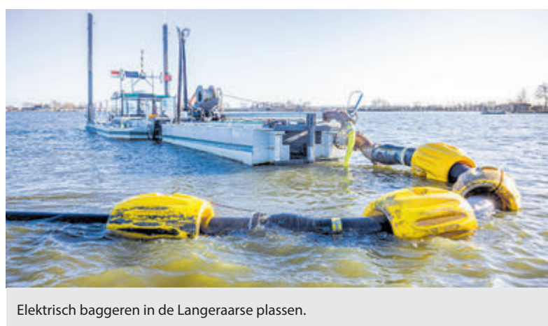
Elektrisch baggeren in de Langeraarse plassen.

Rijnland streeft ernaar om in 2050 100% circulair te zijn.