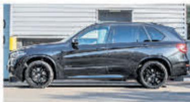
BMW X5 XDrive40e M Sp. Ed. € 54.900,-