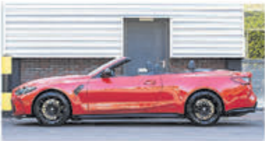
BMW 4-serie Cabrio M4 xDrive Competit € 159.000,-