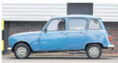
Renault R 4 R 4 € 4.950,-