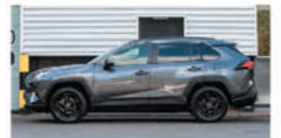
Toyota RAV4 2.5 Hybride Style! € 40.750,-