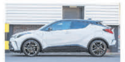
Toyota C-HR 2.0 Hybrid Bns GR S € 32.700,-