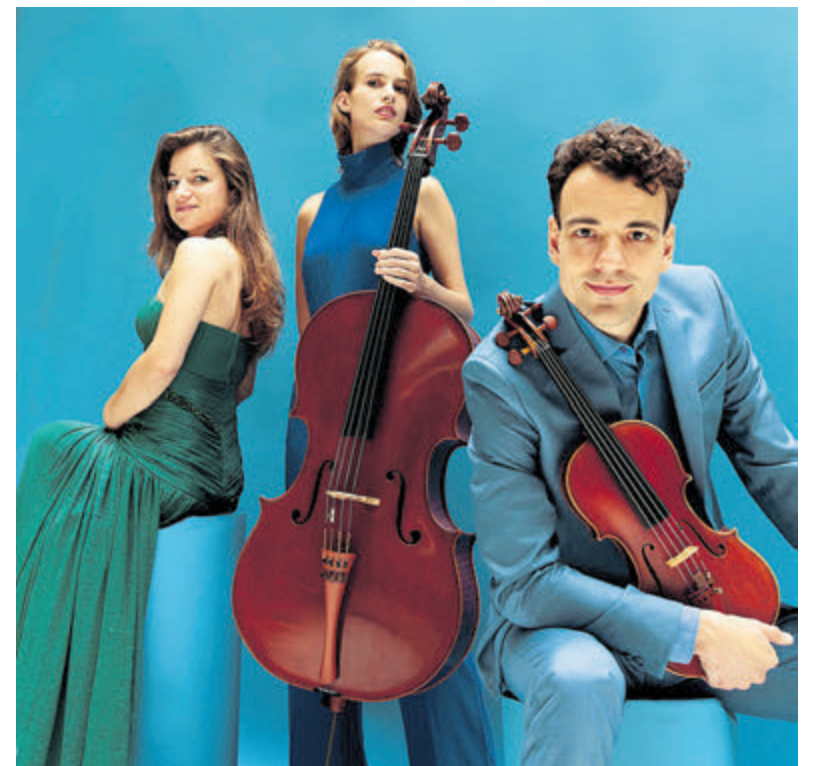
Delta Pianotrio.

Kaarten te bestellen via de website www.CruquiusConcerten.nl of via Stichting CruquiusConcerten, p/a Anne Franklaan 64, 2135 HB Hoofddorp, telefonisch: 023- 529 3204.