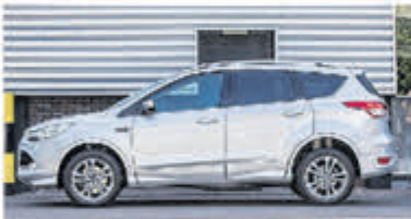
Ford Kuga 1.6 Titanium Pl. 4WD € 16.950,-