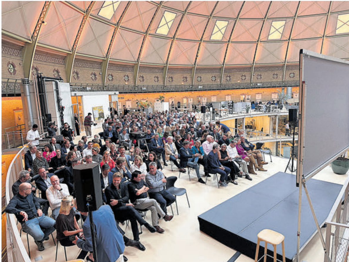
Bijeenkomst in De Koepel.

Het event past volgens hostingpartner Cupola XS ook volledig in de doelstelling om meer tech- en innovatiegerichte events voor bedrijven