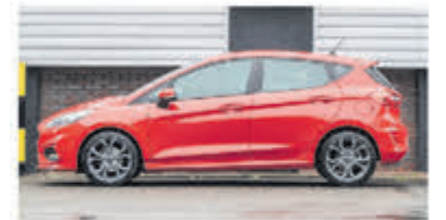
Ford Fiesta 1.0 EcoB. Active € 17.900,-