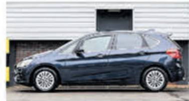
BMW 2-serie Active Tourer 218i Luxury € 14.950,-