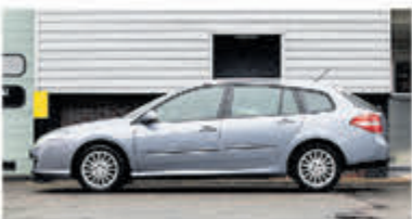
Renault Laguna Estate 2.0 16V Expression € 4.450,-