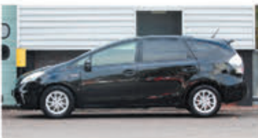
Toyota Prius Wagon 1.8 Aspiration 96g € 16.700,-