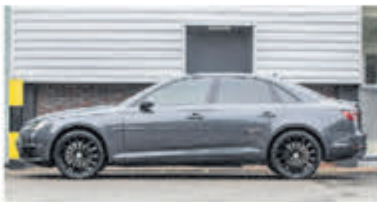
Audi A4 Limousine 2.0 TDI Sport L. Ed. € 19.850,-