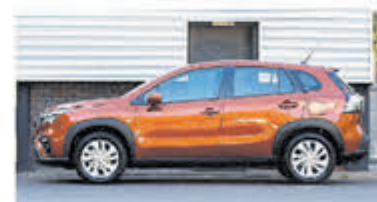
Suzuki S-Cross 1.4 B.jet Comfort SH € 28.900,-