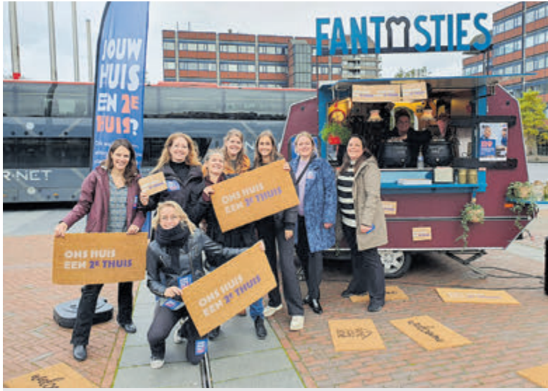
Aftrap van de Week van de Pleegzorg.