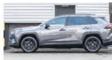
Toyota RAV4 2.5 Hybrid Dynamic € 36.900,-