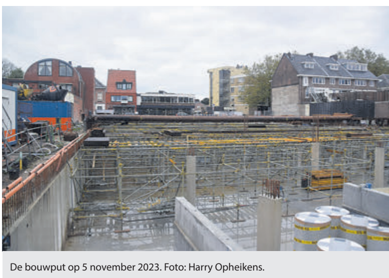
De bouwput op 5 november 2023.