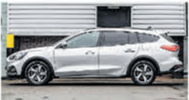
Ford Focus Wagon 1.0 EcoB. Tit. Bns € 24.900,-