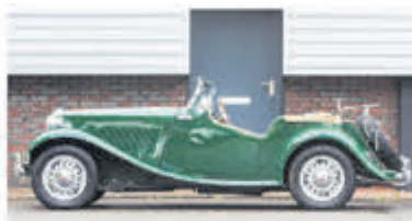
MG TD Roadster € 28.950,-