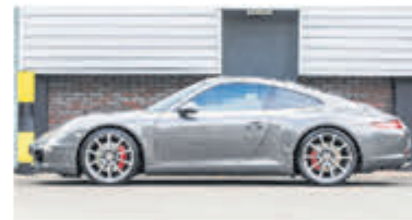
Porsche 911 3.8 Carrera S € 84.900,-