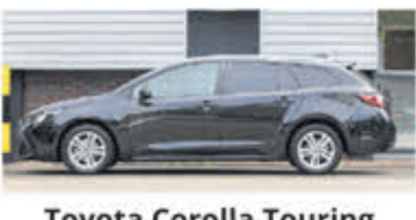
Toyota Corolla Touring Sports 1.8 Hybrid Active € 26.900,-