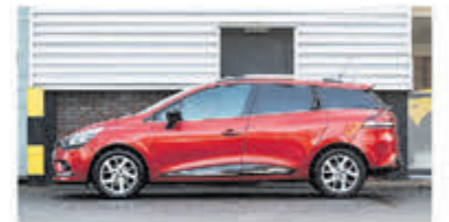
Renault Clio Estate 1.2 TCe Zen. € 15.950,-