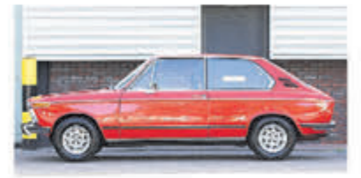
BMW 2002 1802 Touring € 14.950,-