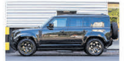
Land Rover Defender 2.0 P400e 110X SE € 99.999,-