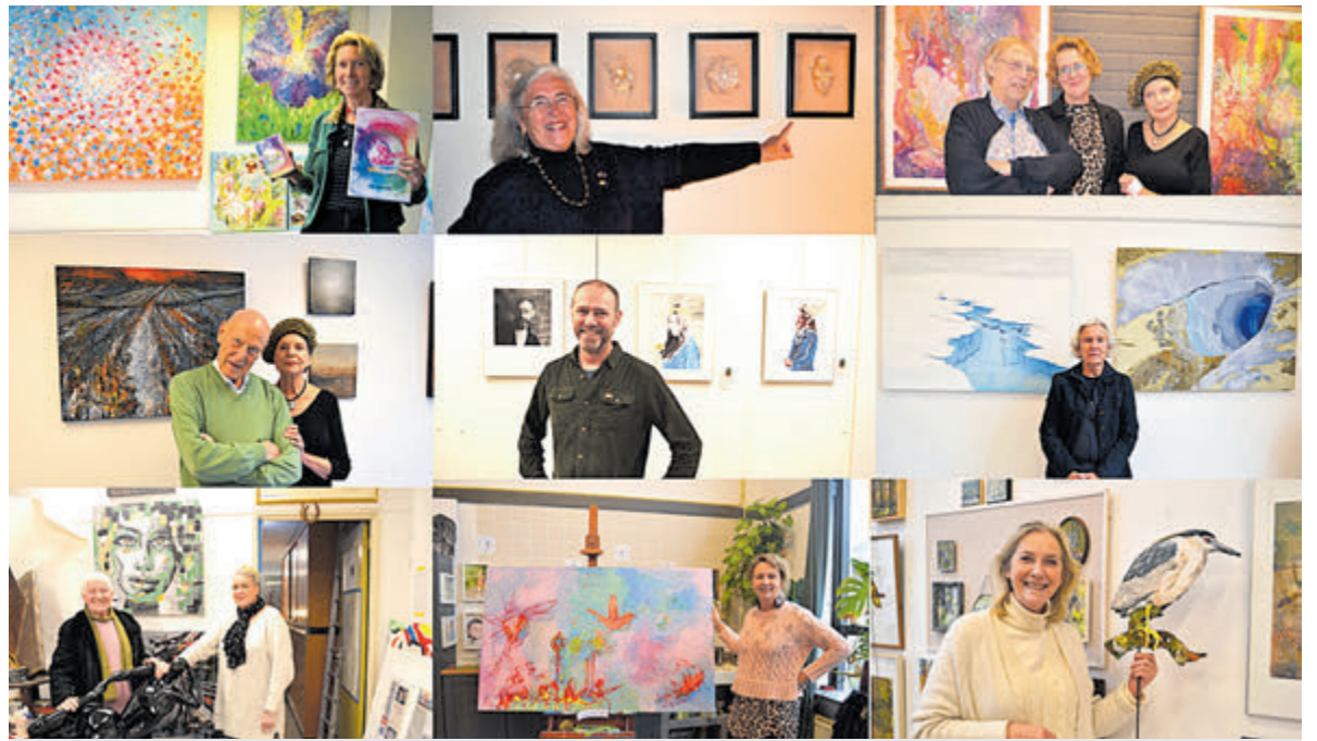
Diverse Heemstedse kunstenaars exposeerden afgelopen weekend hun werk.