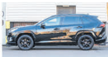
Toyota RAV4 2.5 Hybrid AWD Enrg+ € 37.900,-