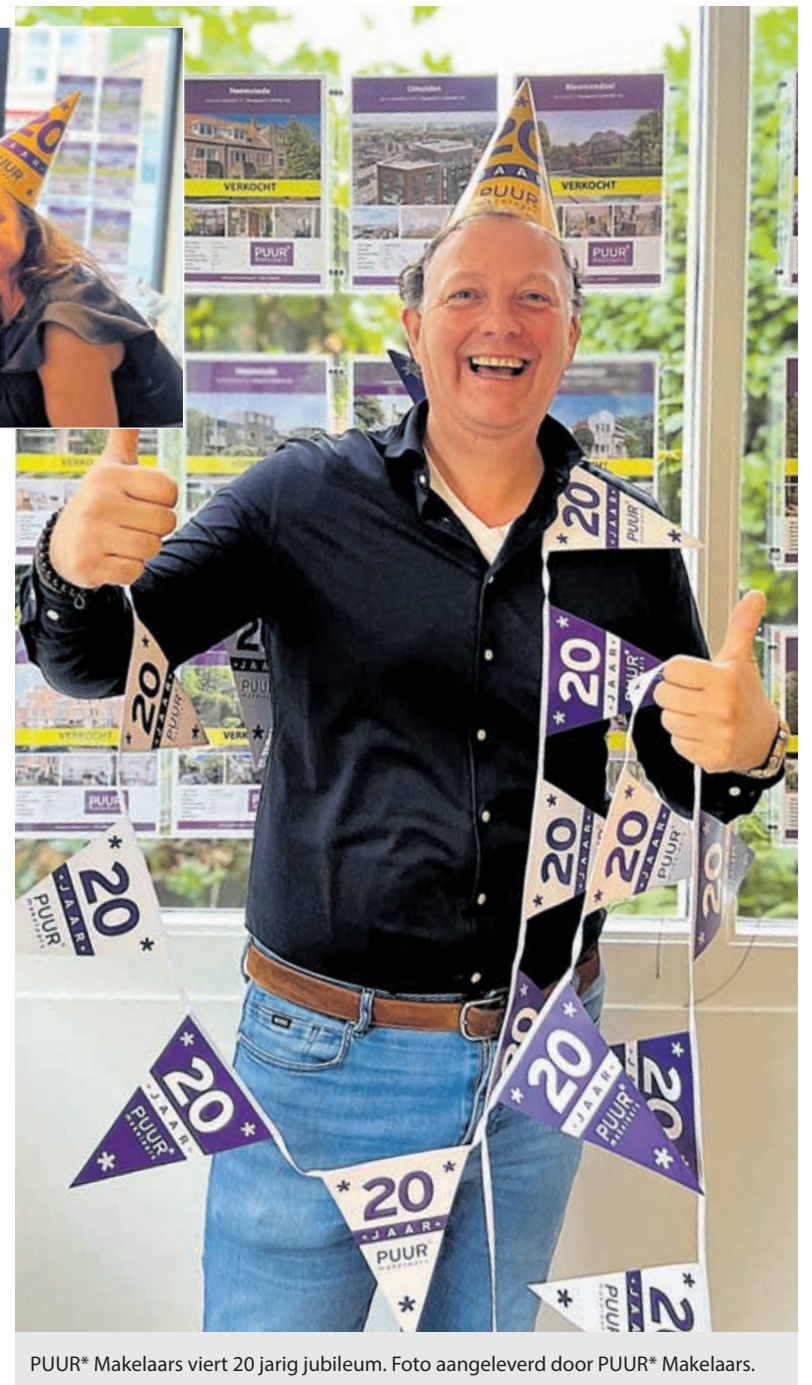
PUUR* Makelaars viert 20 jarig jubileum.

PUUR* makelaars onderscheidt zich door haar creatieve aanpak, persoonlijke benadering en lokale betrokkenheid. De slogan 'Nét even anders' is geen loze kreet, maar de rode draad in alles wat het team doet, van de manier waarop woningen worden gepresenteerd tot hoe klanten worden begeleid in