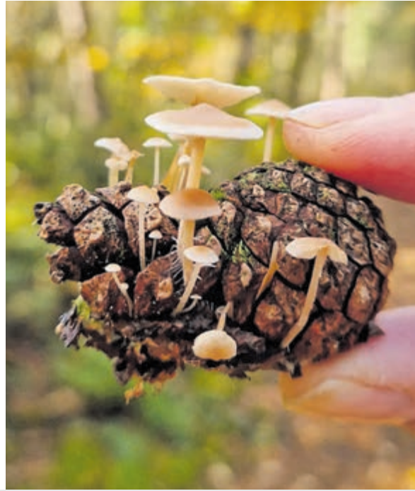
Zoveel soorten om te ontdekken, te bewonderen en fotograferen.