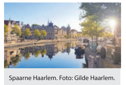
Spaarne Haarlem.