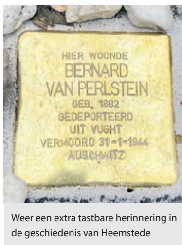
Weer een extra tastbare herinnering in de geschiedenis van Heemstede