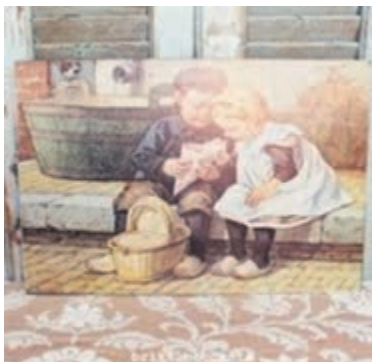
Ot en Sien.

NVVH- leden kunnen de lezing gratis bijwonen, niet-leden betalen €7,50.