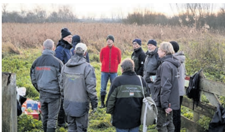
Vrijwilligers De Liede.

Lijkt het je iets en wil je meer informatie, stuur dan een motivatiebrief aan boswachter Gert-Jan Gebben via gj.gebben@landschapnoordholland.nl .