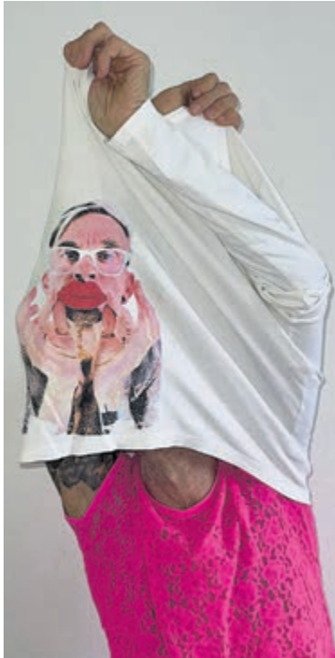
De Roze Kunstlijn hult zich in Love.

De Roze Kunstlijn is vanaf nu te zien tot in de eerste week van januari. Officiële opening 31 oktober van 14.30-16.30 met korte praatjes en muziek in aanwezigheid van veel van de dertig kunstenaars.