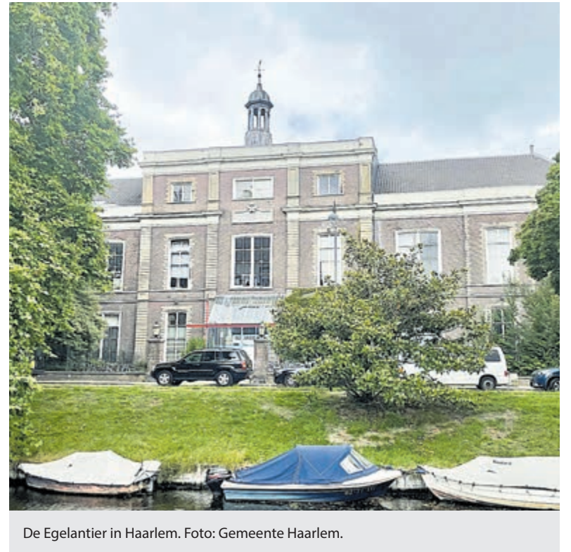
De Egelantier in Haarlem.

Voor beide evenementen: toegang gratis. Reserveren gewenst, via info@boekhandelblokker.nl of 023-5282472/ app 06 18336320.