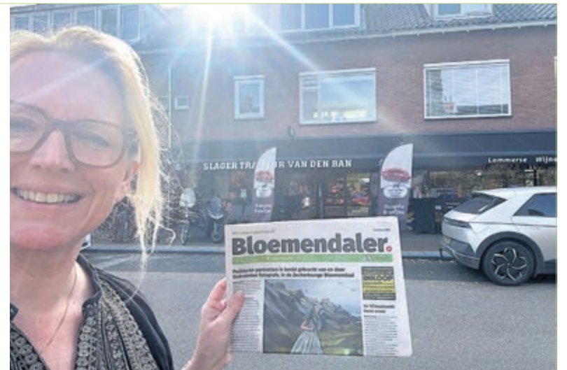
Even verderop in de straat heeft de gemakwinkel ook een stapeltje Bloemendalers liggen.

Grijp je mis, lees de krant dan online via: www.heemsteder.nl , kies voor