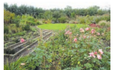
Mooie omgeving om stil te zijn.

Tussen 13.00 en 16.00 uur is er verkoop van biologische vaste plantjes, boompjes, kruiden thee en andere tuinproducten. De opbrengst is voor de Stiltetuin. Je kunt alleen contant betalen. De Stiltetuin ligt aan het Marcellisvaartpad in Haarlem Zuid-West. Voor informatie zie: www.de-regenboogtuin.nl .