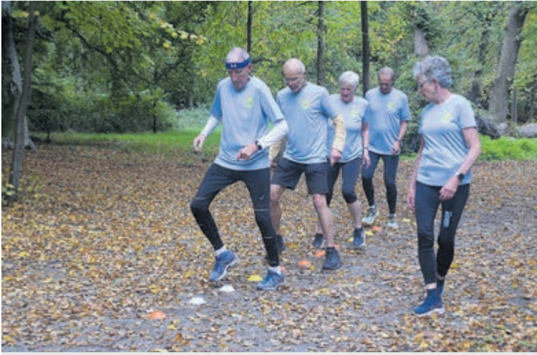
GezondOud voor het goede doel, heerlijk trainen in het bos