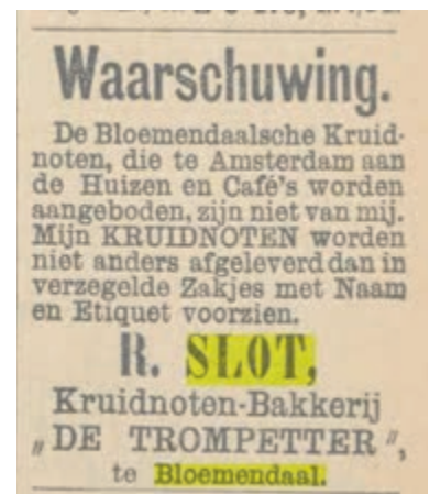
Het is een advertentie uit mei 1892.

Bloemendaal - Op de Bloemendaalseweg nummer 112A zat vroeger de bakkerij van de familie Slot. Drie generaties van deze familie hadden hier tot 1960 een bakkerij en zelfs daarvoor woonde er al een bakker. Aan de straatzijde was de winkel, waar een uithangbord met een trompetter uithing. Beroemd waren de Bloemendaalse kruidnoten, die hier eeuwenlang volgens een geheim recept gebakken werden. Deze waren zelfs op speciale adressen in Amsterdam en Utrecht te koop. Maar let er wel op dat u de echte heeft!