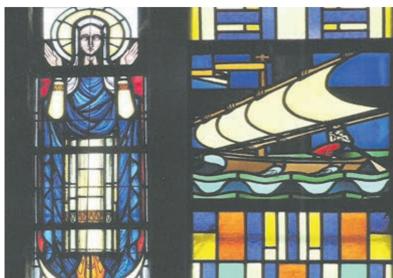
Deel van het fraaie glas-in-loodraam in OLV Hemelvaartkerk.

Aanmelden via de receptie van de Luifel, tel. 023 - 548 38 28 of via info@wijheemstede.nl . Aanmelden kan tot 1 dag van tevoren.