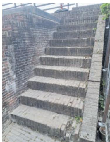
Trap van de kolksluis voor de opknappbeurt. En erna...