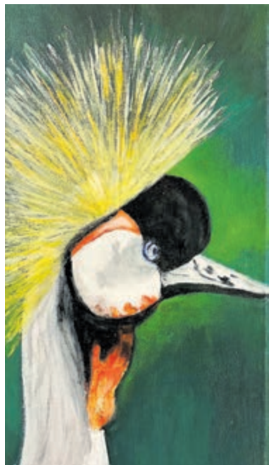
Deelnemer Nic schilderde deze kraanvogel.

Bennebroek – In het Centraal Servicepunt Bennebroek (CSB) aan de Kerklaan 6 is vanaf deze week een expositie te zien van zo'n twintig tekeningen en schilderijen gemaakt door de deelnemers van Roads en de Oppeppers Kennemerhart.