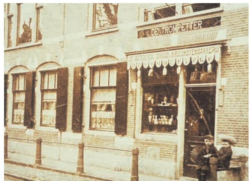
Op de foto het bankje voor de winkel zoontje Reinier Slot en zijn zusje.