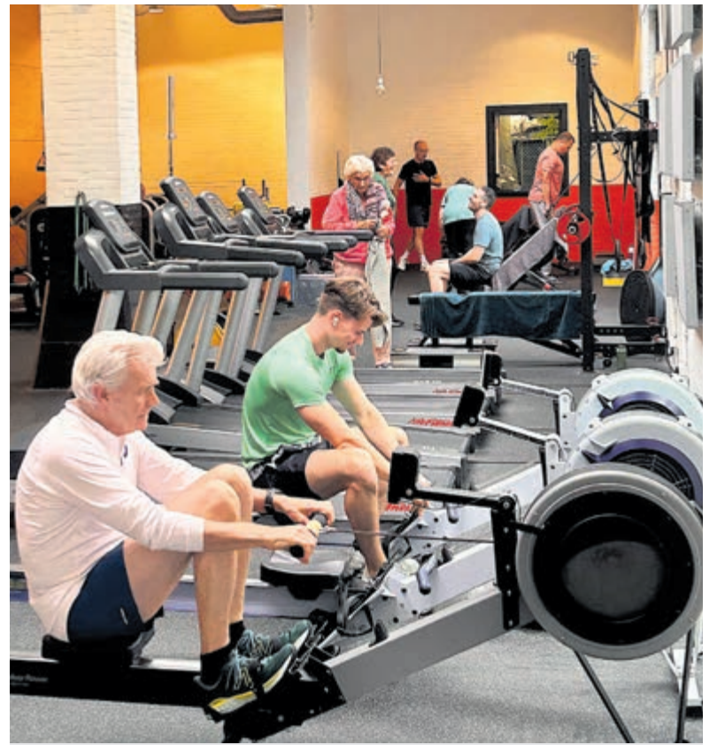
FM HealthClub Heemstede.

De inschrijving voor dit nieuwe programma is nu geopend, maar er