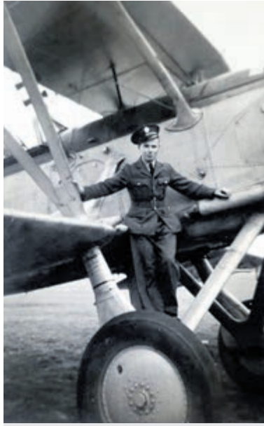
De piloot van de Spitfire overleefde de crash.

De lezing wordt gehouden in 'Het Jagershuis', Binnenweg 69, Bennebroek. Inloop vanaf 19.30 uur, de lezing begint om 20.00 uur en duurt, met vragen en discussie, tot ca. 22.00 uur. Daarna nog een nazit met hapje/