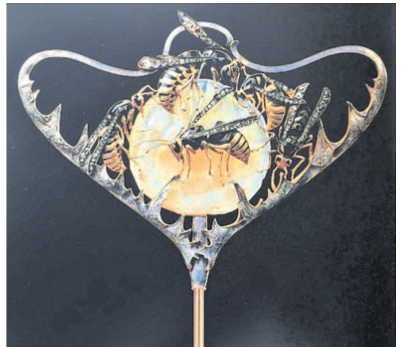
Glaskunst van Lalique.