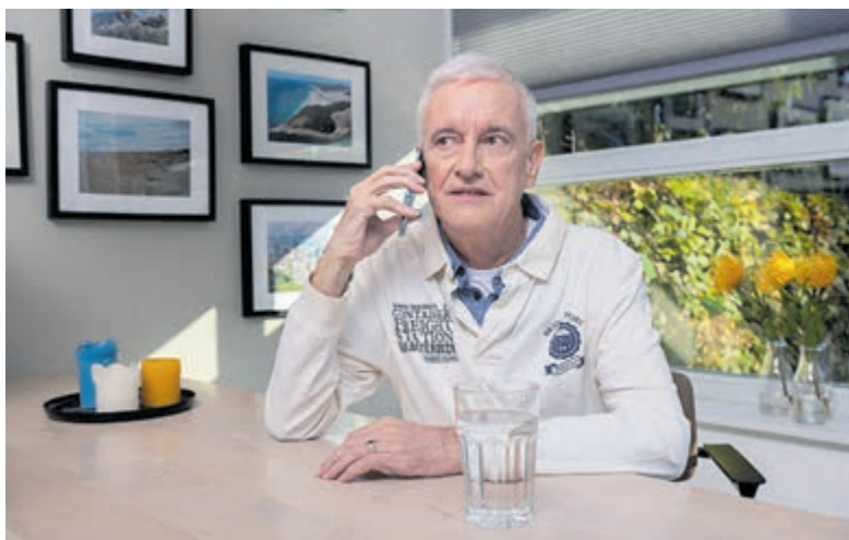
Ouderen bang slachtoffer te worden van online fraude.

Uit het onderzoek blijkt verder dat 11% van de ouderen al eens is opgelicht op internet. Bijvoorbeeld door phishing, WhatsApp-fraude, bankfraude of aankoopfraude. Van hen wist 20% niet wat ze moesten doen nadat zij waren bedrogen. En maar liefst 28% van de gedupeerden vond zelfs dat het zijn/haar eigen schuld was. Ook worstelt bijna een derde van de slachtoffers van online fraude met een gevoel van schaamte.