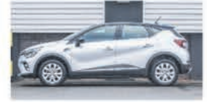
Renault Captur 1.6 Hybrid Intens € 28.950,-