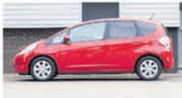
Honda Jazz 1.4 Hybrid Elegance € 11.700,-