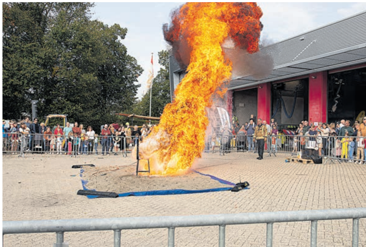
De demonstratie ‘vlam in de pan’ trok veel bekijks op de Open Dag.

tijdens de demonstratie water over de brandende frituurpan werd gegooit, wat een metershoge vuurzee veroorzaakte. Ook werd met een oorverdovende knal duidelijk dat zelfs een (klein) campinggasflesje dat te heet wordt, een flinke explosie en vuurzee veroorzaakt.