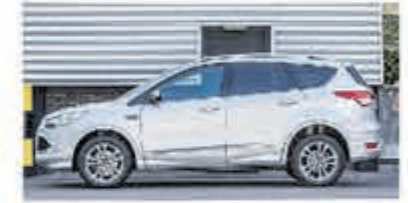
Ford Kuga 1.6 Titanium Pl. 4WD € 16.950,-