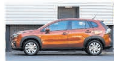
Suzuki S-Cross 1.4 B.jet Comfort SH € 28.950,-