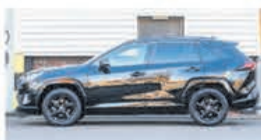
Toyota RAV4 2.5 Hybrid AWD Enrg+ € 37.900,-