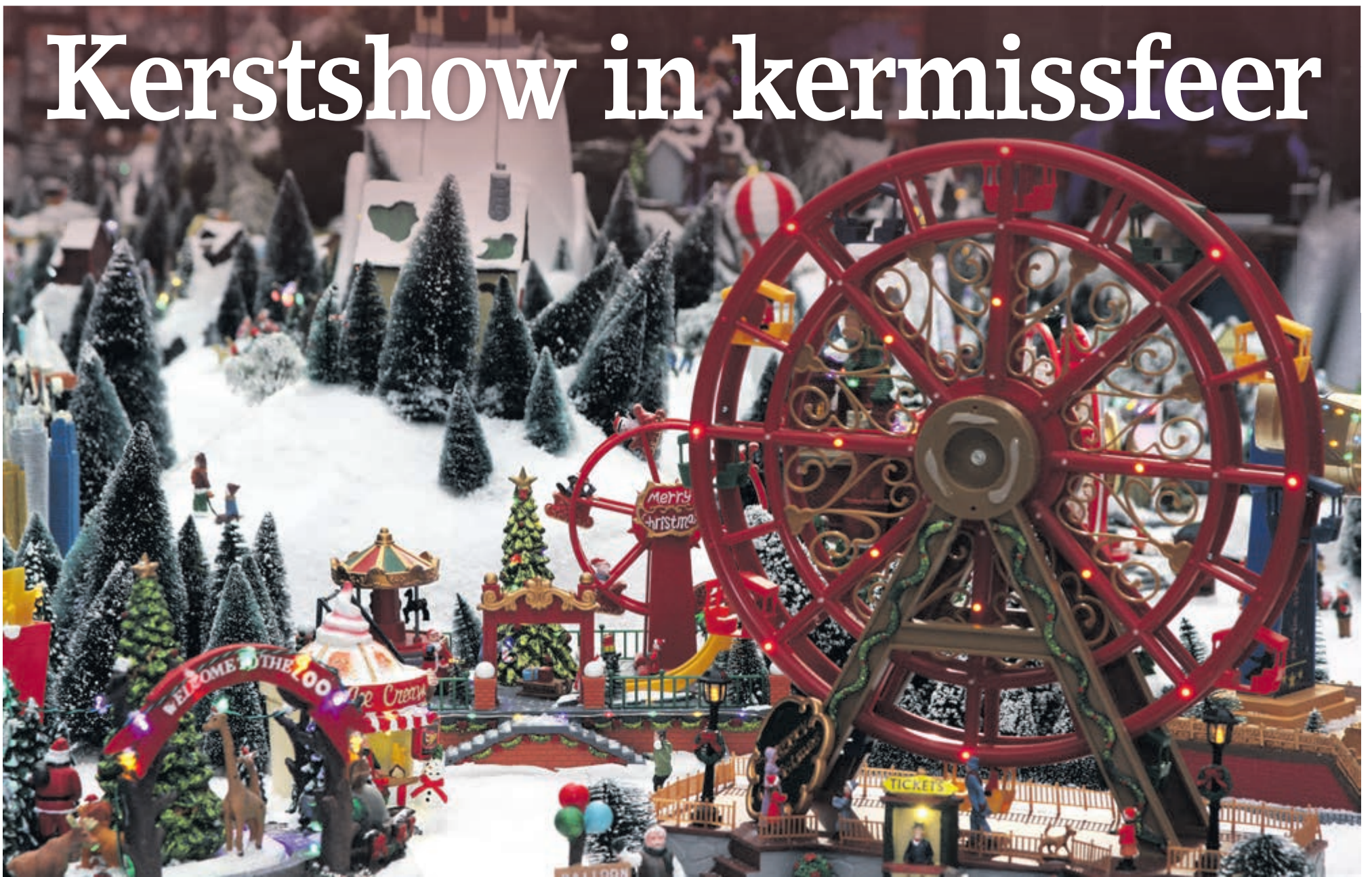
■ In het kerstdorp wordt kermis gevierd.