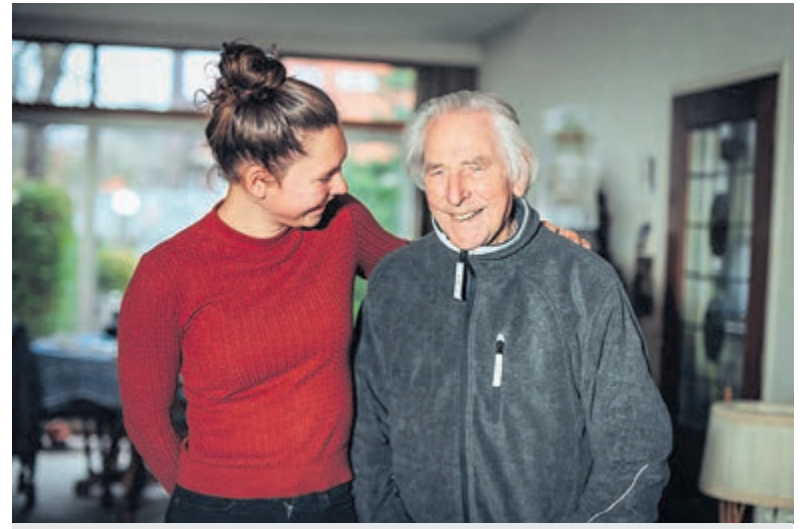
Werken in de zorg is leuk en betekenisvol werk

Voor zij-instromers geldt, dat je met mbo instroomt op ons mbo 3-werken leertraject tot Verzorgende IG: dus tijdens je opleiding word je betaald en ben je meteen in de praktijk bezig. Zorgbalans was een van de eerste zorgorganisaties die zo'n omscholingstraject aanbod. Twee keer per jaar kunnen mensen instromen. Om dit kenbaar te maken staan we regelmatig op banenmarkten. Eveneens onderhouden we samenwerkingen met het NOVA-college en opleider OPPstap om het werken in de zorg te promoten. We zijn ook online zichtbaar met wervingscampagnes op vacaturesites en social mediakanalen. Er zijn op ons Youtube-kanaal veel video's te vinden over werken bij Zorgbalans. Kijk daar gerust eens op om een indruk te krijgen en wie weet word jij ook enthousiast om bij ons te komen werken. Zorgbalans biedt eveneens mogelijkheden voor vakantiewerk, stages en studenten om een kijkje in onze keuken te nemen. Tevens bieden we al zes jaar een oriëntatiebaan aan in locatie de Houttuinen. Hiervoor kun je drie keer per jaar instromen en 3 maanden meelopen. Je dient hiervoor minimaal 16 uur in de week beschikbaar te zijn. Klik het na die