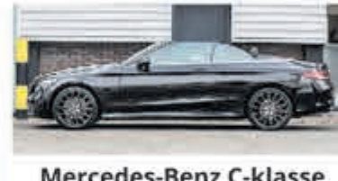
Mercedes-Benz C-klasse 220 d Cabrio Premium Pack € 39.900,-