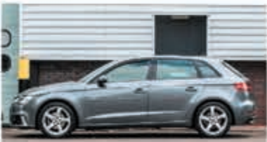
Audi A3 Sportback 35 TFSI CoD ProL. € 25.900,-