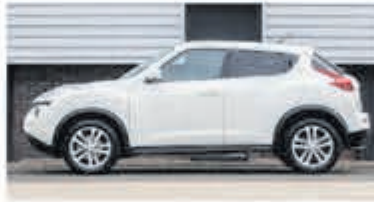
Nissan Juke 1.6 Acenta € 10.900,-