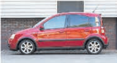
Fiat Panda 1.4 16V Sport € 4.950,-