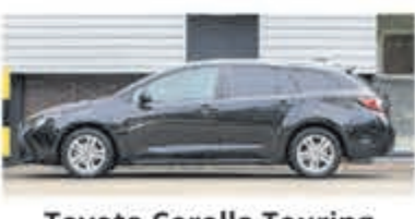
Toyota Corolla Touring Sports 1.8 Hybrid Active € 26.900,-