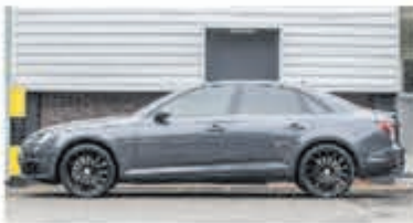
Audi A4 Limousine 2.0 TDI Sport L. Ed. € 19.850,-