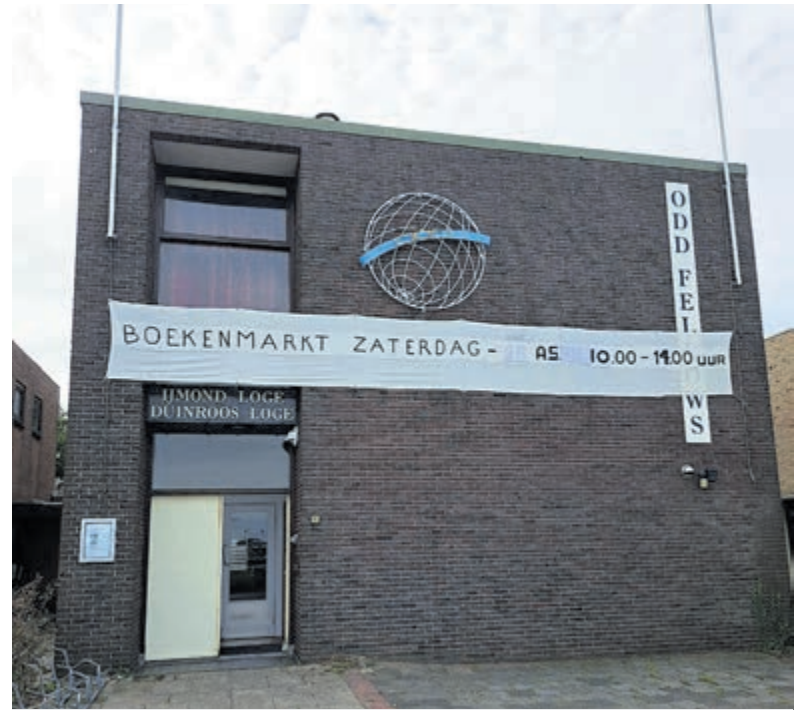
Het logegebouw met spandoektekst: Boekenmarkt zaterdag a.s.

Velsen-Zuid - Op zaterdag 14 oktober a.s. tussen 10-14 uur houden de Odd Fellows van Velsen weer een boekenmarkt in hun verenigingsgebouw aan de Stationsweg 95 in Velsen-Zuid. Parkeren kan in de naaste omgeving, o.a. op de parkeerplaats op de hoek met de Min. Van Houtenlaan. De voorraad boeken wordt steeds aangevuld met kwalitatief goede boeken en daardoor vinden deze bij velen gretig aftrek. Voor een spotprijze zijn de meeste boeken te koop. Een bijzonder boek is wat hoger geprijsd. De Odd Fellows van Velsen rekenen op veel bezoekers.