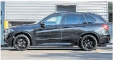
BMW X5 XDrive40e M Sp. Ed. € 54.900,-