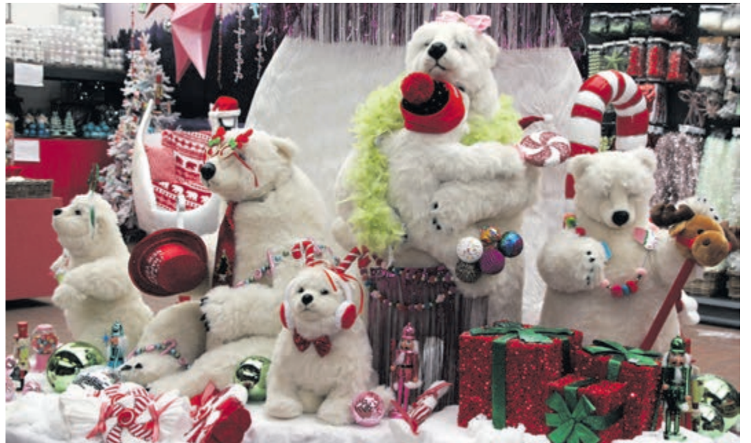
■ Vrolijke beertjes met verrassende kerstcadeaus.