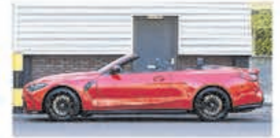
BMW 4-serie Cabrio M4 xDrive Competit € 159.000,-