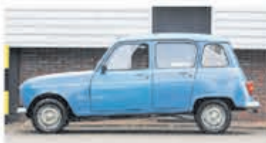
Renault R 4 R 4 € 4.950,-