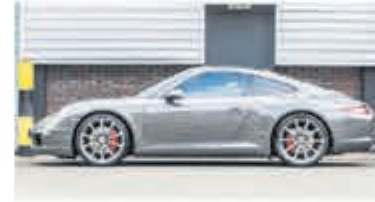
Porsche 911 3.8 Carrera S € 84.900,-