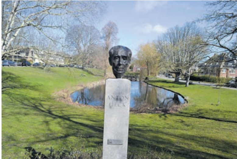
Een beroemde Bloemendaler was Anton Pieck.

een keuze die zij aan het college van B&W voorleggen. Op 1 maart 2024 – Nationale Complimentendag – wordt de Bloemendaler van het Jaar door de burgemeester in het zonnetje gezet.