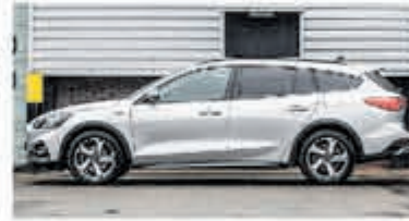
Ford Focus Wagon 1.0 EcoB. Tit. Bns € 24.900,-