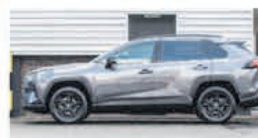
Toyota RAV4 2.5 Hybrid Dynamic € 36.900,-