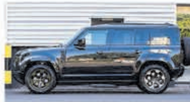
Land Rover Defender 2.0 P400e 110X SE € 99.999,-