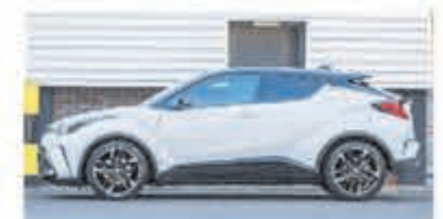
Toyota C-HR 2.0 Hybrid Bns GR S € 32.700,-