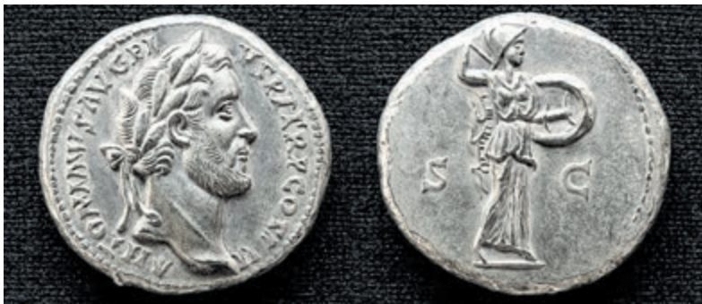
Oude Romeinse munten.

Dit is een excursie in het Nationaal Park Zuid-Kennemerland. Verzamelen 10 minuten voor aanvang: Bezoekerscentrum NP Kennemerduinen Zuid, Zeeweg 12, 2051 EC Overveen. Reserveren/aanmelden via www.np-zuidkennemerland.nl . Informatie: di. t/m zo. via tel. 023-5411123.