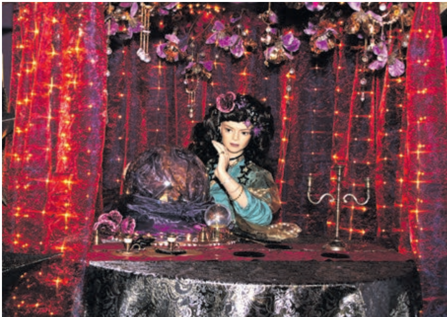
■ De waarzegster kijkt in haar kristallen bol.

Mystery Moon is het thema dat je meevoert naar mysterieuze steden als Marrakesh. Goud, zwart en paars zijn hier de kleuren. Kinderen kunnen er op de foto in een vliegende slee. Een waarzegster tuurt in een glazen bol en ziet het verloop van de kerstdagen. Aan de sfeermakers die op de kerstshow van 3.000 vierkante meter te vinden zijn zal het niet liggen, weet het kersteam heel zeker. "Vanaf het opzetten van de boom tot en met de feestelijk gedekte tafel, we hebben geprobeerd een totaalbeleving te creëren zodat mensen inspiratievol naar huis gaan."