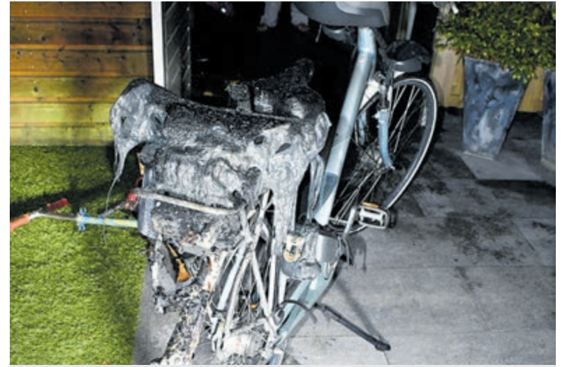
Gesmolten fietsaccu door brand.