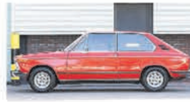
BMW 2002 1802 Touring € 14.950,-