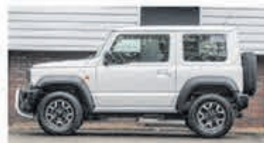
Suzuki Jimny 1.5 Stijl € 36.950,-