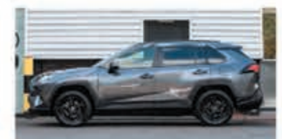
Toyota RAV4 2.5 Hybride Style! € 42.950,-