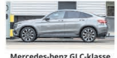
Mercedes-benz GLC-klasse Coupe 250 4MATIC Premium € 49.950,-