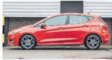
Ford Fiesta 1.0 EcoB. Active € 17.900,-