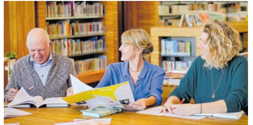
Verdiep je in geschiedenis met de leesclub. Foto aangeleverd.

Meer informatie over de leesclubs van Senia is te vinden op: www.senia.nl .