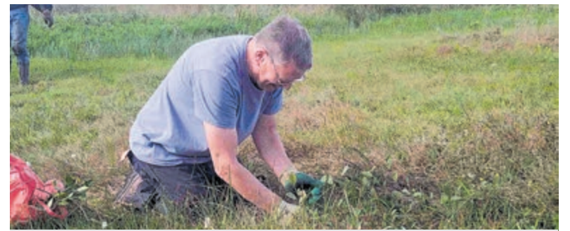
Werkdag in het Spaarnwouderveen.

Toegang €15,-, kinderen €7,-. Meer informatie: www.dekapel-bloemendaal.nl.