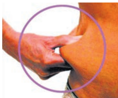
LaRiva helpt gewicht en figuur te behouden.

Trainen is heel effectief voor het behoud van spierkracht, het stroomlijnen van je lichaam, reduceren van stress, beter slapen en het verliezen van (overtollige) kilo's maar ook om neerslachtigheid tegen te gaan. Met een intensief en persoonlijk programma begeleidt LaRiva de dames om middels een natuurlijke en gezonde manier aan de slag te gaan tijdens de overgang. Dit kan zijn met krachttraining met behulp van Bodytec, sporten in de warmtecabine of voedingsadvies. Kennismaken of meer informatie: kijk op www.lariva.nl of kom langs LaRiva, Raadhuisstraat 27, 2101 HC Heemstede of bel: 023 547 44 19.