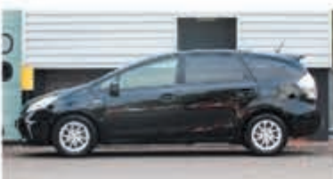
Toyota Prius Wagon 1.8 Aspiration 96g € 16.700,-