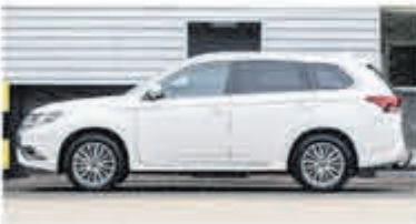
Mitsubishi Outlander 2.4 PHEV S-Edition € 30.750,-