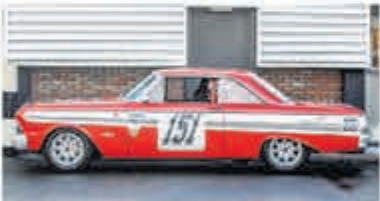
Ford Usa Falcon FUTURA SPRINT € 79.000,-