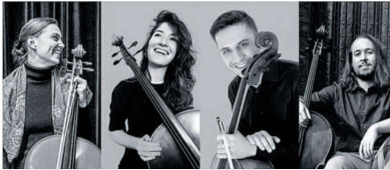
Het Alma Sola Quartet.