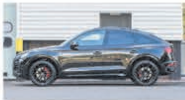
Audi Q5 Sportback 55 TFSI e S edition € 79.950,-