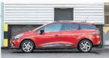
Renault Clio Estate 1.2 TCe Zen. € 15.950,-