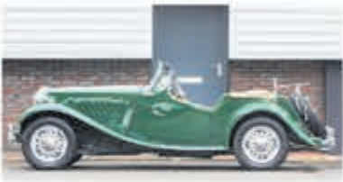
MG TD Roadster € 28.950,-