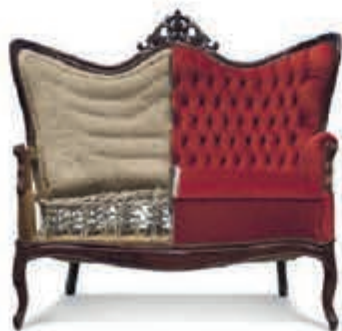
Meubelstofferen voor en na.

Klinkt goed? Dat vraagt om een nadere kennismaking. Ambachtelijke Meubelstoffeerderij Joseph Wolters is al 25 jaar specialist in herstoffering van alle soorten meubels. Wolters gebruikt hiervoor