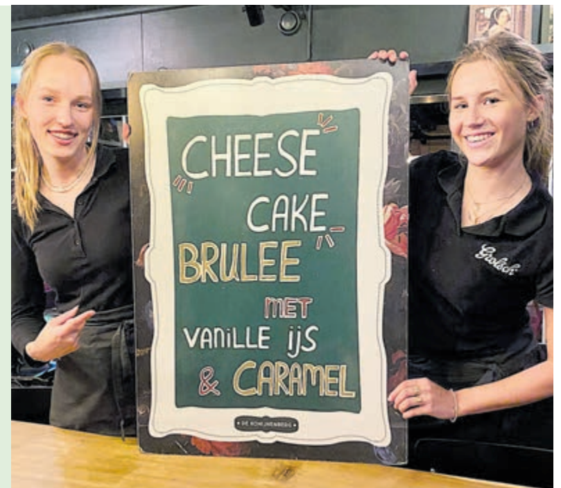
De herfst is altijd een weergaloos lekker seizoen bij De Konijnenberg, zoals deze desserts. Foto aangeleverd.

Restaurant De Konijnenberg, Herenweg 33 Heemstede, 023-5848096, www.dekonijnenberg.nl