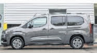
Toyota PROACE Verso CITY 7 pers. 1.2 T Act. Long 7p € 36.134,- excl. btw