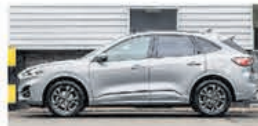
Ford Kuga 1.5 EcoB. ST-Line € 41.950,-