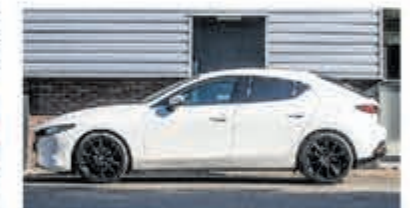
Mazda 3 2.0 SkyActiv-X € 28.750,-