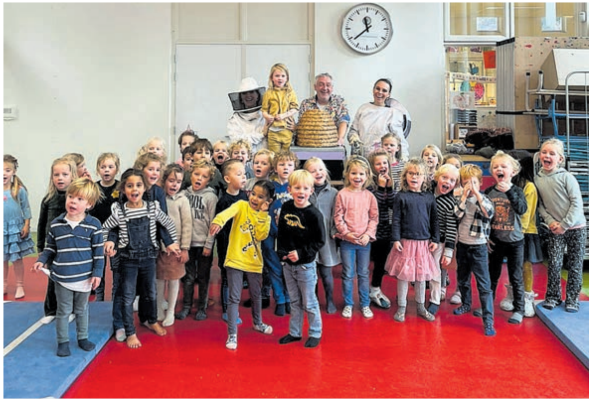
Op de Sparrenboschool in Bennebroek. Foto's aangeleverd.