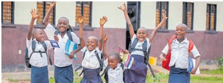
Blijde schoolkinderen.