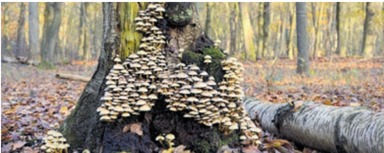
Herfstig Leyduin.

Op zondag 16 oktober van 14.00 tot 15.30 uur geeft de boswachter een speciale excursie over wat dieren zoal eten. Startpunt: parkeerplaats van Buitenplaats Leyduin bij Informatiecentrum De Kakelye aan de Woestduinweg 4 in Vogelenzang. Reserveren is noodzakelijk. Volwassenen €7,-, kinderen €3,-. Beschermers krijgen korting. Aanmelden voor deze, en andere excursies gaat via: www.gaatumee.nl .