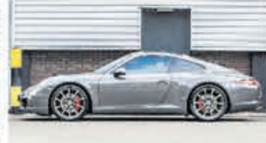
Porsche 911 3.8 Carrera S € 84.900,-