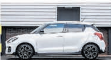
Suzuki Swift 1.4 Sport Sm. Hyb. € 22.950,-