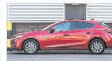
Mazda 3 2.0 S.A. 120 TS € 22.900,-