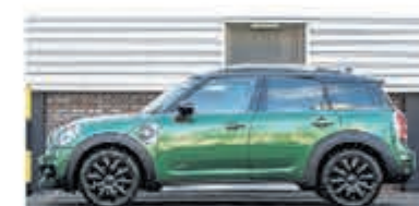
Mini Countryman 1.5 Co.S E ALL4 Chil € 37.900,-