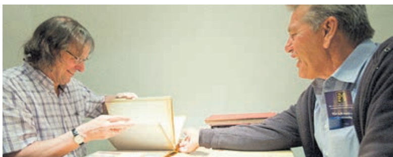
Heeft u nog artikelen van waarde die u wilt laten taxeren? Foto aangeleverd.

Om die vraag te beantwoorden, houdt Heritage Auctions Europe in Bloemendaal een gratis taxatiedag op dinsdag 18 oktober. Wie deze dag