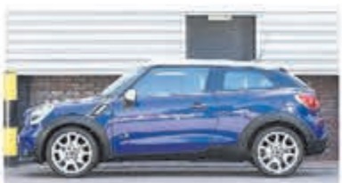
Mini Paceman 1.6 Cpr S ALL4 Chili € 12.950,-