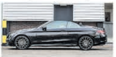
Mercedes-benz C-klasse 220 d Cabrio Premium Pack € 44.900,-