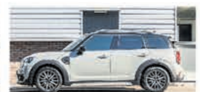
Mini Countryman 2.0 Cooper D € 17.950,-