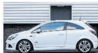
Opel Corsa 1.4-16V Cosmo € 8.950,-