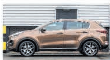
Kia Sportage 1.6 T-GDI 4WD GT-L. € 25.750,-