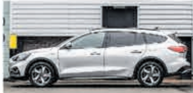
Ford Focus Wagon 1.0 EcoB. Tit. Bns € 27.900,-