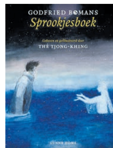
Sprookjesboek van Godfried Bomans met illustraties van Thé Tjong-Khing, hij is aanwezig op 21 oktober.

Reserveren en info via: info@boekhandelblokker.nl of 023-5282472.