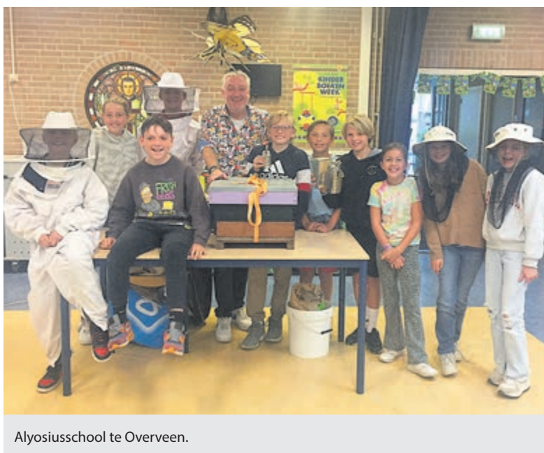
Aloysiussschool te Overveen.

"Het was weer leuk om de kinderen het belang van (wilde)bijen uit te leggen. Zonder bijen zijn de schappen in de winkels grotendeels leeg", aldus Pim. Aan het eind van de gastlessen mochten alle kinderen van de honing snoepen, zich verkleden als