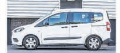
Ford Tourneo Courier 1.0 Titanium € 14.950,-