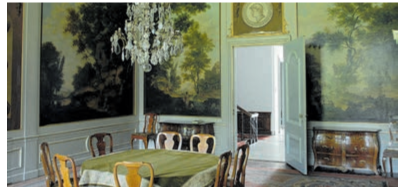
Binnenkijken in Huis te Manpad.

Informatie en kaarten: www.podiaheemstede.nl . Plaats: Oude Kerk, Heemstede Datum: zaterdag 15 oktober 20.15 u.