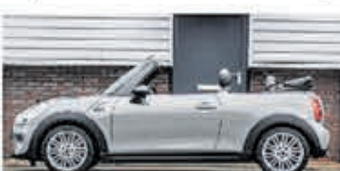
Mini Cooper Cabrio 1.5 C. Chili S. Bns € 25.900,-