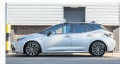
Toyota Corolla 2.0 Hybrid Dynamic € 26.950,-