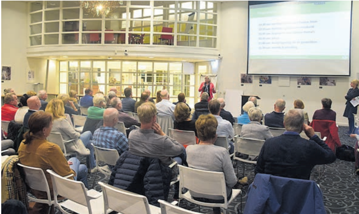
Redelijk gevulde zaal meedenkers voor de Woonvisie.