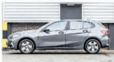
BMW 1-serie 116d Sp.Line Edition € 27.950,-