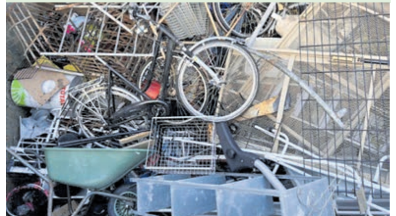
Milieustraat Overveen. Foto aangeleverd.