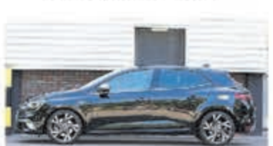
Renault Megane 1.6 TCe GT € 21.950,-