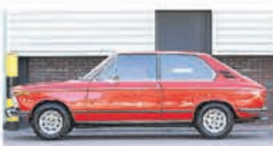
BMW 02-serie 1802 Touring € 14.950,-