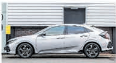
Honda Civic 1.5 i-VTEC Sport + € 22.900,-