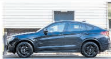
BMW X4 xDrive28i High Exec. € 39.950,-