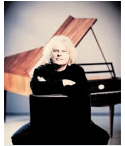
Ronald Brautigam.

Ronald Brautigam ontving in 1984 de Nederlandse Muziekprijs, maar was ook toen al bezig met een internationale carrière; als solist met alle grote orkesten en dirigenten waaronder het London Philharmonic Orchestra, het Freiburger Barockorchester en het Koninklijk Concertgebouworkest. Inmiddels heeft hij meer dan 60 Cd's gemaakt met onder meer het complete oeuvre voor piano van Mozart, Haydn en Beethoven. Opnames waarmee hij diverse hoge cd-onderscheidingen in de wacht heeft gesleept, waaronder twee Nederlandse Edison's, een Franse Diapason d'Or en een Midem Classical Award.