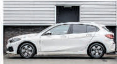
BMW 1-serie 118i € 26.750,-