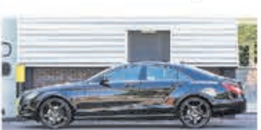
Mercedes-benz CLS-klasse 350 € 21.950,-