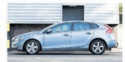
Volvo V40 2.0 T2 Nordic+ € 17.900,-

Turenhout de occasiondealer van Heemstede en al meer dan 40 jaar uw vertrouwde onderhoudsadres.