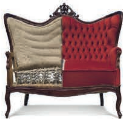
Meubelstofferen voor en na