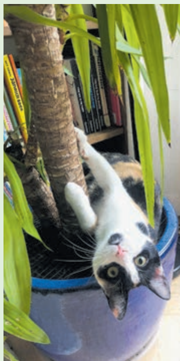
De winnende foto.