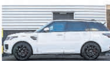
Land Rover Range Rover Sport P400e HSE € 101.950,-