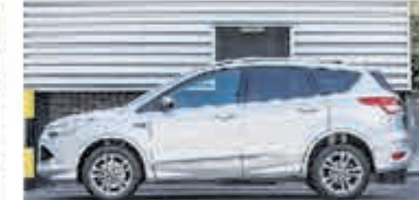
Ford Kuga 1.6 Titanium Pl. 4WD € 18.450,-