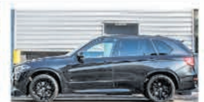
BMW X5 xDrive40e M Sp. Ed. € 58.900,-