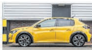
Peugeot 208 1.2 PureTech GT-Line € 25.950,-