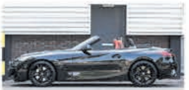
BMW Z4 Roadster sDrive30i Hi. Ex. Ed € 54.950,-