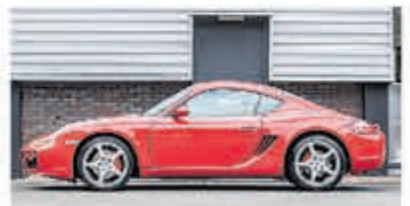
Porsche Cayman S Tiptronic Uniek 76.000 km € 29.950,-