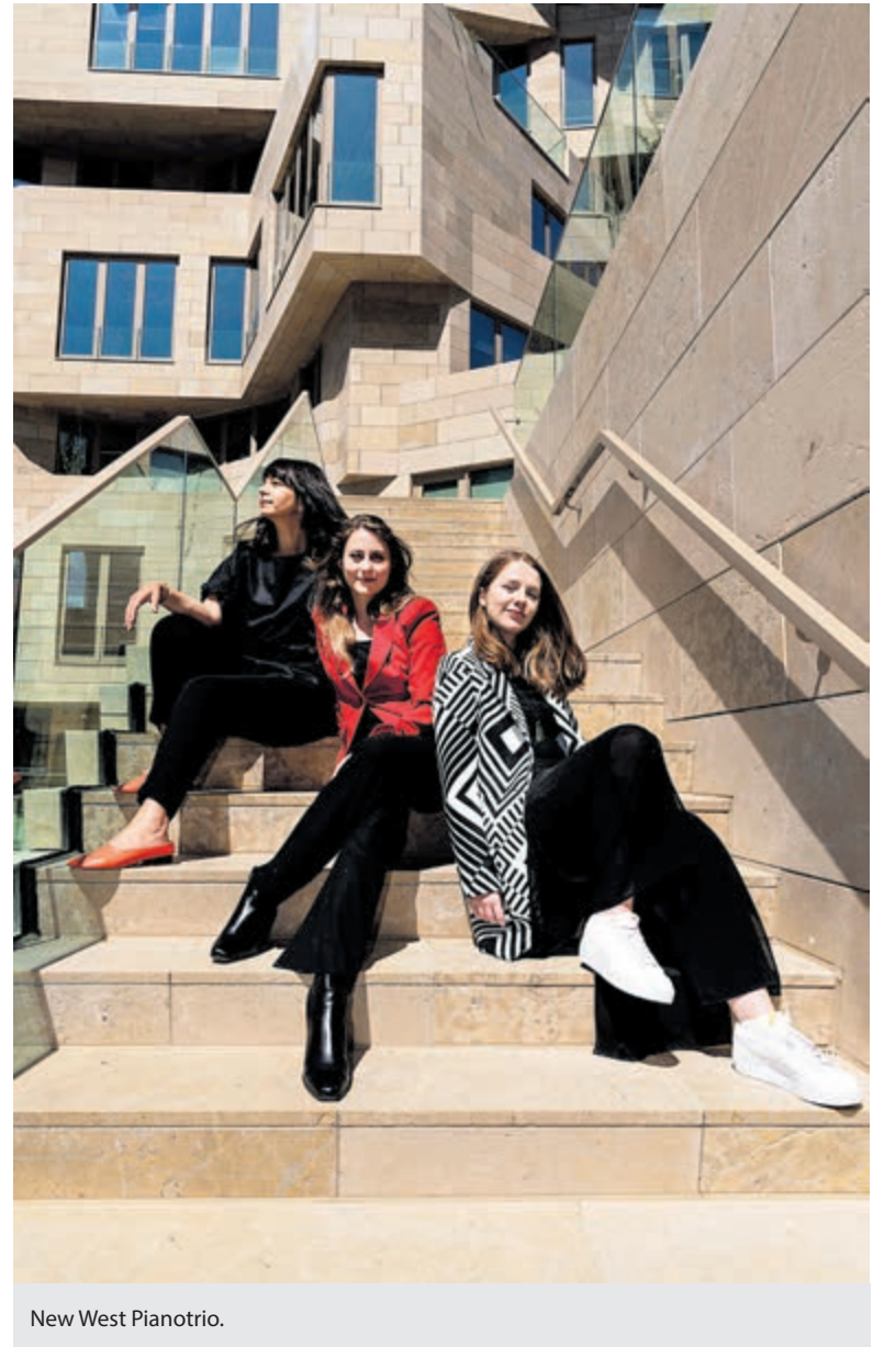
New West Pianotrio.