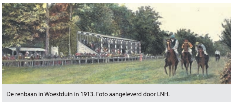
De renbaan in Woestduin in 1913.