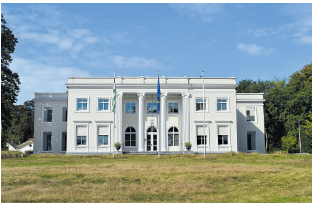
Gemeentehuis Bloemendaal.

Blekersveld terecht zijn gekomen is niet duidelijk. Het Blekersveld wordt momenteel gesaneerd om daar op termijn permanente woningbouw mogelijk te maken.