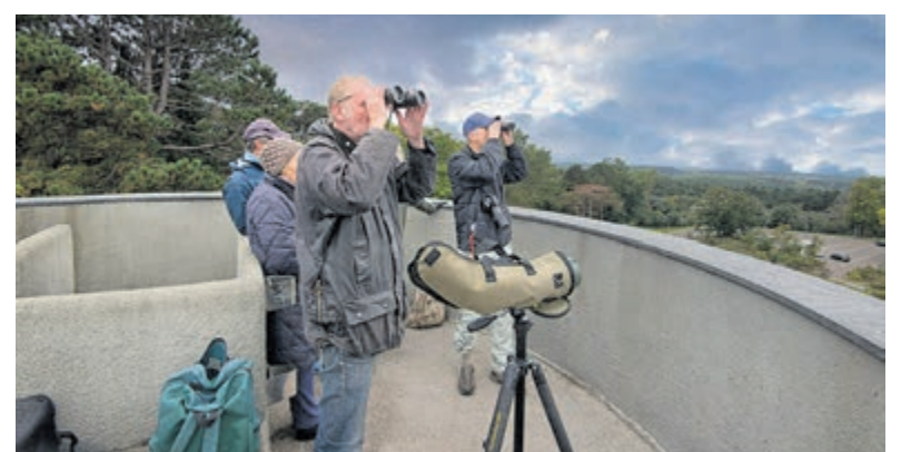
De Vogeltrek observeren op 't Kopje van Bloemendaal.

Locatie: Koningin Wilhelminatoren, op 't Kopje van Bloemendaal, aan de Hoge Duin en Daalseweg 6 in Bloemendaal.