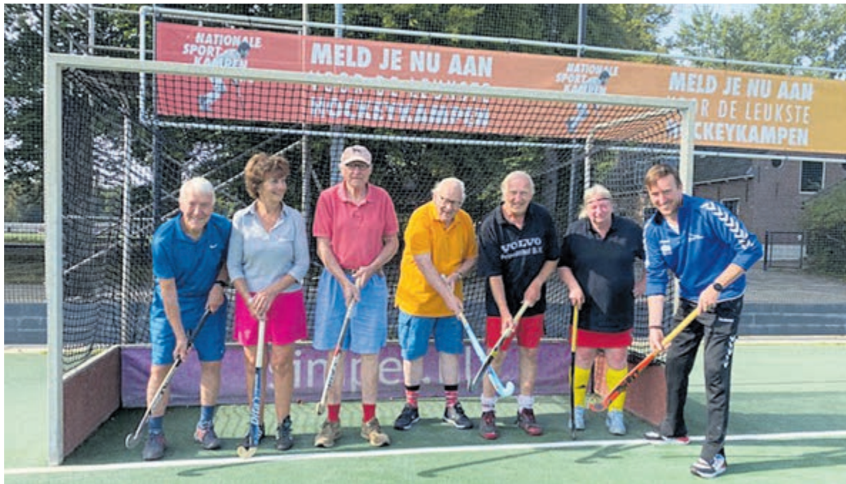
Op het terrein van HBS aan de Bergweg in Bloemendaal staat iedereen klaar voor de warming-up.