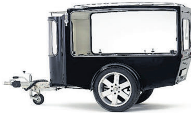
Rouwcaravan.

Jessica IJzer Uitvaartverzorging staat al meer dan tien jaar op de jaarmarkt met andersoortig rouwvervoer: een VW-busje, een Harley Davidson