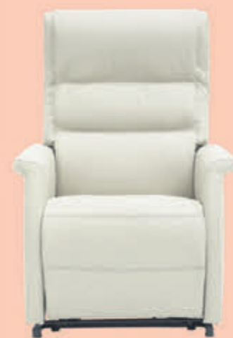
BIJ ONS v.o. 1399,-