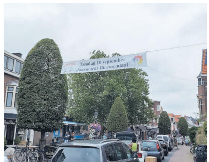
Winkelcentrum Bloemendaal.