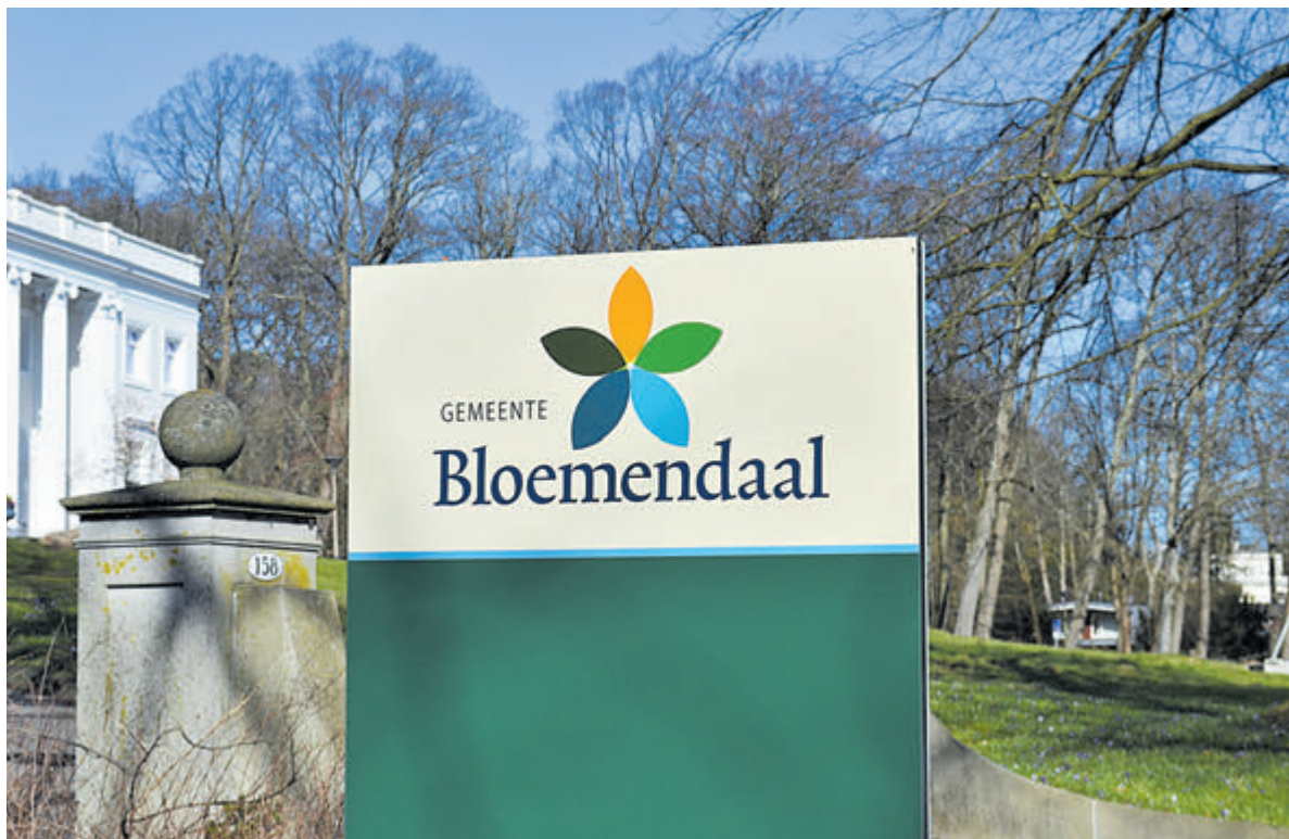
Gemeentehuis Bloemendaal.