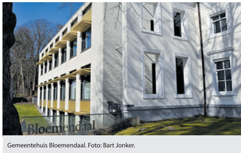
Gemeentehuis Bloemendaal.