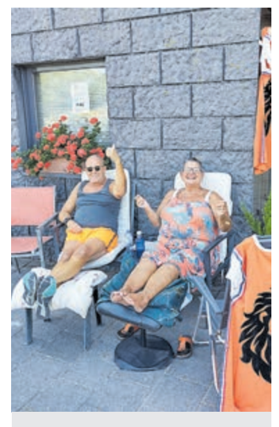
De familie Bakker geniet van de feestvreugde.