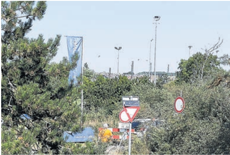
Motorgeronk was goed te horen tijdens de races.