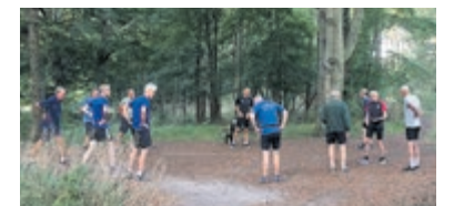
Trimmen met E.M.W.G.

Zaterdag 3 september heeft trainer Gerald Garrelts, die al 20 jaar de trainer van de club, alle clubtrimmers weer flink onder handen genomen met allerlei rek- en strekoefeningen, duurloopjes, looptraining, enz. Afsluitend was er een balspel. Elke zaterdagmorgen traint de club tussen 8 en 9 uur in Groenendaal en genieten niet alleen van het lekker bewegen, maar ook van de heerlijke natuur. Op dit moment telt de club