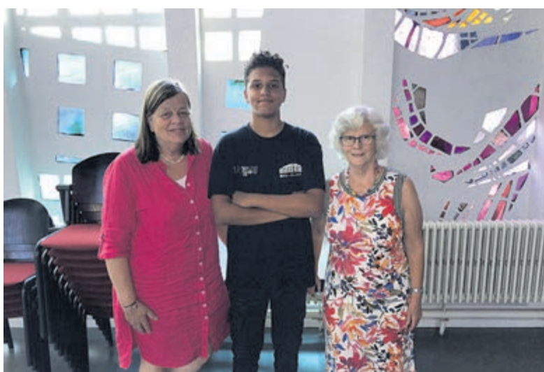
Een goede start is het halve werk bij HJF huiswerkbegeleiding.

te voorkomen is tijdig ingrijpen nodig. Gun uw kind een goede start, daar heeft het een schooljaar lang plezier van! Bel voor verder informatie met Hedwig Jurrius, 0f-46577776.