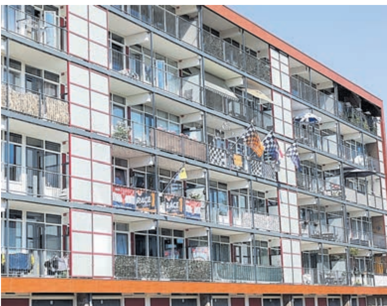
Flatgebouw in Zandvoort uitgedost in de feeststemming van de Grand Prix.