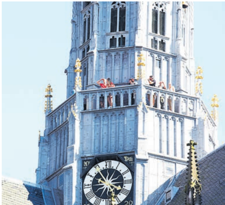
Grote of Bavokerk in Haarlem.

Ook is er een programmaboekje met daarin alle informatie over deelnemende monumenten, themateksten en meer achtergrondinformatie. Het gedrukte boekje is verkrijgbaar bij VVV Haarlem en de deelnemende monumenten. VVV Haarlem (Grote Markt 2) is tijdens de Open Monumentendagen hét informatiepunt voor vragen over het programma en tevens voor kaartjes voor een wandeling.