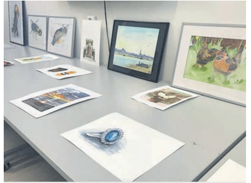
Werken van cusicisten.