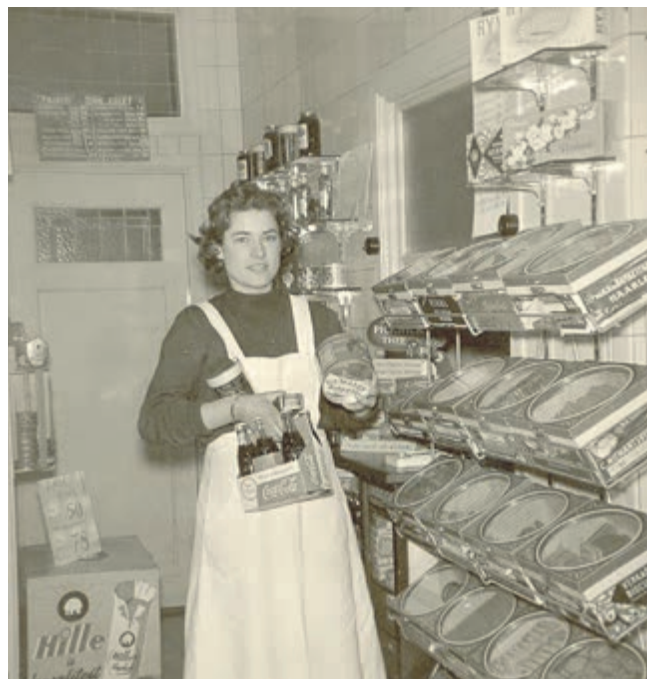
Kruideniers- en reformzaak Kiebert.