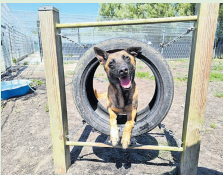
Herders Kai en Stan. Foto's aangeleverd.

Wanneer u gedurende de maand september een herder bij de opvang adopteert, wordt ervoor gezorgd dat u daar een fantastisch starterspakket krijgt: een grote zak voer, stoere 'gear' en natuurlijk een paar hele mooie speeltjes.