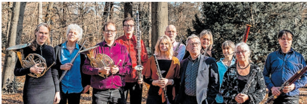
Het Domstad Blazersensemble. Foto aangeleverd.

Na afloop wordt gecollecteerd bij de uitgang om de onkosten te dekken, wat daarvan overblijft is voor het Restauratiefonds van de Oude Kerk. Na afloop is er ook weer gelegenheid elkaar en de musici te ontmoeten en dat is uiteraard weer onder het genot van thee, koffie en zelfgemaakt gebak.