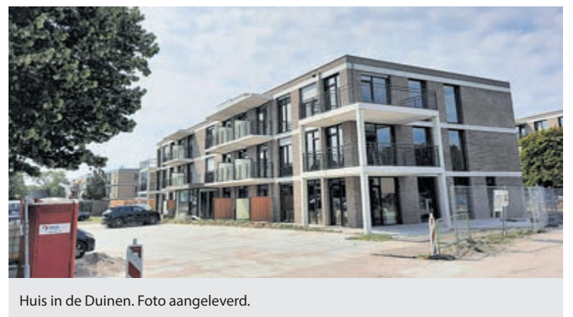
Huis in de Duinen. Foto aangeleverd.