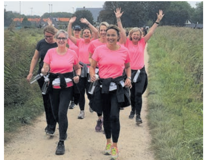
Met gezellig powerwalken bouw je een goede conditie op.

Er starten twee groepen: op dinsdag 20 september om 9