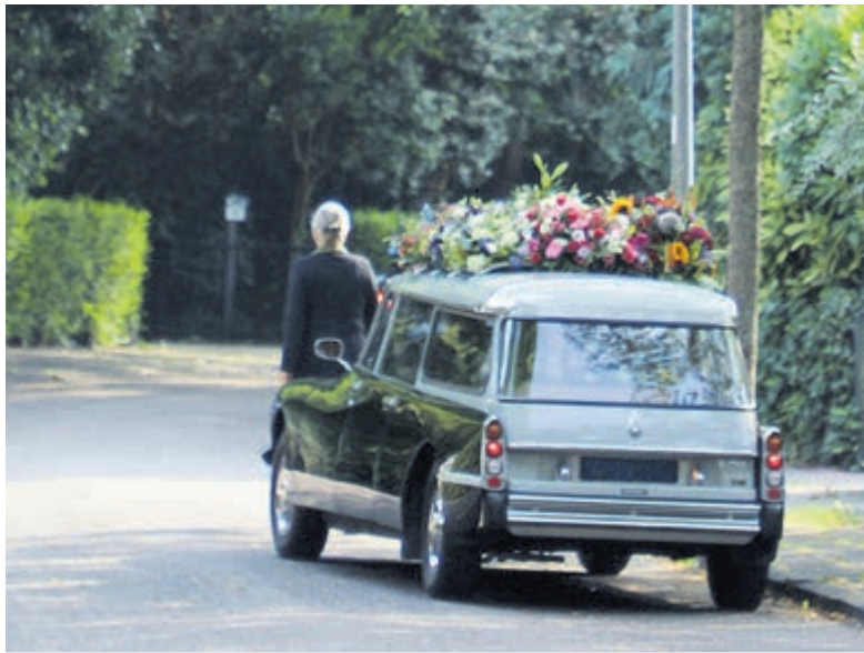
De Citroën DS Break van Uitvaartzorg Jessica IJzer.

Daarbij is er ook vaak veel meer mogelijk dan mensen denken. Een uitvaartverzorger kan je hier goed