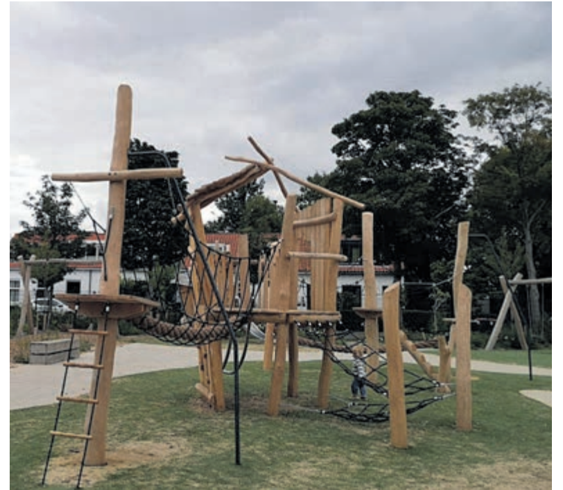
De vernieuwde speeltuin in het Ramplaankwartier.

Kijk op belastingdienst.nl/eigenwoning .