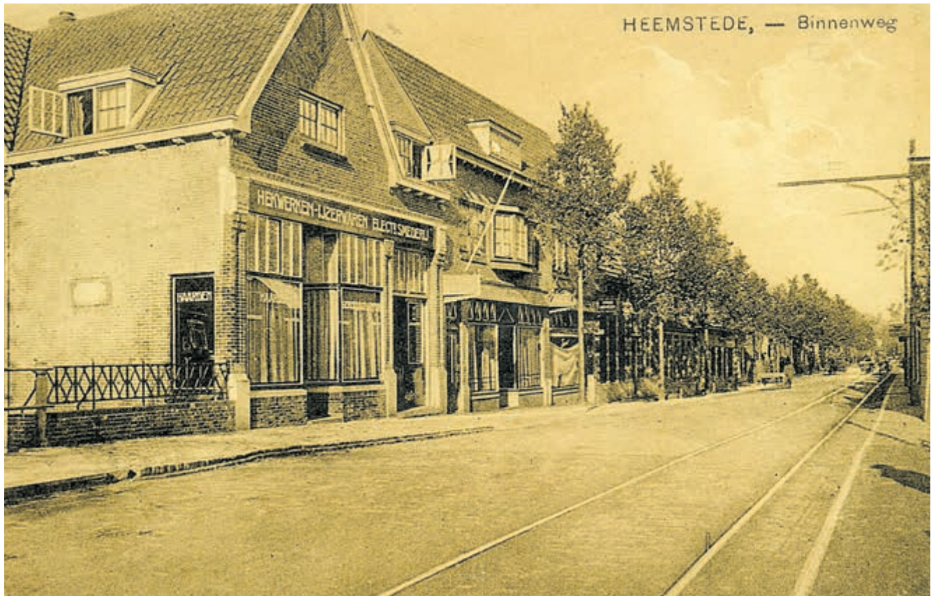
De IJzeren brug.

Het volledige programma is te vinden op www.wch.nl .