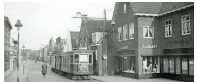
Tram door de winkelstraat.