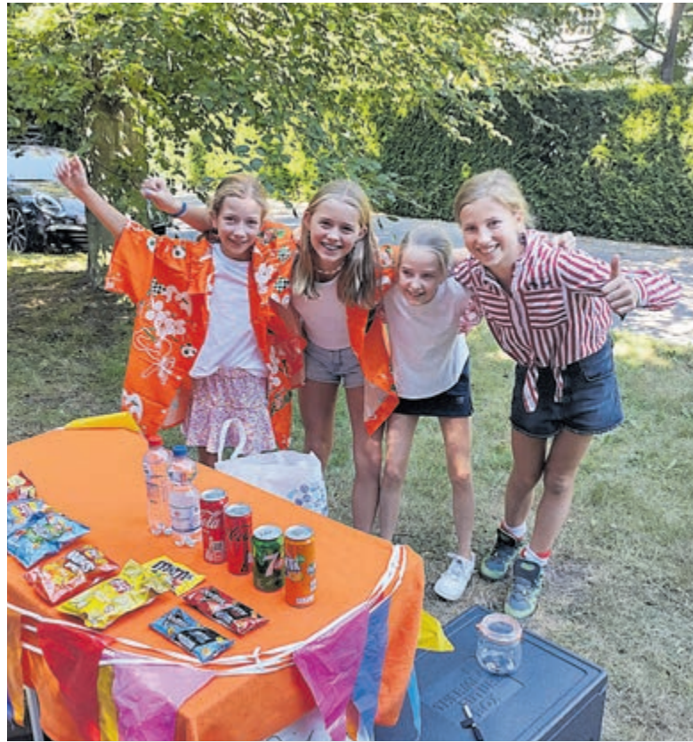
Enthousiaste kinderen met hun ouders bieden versnaperingen en drankjes aan.