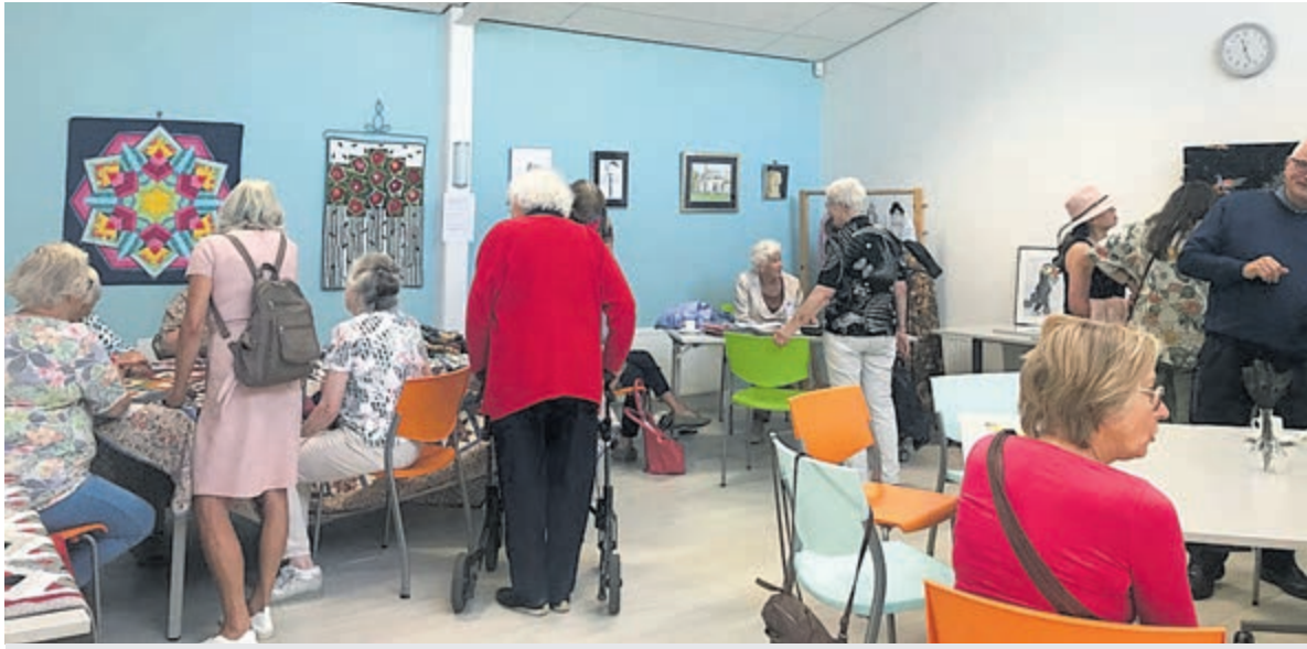
Veel belangstelling voor Open Dag in de Pauwehof.