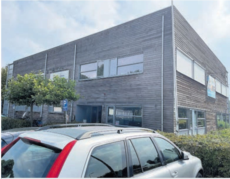
Nieuw Groenendaal.

Heemstede - Nieuw Groenendaal aan de Sportparklaan 18 in Heemstede is deze maand al 20 jaar uw vertrouwde adres voor fysiotherapie en fitness.