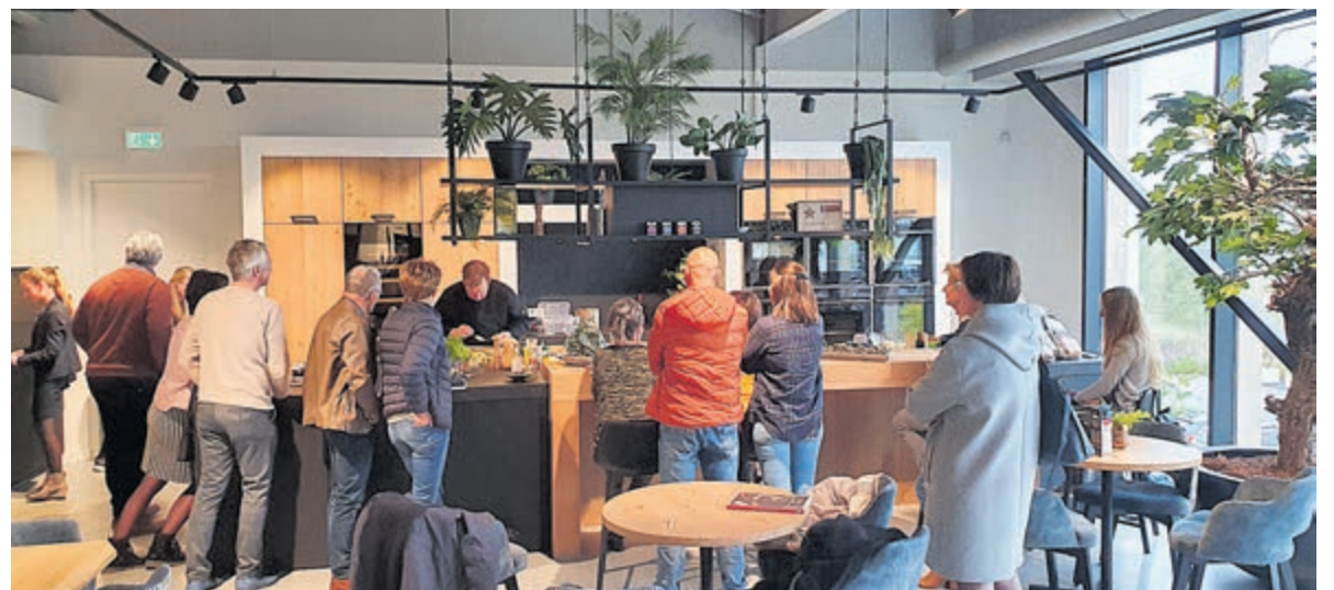
Aandacht voor uw droomkeuken bij DB Keur Keukens.

Naast de VIP-avonden, met extra persoonlijke aandacht voor de aanwezigen, houdt DB Keur Keukens ook een open dag op zaterdag 9 september van 09 tot 17 uur. Deze dag staat in het teken van inspiratie, adviezen, eetkraampjes en