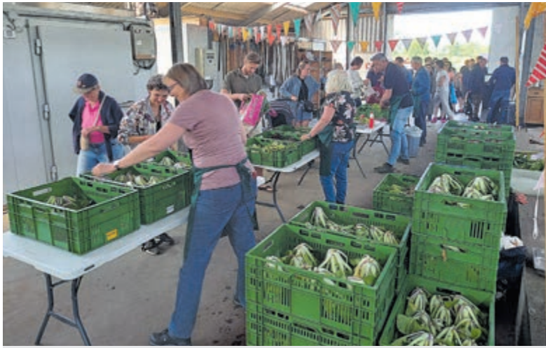
Eerlijk en puur voedsel van de Herenboerderij.