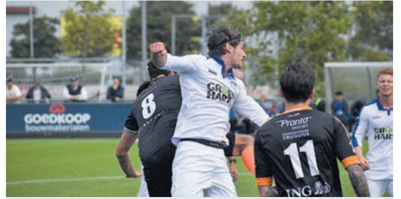
HBC tegen Purmersteijn.

Heemstede - Voor HBC is het nieuwe voetbalseizoen begonnen. Na een kampioenschap is het afwachten hoe het team een klasse hoger presteert. Nieuwe spelers worden ingepast alle tegenstanders zijn nieuw, dus kijkt de aanhang van de club reikhalzend uit naar de eerste paar wedstrijden. Voor de eerste confrontatie ging HBC zondag 27 augustus op bezoek bij Purmersteijn. Coach Jasper ketting van HBC had ervoor gekozen de nieuwe aanwinsten op de reservebank te zetten en speelde in aanvang met vrijwel het elftal van het afgelopen seizoen. Dat pakte niet slecht uit, want de ploeg stond en pakte in het eerste bedrijf Purmersteijn in. Na 3 minuten had Jesse van Loon een kans, maar verloor de bal onderweg naar het doel. Twee minuten later een schot van Van Loon in de handen van de doelman van Purmersteijn. Een minuut later een schot van Arno Dijkstra die via de binnenkant van de paal weer het veld instuutte. Ook Brian Wilderom testte de doelman. Binnen het kwartier had HBC een overwinning al kunnen meenemen naar Heemstede, maar het pakte anders uit. Ondanks alle energie die de spelers in het duel stopten, kwam Purmersteijn stap voor stap terug in de wedstrijd. HBC koos ervoor de bal heel vaak terug te spelen op doelman Bram Verhage. Dat kwam het