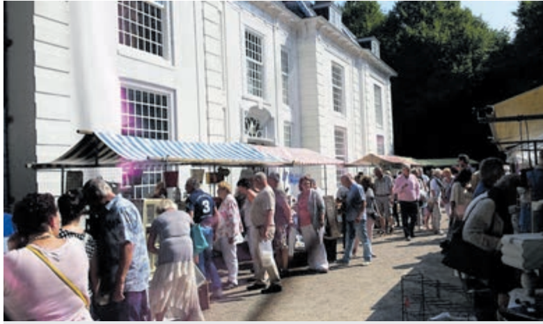
Curiosa, antiek, brocante- en vintagemarkt op Buitenplaats Beeckestijn.

Buitenplaats Beeckestijn, met zijn uitgestrekte tuinen en charmante architectuur, voegt een extra dimensie toe aan deze magische dag. Betreed de wereld van curiosa,