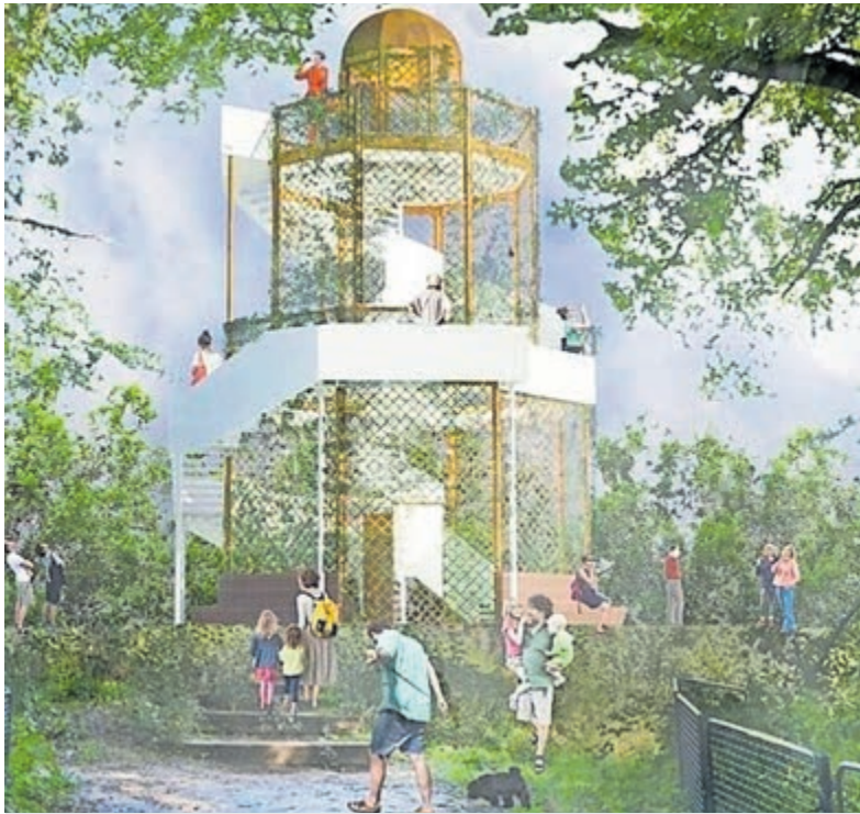
Het ontwerp 'De Wandeling' voor de nieuwe Belvédère. Beeld aangeleverd.