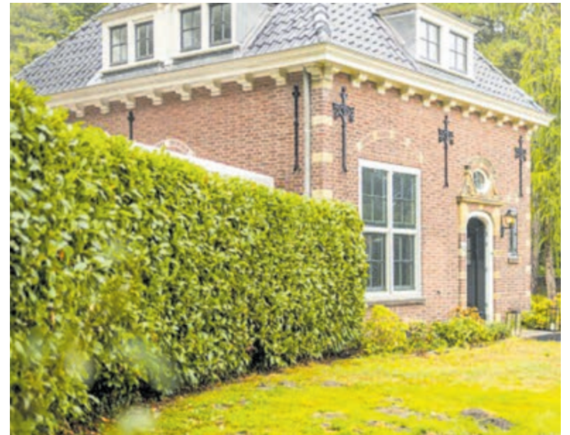
Afscheidshuis Bloemendaal. Foto aangeleverd.

Op www.monuta.nl/open-dag-bloemendaal kunt u meer lezen over de open dag en het programma. Graag tot ziens op zaterdag 9 september!