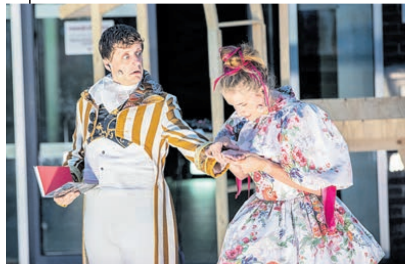
Club Kenau speelt 'Koning van Haarlem'.

termen en kluchtige scènes met een kern van waarheid. Lodewijk Bonaparte maakte zich in de korte tijd dat hij Koning van Holland was inderdaad redelijk geliefd. Hij verdedigde onder meer de Hollandse handelsbelangen tegenover de Keizer en trad vaak op tegen diens instructies. Feiten en fictie wisselen elkaar af, maar dat mag in een luchtige komedie. Af en toe vliegt het uit de bocht, maar soiet, de lach overheerst en is aanstekelijk.