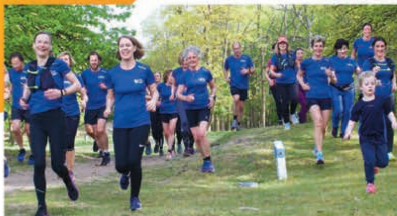
VerjaardagRun van Loopschool Enno.

Deze cijfers zijn gebaseerd op een vragenlijst onder het gemeentepanel van Vereniging Sport en Gemeenten (VSG) in maart 2023. In totaal hebben 110 gemeenten de vragenlijst ingevuld. De verzamelde data hebben we gewogen naar stedelijkheid van de gemeente en vormen een goede afspiegeling van de Nederlandse gemeenten. We voerden het onderzoek uit in opdracht van VSG. Bron: VSG.