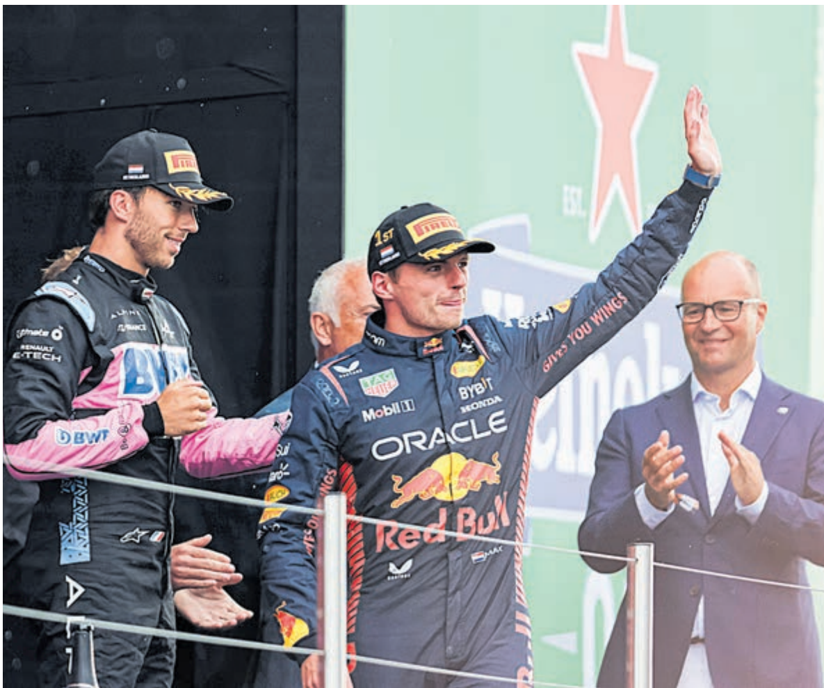
Max Verstappen wederom winnaar.