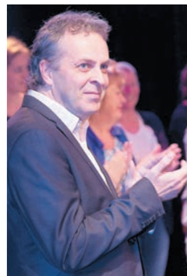
Pianist Frederic Voorn.

sieke zender en schrijft hij artikelen en boeken over pianoliteratuur. Van hem zijn in de loop der jaren vele cd's verschenen waaronder ook één geheel gewijd aan eigen composities.