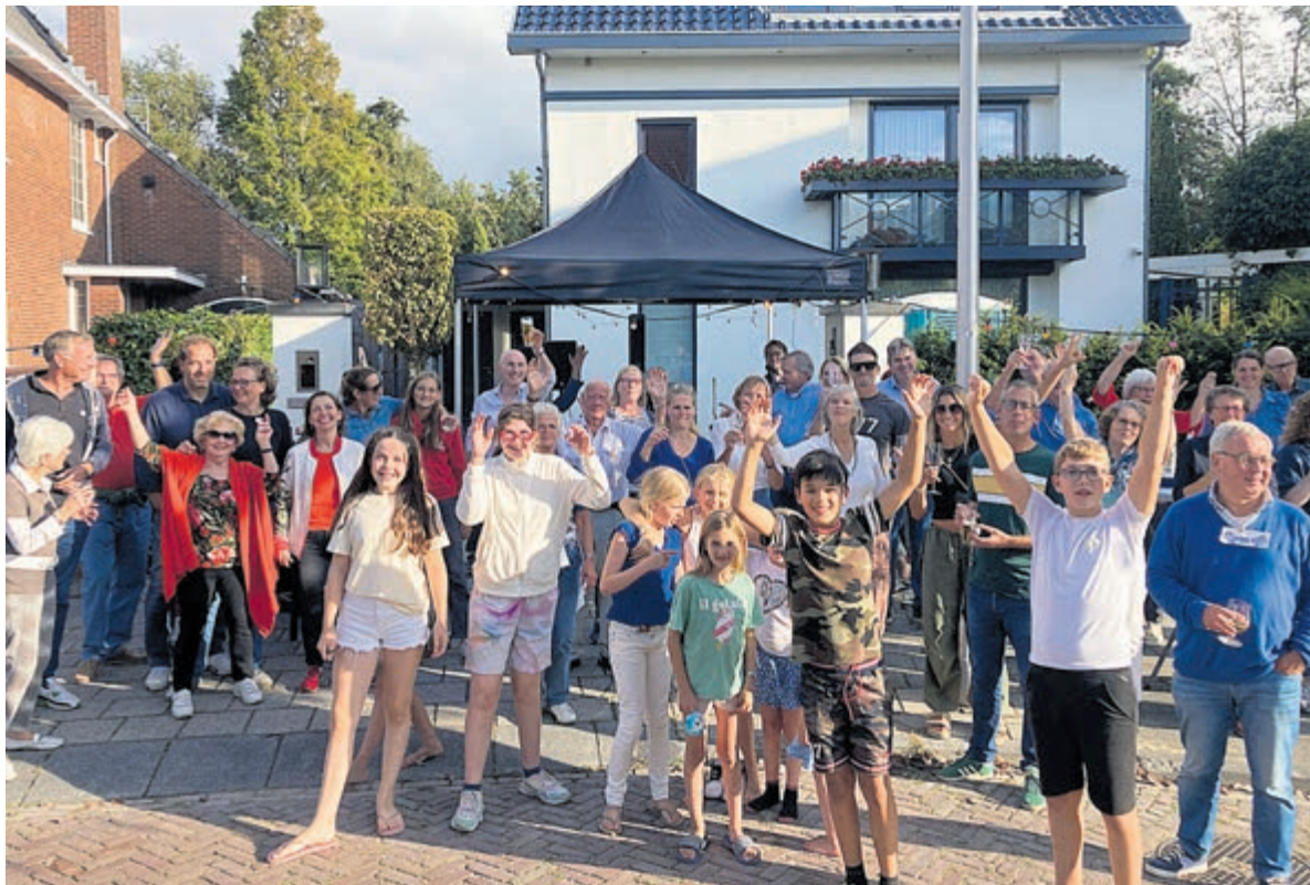
Volop gezelligheid op straatfeest Lorentzlaan.

De bewoners hadden weer speciale lekkere et hapjes en drankjes meegenomen in stijl met het Griekse thema. Het was een sfeervolle feestelijke avond.