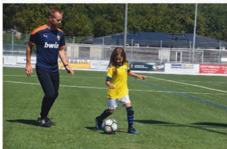
Trainingsdag voor kids.

Voor meer informatie kijk op www.rch-voetbal.nl .