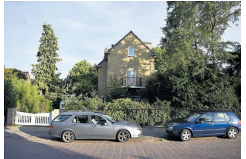
De ambtswoning in Heemstede.

Het alternatief is dat een nieuwe burgemeester zelf een pand aankoopt of huurt en dat er dus geen ambtswoning in Heemstede meer is. De nieuwe burgemeester is wettelijk verplicht in Heemstede te wonen, dus zal de gemeente hem of haar wel enigszins moeten faciliteren bij het kopen/huren van een woning. Omwille van de veiligheid dienen er