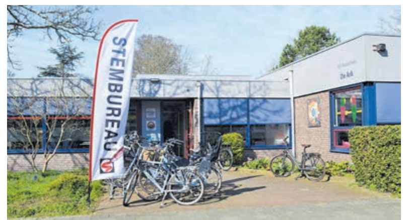
Stembureau op basisschool de Ark.

Ondanks dat partijen het niet ontkenen, loopt Nederland tegen haar grenzen aan wat betreft het aantal inwoners. Jaarlijks een stad als Purmerend (80.000) erbij is niet langer vol te houden. Ook hier botste de coalitie. Het breekpunt was het nareizen van familie van hen die tot Nederland zijn toegelaten. Iedere toegelaten asielzoeker zal een aantal familieleden laten overkomen. In 2023 staat de teller nu al op +/- 6.000 nareizigers. De VVD en het CDA wilden de instroom van familieleden beperken of tenminste ver-