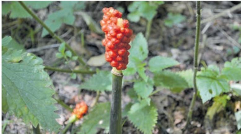
Italiaanse aronskelk in Leyduin.

figuur Aaron deze bloem ontstond. Aronskelken worden graag in siertuinen gehouden. In Nederland komt tevens de gevlekte aronskelk ( Arum maculatum ) voor. De plant is giftig en staat graag halfschaduw. De pijlvormige bloem bloeit in april en mei. Aronskelken zijn verwant aan asperges.