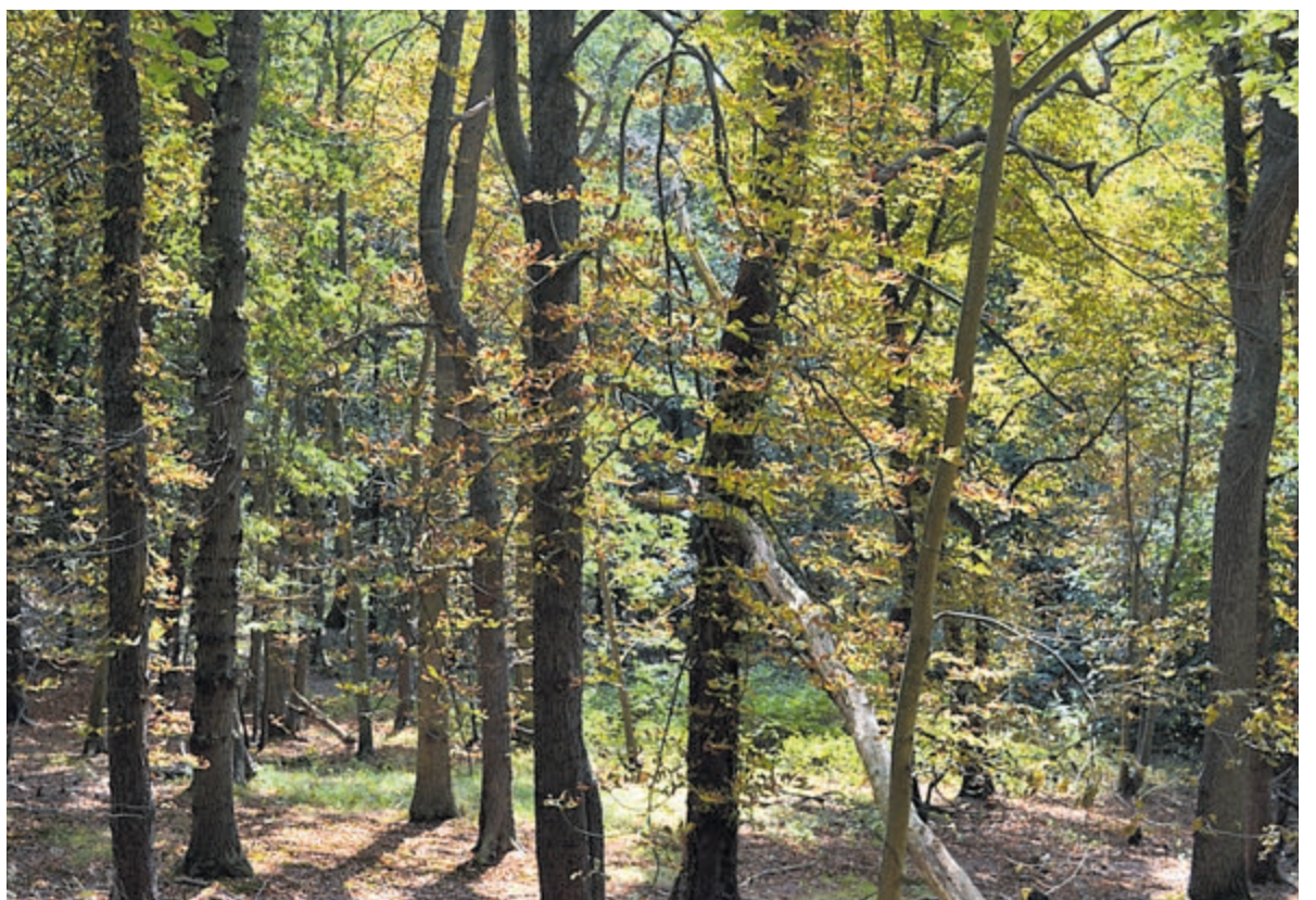
Duidelijk is aan sommige bomen te zien dat de herfst vroeger intreedt door de aanhoudende droogte.

Al met al lijkt het erop dat de natuur zich nu al aan het omkleden is en de herfstmantel aantrekt. De kastanjebomen kleuren als eerste. Dat betekent wel dat we vroeger kunnen genieten van het fraaie palet aan herfstkleuren. En dat in een mooi een zonnig najaarszonnetje, hoewel regenbuien nu echt wenselijk zijn.