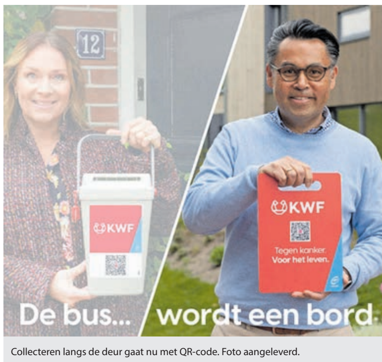
Collecteren langs de deur gaat nu met QR-code. Foto aangeleverd.

Meer informatie over de diverse activiteiten kunt u vinden op de website www.wijheemstede.nl . U kunt natuurlijk ook altijd even bellen om informatie te vragen op tel. 023 – 528 60 22.