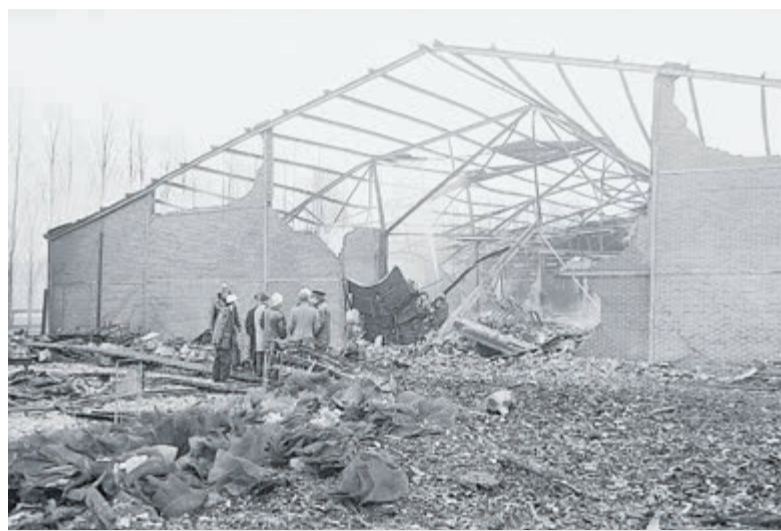
Brand in de Apollo Hal in 1976. Aangeleverde archiefphoto.