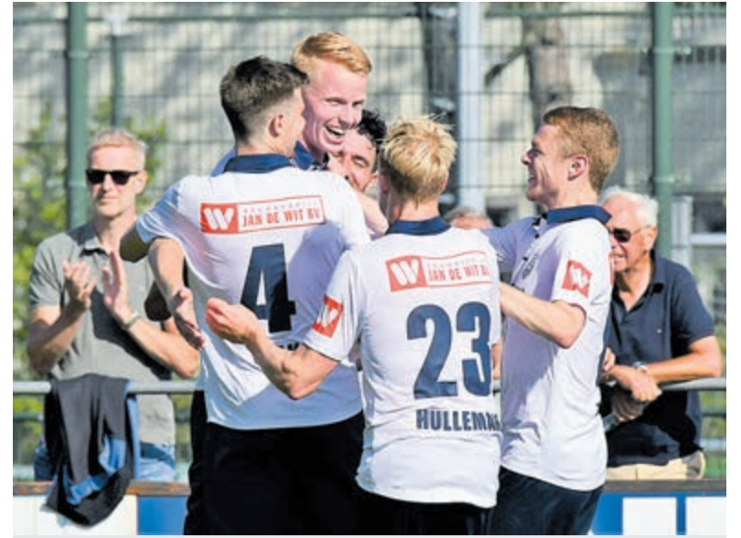
Spannende ogenblikken bij Kon. HFC vs. Spakenburg.

Missiehuis Park is een ontwikkeling van Equilis Nederland; voor meer informatie zie: www.missiehuispark.nl .