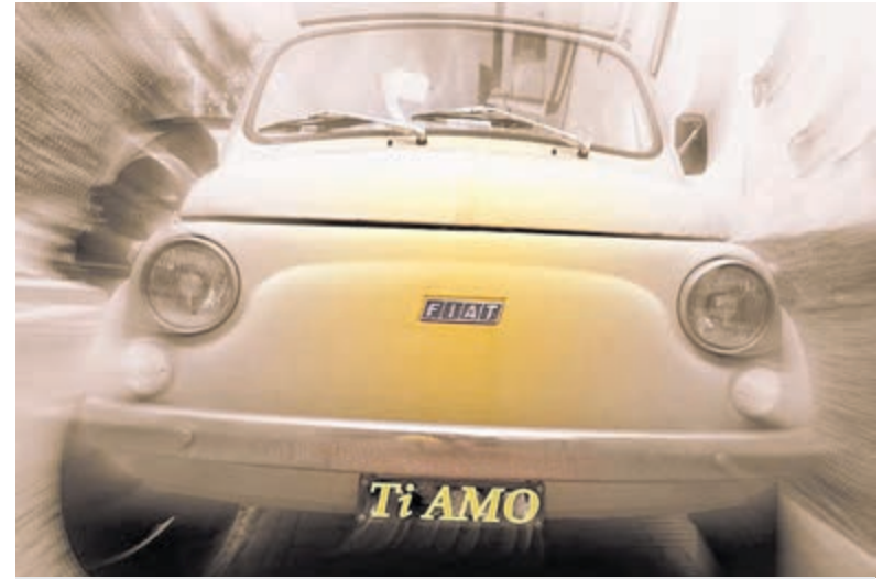
Symbool voor Italië: de iconische Fiat 500.