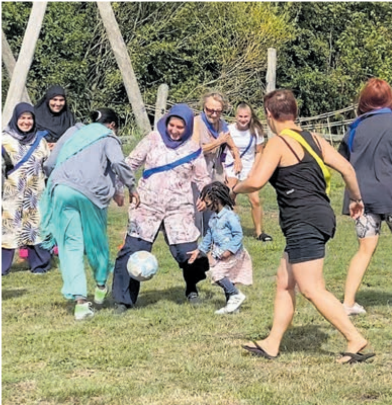
Geslaagde picknick in Meermond met potje voetbal.

Heemstede - Afgelopen zaterdag vond een door Stichting Taalcoaches Zuid-Kennemerland en Haarlem Mozaïek georganiseerde picknick plaats op de Speelbos Meermond. Met een opkomst van meer dan 100 deelnemers, waaronder veel gezinnen en diverse taalcoaches met hun taalmaatjes, werd het een erg gezellig en succesvol evenement. De picknick bracht vele culturen bijeen. Nederlanders en nieuwe Nederlanders uit Syrië, Eritrea, Turkije, Azerbeidzjan, Soedan, Oekraïne en Afghanistan. Aan lange tafels maakte men onderling kennis, deelde men de thuisgemaakte hapjes met elkaar en werden verhalen en ervaringen uitgewisseld. De kinderen konden meedoen aan allerlei sportactiviteiten, opgezet en begeleid door de mensen van SportSupport. Het werd een actieve middag met als afsluiting een potje voetbal tussen de vrouwen en voor iedereen ijs van de ijscovrouw. Een mooi en inspirerend evenement en dus zeker voor herhaling vatbaar.