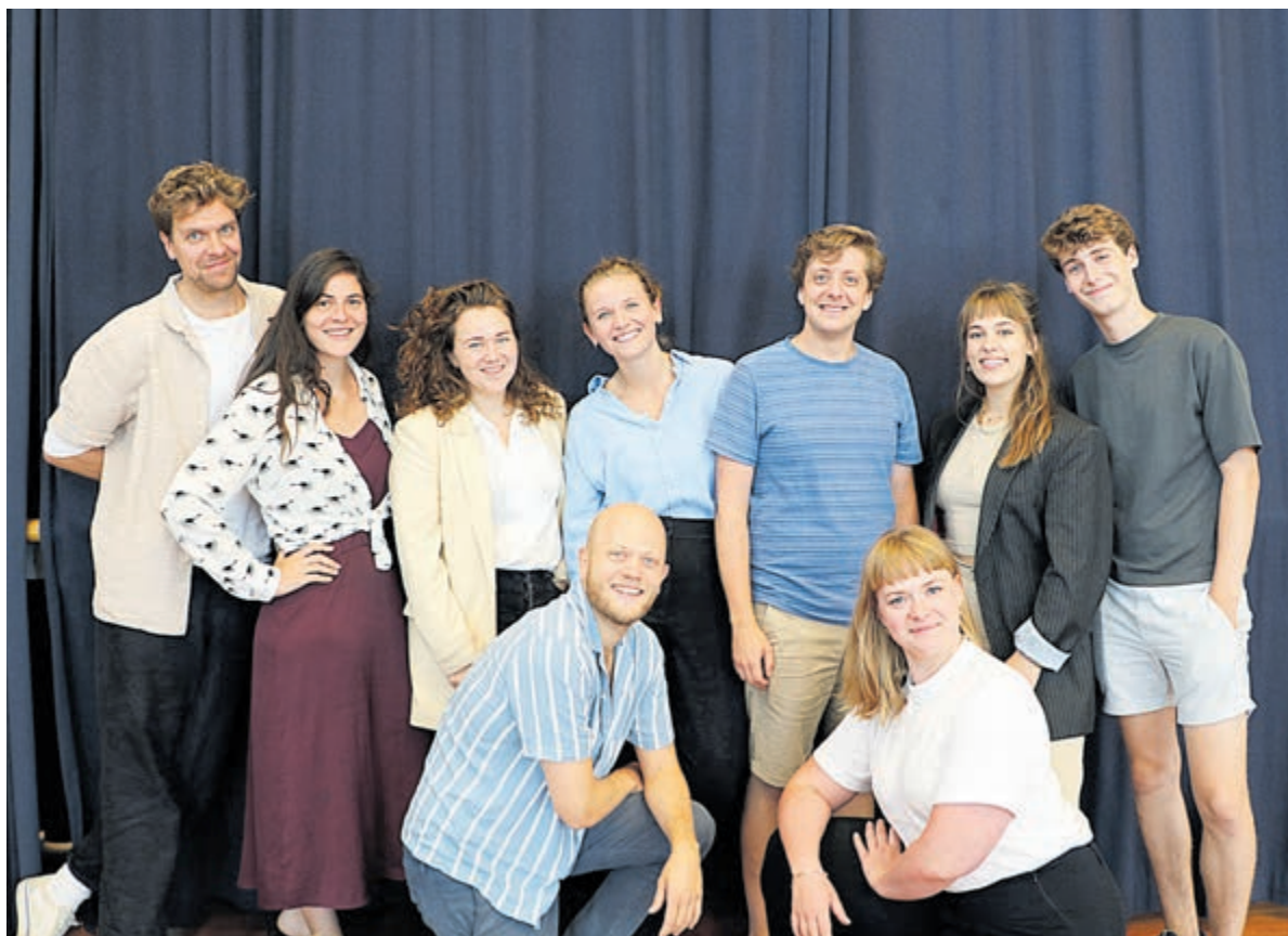
De cast van Malle Babbe.