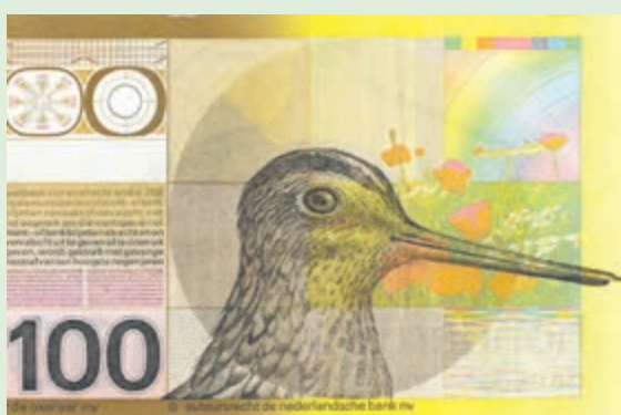
Fl. 100,-. Afbeelding: De Nederlandse Bank.

Deze rubriek komt tot stand met medewerking van Vereniging Vrienden Wandelbos Groenendaal. info@wandelbosgroenendaal.nl , www.wandelbosGroenendaal.nl .