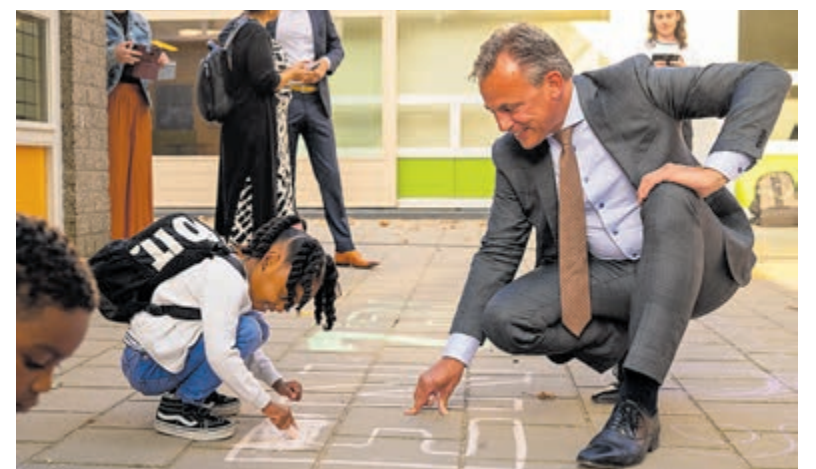
Verkeersminister Harbers start Schoolplein Challenge.

Dat onveilig verkeersgedrag door de sociale omgeving steeds vaker wordt afgekeurd, is volgens Veilig Verkeer Nederland goed op te maken uit de toenemende betrokkenheid van bedrijven.