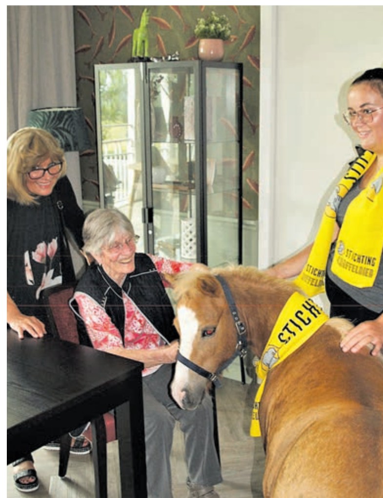
Een brede glimlach bij een bewoonster van de Slottuin, die een pony aait.

Volgens de eigenaar Robine Talboo is de meegebrachte poepschep en vuilniszak niet nodig gebleken en kan men terugkijken op een geslaagd uitje, ongetwijfeld voor herhaling vatbaar.