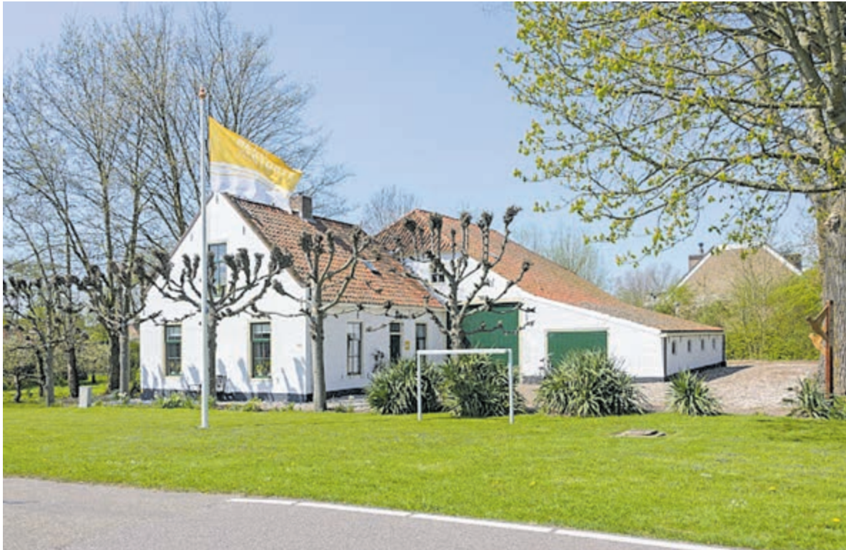
De Witte Boerderij, sinds jaar en dag de plek waar Meer-Historie door de redactie wordt samengesteld.