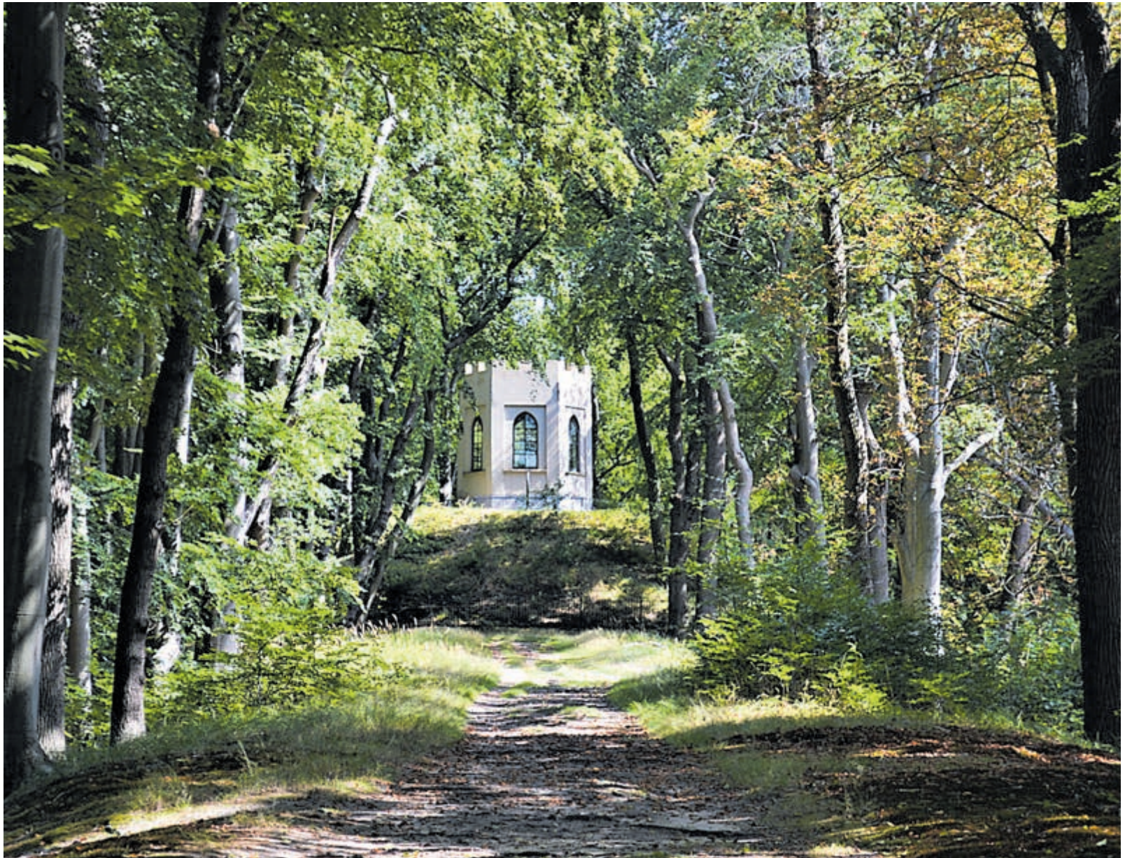
Belvédère op Leyduin.

Het betekent eveneens dat vogels het moeilijker hebben, want voor veel vogels vormen insecten een