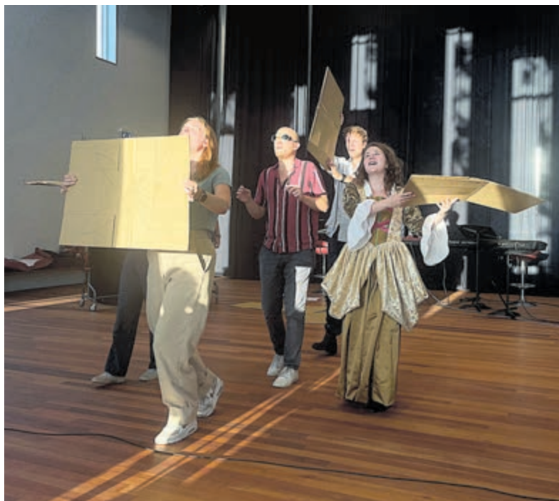
Repetitie Malle Babbe.

De voorstelling Malle Babbe speelt van donderdag tot en met zondag van 25 augustus t/m 11 september buiten op het voorplein van de Stadschouwburg Haarlem. Vrijdag 26 augustus vindt de première plaats. Meer informatie en kaarten via: www.stadsschouwburghaarlem.nl/mallebabbe .