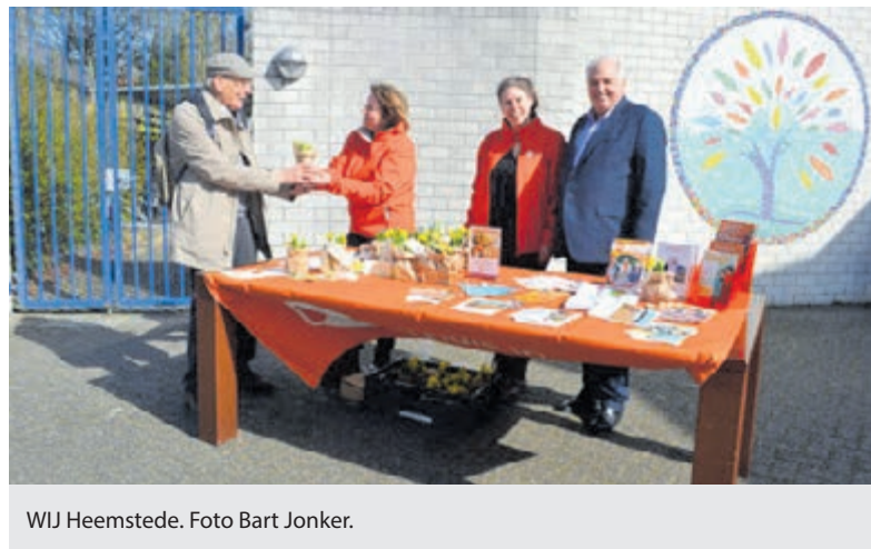
WIJ Heemstede.