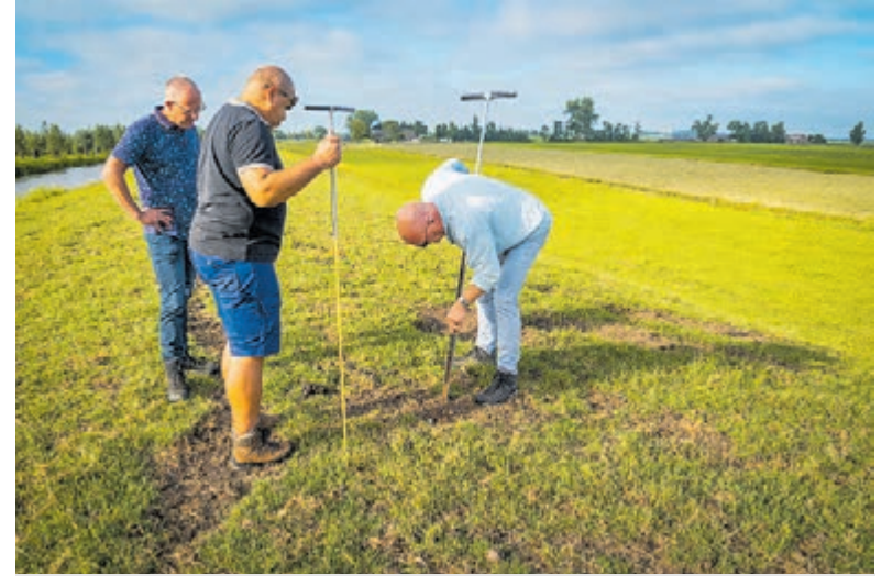
Medewerkers van Rijnland inspecteren de dijken regelmatig met deze droogte.

Door de verzilting op de Gouwe is extra aanvoer van zoet water naar de polders aan de westzijde van de Gouwe noodzakelijk. Er wordt water ingelaten via de Oostvaart in Hazerswoude en bij de Oostvaartsuis wordt een hevel geplaatst. Het scheepvaartverkeer wordt hier niet door gehinderd. Bij de Rietveldsluis is een hevel niet mogelijk. Deze sluis is daarom per 5 augustus iedere avond