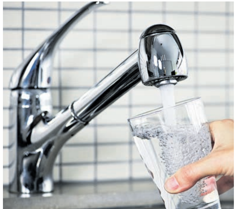
Drinkwater wordt kostbaarder.