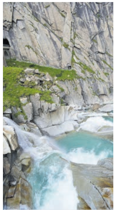
Waterval boven op de Gotthardpas.

Diverse bronnen, onder meer MySwitzerland.com .