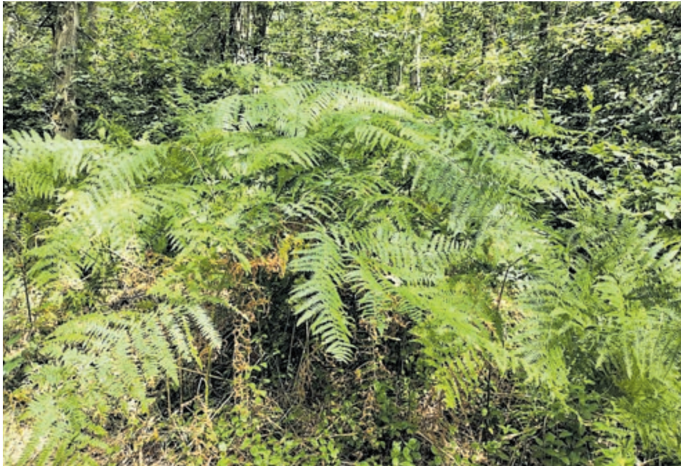
Adelaarsvaren op Leyduin.

Bloemendaal/Heemstede – De omgeving waarin we wonen is gezegend met veel groen en dat maakt het juist zo prettig wonen. Binnen een kort tijdsbestek bent u aan het wandelen in bossen als Middenduin, Koningsduin, de Waterleidingduinen, Leyduin of Wandelbos Groenedaal. Wie zijn ogen goed de kost geeft ontdekt veel en leert over het leven in het bos. Enkele zaken die u tegen kunt komen tijdens het wandelen worden hieronder uitgelicht. Sommige flora en fauna zijn eveneens in de tuin waar te nemen.