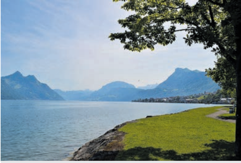
Veel mooie plekjes aan de Zwitserse meren.