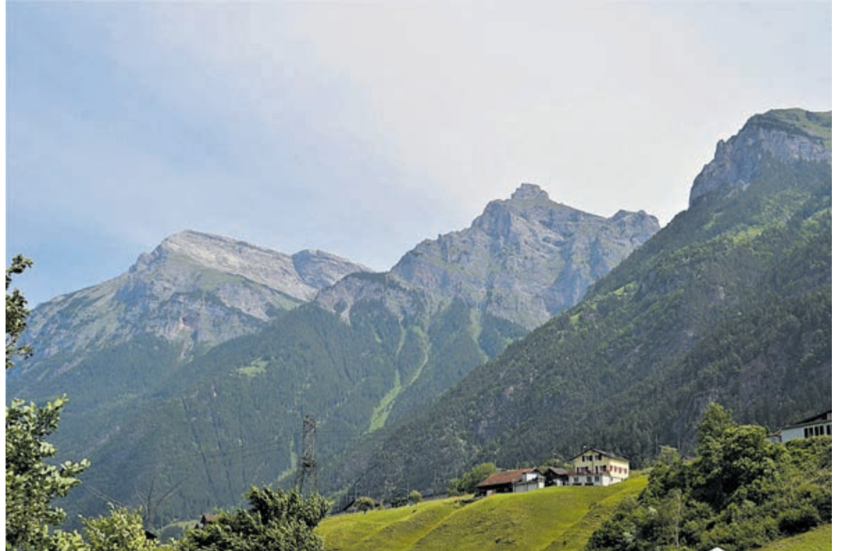
Bergdorpjes in de Alpen.

Zwitserland beschikt over 19 nationale parken. Een van deze parken is