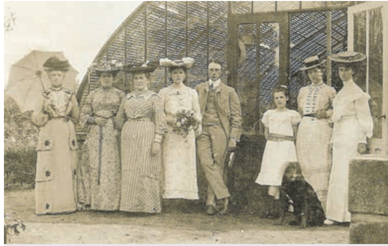
Historische foto Leyduin.

Akonietenplein 1 Bennebroek Zondag 14 augustus: gezamenlijke dienst in de Oude Kerk. De vieringen zijn ook online te volgen, zie: www.pkntrefpunt.nl , klik op actueel of zoek op YouTube naar trefpunt Bennebroek. www.pkntrefpunt.nl .