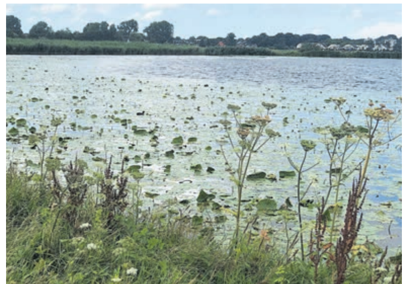
De Molenplas is een beauty.