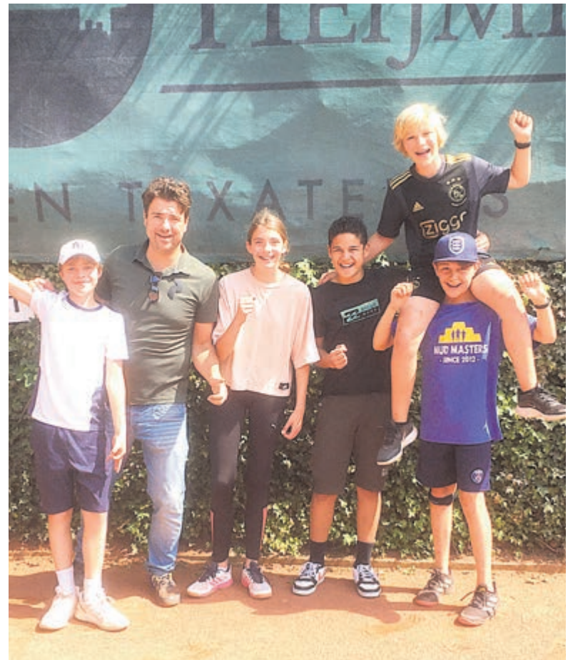
Groen kampioen.

Het college kan een advies van de commissie naast zich neer leggen. Zij hebben inmiddels laten weten het advies te bestuderen maar zien geen kans binnen 12 weken tijd een besluit te nemen. Voor de voortgang van de bouw zal het waarschijnlijk geen grote gevolgen hebben. Wordt vervolgd.