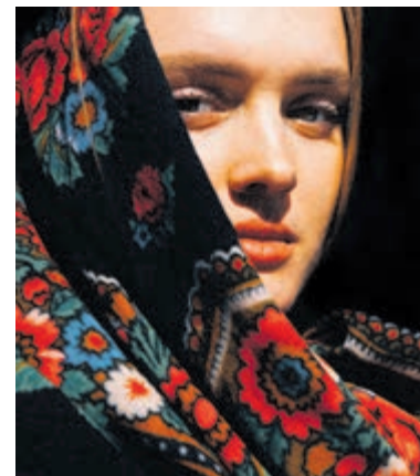
Fotografie van Alex Blanco. Foto's: Alex Blanco.