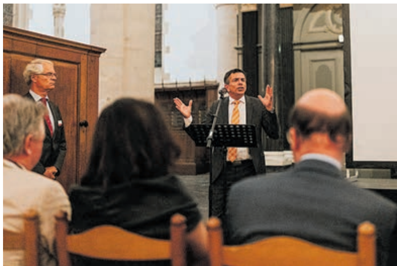
Geen winnaar dit jaar voor Orgel Improvisatieconcours.

Zie voor meer informatie: www.orgelfestivalhaarlem.nl .