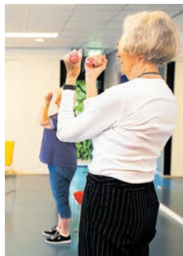
Fit in evenwicht voor ouderen.

023 – 5483828 van maandag t/m donderdag tussen 9 en 16 uur en op vrijdag tussen 9 en 13 uur.