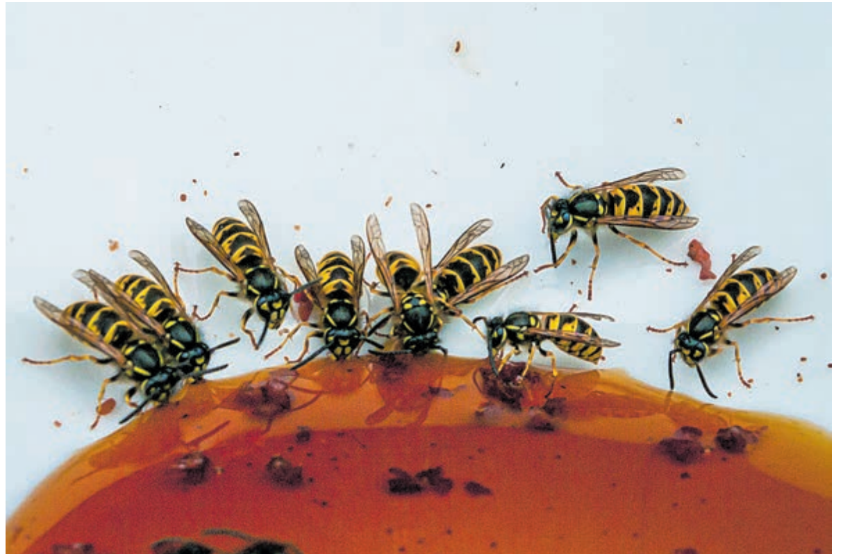
Wespen kunnen een behoorlijke plaag vormen.