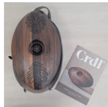
De Crdl.