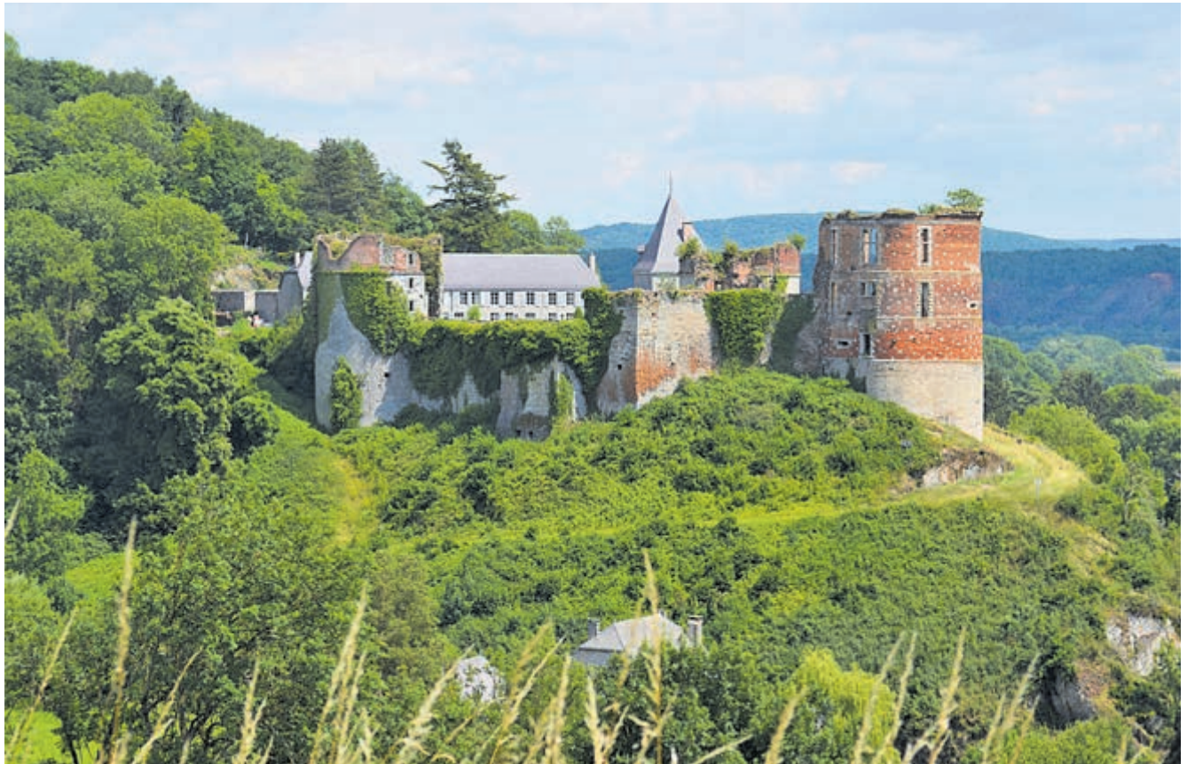
Het kasteel van Hierges.

Een ander historisch gebouw is de kerk Saint Jean Baptiste. Oorspronkelijk was deze kerk een kapel. De kerk is gebouwd in 1579. De buitenmuren van deze kerk zijn tevens opgetrokken uit de lokaal blauwe steensoort uit Givet. Wie slentert door de knusse straatjes, zal opvallen dat Hierges zich tevens profileert als kunstenaarsdorp. Kunstwerken van lokale kunstenaars zijn hier te bewonderen.