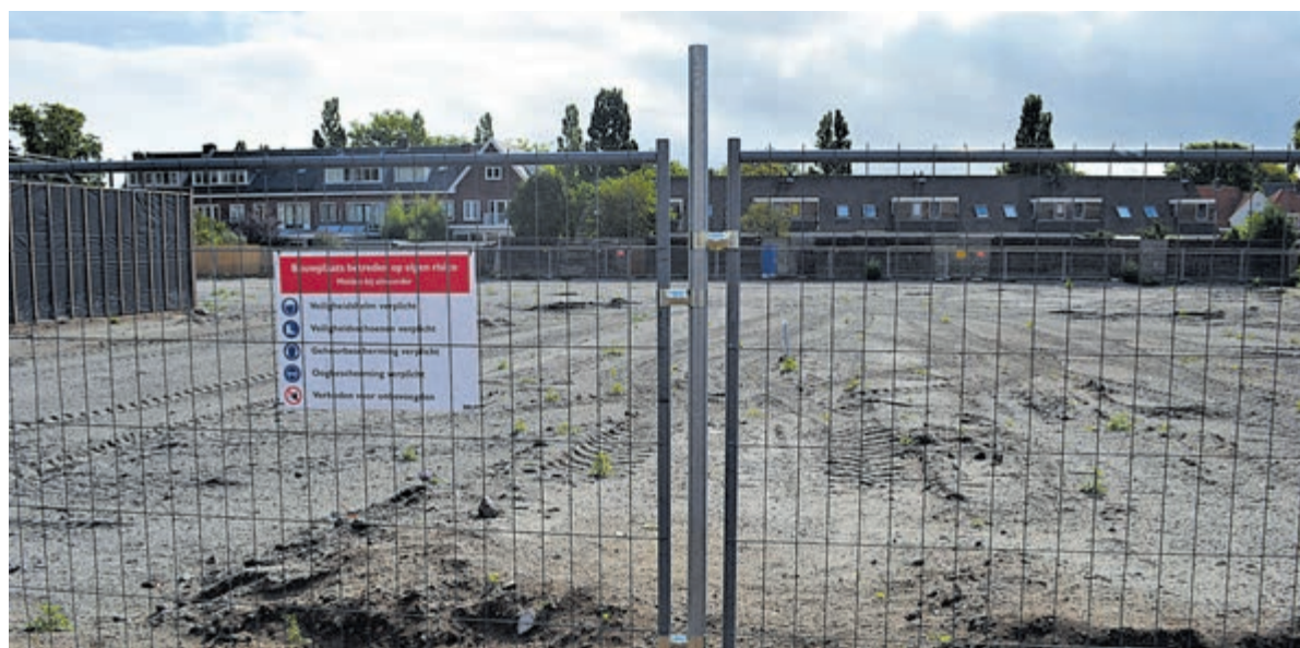
Het bouwterrein waar de nieuwe Vomar moet komen.