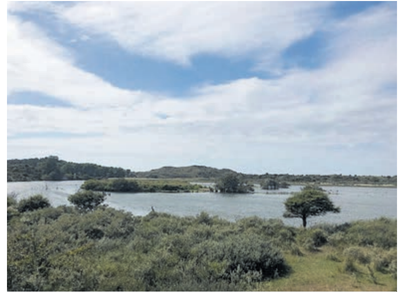
Het Vogelmeer.

Voorzieningen: Eigenlijk was het doel een verkoelend 'nat pak' te halen in het meer. Eenmaal aangekomen zag uw correspondentente daar vanaf. Niet dat het niet toegestaan is – maar het zou de rust maar verstoren van zoveel vogels die hier genieten van een stukje ongereptheid