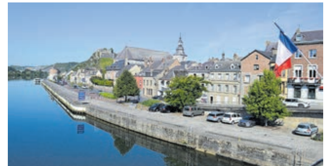
Givet aan de Maas.

Nabijgelegen, aan de grens met België ligt Givet aan de Maas, waar de rivier verder België instroomt. Givet is een gezellig stadje met leuke restaurantjes, barretjes, hotels en een camping aan de Maas. Ook Givet maakt deel uit van de 'Route Rimbaud/Verlaine', alsmede van de 'Route des fortifications' met haar vesting Charlemont, waarvan de bouw in 1555 aanving onder Karel V. Iets verderop bevindt zich bij het dorpje Chooz een kerncentrale (waarvan er veel in Frankrijk staan), die de omgeving van elektriciteit voorziet.