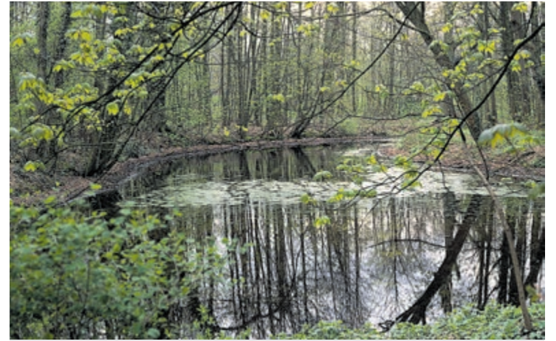
Vijver in Bennebroekbos.

heerlijkheid Bennebroek. 2. De geschiedenis van het Huis te Bennebroek en zijn bewoners. 3. Het Bennebroekbos. Ontwikkelingen, inrichting en toegepaste landschapsarchitectuur.