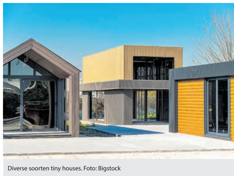
Diverse soorten tiny houses.

Mensen die interesse hebben, hoeven het wiel niet meer uit te