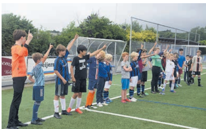
Wie heeft er zin in het jeugdweekend? Ik, Ik, Ik, Ik.....