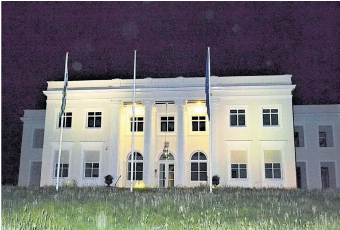
Gemeentehuis Bloemendaal bij nacht.