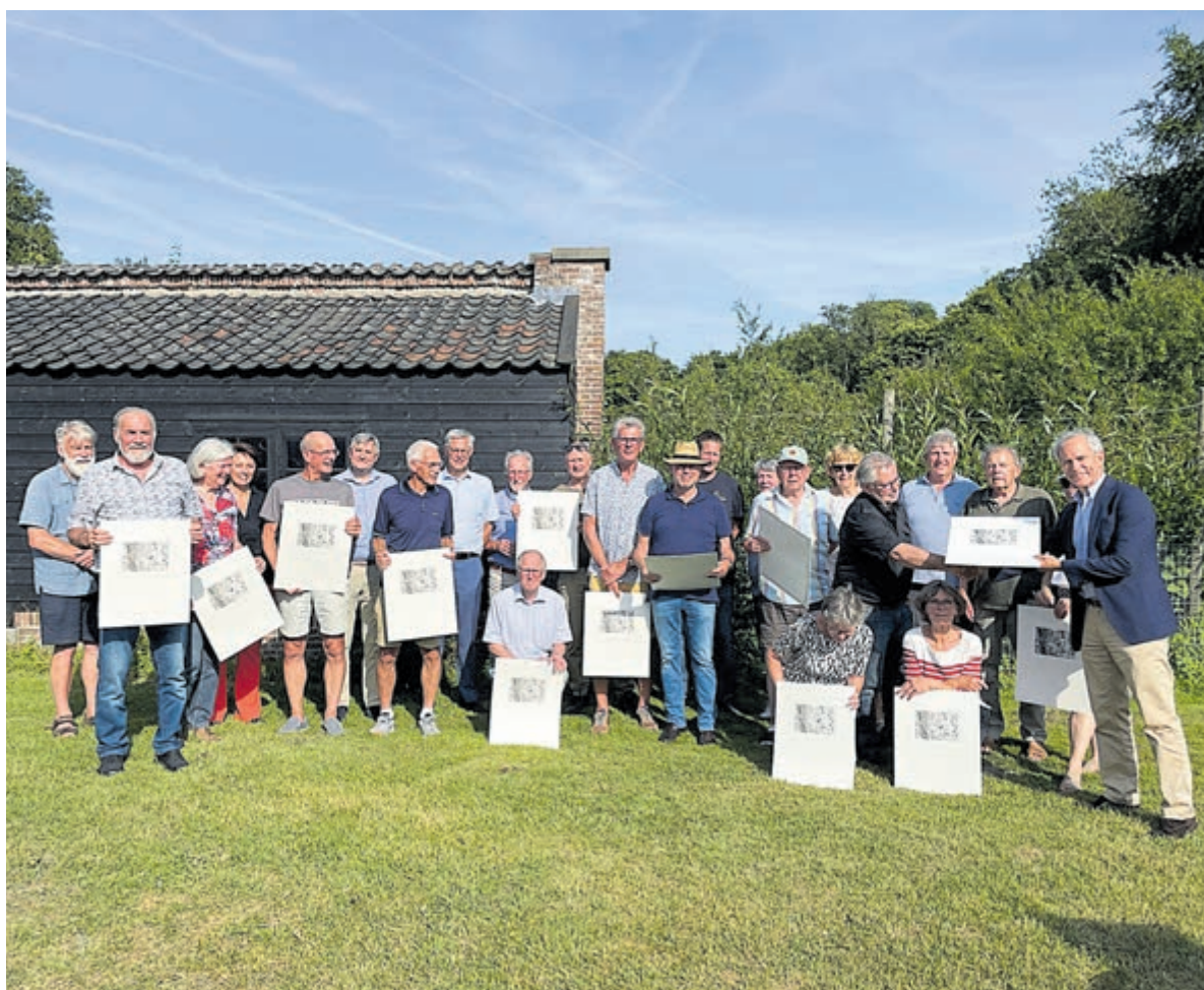
De vrijwilligers met hun zojuist ontvangen prent van Huis te Manpad.