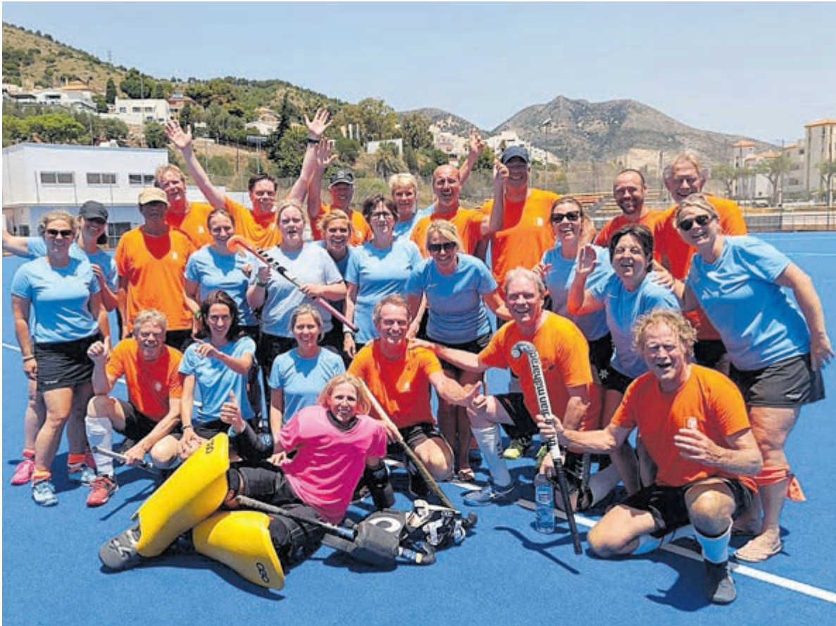
Groepsfoto van de teams van MHC Alliance in Spanje.

De voorbereidingen voor het toernooi van volgend jaar zijn alweer begonnen; tijdens een boottocht door de Amsterdamse grachten zal binnenkort worden besproken met welke tactiek niet één maar twee podiumplaatsen binnengesleept kunnen worden.