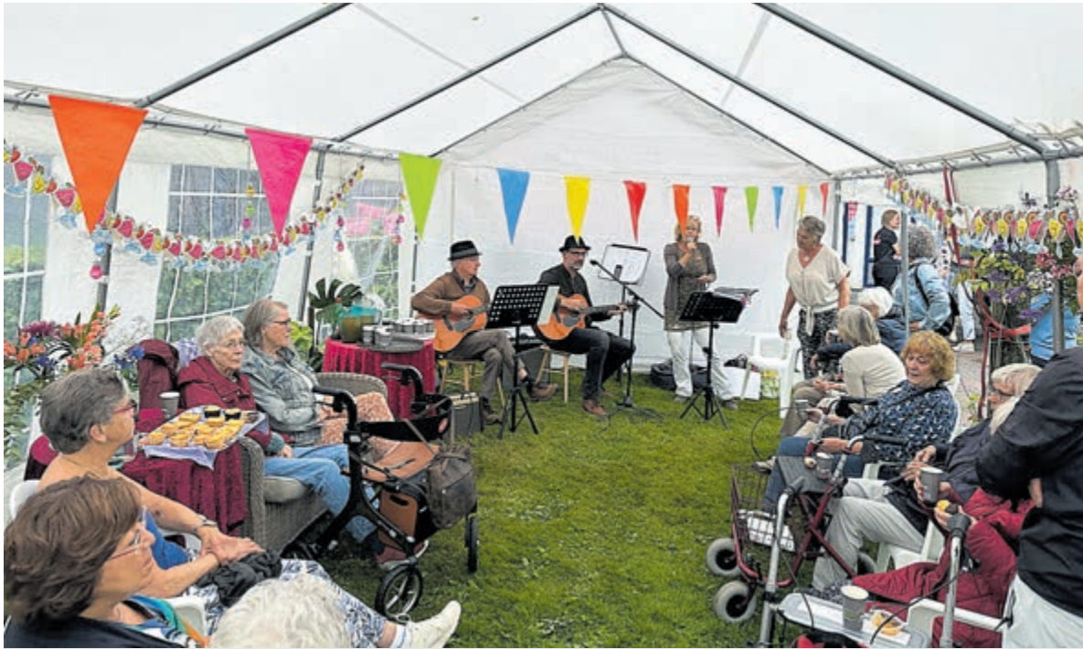
Gezelligheid op de wandeldag van de Heemhaven.

of gezapig: The Beatles! Wat deze muziek gemeen heeft met de instelling van iedereen deze ochtend: het aanstekelijk enthousiasme. Regen? Geen probleem, geen chagrijn. De tuin vaart er wel bij, het is er heerlijk toeven. Voor taarten, limonade en zelfs suikerspinnen was gezorgd. Binnen in het centrum konden groepjes bewoners ook genieten van speciale activiteiten, zoals luisteren naar mooie verhalen. Gaande de ochtend werd het droger maar het ontbreken van zonnestralen was geen sfeerbederver. De Heemhaven houdt de stemming er altijd in!