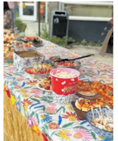
Gezellig zomerfeest op PBS. Foto aangeleverd.

Iedereen heeft genoten van het fantastische zomerfeest wat weer een fijne afsluiting was van dit prachtige schooljaar.