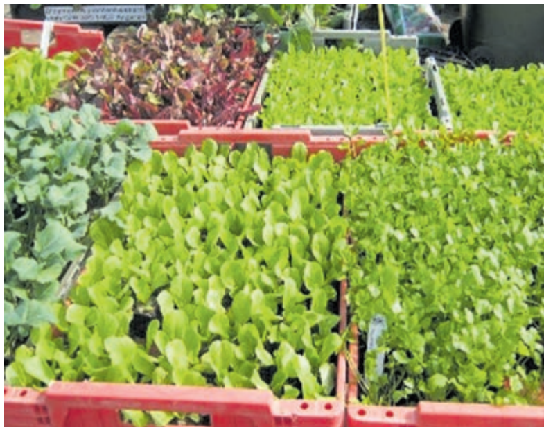
Open Dag bij tuindersvereniging BATV. Foto aangeleverd.

pannenkoeken en is er koffie, thee en limonade verkrijgbaar. Tuincentrum de Oosteinde heeft drie prijzen beschikbaar gesteld voor de winnaars van de fotowedstrijd. Vanaf 15 uur wordt de middag afgesloten met gratis frisdrank, wijn of een biertje. Tot ziens op 8 juli aan de Zandlaan 250 meter voorbij nummer 36 in Bennebroek.