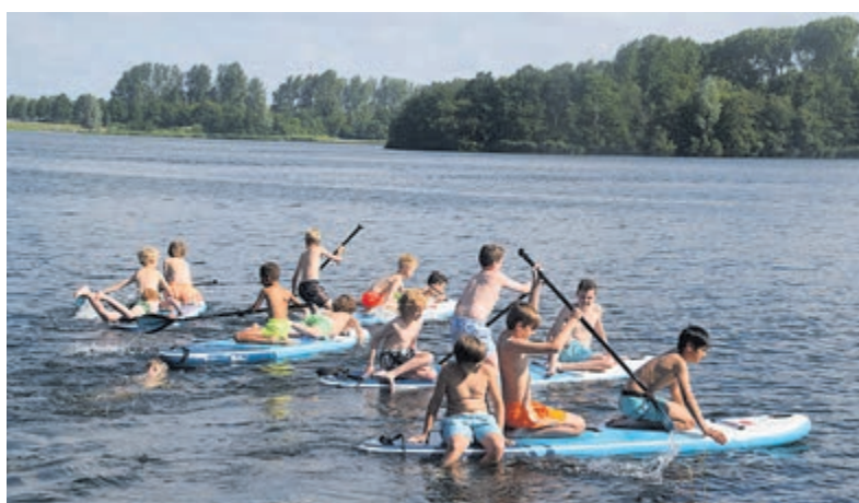
Voetballers op het water geeft een spektakel