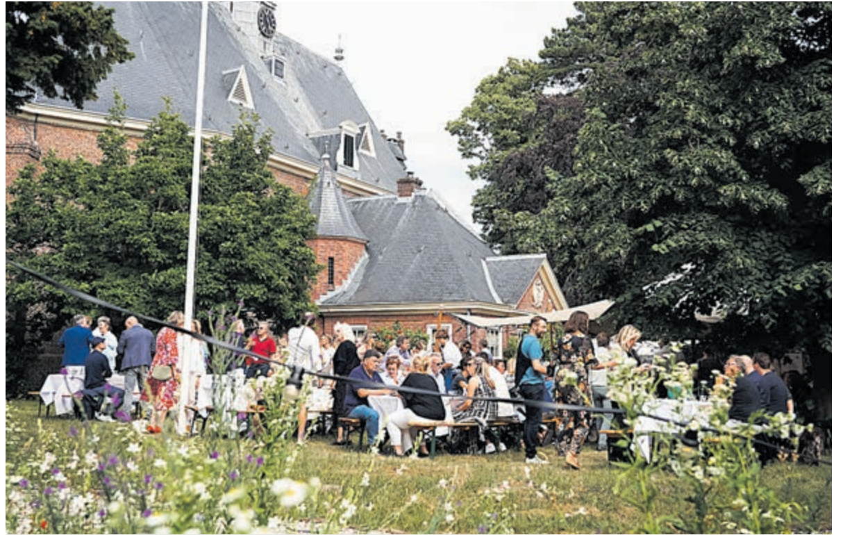
Een en al gezelligheid die verbindt op de Bloemendaalse Zomeravond.

De taalkoppels nemen dus zelf de ingrediënten mee, ook graag het recept in het Nederlands en eventueel een kookschort. Aanmelden en informatie kan via de mail: info@wijheemstede.nl .