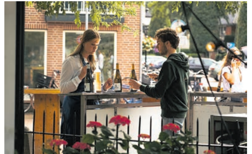
Heerlijk genieten van eten en drinken.