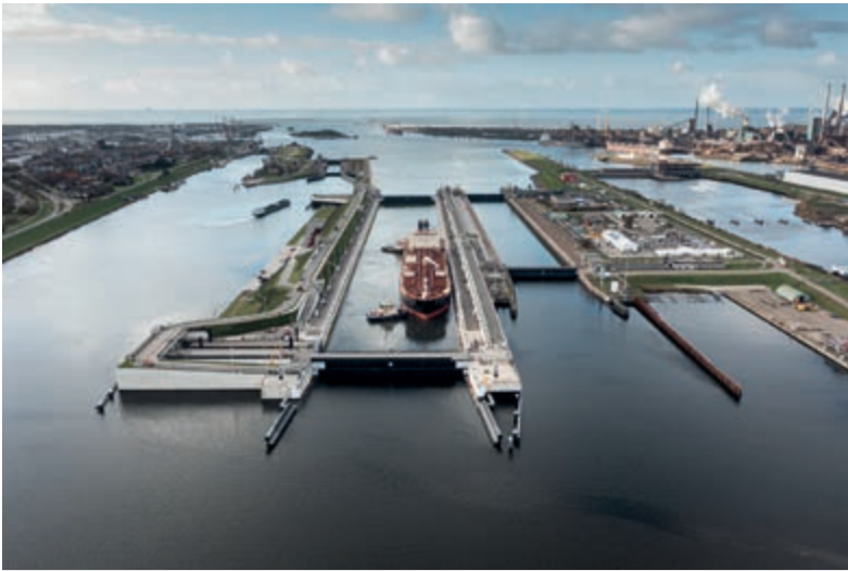
Sluizencomplex in IJmuiden.

Meer info vind je op de site loopschoolenno.nl en inschrijven kan daar ook.