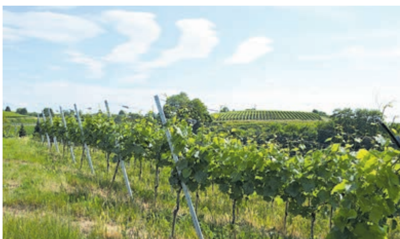
Heerlijk rustig slenteren langs de wijngaarden.