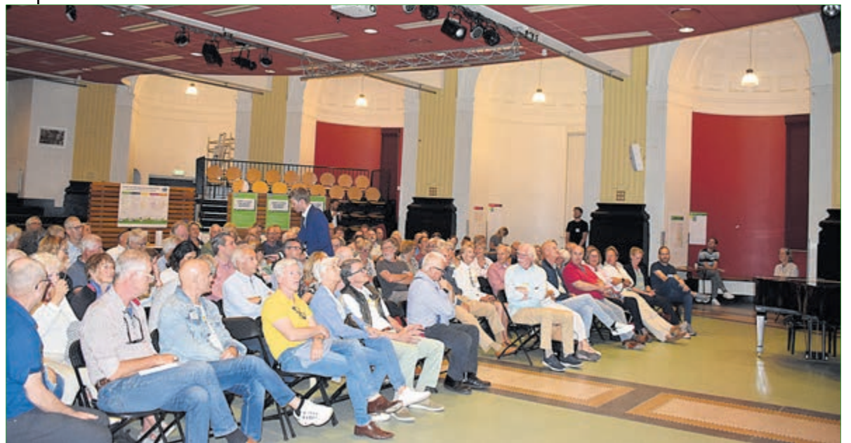
Ruim honderd genodigde inwoners woonden de avond over het Burgerberaad bij.