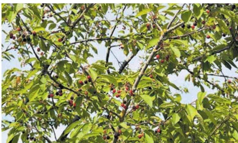
Veel kersbomen die tot de nok volhangen op dit moment in het Zwarte Woud.