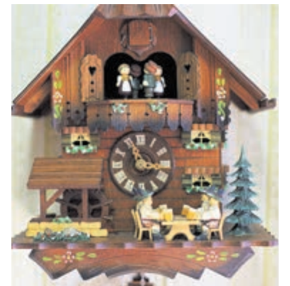
Een variant van de wereldberoemde koekoeksklok.