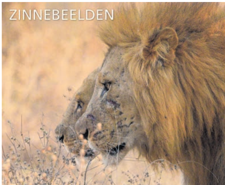
Leeuwen (Ada Kors).

Er is een blad op magazineformaat waarin van elke deelnemer een kunstwerk is afgebeeld met bijbehorende tekst. Er is nog een beperkt aantal exemplaren beschikbaar, te bestellen bij jokefineart@icloud.com . Kosten € 10,- per exemplaar.