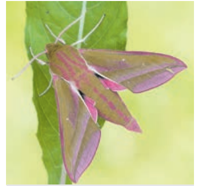
Groot avondrood (Deilephila elpenor).

Check of je recht hebt op toeslagen. Je hebt tot en met 1 september 2022 om jouw huur- of zorgtoeslag over 2021 aan te vragen op Mijn toeslagen (Belastingdienst.nl).