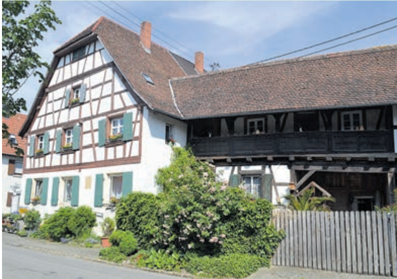
De typerende vakwerkhuisjes voor het Zwarte Woud.

Baden-Württemberg – Nog even en dan is het echt zomervakantie. Nog geen reisplannen gemaakt? Misschien is het Zwarte Woud in Duitsland dan wel iets voor u!