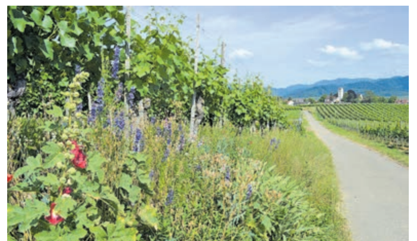
Alles staat nu prachtig in bloei.