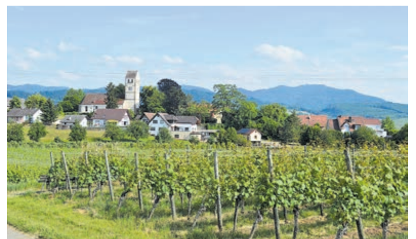
Midden in de wijnvelden ligt het pittoreske dorpje Sulzburg bij Buggingen.