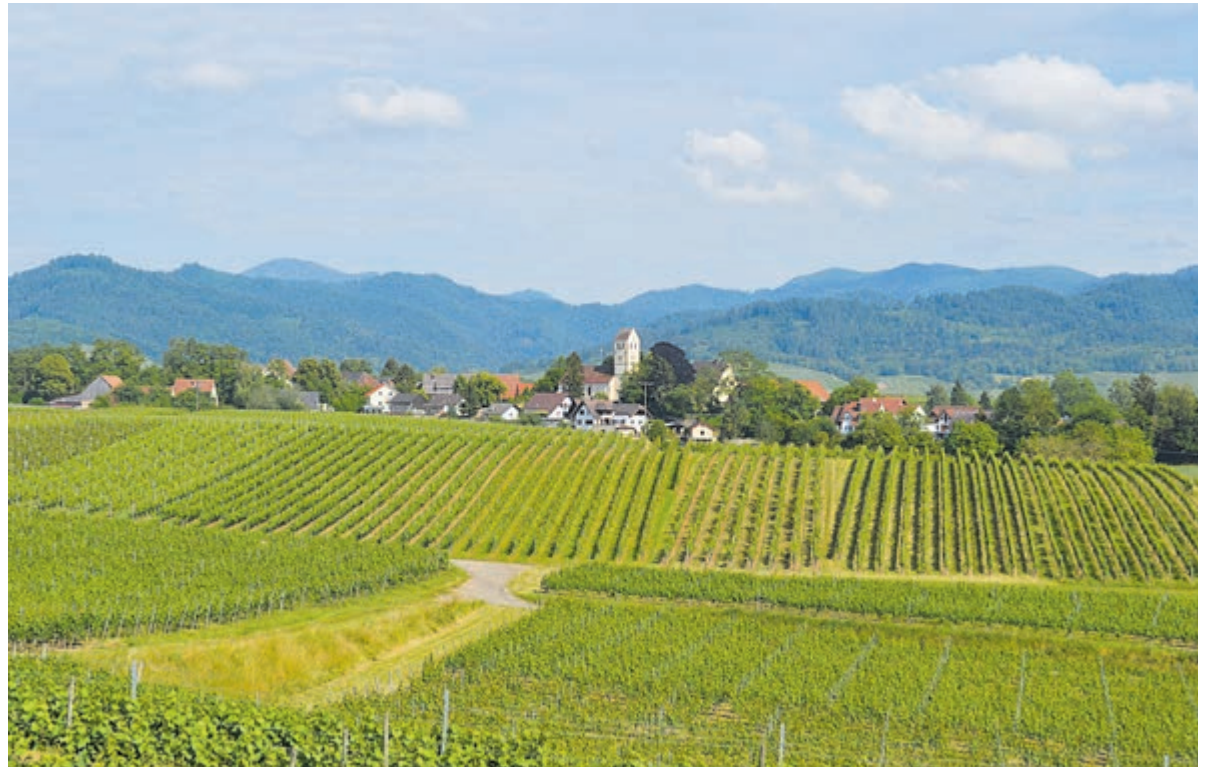
Prachtige vergezichten met rustieke dorpjes in het fraaie Zwarte Woud.

Het Zwarte Woud in het zuiden van Duitsland behoort tot de deelstaat Baden-Württemberg. Vaak is het Zwarte Woud voor veel Nederlanders 'slechts' een overnachtingsplek voor als ze op doorreis zijn. Toch is het zeer de moeite waard om deze streek eens nader te ontdekken en om daar eens vakantie te vieren. Het is een schitterende en gastvrije regio, waar voor ieder wat wils iets is te doen. Een omgeving waar je snel verliefd op wordt. Er is zoveel te vertellen over dit fraaie gebied. In dit reisartikel wordt slechts een tipje van de sluier opgelicht.