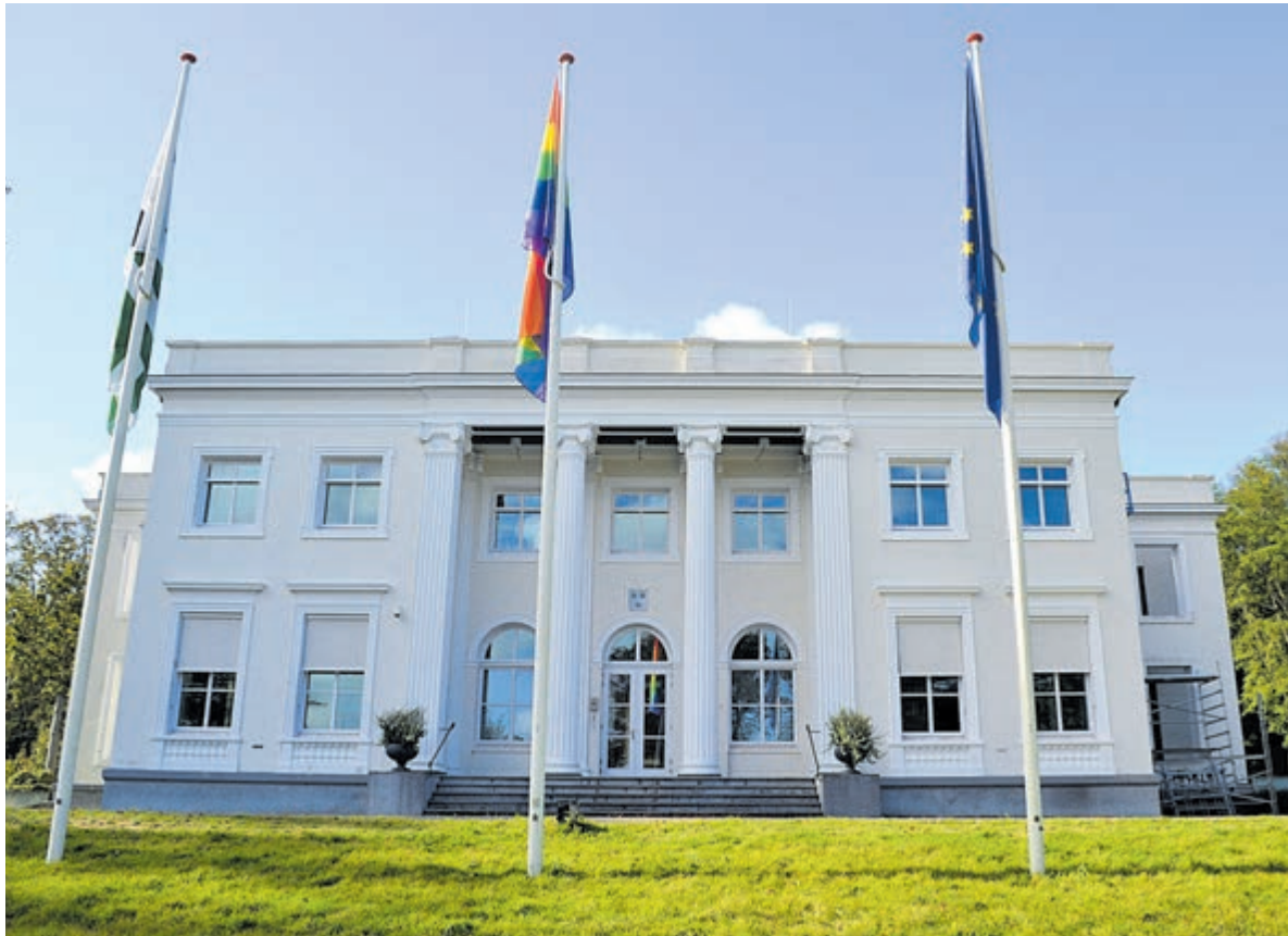
Raadhuis Bloemendaal.