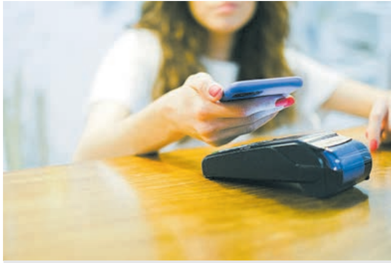
Portemonnee steeds vaker vervangen door smartphone.