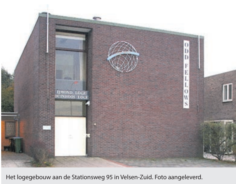
Het logegebouw aan de Stationsweg 95 in Velsen-Zuid.

velen dagelijks bezighouden. Dat kunnen levensvragen zijn of maatschappelijke vraagstukken. Ze willen van elkaar leren om hierdoor mogelijk andere inzichten te verkrijgen in een wereld vol van diversiteit. Goed en actief luisteren is voor hen een levenskunst geworden. Verder voelen zij zich actief betrokken bij wat zich in de samenleving afspeelt, te beginnen dicht bij huis. Het is uit deze betrokkenheid dat zij al 104 jaar lang jaarlijks donaties schenken aan lokale en regionale verenigingen. Hun organisatie c.q. vereniging is op filosofisch en humanaan gedachtegoed gebaseerd. Heeft u belangstelling voor bovenvermelde 'vrije inloop' of wilt u anderszins informatie over deze vereniging, laat dit dan even weten aan één van onderstaande emailadressen: bwelink@zonnet.nl , 40ijmond@oddfellows.nl , of johan.zwakman@kpnplanet.nl . Kijk ook op de (landelijke) website: www.oddfellows.nl .