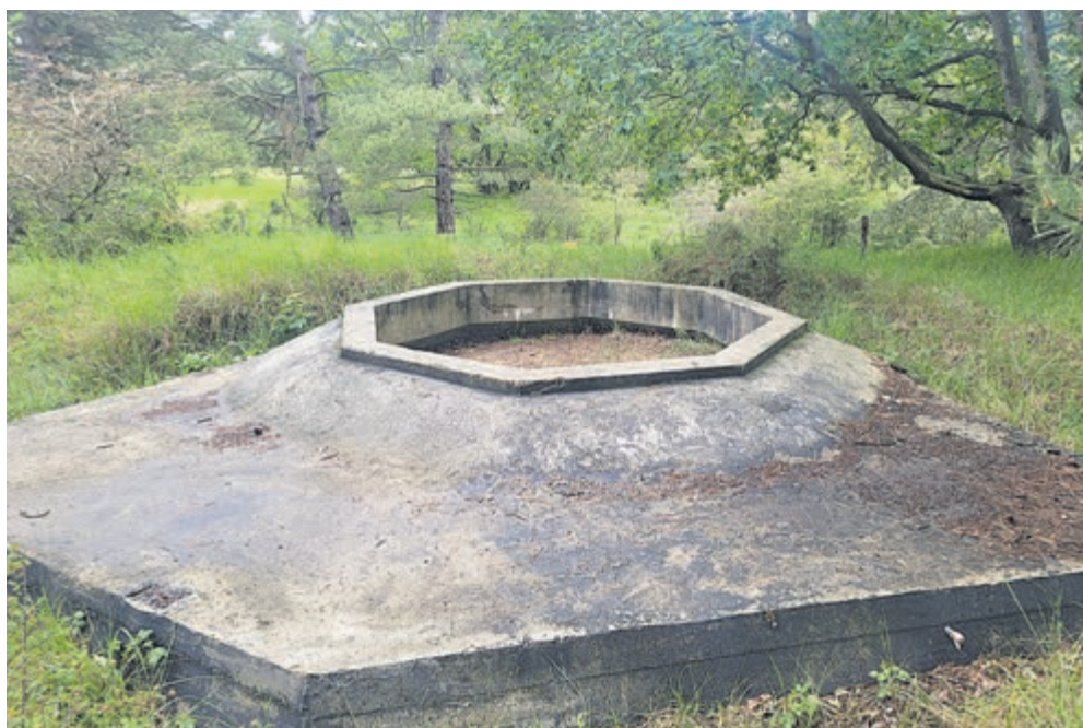
Een Kampwagenkanon, hier stond een kanon in de aanslag.