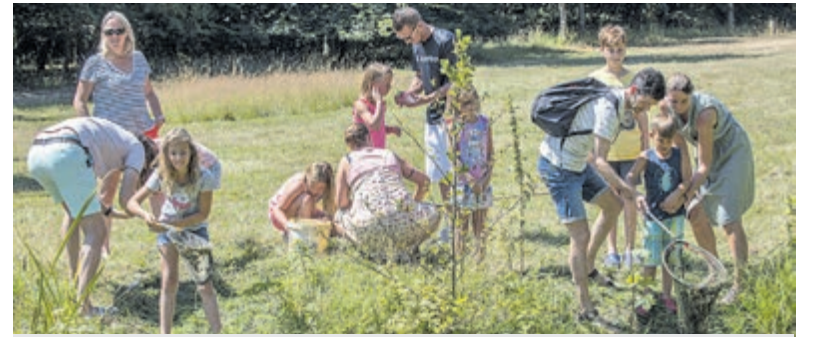
Waterbeestjes scheppen

Entree: vrijwillige bijdrage met richtbedrag €10 ter dekking van de kosten. Info: www.dekapel-bloemendaal.nl .