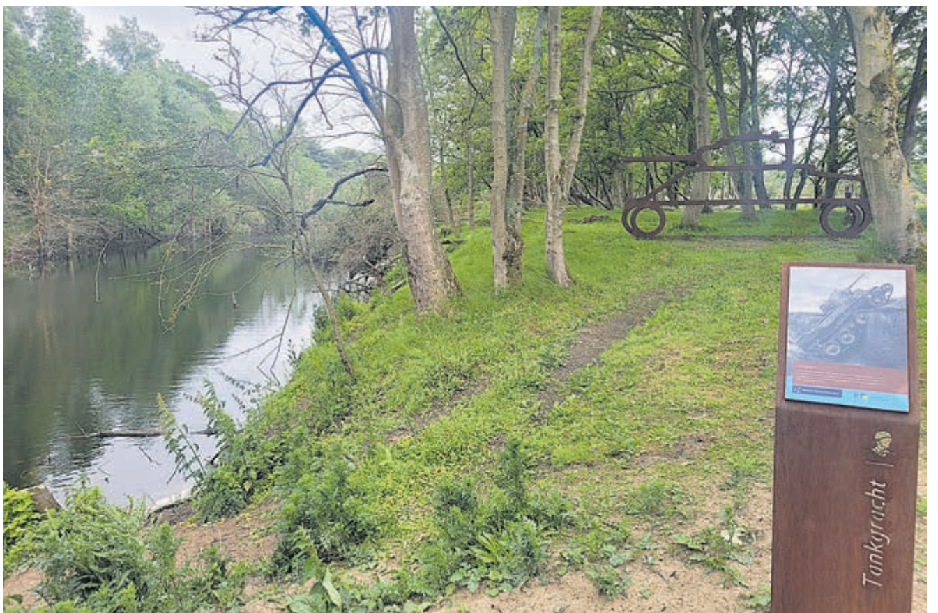
De voormalige tankgracht die nu een fijne plek voor dieren is om te drinken.