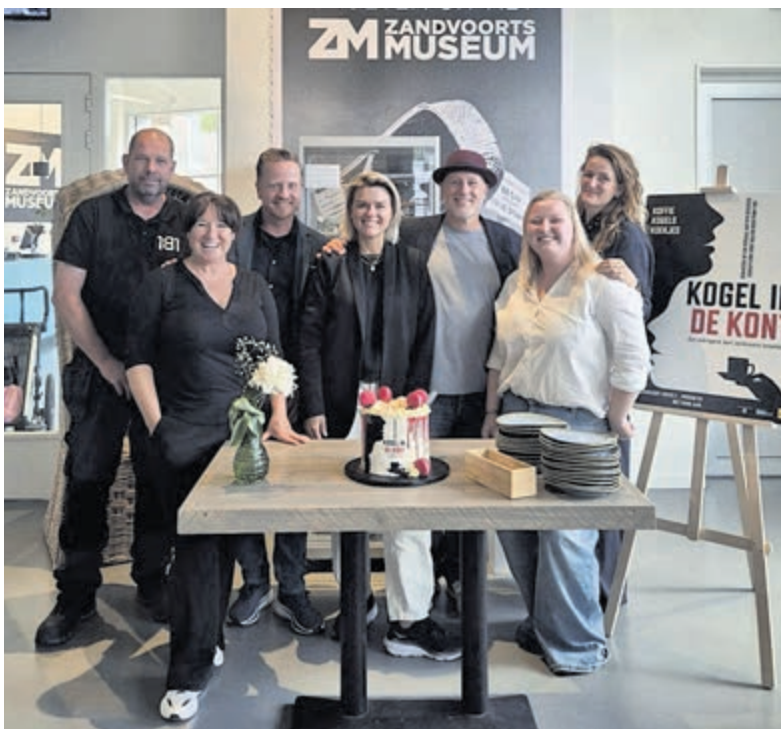
Cast en creatives van Kogel in de Kont tijdens de officiële start van de productie in het Zandvoorts Museum. De eerste productie van Zandvoort Vertelt is uitverkocht.

Rijnland zuivert afvalwater uit huizen en bedrijven, zodat het schoon genoeg is om terug te gaan naar sloten, meren en plassen. Een van de grootste zuiveringen staat in de Haarlemse Waarderpolder. Daar kan tot 8,7 miljoen liter water per uur worden gezuiverd. Zo werkt Rijnland elke dag aan schoon water en een gezonde leefomgeving. Op www.rijnland.nl/spoelwijzer staat meer informatie over wat wel en niet door het toilet of de gootsteen mag, inclusief praktische tips voor thuis.