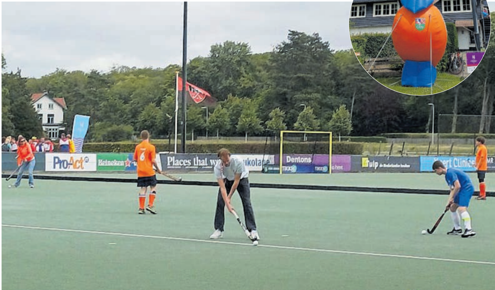
Het was een fantastisch hockey-evenement. In de inzet de mascotte van de Spelen: de Mus.

werd geopend met een officiële openingsceremonie op de ijs-baan in Haarlem. Tijdens de openingsceremonie werd de vlam ontstoken, en was er een atletenparade. Op maar liefst 25 locaties vonden de toernooisporten plaats. De sporters kwamen uit in 27 verschillende sporten, varië-