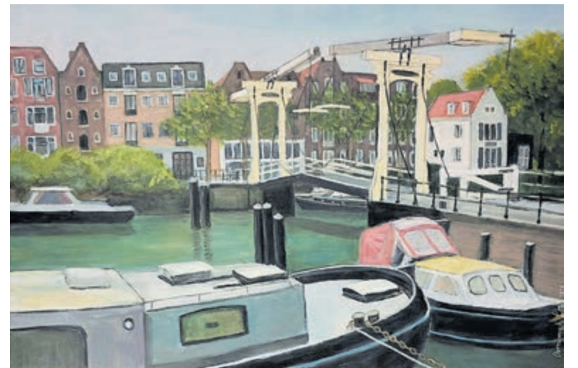
Werk van Annemiek Loof - stadsgezicht.

Tijd: 10.00 tot 12.00 uur. Verzamelen voor Juffershuis/Gasterij Leyduin, Tweede Leyweg 7, Vogelenzang.