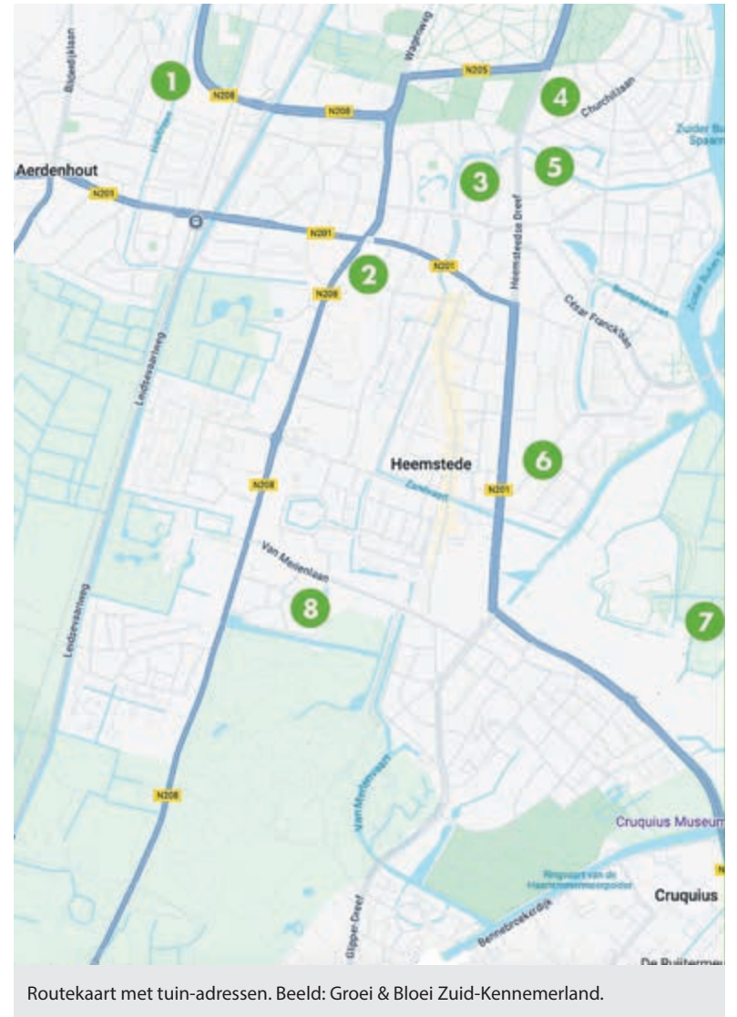
Routekaart met tuin-adressen.

Herenboeren Heemstede is een coöperatieve boerderij, die biologische groenten, aardappelen, fruit en varkens- en rundvlees produceert voor de eigen leden. Onder leiding van twee professionele boeren bewerken leden het land en bouwen ze aan een alternatief voor de traditionele landbouw, niet gericht op winst maar op een duurzaam voedselsysteem. Dat doen ze op ongeveer 18 ha. gras- en akkerland en een lange tunnelkas. Met de auto: Cruquiusweg 45a ingang door hek vlak naast de