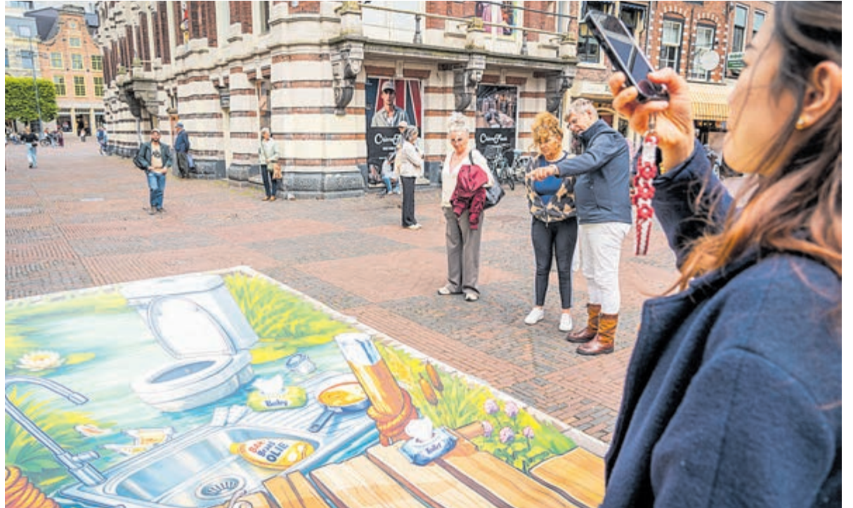
3D-print die inwoners erop wijst dat ze niet zomaar alles door gootsteen of toilet kunnen spoelen.

De uitverkochte kaartverkoop onderstreept de grote belangstelling voor verhalen die geworteld zijn in de geschiedenis van het dorp.