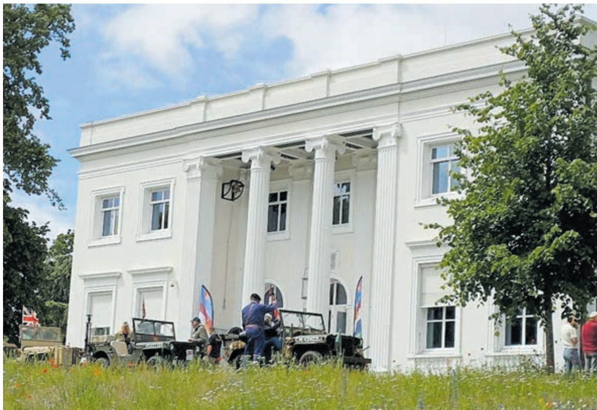
Veteranen in klassieke voertuigen worden ontvangen op het gemeentehuis.

Bloemendaal - De lokale Veteranendag in Bloemendaal werd dit jaar net als voorgaande veteranendagen gecombineerd met de Stormschool Bloemendaal Memorial, die dit jaar alweer voor de 10e keer werd georganiseerd. Tijdens Veteranendag staat de gemeente Bloemendaal stil bij de inzet van veteranen waar ook ter wereld, in oorlog- en vredesoperaties. Naast de 'historische' mars van zo'n 20 kilometer door onder meer de duinen van Bloemendaal ter herinnering aan de Stormschool als bakermat van het huidige Korps Commandotroepen in Nederland, was er zaterdag 13 juni ook een ontvangst op het gemeentehuis en een moment van herdenking bij de Eerebegraafplaats in Overveen. Na het defilé door Bloemendaal werd de dag afgesloten met een BBQ bij Vanouds het Dorpshuys.