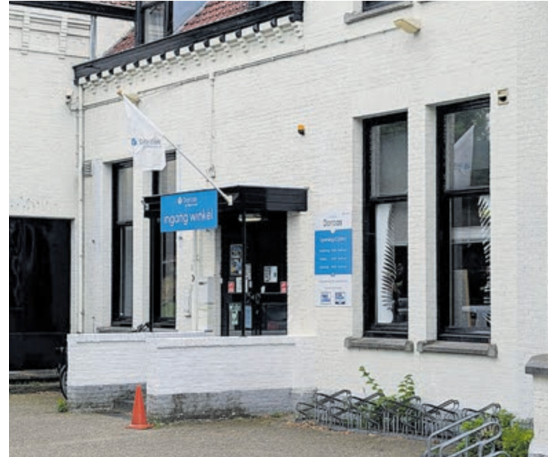
Op zaterdag 27 juni aanstaande organiseert Dorcas Kringloopwinkel een taxatiedag.

Het voorwerp kan na de taxatie weer worden meegenomen naar huis, maar de taxateur kan het ook laten veilen voor de eigenaar. Het voorwerp schenken aan Dorcas, kan natuurlijk ook. De noodhulp- en ontwikkelingsorganisatie Dorcas besteedt het geld aan projecten voor mensen in nood in Oost-Europa, Oost-Afrika en het Midden-Oosten. Denk onder andere aan noodhulp in Libanon, Oekraïne en Soedan. Daar