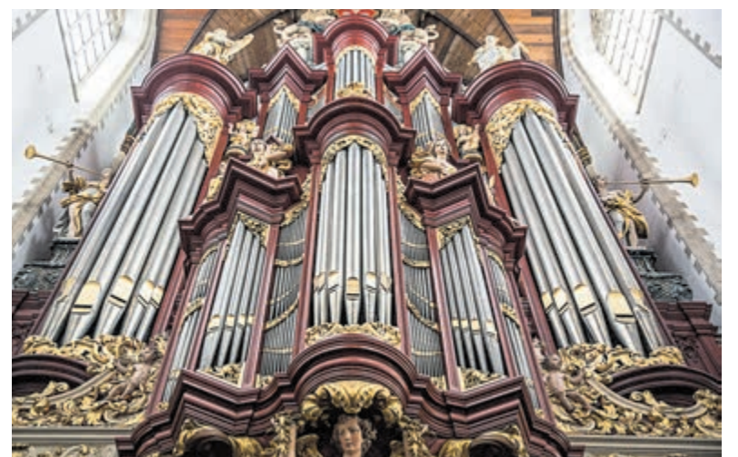
Dit jaar is er ook weer een reeks lunchconcerten op het wereldberoemde Müller-orgel.