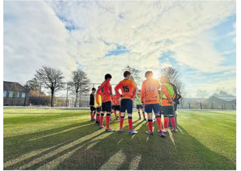
Huidige JO13 team SV Vogelenzang.

Nieuw sportpark De vereniging beschikt over een recent vernieuwd sportpark, enthousiaste trainers en een grote groep betrokken vrijwilligers die samen zorgen voor een warme en gemoe-