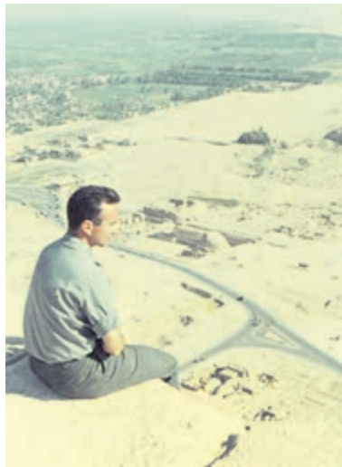
In Egypte, 1964.

Aerdenhout - "In 1964 hebben mijn vrouw en ik - pasgetrouwd - een reis gemaakt naar Egypte. Onlangs vond ik weer de oude dia's en film. We waren de piramide van Cheops op geklommen en hadden de koningsgraven in de woestijn bij Luxor op