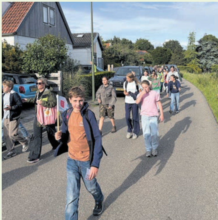
De paden op, de lanen in, hier op de Zandlaan.

mocht de pret niet drukken. De laatste avond werden alle deelnemers muzikaal onthaald door vrolijke noten van fanfare KNA en Brandweer Bennebroek. Trots ontvingen alle deelnemers hun medaille, dit jaar zelfs iemand voor de 10e keer van een aantal juffen en meesters van de scholen. Daarna was het tijd voor feestvieren en genieten van spelletjes, een hapje en een drankje op het terrein van de BSM. Na zo een succesvolle editie gaat de organisatie even nagenieten maar kijkt ze ook alweer uit naar komend jaar.