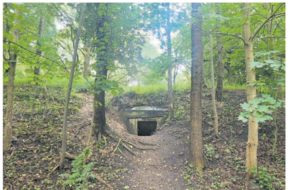
Een verscholen manschappenbunker waar zich het dagelijkse leven van de soldaten afspeelde.