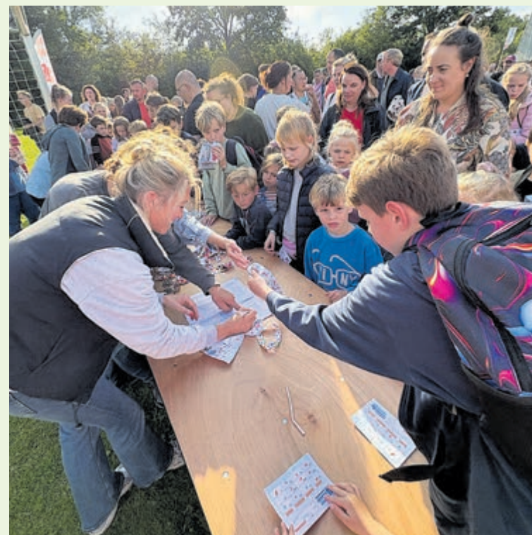
Feestvieren na de finish.