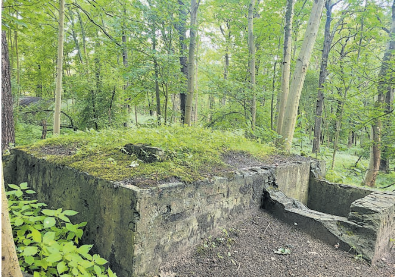
De bunkers die de soldaten beschermden, bieden nu onderdak aan vleermuizen.

De app 'natuurgeheimen' is gratis te downloaden en biedt verschillende wandelroutes met 3D-audio. Meer informatie over het landschap: np-zuidkennemerland.nl .