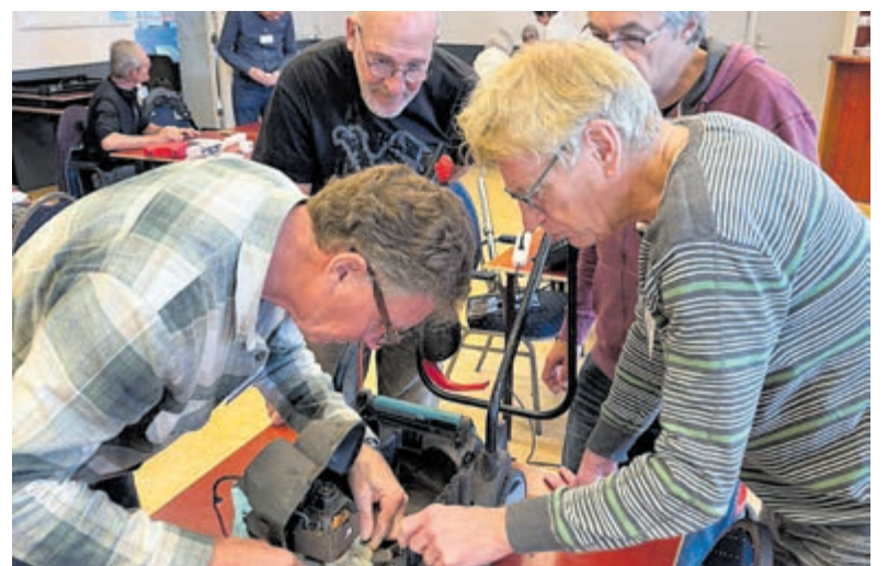
Reparateurs buigen zich over een object.

De computertechnicus is aanwezig voor IT vragen. Eenvoudige koffieapparaten kunnen vaak gerepareerd worden maar volautomatische koffiezetters moet men vooraf aanvragen op haalbaarheid. Geen TV- toestellen. De activiteiten zijn in principe gratis maar een vrijwillige bijdrage voor de onkosten zoals o.a. het gebruik van de zaal en speciale gereedschappen wordt zeker op prijs gesteld. Het Repaircafé is geopend van 10.00 tot 13.00 uur. Het Dorpshuis van Vogelenzang vindt u aan de Henk Lensenlaan 2. Er is ruime parkeergelegenheid. Aanleveren van defecte artikelen kan tot 12.15 uur. Er is een gezellige koffie-praattafel voor de wachtenden. Voor vragen of een bijzondere reparatie haalbaar is: repaircafevogelenzang@gmail.com of bel/sms naar 06-53561413.