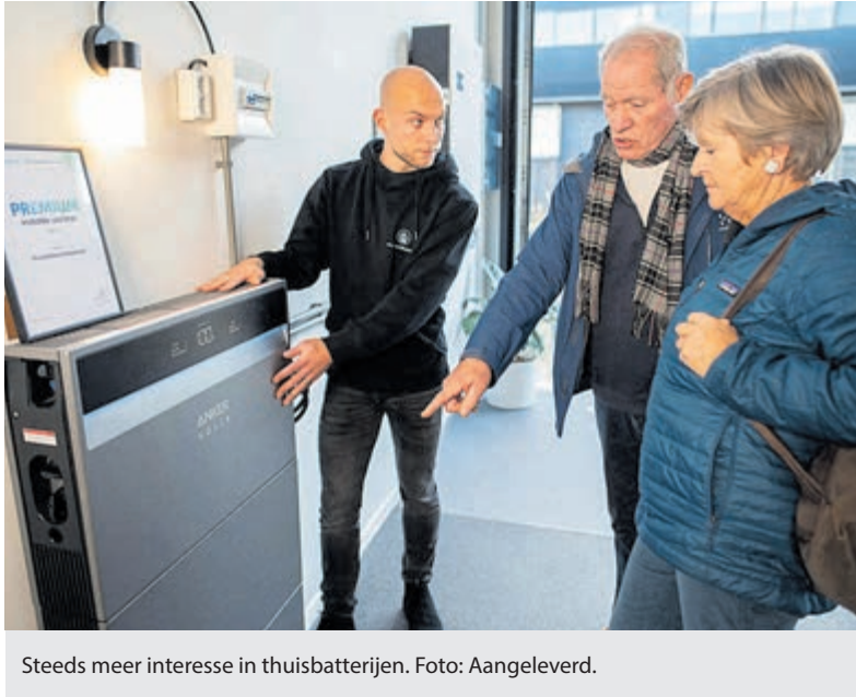
Steeds meer interesse in thuisbatterijen.