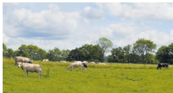
Grazende vleeskoeien van het ras Charolais.