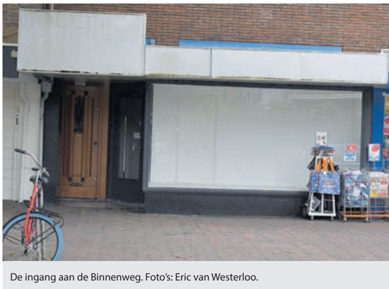
De ingang aan de Binnenweg.

Het onderwerp van de besloten vergadering werd niet bekendgemaakt. Alle raadsleden hielden dan ook hun kaken stijf op elkaar. Wat wel bekend was dat de vergadering ruimtelijke ordening als onderwerp had. Er spelen niet veel urgente zaken op dit moment zoals het Manpadslaangebied, en het voormalige postkantoor. De urgentie van het onderwerp doet vermoeden dat het hier gaat over het al dan niet toestaan van flitsbezorger in Heemstede. Getir gaat binnenkort op de Binnenweg een filiaal openen. Daar is de buurt niet blij mee en ook de ondernemers op de Binnenweg zien het bedrijf, dat niet echt een winkel is, niet zo zitten. Het vermoeden bestaat dat de gemeente dit soort bedrijven wil weren uit Heemstede. Het is mogelijk dat zelfs Getir, dat over twee weken wil starten, zich niet in Heemstede mag vestigen. Volgens de burgemeester zal een publicatie in de Staatscourant