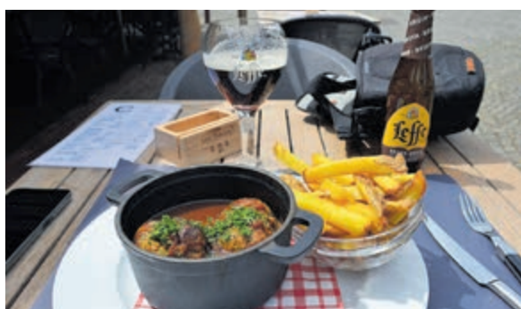
Les boulets à la Liégeoise.