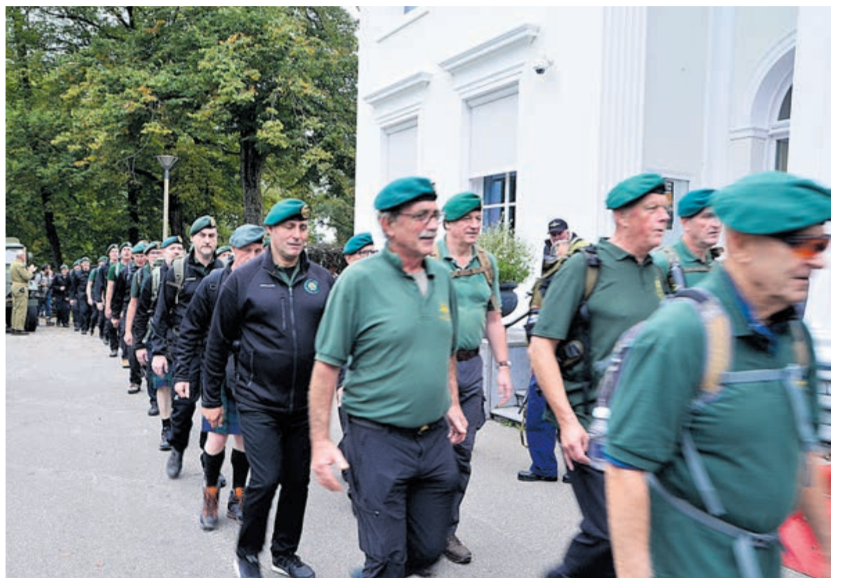
Aankomst van de commando's op het gemeentehuis na een mars van 20 km door de duinen. Foto aangeleverd.

De marslopers lopen om 12.15 uur van Parnassia richting gemeentehuis. Om 14.00 uur wordt daar de algehele ontvangst verwacht - hier is publiek welkom - en om 15.15 uur vertrekt het hele gezelschap voor het defilé naar het oorlogsmonument aan het Wildhoeftplantsoen. Ook hier zijn belangstellenden welkom. Daar