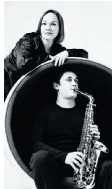
Zondag 12 juni vindt er een concert plaats door twee Russische musici die met hun muziek de oorlog in Oekraïne veroordelen en gevlucht zijn uit Rusland.

Het programma heeft een verrassende setlist met het Rondo of our times van Nazaykinskaya, een sonate van Beethoven, de Symphonis