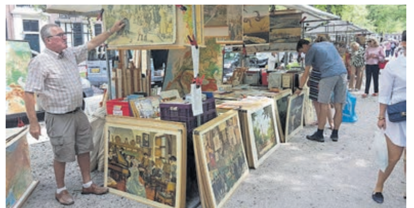
Oude schoolplaten en Verkade-albums.

Expositie raadzaal in raadhuis Heemstede kunstenaar Esther Schnerr: aquarellen en tekeningen. Toegankelijk tussen 9-17u tijdens werkdagen.