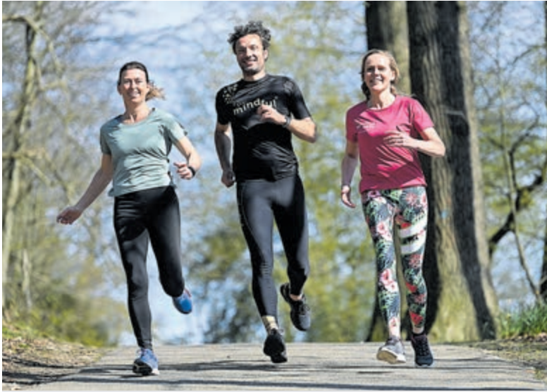
Clinic Mindful Running.

"Mindfulness is het bewust aandacht geven aan het huidige moment, zonder hierover te oordelen en het geeft je meer energie en minder stress." De Mindful Running clinic laat je kennismaken met de verschillende facetten van het hardlopen en leert jou te luisteren naar je eigen lichaam. Jij wordt je bewust van je eigen loophouding, je aandacht bij het hardlopen en de kracht en energie in je lichaam. Door meer in het 'hier en nu' te lopen maak je het hoofd leeg en geniet je meer van het moment. Tijdens de clinic ga je lekker lopen door de natuur waarbij de fun factor hoog is en je hardlopen anders gaat beleven. Je ervaart dat je meer energie krijgt door een betere adem-