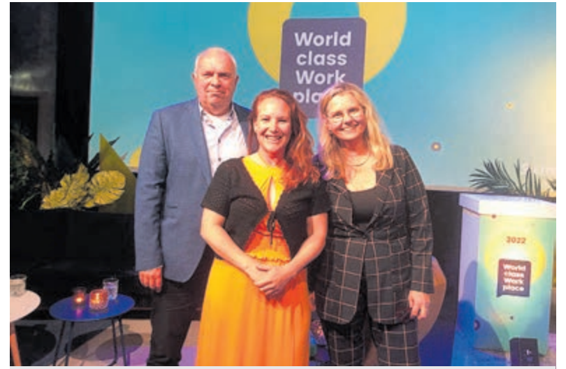
Verkiezing Beste Werkgever in de Gehandicaptenzorg.