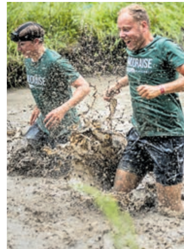
Mudraise van 2021.

lokale overheden, ruim 60.000 kinderen, vrouwen en mannen uit situaties van geweld en slavernij. Deelnemers kunnen zelf kiezen voor welk doel ze fondsen werven, bijvoorbeeld de strijd tegen slavernij in de Ghanese visindustrie of tegen seksuele uitbuiting van Filipijnse kinderen voor webcams. Dit jaar kunnen deelnemers ook fondsen werven voor IJM's programma om mensenhandel in Europa tegen te gaan. Het is nog steeds mogelijk om deelnemers van de Mudraise te sponsoren en zo bij te dragen aan de strijd tegen slavernij wereldwijd. Voor meer informatie: www.mudraise.nl .