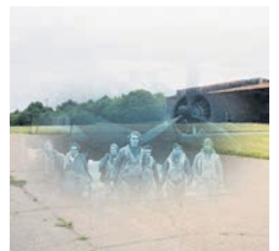
Spookverschijningen rondom luchthavens. Foto aangeleverd.