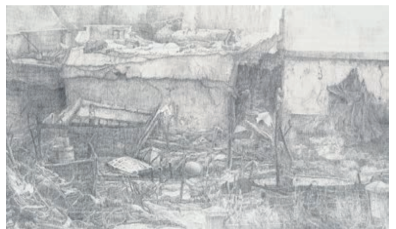
Werk van Esther Schnerr. Foto's aangeleverd.