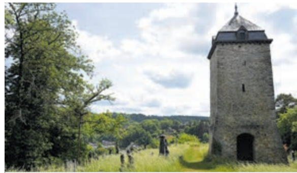
De Sint-Maartensstoren, een stukje historisch erfgoed.