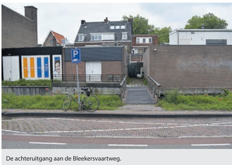
De achteruitgang aan de Blekersvaartweg.

de achterdeur aan de Blekersvaartweg de uitgifte te laten plaatsvinden om zo overlast aan de Binnenweg te voorkomen. De bewoners aan de Blekersvaartweg zijn, zoals mocht worden verwacht, hier niet over te spreken. Getir blijkt op dit moment onvoldoende informatie te hebben om vragen te kunnen beantwoorden.