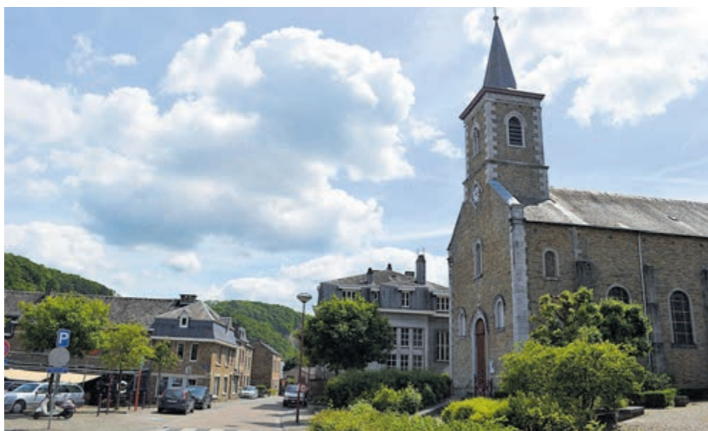
Het centrum van Comblain-au-Pont.