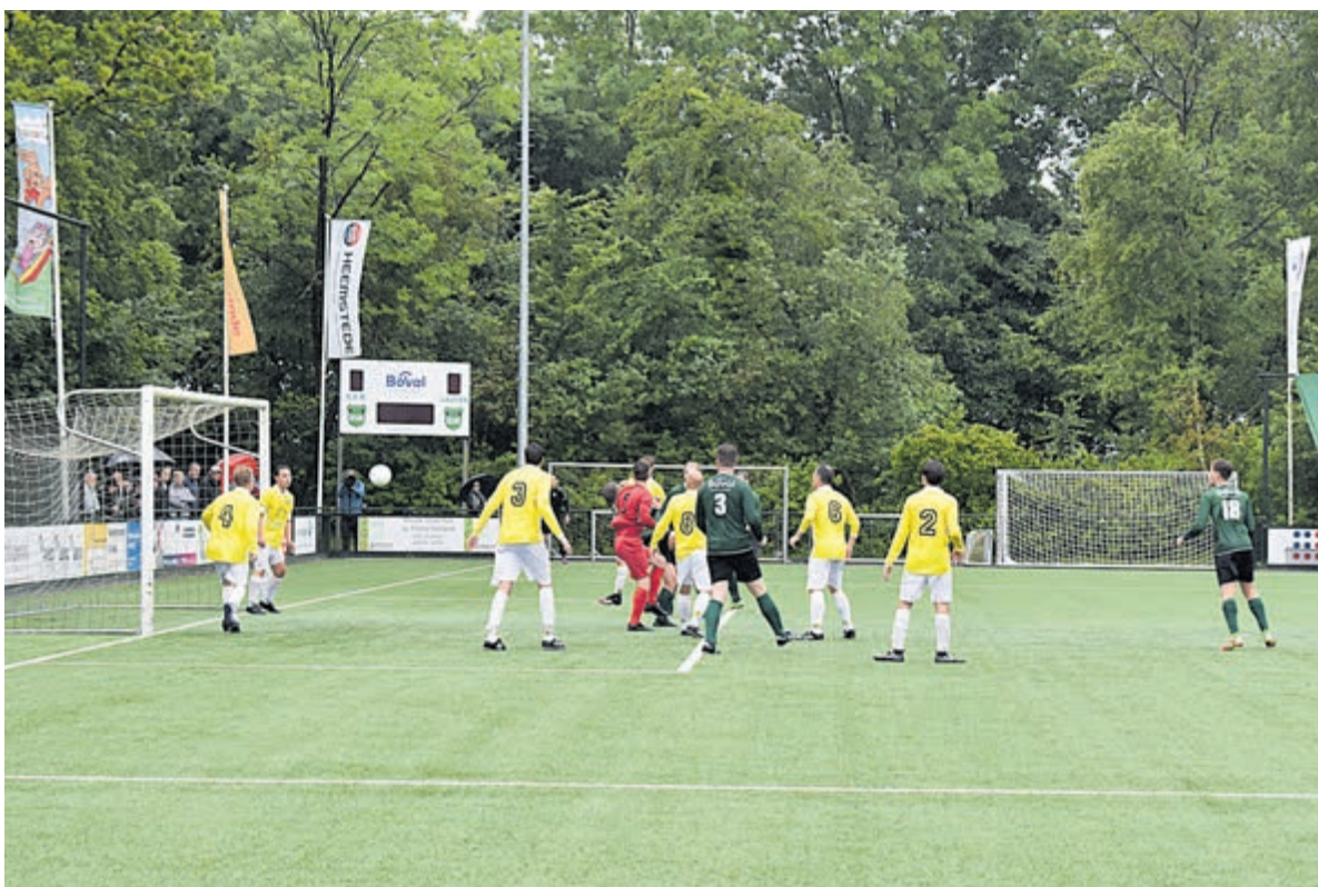
1e doelpunt BSM in de maak.

Ook RCZ won de laatste wedstrijd en zijn dus kampioen. BSM heeft een periodetitel op zak en maakt zo, via de nacompetitie, nog steeds kans op promotie. Een prima seizoen sloot BSM met deze laatste gewonnen wedstrijd af.