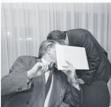
'Nederland Gidsland'. Foto aangeleverd.

programma en de bewoonster van een, door de aardbevingen getroffen, boerderij in Groningen vecht voor een schadevergoeding.