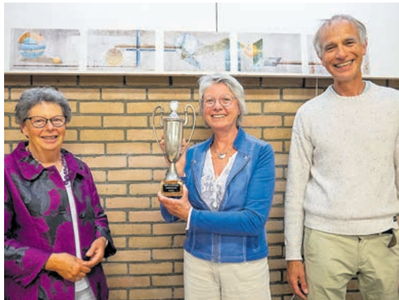
'Vijf foto's verhaal'.

Zie www.fotogroephaarlem.nl voor meer informatie.