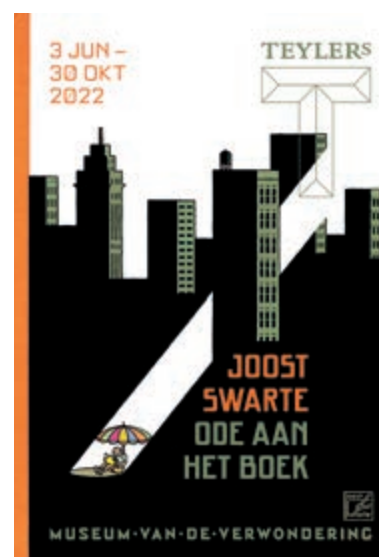
Joost Swarte: Ode aan het boek.

Meer informatie over de Stripedagen Haarlem is te vinden op: stripdagenhaarlem.nl .