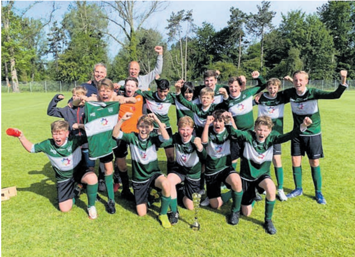
Gelukkige gezichten na de overwinning. Foto aangeleverd.