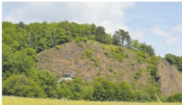
De Zwarte Rotsen, het oudste natuurreservaat van België.

België kent ook een gerenommeerde en een gastvrije gastronomische cultuur van goed eten en drinken. Beroemd zijn natuurlijk de speciale Belgische biere. De nabijgelegen stad Luik (Liège) kent een ware culinaire traditie. Veel gerechten uit deze stad worden in de lokale etablissementen met liefde en passie vers voor je bereid en geserveerd. Wat te denken van het dessert Luikse koffie 'Café Liégeois' of de vermaarde en unieke Luikse gehaktballen 'les boulets à la Liégeoise'? Deze moet u zeker proeven. Uniek ingrediënt van de Luikse gehaktballen is de 'vrai sirop de Liège'. Dit is een uniek recept boordevol fruit, ontwikkeld in 1937 met appels, peren, dadels. Afijn, je moet het zelf allemaal maar eens gaan proeven: de Belgische Ardennen heten je van harte welkom!