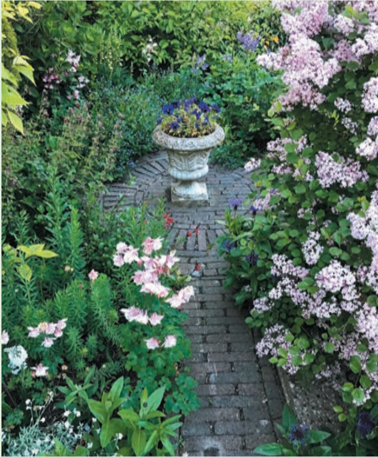
Een romantisch terras omzoomd met lichtgekleurde bloemenpracht.

Iedereen met een tuin(tje) uit Heemstede en Bloemendaal kan meedoen én kansmaken op een geweldige tuinbon van 100 euro, beschikbaar gesteld door Tuincentrum De Oosteinde. Vertel in het kort wat over uw tuin of balkon en mail dit samen met een of meer tuinfoto's, voorzien van naam, adres en telefoonnummer naar redactie@heemstede.nl , onder vermelding van 'Tuinenwedstrijd'. U kunt inzenden tot en met zondag 31 juli. De mooiste inzendingen van tuinen of balkons krijgen een ereplaatsje in onze krant. De winnaar wordt in augustus bekendgemaakt. Over de uitslag wordt niet gecorrespondeerd. Heel veel succes!