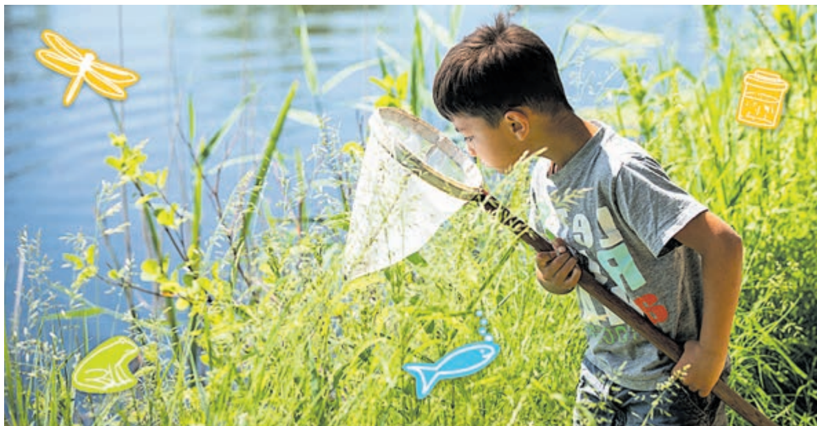
Slootjesdagen 2022.