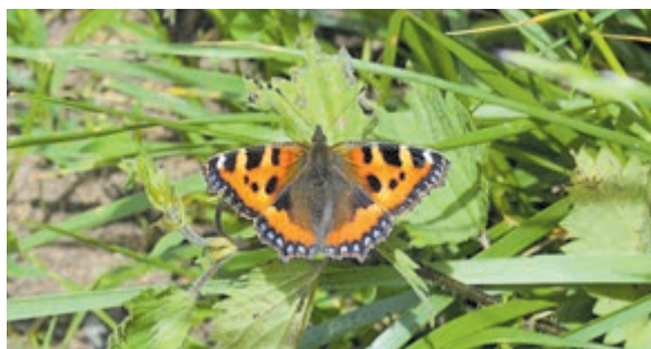
De kleine vos is hier vrij talrijk dit seizoen.