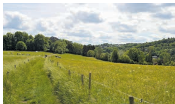
Een en al landelijkheid in de Belgische Ardennen.