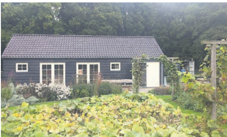
Tot eind september alle zondagmiddagen geopend.

oud. Het doel is kinderen, ouders/grootouders en mindervaliden te onderrichten over de natuur en gezonde voeding. Info op: www.kominmijntuin.com .