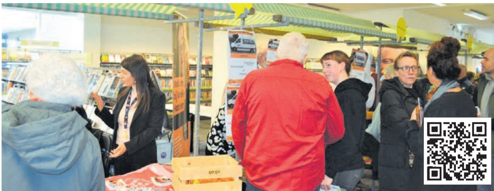
Werkzoekenden en werkgevers zoeken elkaar op.

Werkgevers kunnen zich aanmelden via de site van het WerkgeversServicepunt ( www.wspzki.nl/evenementen/werkfestival ) voor het Werkfestival. Werkzoekenden kunnen terecht op de evenementenpagina van ZKIJ Werkt Door ( https://zkiwwerktdoor.nl/event/werkfestival ).