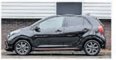
Kia Picanto 1.0 DPI GT-Line € 17.900,-