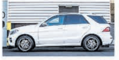
Mercedes-benz M-klasse 350 € 34.950,-