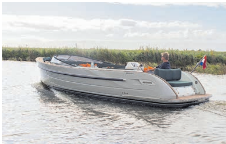
De nieuwe Antaris Seventy5.

Meer informatie vindt u ook op: www.poelgeest.nl .