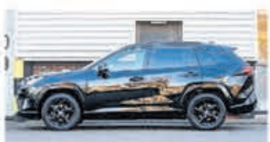
Toyota RAV4 2.5 Hybrid AWD Enrg+ € 38.950,-