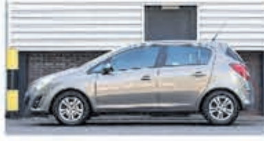
Opel Corsa 1.4-16V Cosmo € 5.900,-