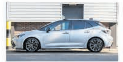
Toyota Corolla 2.0 Hybrid Dynamic € 26.700,-