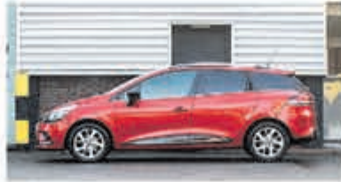
Renault Clio Estate 1.2 TCe Zen. € 15.950,-