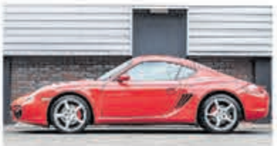
Porsche Cayman S Tiptronic Uniek 80.000 km € 29.950,-