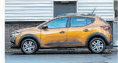
Dacia Sandero 1.0 TCe Comfort € 22.950,-