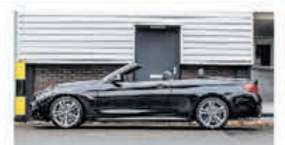
BMW 4-serie Cabrio 440i Cent Hi Exec € 41.950,-