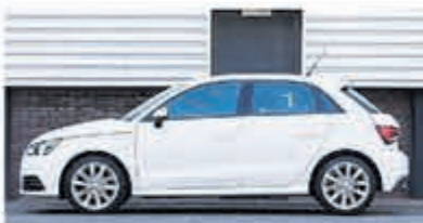
Audi A1 Sportback 1.0 TFSI Adrenalin € 14.900,-