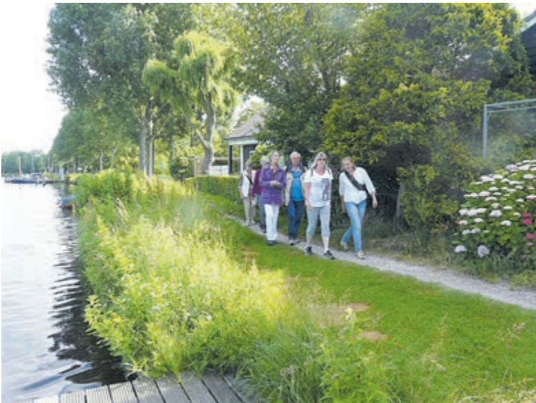
Samen wandelen door het groen met buurtgenoten.

De gratis wandelingen van Gezond Natuur Wandelen in Noord-Holland worden mede mogelijk gemaakt door het Oranje Fonds, Brentano's Steun des Ouderdoms en Provincie Noord-Holland.