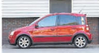
Fiat Panda 1.4 16V Sport € 4.950,-