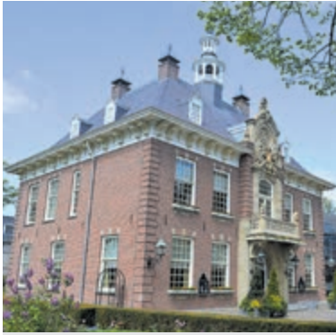
Raadhuis Heemstede.

Inwoners kunnen tot en met 9 juli een aanvraag indienen via heemstededuurzaam.nl/energie-initiatief .