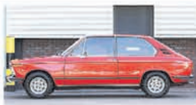
BMW 02-serie 1802 Touring € 14.950,-