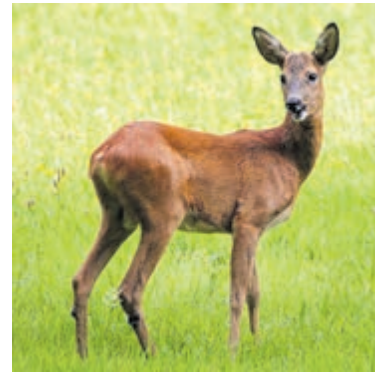
Ree op Leyduin.

des te groter de kans dat je reeën ziet. Trek zoveel mogelijk donkere, onopvallende kleding aan. Denk wel om goede kleding, het kan later op de avond nog behoorlijk koud worden. Een leuke excursie voor het hele gezin die op zondagavond 4 juni wordt gehouden. Verzamelen om 21 uur bij Infocentrum De Kakelye, parkeerterrein Buitenplaats Leyduin, Woestduinweg 4 in Vogelenzang. Zin om mee te gaan? Aanmelden op www.gaatumee.nl .