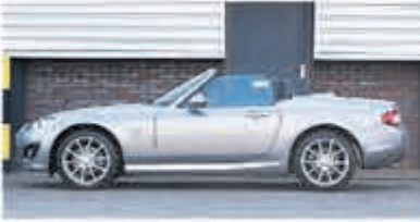
Mazda MX-5 2.0 S-VT Executive € 17.950,-