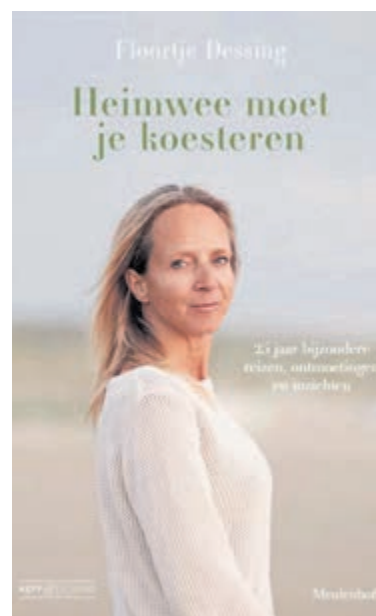
Boekomslag 'Heimwee moet je koesteren' van Floortje Dessing.

In 'Heimwee moet je koesteren' blikt ze terug op vijftientig jaar reisprogramma's maken.