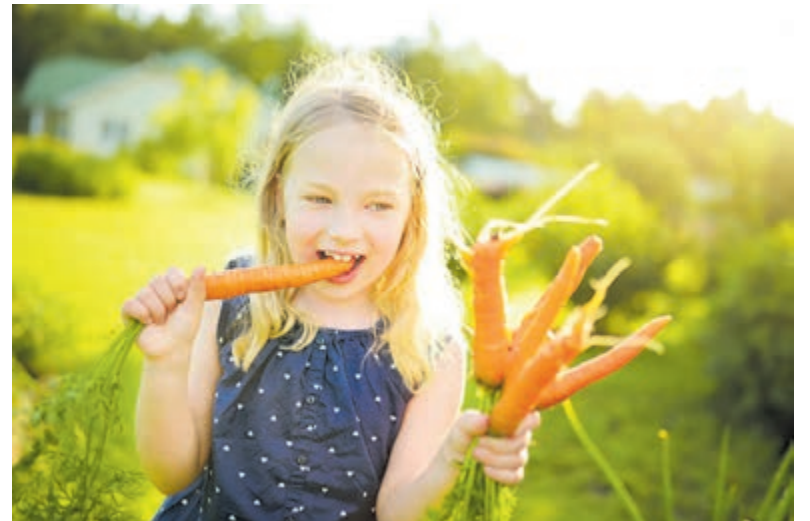
'Ieder Kind een schooltuin'

Het motto van de tweede editie van de Week van de Schooltuin is: samen zaaien, samen groeien. Leerlingen,