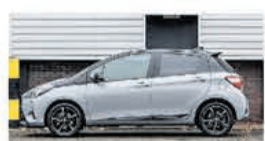
Toyota Yaris 1.5 Hyb Bi-Tone Plus € 17.950,-