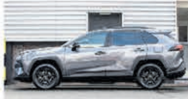
Toyota RAV4 2.5 Hybrid Dynamic € 36.900,-