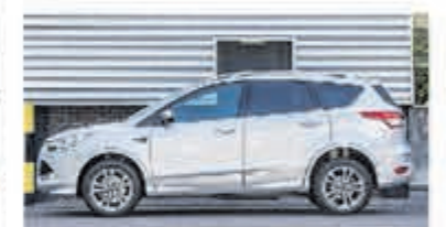
Ford Kuga 1.6 Titanium Pl. 4WD € 17.900,-