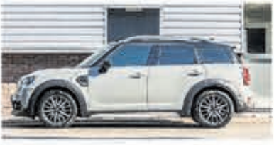
Mini Countryman 2.0 Cooper D € 16.950,-