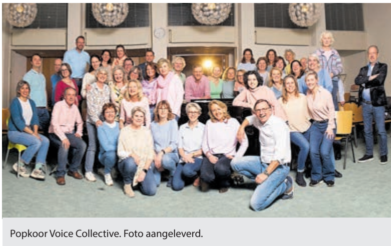
Popkoor Voice Collective. Foto aangeleverd.

Er was tijdelijk geen treinverkeer mogelijk. De weg werd gestremd om de situatie veilig te stellen.