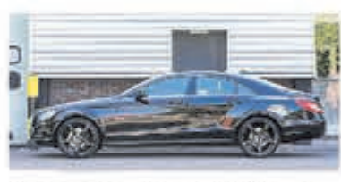
Mercedes-benz CLS-klasse 350 € 20.750,-