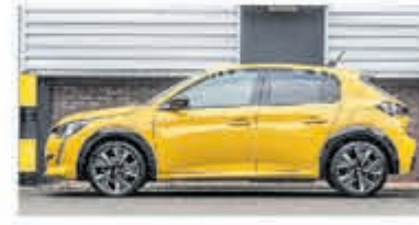
Peugeot 208 1.2 PureTech GT-Line € 25.950,-