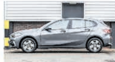
BMW 1-serie 116d Sp.Line Edition € 25.950,-