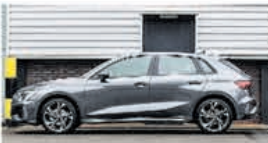
Audi A3 Sportback S Line edition € 42.950,-