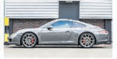
Porsche 911 3.8 Carrera S € 84.900,-