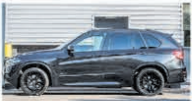
BMW X5 xDrive40e M Sp. Ed. € 56.900,-