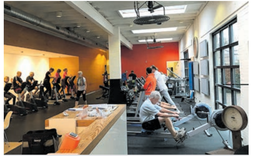
Een gezellige ochtend bij Sportschool FM HealthClub.

FM HealthClub is te vinden aan de Kerklaan 113C, achter De Zwart, in een van Heemsteeds oudste panden.