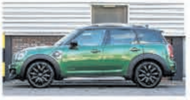
Mini Countryman 1.5 Co.S E ALL4 Chill € 35.950,-