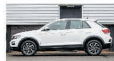
Volkswagen T-Roc 1.0 TSI € 20.950,-

Turenhout de occasiondealer van Heemstede en al meer dan 40 jaar uw vertrouwde onderhoudsadres.