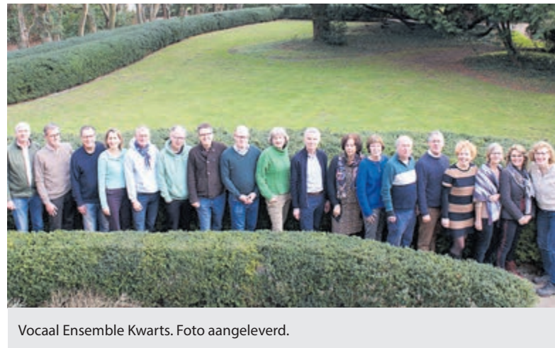
Vocaal Ensemble Kwarts.

Spaarndam - Met de zomer in aantocht, brengt Vocaal Ensemble Kwarts op 3 juni een ode zowel aan de lange avonden, die romantische fantasieën bij de dichters en musici aanwakkeren, als aan de kortste nacht, die vooral in de Noordelijke landen uitbundig gevierd wordt. Het geloof wil dat er dan een link wordt gelegd tussen het verleden, het heden en de toekomst. Zo ook tijdens dit concert, dat stukken van de 18e-eeuwse Franse componist Jean-Philippe Rameau tot de hedendaagse Jaakko Mäntyjärvi laat horen.