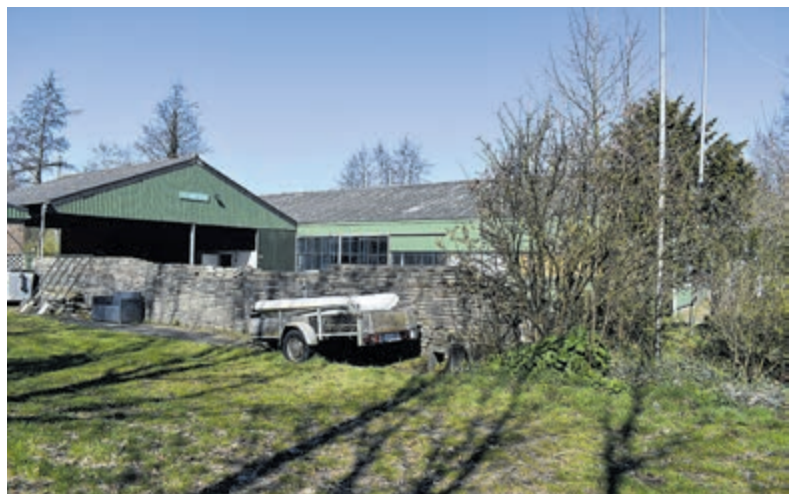
De twee opvanglocaties aan de Leidsevaartweg die komen te vervallen.