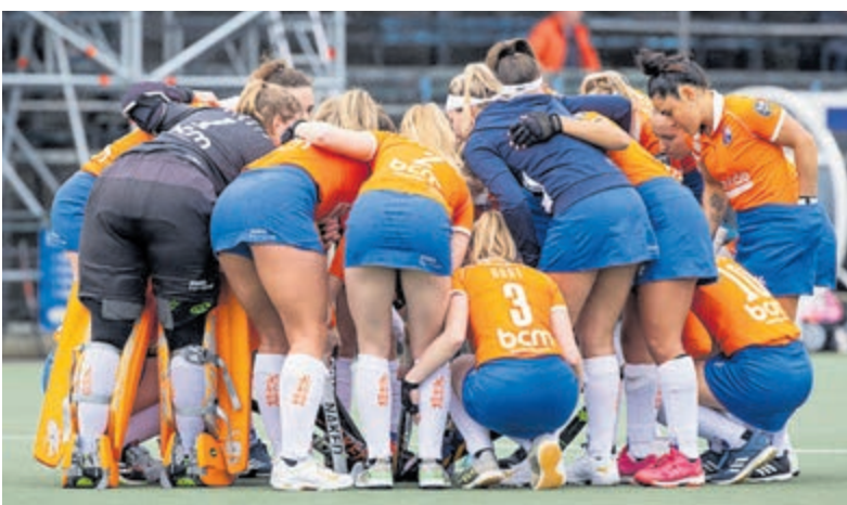
Het Dames 1-team.