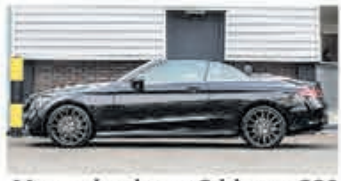
Mercedes-benz C-klasse 220 d Cabrio Premium Pack € 41.900,-