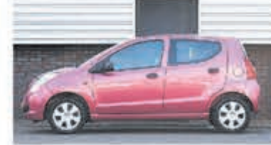
Suzuki Alto 1.0 Comfort € 4.700,-