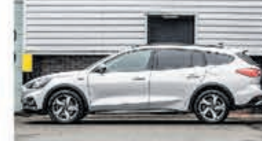
Ford Focus Wagon 1.0 EcoB. Tit. Bns € 25.900,-