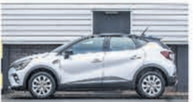
Renault Captur 1.6 Hybrid Intens € 28.950,-