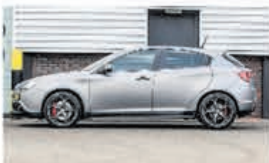
Alfa Romeo Giulietta 1.7 Tbi Quad. V. € 23.950,-