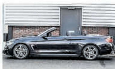
BMW 4 Serie 430i Cabrio € 49.950,-