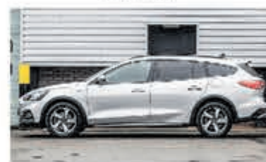
Ford Focus Wagon 1.0 EcoB. Tit. Bns € 27.900,-