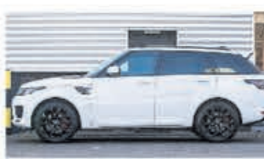
Land Rover Range Rover Sport P400e HSE € 102.950,-