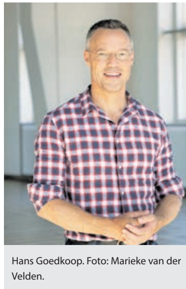
Hans Goedkoop.

Hans Goedkoop (1963), voorheen presentator van Andere tijden, De Gouden Eeuw en De IJzeren Eeuw, biograaf en schrijver, publiceerde 'De laatste man', over zijn grootvader en het verlies van Nederlands-Indië. Hij schreef het voorwoord bij 'Twijfel trainen' en 'Mijn betere ik van Renate Rubinstein'.