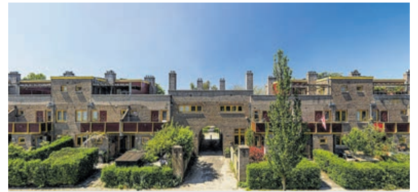
Architectuur van Van Loghem in Haarlem.

www.voor-keur.nl info@voor-keur.nl Tel. 085-0607065