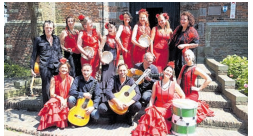
Flamencokoor Calle Real.

De overtocht naar het Forteiland duurt ongeveer 5 minuten en wordt verzorgd met de Koningin Emma, een zeewaardig passagierschip met een vaste ligplaats aan de Kop van de Haven in IJmuiden (Sluisplein nr. 78). Overige publieksdagen zijn op de zondagen: 3 juli, 7 augustus, 4 september, 2 oktober en 6 november en de woensdagen 13 en 20 juli en 10 en 17 augustus. Na de overtocht wordt u aan de steiger op het eiland ontvangen door gidsen van de vereniging Forteiland IJmuiden. Men kan in de Koepelzaal van het fort of op het aangrenzende buitenterras genieten van een drankje. Mindervaliden moeten er rekening mee houden dat het fort niet overal makkelijk begaanbaar is. Toegangskarten voor overtocht en rondleiding kosten € 14.50 per persoon. Karten kunnen vooraf worden besteld via internet: www.ijmuidenserdvaart.nl of telefonisch: 0255-511676.