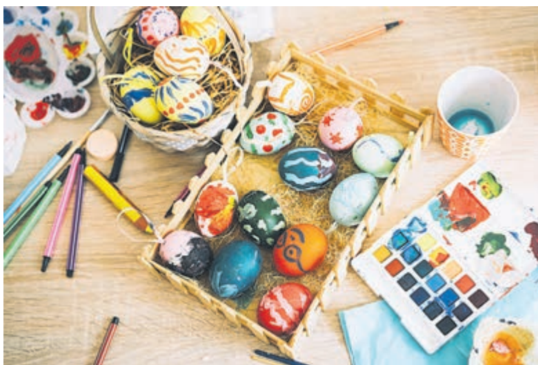
Paaseieren beschilderen met de bewoners in het Woonzorgcentrum. Foto aangeleverd.

Tover jij ook graag een glimlach op de gezichten van onze cliënten en revalidanten met jouw luisterende oor of helpende hand? Vrijwilligerswerk bij Sint Jacob kan op veel verschillende manieren. Kijk op sint-jacob.nl voor onze vacatures. Meer info? Mail naar jacobactief@sintjacob.nl of bel 023 892 29 00.