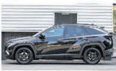
Hyundai Tucson 1.6 T-GDI PHEV PrSky € 43.950,-