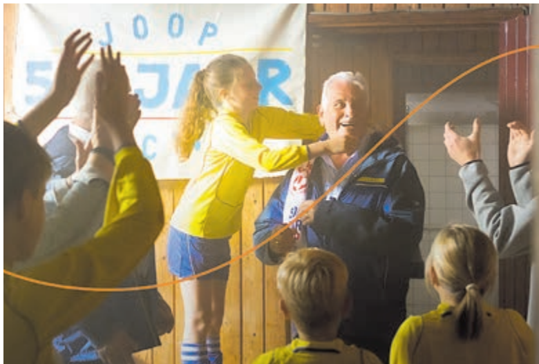
Schrijf ook jouw club in.

Vanaf 5 september kunnen Rabobankleden stemmen op hun favoriete club in de metropoolregio Amsterdam.