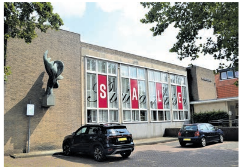
Het voormalig postkantoor aan de Binnenweg.

Drie erfgoedinstellingen hebben in oktober 2021 de monumentenstatus aangevraagd. Na een positief advies van de erfgoedcommissie sprak het college van burgemeester en wethouders in januari het voornemen uit het vroegere postkantoor aan te