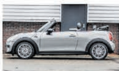
Mini Cooper Cabrio 1.5 C. Chili S. Bns € 25.950,-