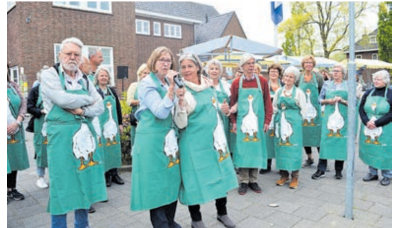
'Heemstede hapt' op 5 mei jl.