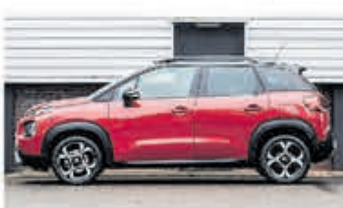
Citroën C3 Aircross 1.2 PT S&S Shine € 24.950,-