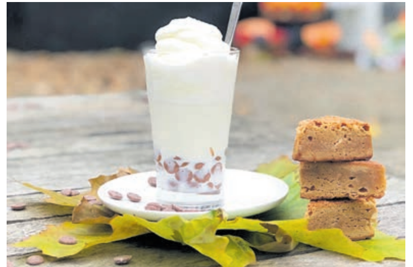
BosBar sluit de deuren.

Uitendaal vertelt: 'In het restaurant herleven pré-corona tijden. Dat bete-