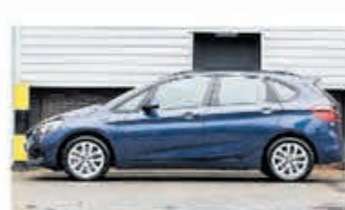
BMW 2-serie Active Tourer 225xe iP eDr. Ed. € 32.950,-