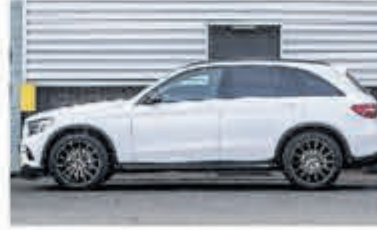
Mercedes-Benz GLC-klasse 250 d 4MATIC Luchtvering € 48.900,-