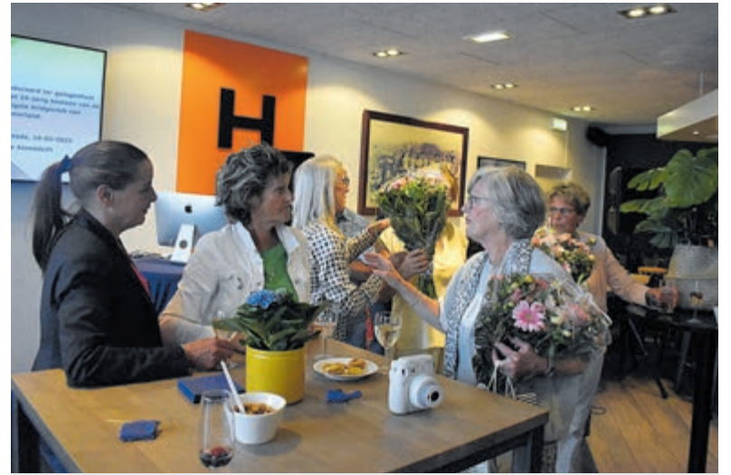
De bestuursleden van HBC Bridge krijgen voor hun inspanningen een bloemetje uitgereikt.

Ook interesse in de bridgesport bij HBC bridge? Neem contact op via hbcbridge@ziggo.nl .