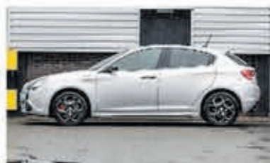
Alfa Romeo Giulietta 1.4 T Distinctive € 14.950,-