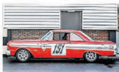
Ford Usa Falcon FUTURA SPRINT € 79.000,-