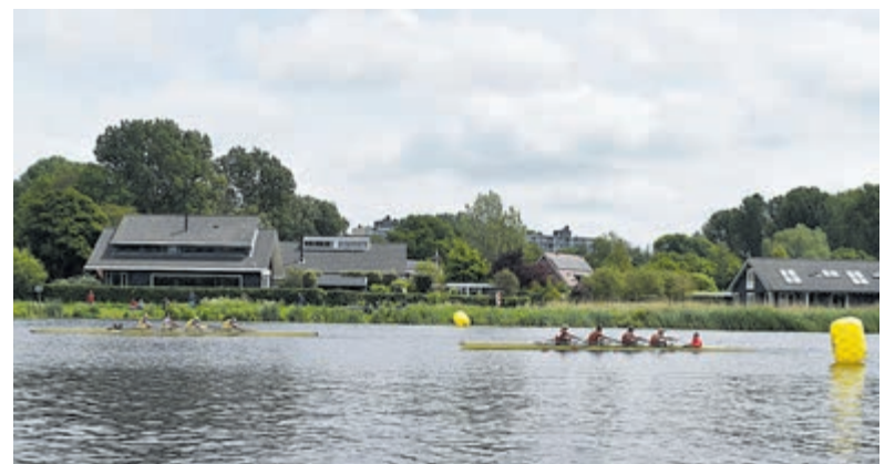
Spannende momenten tijdens de Lenterace.

Zaterdag 18 juni vinden de regiokampioenschappen voor niveau 5 en de oudere meisjes plaats.