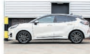
Ford Puma 1.0 EB Hyb ST-Line X € 25.750,-