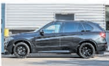
BMW X5 xDrive40e M Sp. Ed. € 59.900,-