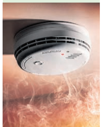
Rookmelders redden levens.