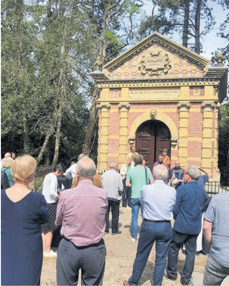
Betrokkenen bij de restauratie van de grafkapel kijken onder een heerlijk zonnetje toe. Even later mochten ze een speciaal biertje van Vollenhoven bier proeven.

De feestelijke heropening van de kapel kreeg extra glans door de aanwezigheid van Van Vollenhoven bier.