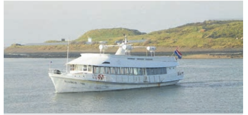
De overtocht naar het Forteiland wordt verzorgd met de Koningin Emma.