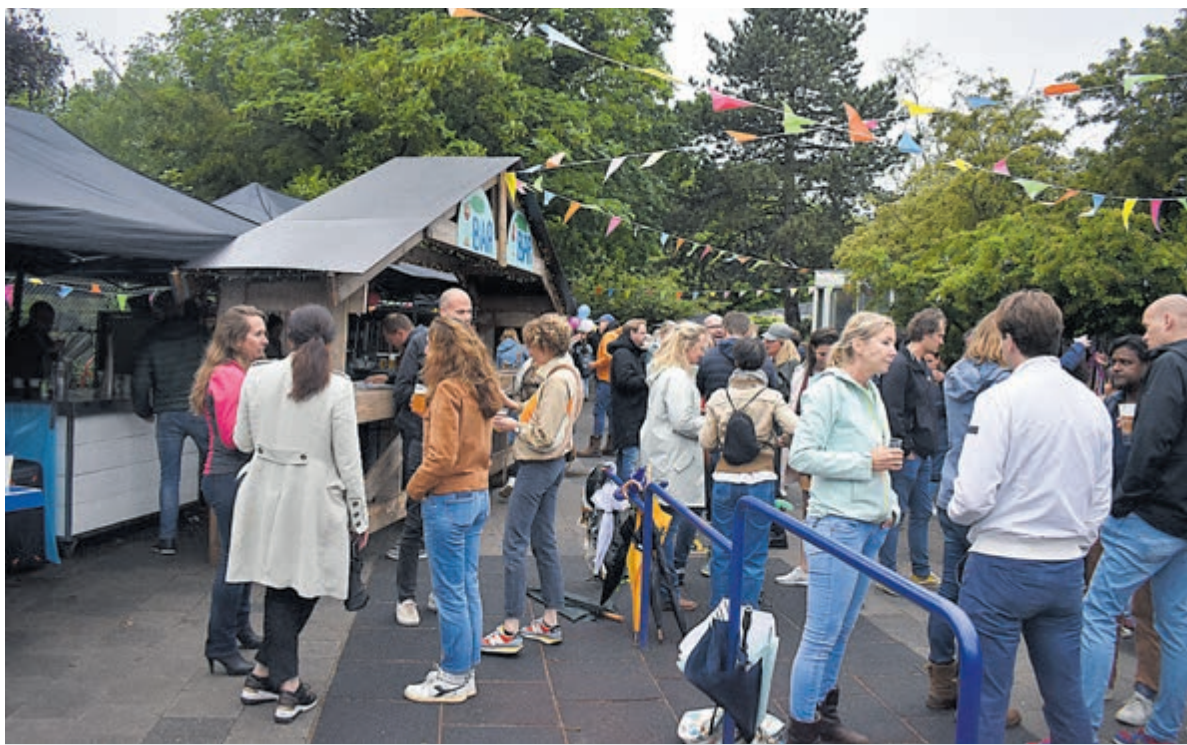
Vrolijk festival met activiteiten op Nicolaas Beetsschool.

De inwendige mens was zeker niet vergeten. De popcorn vond gretig aftrek net als de patatjes, pasta of poffertjes. De ouders konden zich laven aan de bar met bier en wijn. Een ijscoman had over klandizie niet te klagen. De kinderen renden van hot naar her. Er was zoveel te doen dat je moest opletten alle attracties aan het einde van de middag allemaal had bekeken. Soms ontstonden er rijtjes wachtenden, maar dat mocht de pret niet drukken. Heuse wegwijzers maakten het zoeken naar een volgende attractie een lekker