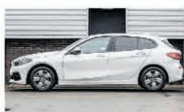
BMW 1-serie 118i € 26.900,-