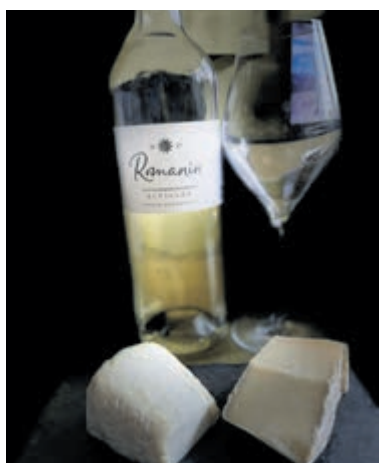
Kaas- en wijnproeverij.

belangen afgewogen en besloten het gebouw aan te wijzen als gemeentelijk monument.