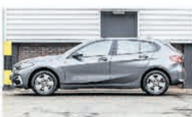
BMW 1-serie 116d Sp.Line Edition € 29.900,-