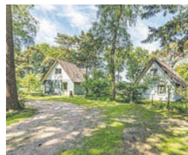
Het fraaie bungalowpark De Rietberg. Foto's: aangeleverd.

"Kleinschalig, knus, keurig verzorgd en midden in de natuur gelegen park". "De bungalows staan mooi ruim opgezet en er is dus rust en veel privacy voor iedereen", zijn enkele reacties van enthousiaste bezoekers die u al voor gingen. Nieuwsgierig geworden? U bent van harte welkom.