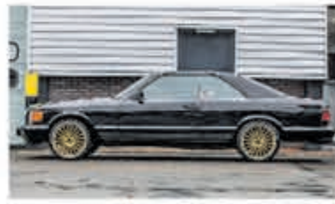
Mercedes-benz S-klasse 380 SEC € 10.950,-