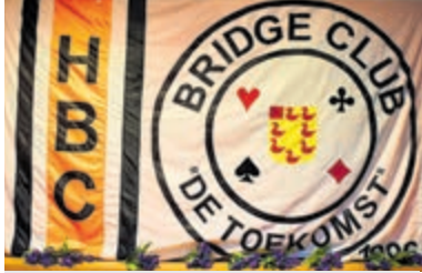
De vlag van HBC Bridge.

Heemstede - Het clubhuis van HBC voetbal De Toekomst bood afgelopen vrijdag 20 mei gastvrijheid aan de HBC Bridgeclub. De leden waren al eerder een dagje wezen varen in Amsterdam, met muziek en dans door de grachten. Dat op zich was al