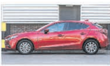
Mazda 3 2.0 S.A. 120 TS € 22.900,-