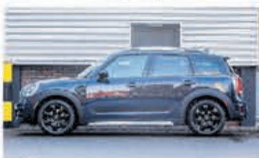
Mini Countryman 1.5 Cooper Salt € 24.950,-