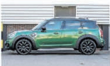
Mini Countryman 1.5 Co.S E ALL4 Chil € 38.900,-