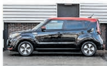
Kia E-Soul ExecutiveLine 30kWh € 19.950,-