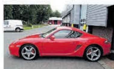
Porsche Cayman S Tiptronic Uniek 76.000 km € 29.950,-

Turenhout de occasiondealer van Heemstede en al meer dan 40 jaar uw vertrouwde onderhoudsadres.