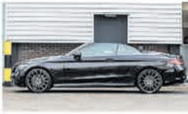
Mercedes-Benz C-klasse 220 d Cabrio Premium Pack € 48.900,-