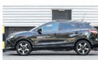
Nissan Qashqai 1.2 Tekna € 17.400,-