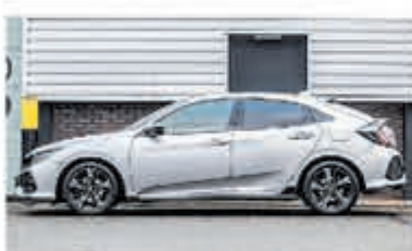
Honda Civic 1.5 i-VTEC Sport + € 24.950,-