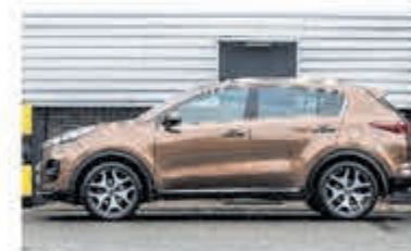
Kia Sportage 1.6 T-GDI 4WD GT-L. € 25.750,-