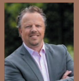
Alexander van der Pijl Dunweg Uitvaartzorg