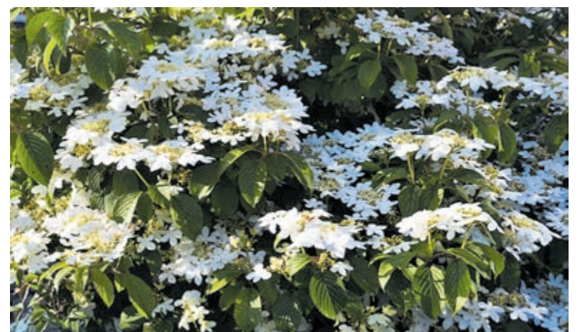
Tijd voor een Lentefair in deze bloeiende meimaand.

kaarsenhouders en lampen, auto-tjes en beelden. Ook kan de inwendige mens versterkt worden met onder andere versgebakken olieballen. De organisatie hoopt op veel gezelligheid en mooi weer. Voor informatie kan men terecht bij info@ac-media.nl .