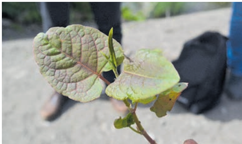
Zo ziet de hardnekkige Japanse duizendknoop ( Reynoutria japonica ) eruit.

Doe de verwijderde Japanse duizendknoop nooit in de groenbak, maar voer het maaisel af naar een gecertificeerd compostbedrijf. Kijk hiervoor op: https://bvor.nl/invasieve-exoten/ . Maak de maaimachine na iedere keer maaien zorgvuldig en grondig schoon, zodat er nooit resten van de plant achterblijven.