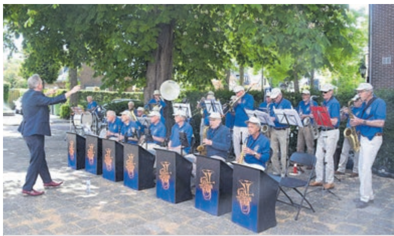
De Teisterband.

HVHB presenteert later dit jaar een cultureel historische wandeling, samen met Vrienden van het wandelbos Groenendaal.