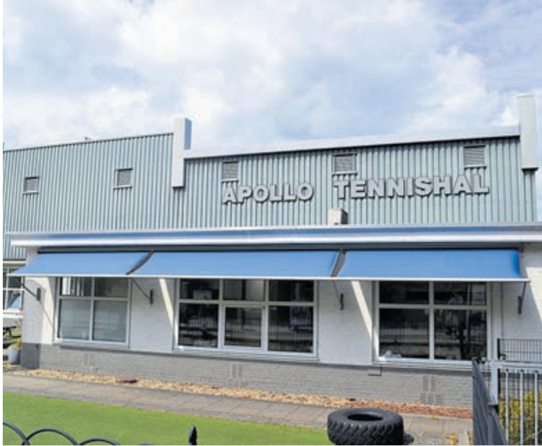
Apollo tennishal is verleden tijd.