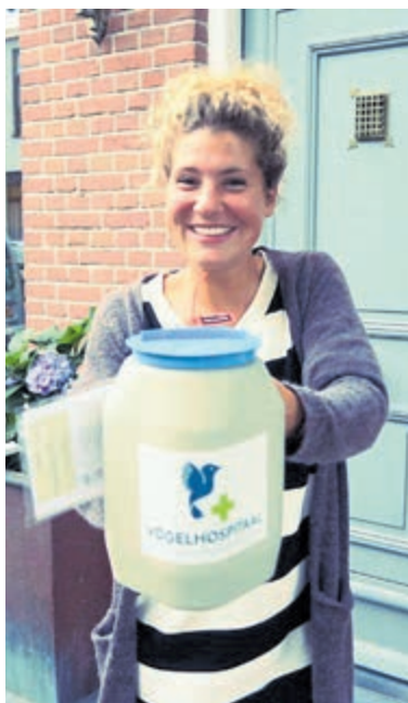
Alle kleine en grote beetjes helpen!

Aanmelden via e-mail: n.bromet@vogelhospitaal.nl/.