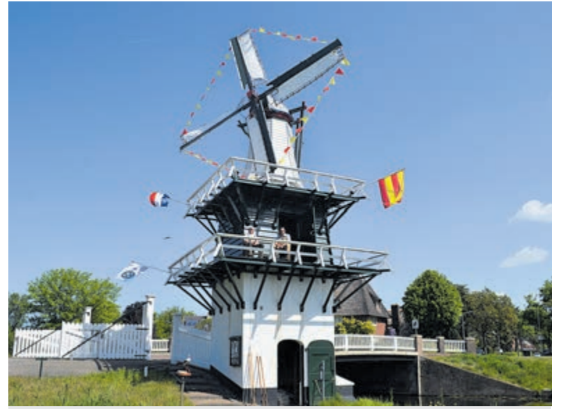
't Molentje in Groenendaal op Nationale Molendag.

Heemstede eigenaar van het Landgoed Groenendaal. 't Molentje werd daardoor weer regelmatig opgeknappt. In 1989 onderging 't Molentje een algehele restauratie, waarna het beheer van de molen werd overgenomen door Stichting Molens Zuid-Kennemerland (SMZK). In 1997 werd de vijzel opnieuw aangebracht. Er vonden twee jaar geleden grote restauratiewerkzaamheden plaats, waarbij op de molen zelf in de kap het bouwjaar en het jaar van de laatste restauratie in een rood schildje zijn aangebracht, te weten 1780-2020.