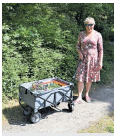
Wagentjes vol met aankopen werden gespot.

Heemstede – Een heerlijk zonnige meidag op Kom In Mijn Tuin (KIMT), waar zaterdag 14 mei tot 15 uur een gezellige (moes)tuinmarkt plaatsvond.