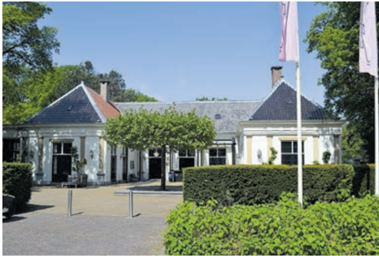
Landgoed Groenendaal in de fraaie meimaand.

Geniet van het viergangenmenu vol smaken van de lente en tussen de gangen door speelt de bigband heerlijke klassiekers als Summertime, Fly me to the Moon, Somewhere over the Rainbow en Blueberry Hill maar ook het wellicht minder bekende maar wunderschone L'il Darlin van Neil Hefti. SBBK-voorzitter en trombonist Ben van Rooijen blikt alvast vooruit op het weerzien bij Groenendaal: