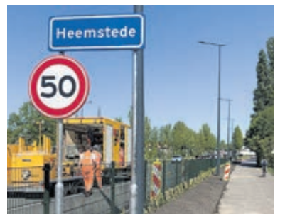
Het verplaatste kombord.

Met het verplaatsen van de komgrens is het mogelijk geworden de Cruquiusweg van 80 km/uur naar 50 km/uur om te vormen. "Het is een lang gekoesterde wens. Er is hard aan gewerkt om de snelheid op deze plek te verlagen om zo de verkeersveiligheid en de leefbaarheid te vergroten", aldus wethouder Mulder.