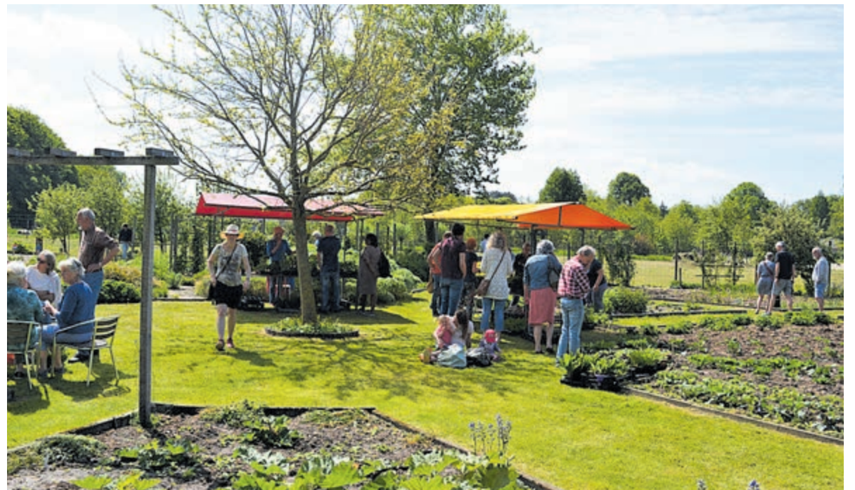
Gezellige (moes)tuinmarkt op KIMT.

Meer informatie over KIMT op www.kominmijntuin.com of op Facebook Kom In Mijn Tuin.