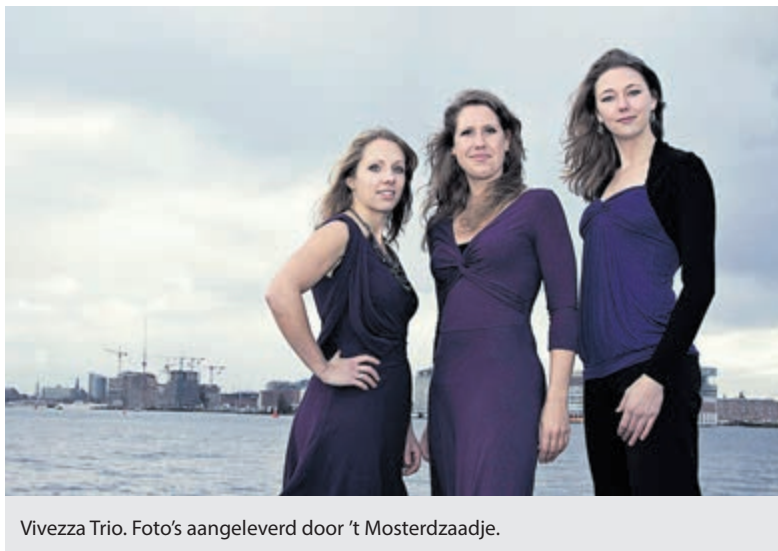
Vivezza Trio.