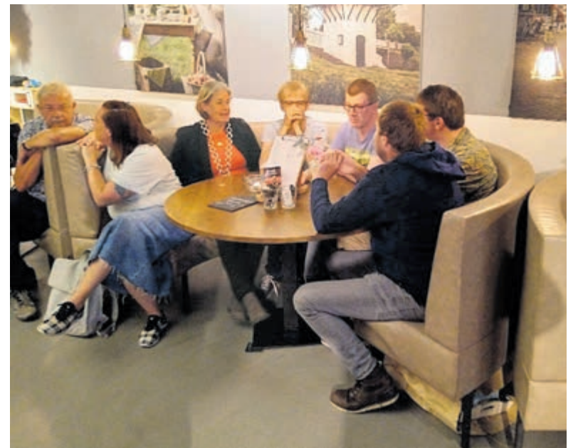
Lustrumfeestje Stichting Woonproject Heemstede. Foto aangeleverd.

Voor alle activiteiten: toegang vrij. Reserveren via info@boekhandelblokker.nl en/of 023-5282472.