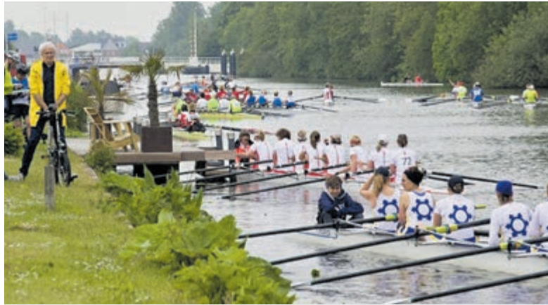
Spaarne Lenterace 2018.

het Marisplein, tegen de grens met Haarlem, zullen die dagen volstaan met botenwagens. Ook het vaargebied van de ringvaart vanaf de Bennebroekerbrug tot het Spaarne voorbij de Crayenestervaart zal per dag twee keer twee uur afgesloten zijn voor bootverkeer. De precieze tijden staan op www.hetspaarne.nl/stremming . Voor meer informatie/locaties zie: www.lenterace.nl en www.hetspaarne.nl of volg Lenterace op Facebook: facebook.com/lenterace .