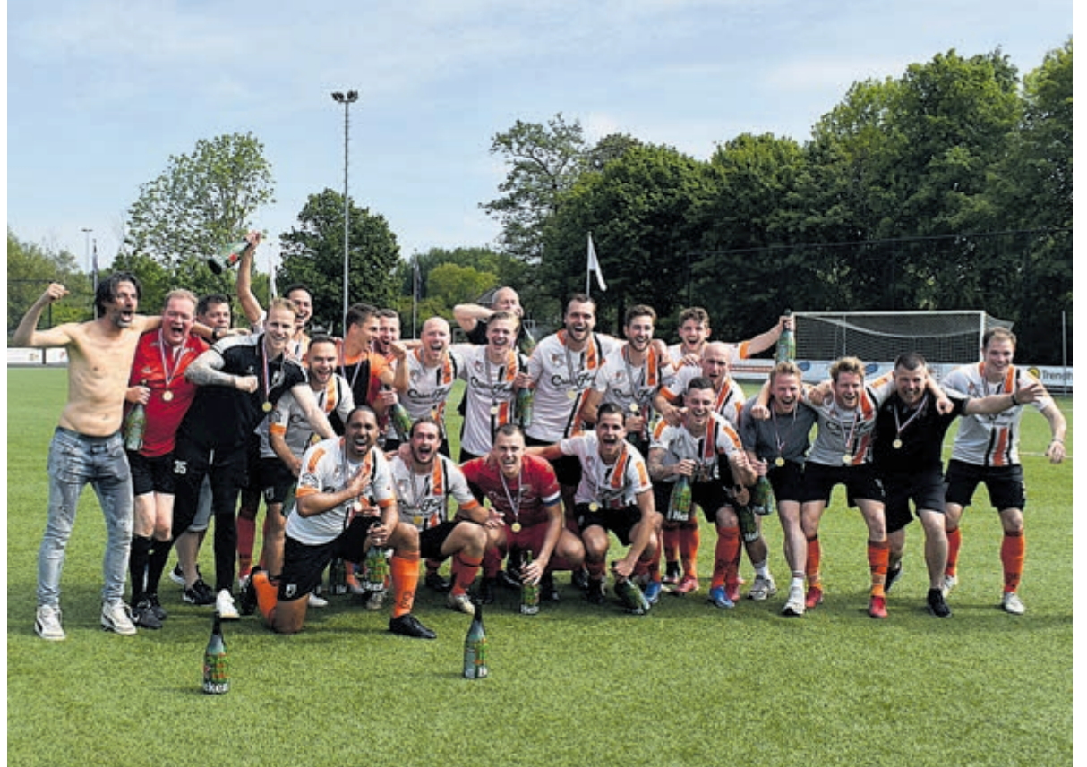
Kampioensploeg HBC.

Voordat de KNVB de oorkonde en de medailles kon uitreiken, moest er nog wel even gewonnen worden van ASC uit Oegstgeest. Hoewel er vooraf geen spanning te bespeuren was bij staf en spelers, weet je het maar nooit. Een offday kan altijd roet in het eten gooien. Als er al een last op de