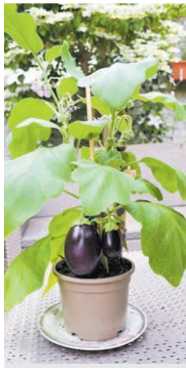
Decoratieve aubergineplant ( Solanum melongena ).

Heemstede/Bloemendaal - Bijzonder is die zeker de aubergine ( Solanum melongena ). Hoewel de aubergine vaak met de Mediterrane keuken wordt geassocieerd, is de vrucht oorspronkelijk uit Myanmar. De Arabieren introduceerden in de 13de eeuw de aubergine voor het eerst in Europa, in Spanje. Daarna werd de vrucht verder verspreid. De bekendste aubergine is met de vruchten in de paarse auberginekleur, maar er bestaan ook witte, rode en groene varianten. De vruchten van de witte variant lijken op grote eieren. Daar komt de Engelse benaming 'eggplant' ook vandaan.