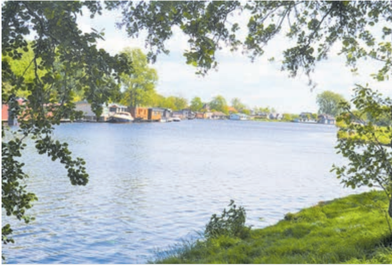
Varen over het fraaie Spaarne is geeft uitstekende inspirerende inzichten.

Aanmelden via e-mail jan.oostenbrink@gmail.com . Informatie: telefoon 06 50 81 56 97. Na aanmelding