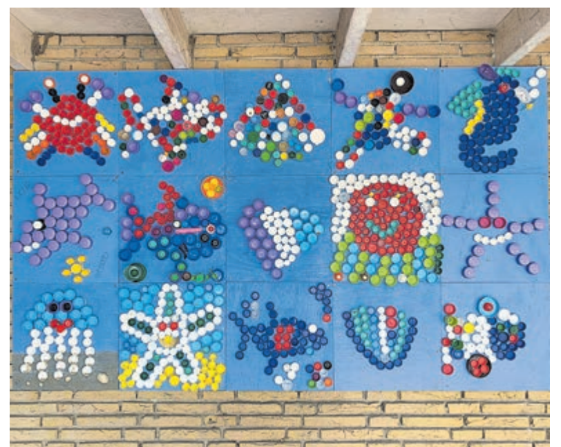
De kunstwerken van plastic doppen.

Door de enorme verzamelwoede blijkt er nog een behoorlijke voorraad doppen over te zijn. Deze doppen worden geschonken aan Mooizooi om het magazijn aan te vullen.