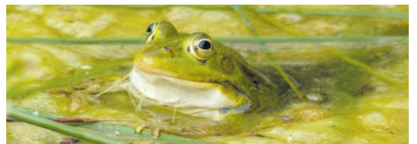
Groene kikker.

Start: Middenduin Ingang Duinlustweg Overveen, eind van de parkeerplaats.