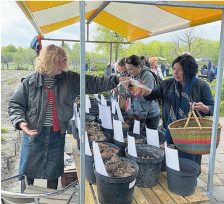
(Moes)tuinmarkt vorig jaar.

Heemstede - Op zaterdag 14 mei wordt er op Kom In Mijn Tuin (KIMT) weer de jaarlijkse moestuinmarkt gehouden van 11 tot 15 uur. Er staan diverse kramen; een kraam met aardbeienplanten, dahliabollen, pioenrozen en een kraam met bijzondere zomerbollen en natuurlijk staat KIMT er zelf ook met een kraam met gekweekte planten, kruiden en bloemen. Zoals ieder jaar kunnen bezoekers onder het genot van koffie of thee komen smullen van diverse huisgemaakte taarten. KIMT is een bijzonder groen-, natuur- en educatief project in het Groenendaalse Bos in Heemstede. Jaarlijks worden er gedurende de zomermaanden cursussen moestuinieren gegeven aan jong en oud. KIMT is gevestigd aan de Herenweg 18 te Heemstede, tegenover de Manpadslaan. (ingang Groenendaalse Bos) ( www.kominmijntuin.com of Facebook Kom In Mijn Tuin).