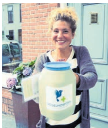
Alle kleine en grote beetjes helpen!