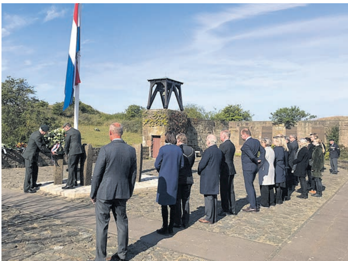
Herdenking leden 40-45.