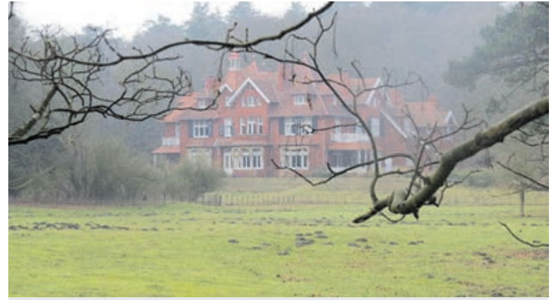
Landgoed Koningshof.

Aanmelden via e-mail: n.bromet@vogelhospitaal.nl .