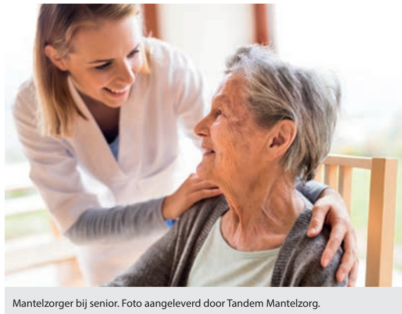
Mantelzorgster bij senior.

Daar is 24 uur per dag zorg en toezicht beschikbaar en zijn de logés welkom bij de activiteiten die de zorginstelling organiseert. Ze kunnen bovendien hun eigen behandelaren