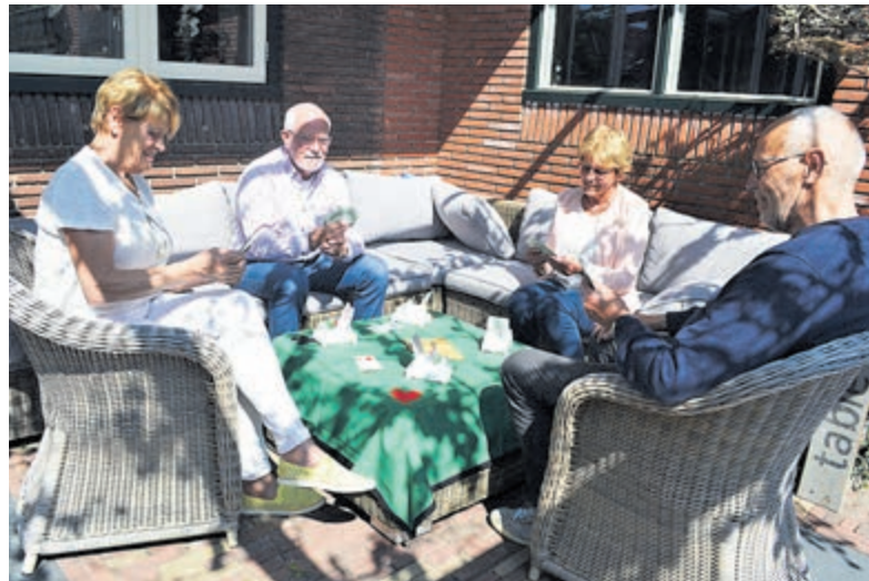
Bridgen bij HBC Bridge is gewoon gezellig.

"Het spel kent ongelooflijk veel mogelijkheden, net als schaken", vult