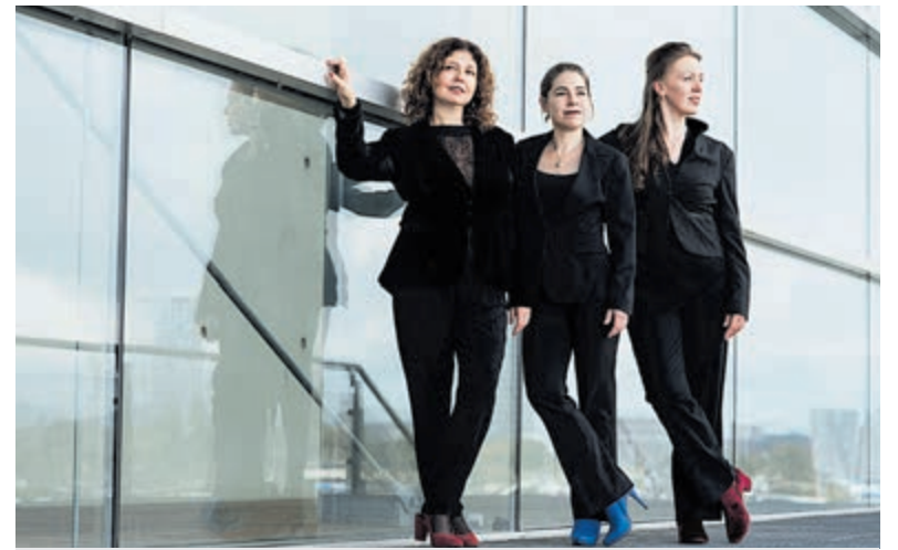
MirAnDa Trio.

Akonietenplein 1 Bennebroek Zondag 15 mei: ds. Hetty van Galen (Krommenie). De vieringen zijn ook online te volgen, zie: www.pkntrefpunt.nl , klik op actueel of zoek op YouTube naar trefpunt Bennebroek. www.pkntrefpunt.nl .