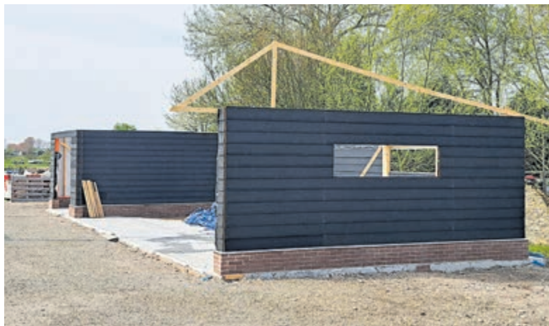
De bouw van de nieuwe keukenschuur voor de workshops.