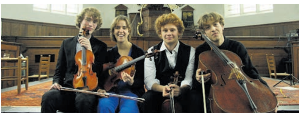
Het Fontana Kwartet.

Vanaf een half uur voor aanvang is de deur open. Toegang vrij, na afloop collecte met richtlijn €10,-.