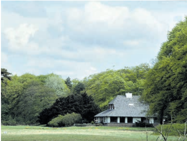
Wandelen door de geschiedenis van Woestduin en Vinkenduin.