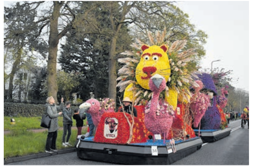
Het Bloemencorso van 2023.

Dat is €269.000 terwijl het corso zelf laat weten dat de kosten €105.000 zijn. Boeder stelt vast Heemstede in 45 minuten wordt gepasseerd. In Haarlem staan de praalwagens twee volle dagen, aldus is de spin-off veel groter. Paul Nielen (D66) vindt dat de rekensom van Boeder klinkt als een klok. Hij wilde inzage in de boekhou-