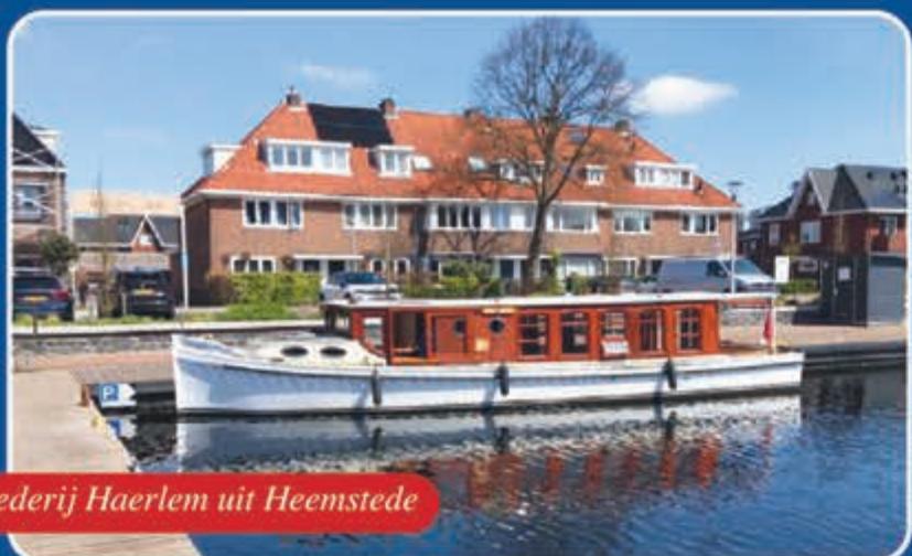
Rederij Haerlem uit Heemstede

Vraag de nieuwe folder aan Informeel bij ons