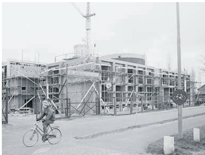
De kelder onder het voormalig politiebureau aan de Cruquiusweg 1 werd in 1966 geschikt gemaakt als noodbestuurspost voor de gemeente. De foto is van de bouw in 1965. Op de achtergrond is nog een gashouder zichtbaar van de gasfabriek.

Volg verder de HVHB op de website, de gratis nieuwsbrief of op de eigen Facebookpagina.