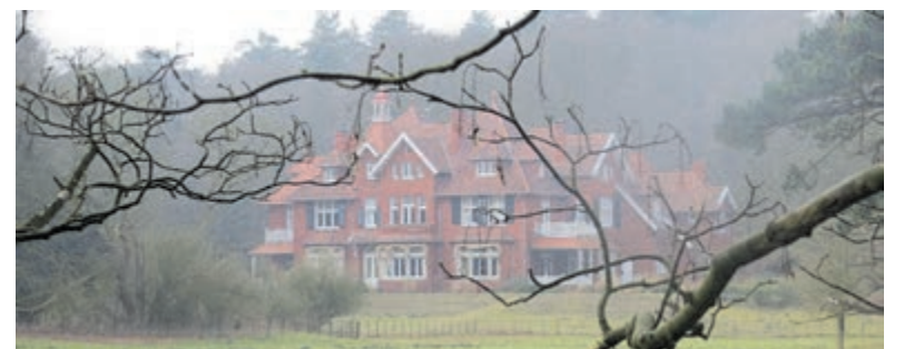
Landgoed Koningshof.

ridder Jan van Brederode, schilder Maarten van Heemskerk en het bankiersgeslacht Borski passeren. Bent u nieuwsgierig? Dan bent u van harte welkom. Dit is een excursie in het Nationaal Park Zuid-Kennemerland. Reserveren/aanmelden (verplicht) via www.np-zuidkennemerland.nl . Informatie via tel. 023-5411123. Verzamelen bij het infopaneel op de parkeerplaats Koningshof, Duinlustweg 26, Overveen.