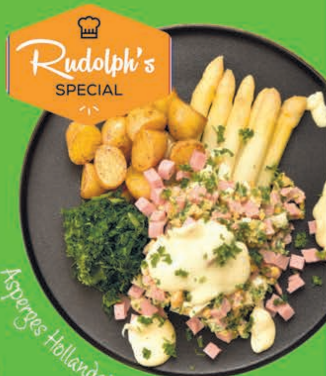
Asperges Hollandaise à la Rudolph