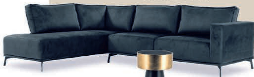
▼ Loungebank Leonore zoals afgebeeld v.a. 839,-