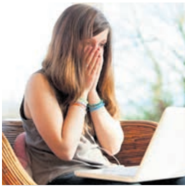
Kwart meldt cyberfraude niet.

baar zijn", waarschuwt Slotboom. "Ik ken een geval van identiteitsdiefstal waarin het slachtoffer buiten zijn wil en invloed twee panden met een hennepkwekerij op zijn naam kreeg, nadat cybercriminelen een kopie van zijn paspoort uit zijn mail stalen. Hoewel de rechtbank zijn slachtofferrol in de zaak heeft erkend, heeft de man de grootste moeite om een bankrekening, verzekering of hypotheek te kunnen afsluiten. In diverse systemen staat hij namelijk nog steeds als fraudeur vermeld en het kost hem al acht jaar om dat gewijzigd te krijgen."