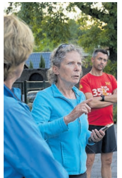
Goed ademen is belangrijk voor je hardloopprestaties.

meedoen aan de Clinic Zuurstofwinst? Het aantal plaatsen is beperkt. Aanmelden kan door een e-mail te sturen naar info@loperscompany-heemstede.nl of in de winkel aan de Binnenweg 35 of het formulier in te vullen dat je kan vinden op de site https://www.loperscompany-heemstede.nl/clinic-zuurstofwinst/ .