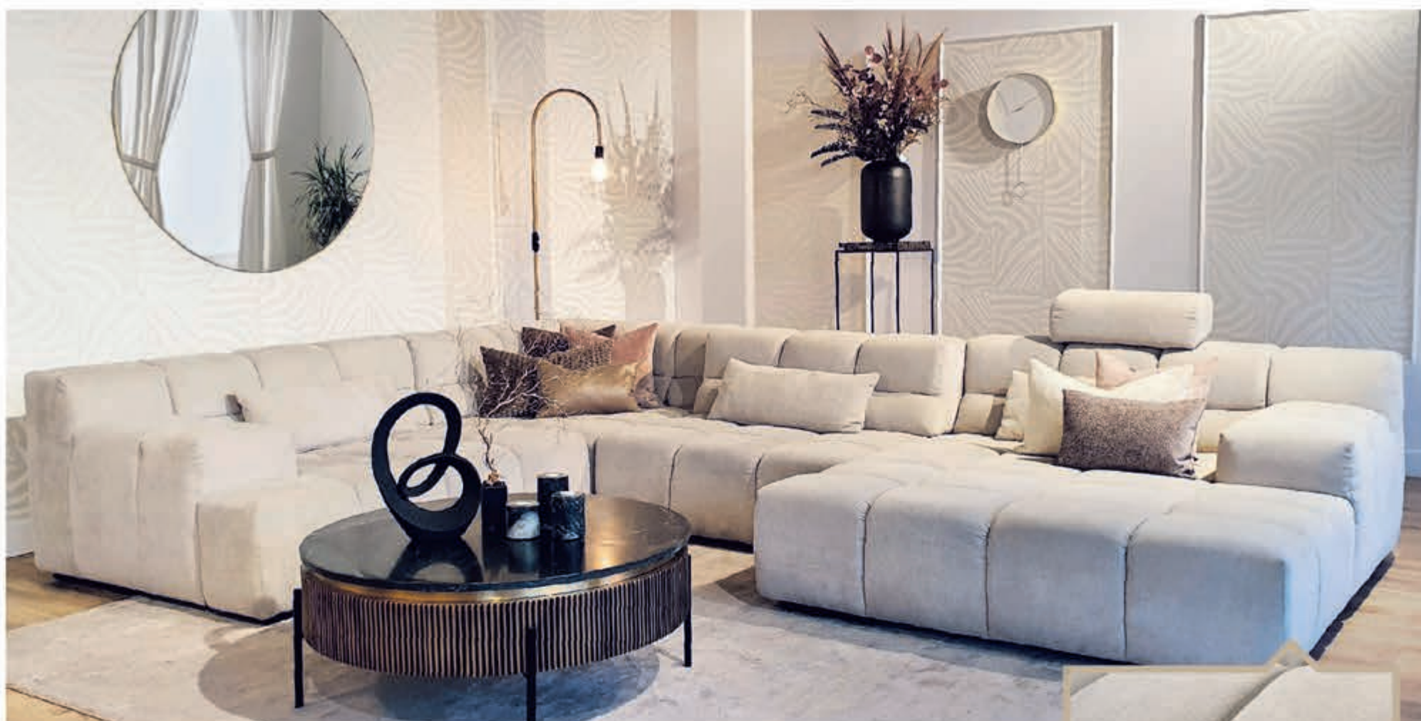
Hoekbank Salvatore zoals afgebeeld v.a. 3129,- | Salontafel Ironville 765,- | Spiegel Immense 189,- | Vloerlamp Pike 197,- | Pilaar 259,- | Vloerkleed Erada v.a. 270,- |