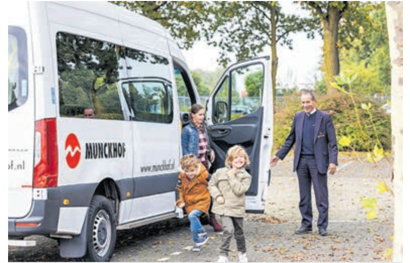
Munckhof is op zoek naar chauffeurs voor leerlingenvervoer in meerdere regio's.

naar de klant toe. In je handelen staat veiligheid van jezelf, je klanten en medeweggebruikers voorop! De werktijden zijn veelal in de vroege ochtenduren en middaguren. Om beroepsmatig personen te vervoeren heb je een chauffeurskaart taxi nodig. Heb je deze niet, dan vergoedt Munckhof de opleiding ter waarde van 1200 euro. Kijk voor meer informatie op http://werkenbij.munckhof.nl en solliciteer direct!