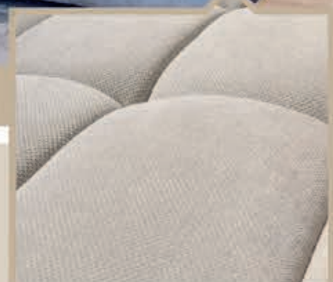
Verkrijgbaar in meer dan 3600 verschillende kleuren en bekleding.