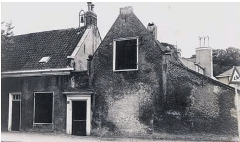
De Appelkamer aan de Koediefsaan in 1977. Er was een sloopvergunning aangevraagd, maar mede door de HVHB werd het pand behouden en werd het een gemeentelijk monument.

Heems sinds 1822, Havenstraat 49, Heemstede, 023-5284079, www.heems.nl .