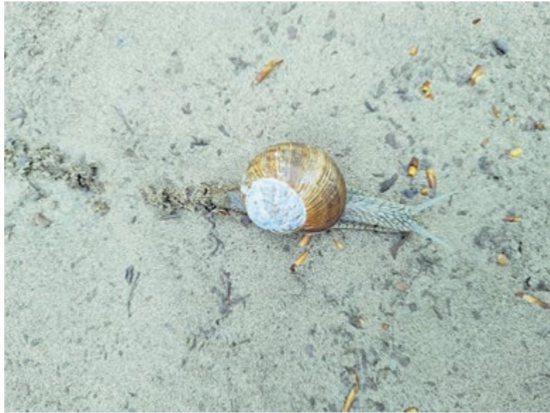
Wijngaardslak op Leyduin.

Vanaf een half uur voor aanvang is de zaal open. Toegang vrij, een bijdrage met een richtlijn van 10 euro is wenselijk. (incl. koffie en thee) Tel.: 023-5378625. Meer informatie op: www.mosterdzaadje.nl (reserveren is ook mogelijk via website of via de e-mail: penningmeester@mosterdzaadje.nl ).