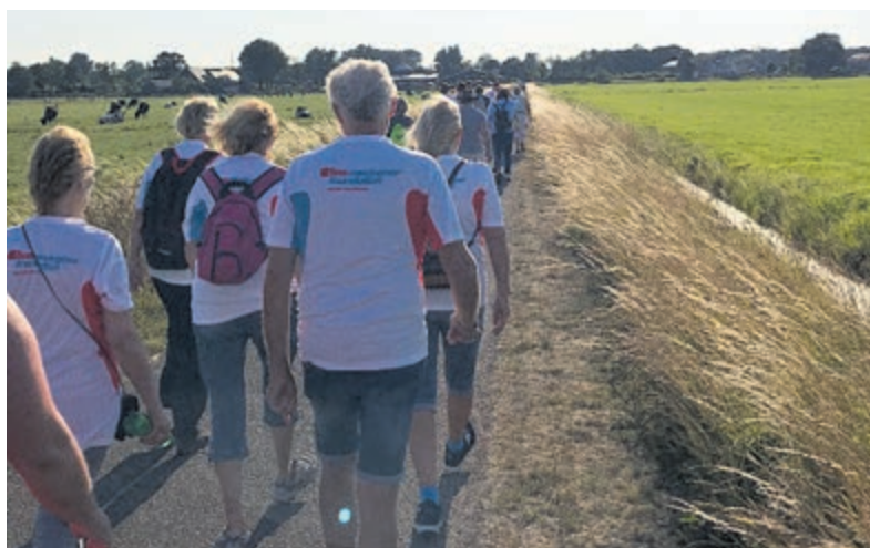
Nationale Diabetes Challenge. Foto aangeleverd.