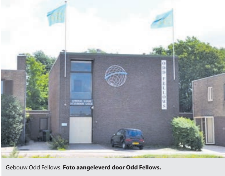
Gebouw Odd Fellows.