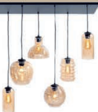
◀ Hanglamp Fantasy 439,-