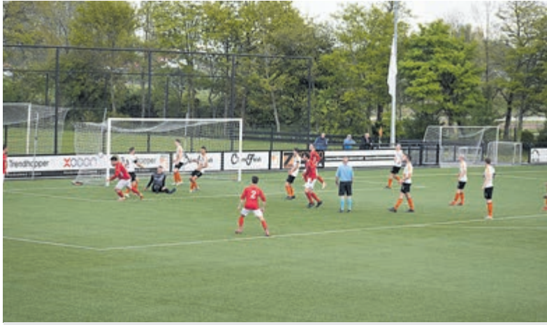
Hartog maakt de gelijkmaker. foto 2: Doelman Verhagen brengt redding.