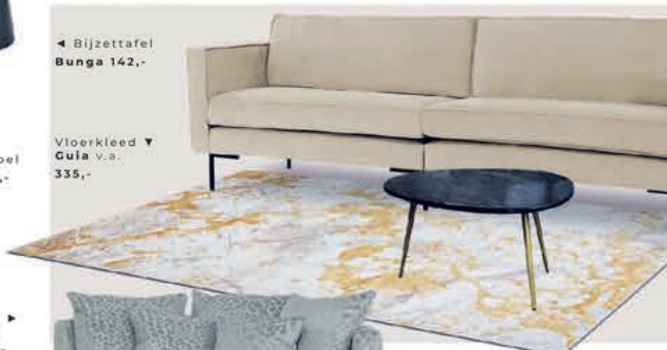
Vloerkleed ▼ Guia v.a. 335,-