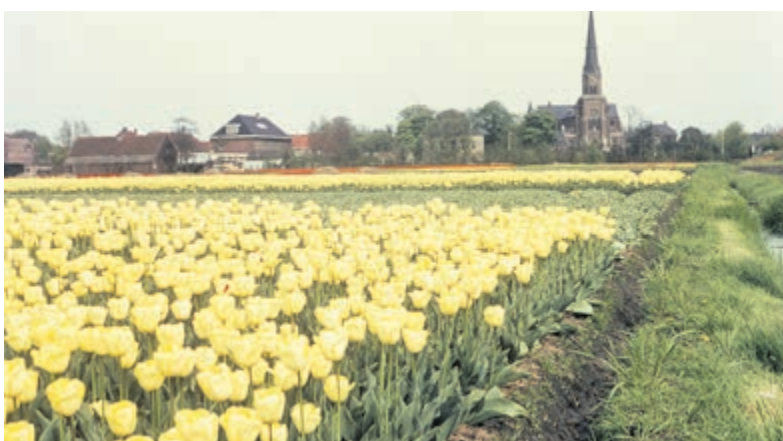
Bloembollenvelden van de Gebr. Rot tegenover de Bavo, begin jaren vijftig. Je kijkt met de Leidsevaart in de rug richting Herenweg. Links van de Bavo zie je Huize Postlust en schuin daartegenover de Henricus ulo.

bestaat 75 jaar en dat wordt gevierd! Met bijeenkomsten, tentoonstellingen en wedstrijden, maar ook met een dubbeldikke jubileumversie van het