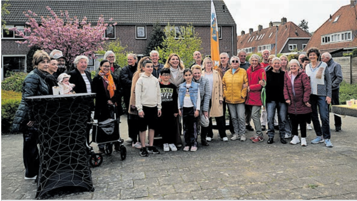
De buurtbewoners van de Lief &amp; Leedstraat.