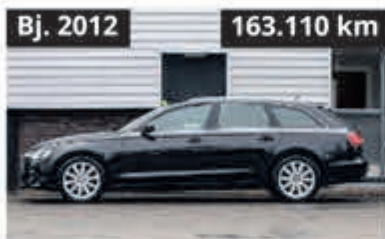
Audi A6 Avant 2.8 FSI € 12.950,-