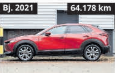
Mazda CX-30 2.0 E-SkyActiv-G € 23.700,-