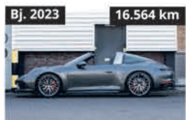
Porsche 911 Targa 4 S € 192.992,-