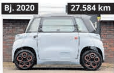
Citroën Ami € 6.950,-