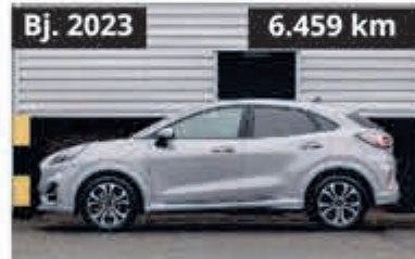
Ford Puma ST-Line € 25.950,-