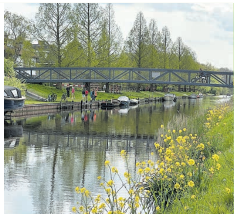
De nieuwe brug past mooi in het straatbeeld.

Bennebroek - Onlangs is de nieuwe brug die fietsers en wandelaars over de Leidsevaart brengt, tussen Vogelenzang en Bennebroek, officieel geopend. De oude Stationsbrug die nog naast de nieuwe lag, is vorige week weggehaald. Ina Mostert-Stam maakte nog een mooie foto van de in 1981 gelegde brug. Nog een leuk weetje over de Stationsbrug: de huidige grens tussen Vogelenzang en Bennebroek loopt daar precies midden in de Leidsevaart, dus de brug is 50/50 Vogelenzang en Bennebroek.