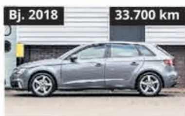
Audi A3 Sportback 35 TFSI CoD ProL € 20.900,-