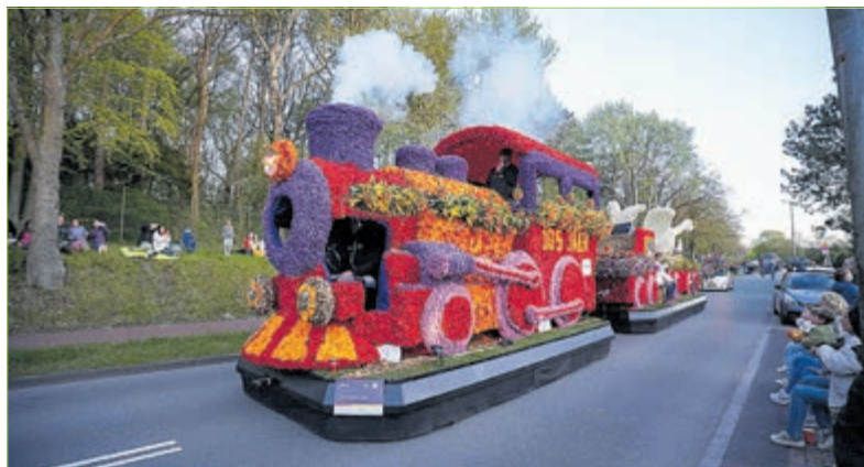
Aankomst in Heemstede (Herenweg).