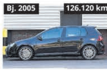
Volkswagen Golf 3.2 R32 € 20.900,-