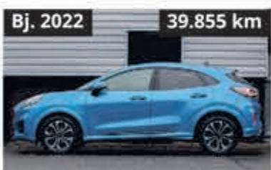
Ford Puma ST-Line € 20.900,-