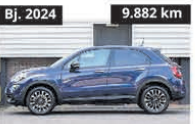
Fiat 500X 1.5 Hybrid Sport € 24.700,-