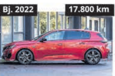
Peugeot 308 1.2 PureTech GT Line Av € 22.900,-