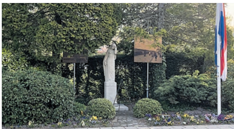
Het monument aan de Bennebroekerlaan is een plek om oorlogsgebeurtenissen te herdenken.

De middag Spot is open voor kinderen van groep 6, 7 en 8. Meer info op bloemendaalsamen.nl .