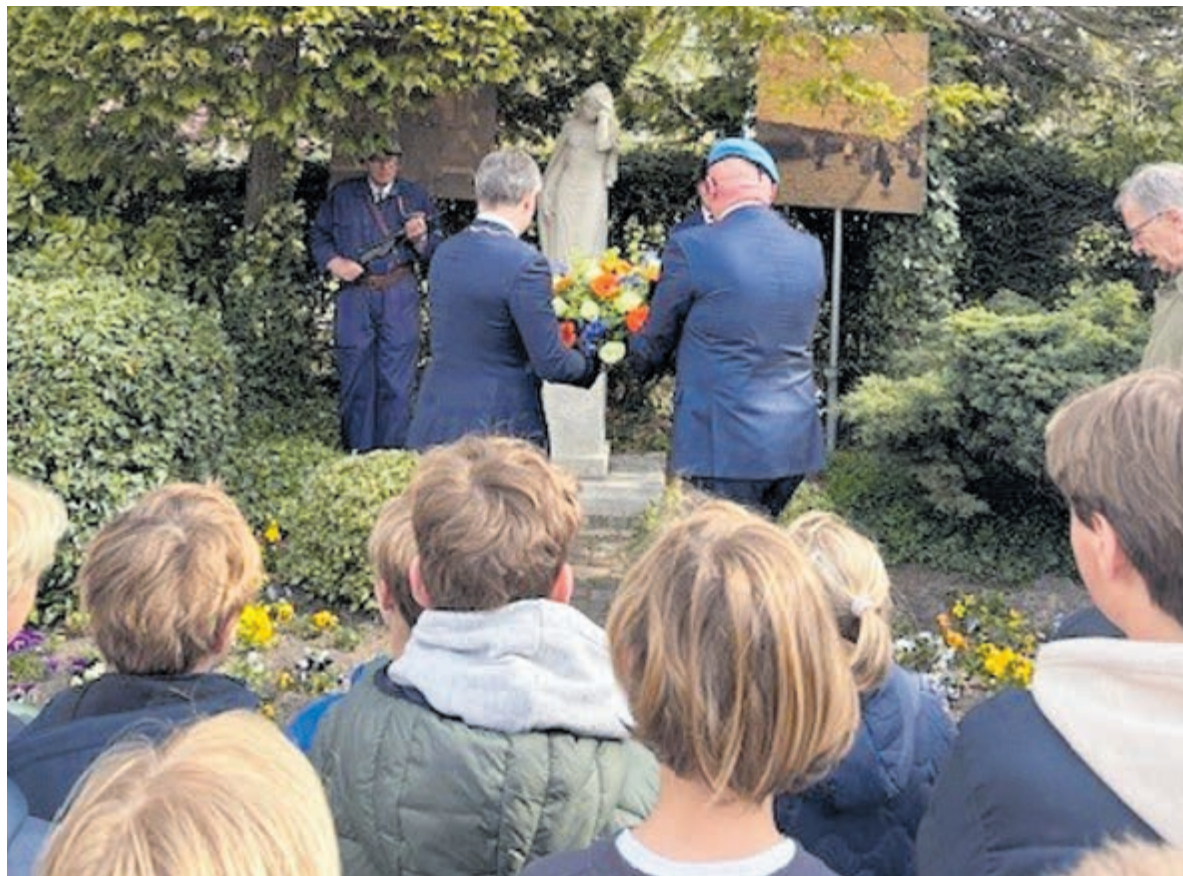
Burgemeester legt een krans bij het monument 'Wenende vrouw'.

Bennebroek - Op woensdag 15 april vond in Bennebroek de jaarlijkse bijeenkomst van Adopteer een Monument plaats. Leerlingen van groep 7 en 8 van de Franciscusschool, Sparrenboschool en de Willinkschool kwamen samen in 't Trefpunt om stil te staan bij de lokale oorlogsgeschiedenis.