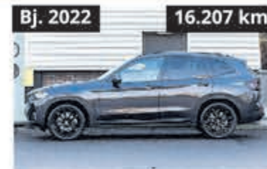
BMW X3 xDrive 20i Mild Hybrid € 45.750,-