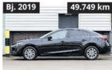
Mazda 3 2.0 S.A. 120 TS+ € 17.900,-