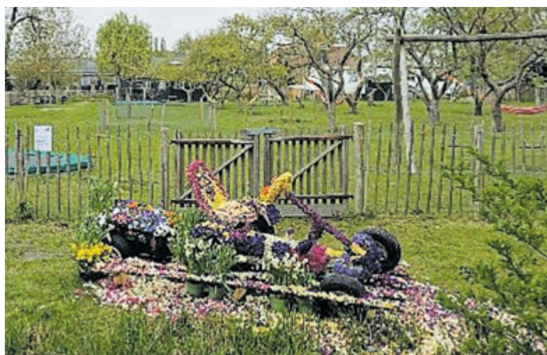
Kleurige skelter bij de Zebra-Zorgboerderij.