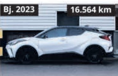
Toyota C-HR 2.0 Hybrid Dynamic € 27.900,-