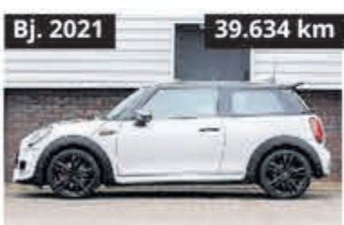
MINI Mini Cooper S JCW € 26.900,-