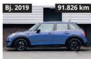
MINI Mini 5-deurs One € 16.900,-