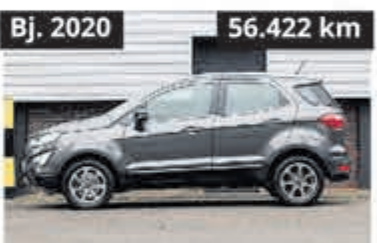
Ford EcoSport Titanium € 19.900,-