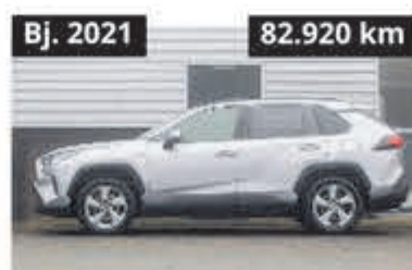
Toyota RAV4 2.5 Hybrid Style € 29.950,-