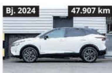
Nissan QASHQAI 1.5 ePower Tekna PI € 29.950,-