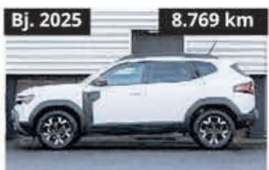
Dacia Duster III Hybrid 140 Extreme € 27.900,-