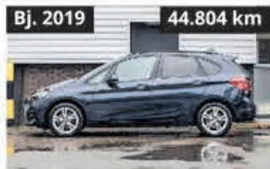
BMW 2 Active Tourer 218 i Sport Line € 19.900,-