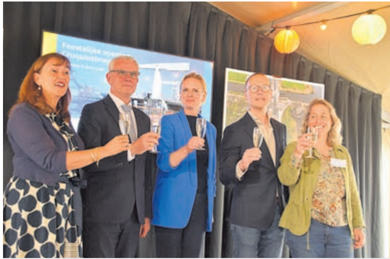
Het glas kan geheven worden.

Een stuk historie mag niet ontbreken, dus hingen er in een tent grote foto's van het verleden en het heden over de plek van de bruggen, waarbij je je