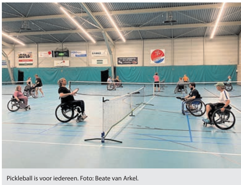
Pickleball is voor iedereen.