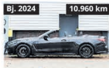
BMW 4 Serie Cabrio M4 xDrive Competit. € 147.500,-