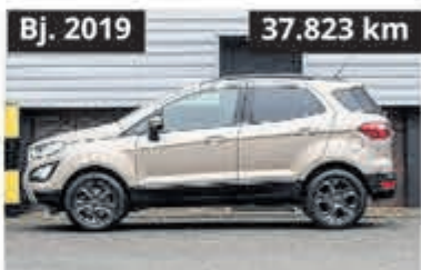
Ford EcoSport Cool & Connect. € 19.750,-