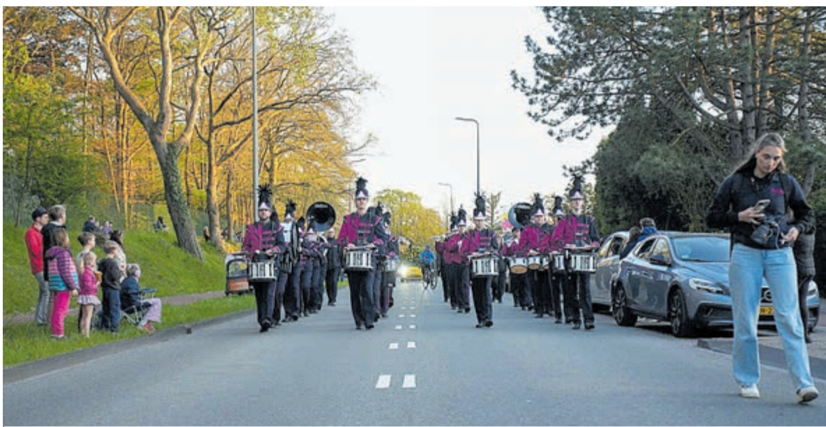
Ook muziekkorpsen lieten van zich horen.

De foto's van lezer J. Kan zijn te mooi om te laten staan in de redactie-mailbox. Hierbij!