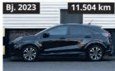
Ford Puma ST-Line € 23.750,-