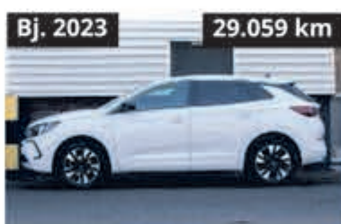
Opel Grandland X Elegance € 22.900,-