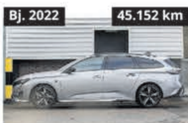
Peugeot 308 SW 1.2 GT Line-Pack Bns € 21.900,-