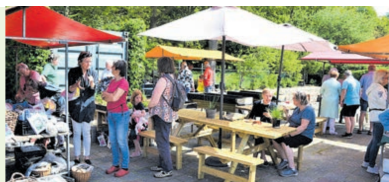
Moestuinmarkt bij KIMT.

Locatie: in het Groenendaalse bos, Herenweg 18 in Heemstede.