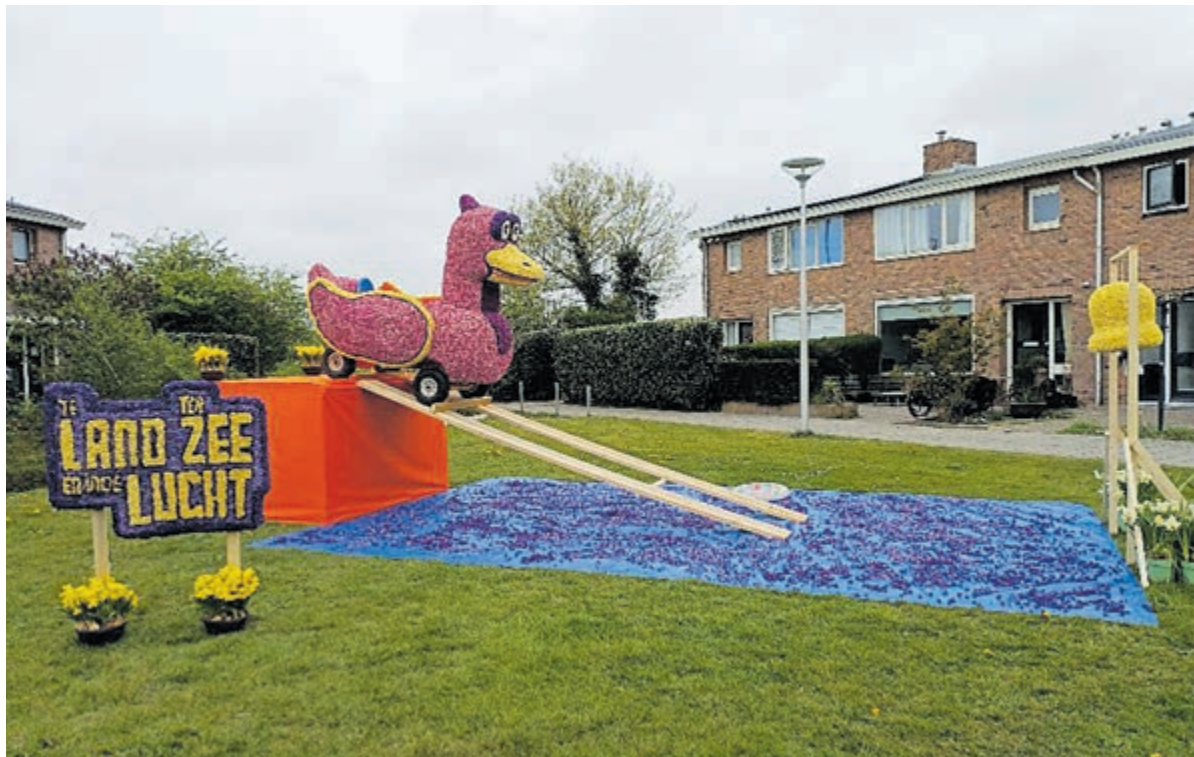
Creatie van Team Opa Jan.

Een stukje verderop staat een waar kunstwerk. Gemaakt door Team Opa Jan. Een grote eend racet naar beneden en zelfs de bel met een koordje (bekend van het tv programma Te land, ter zee en in de lucht) doet het echt. Een deel van de