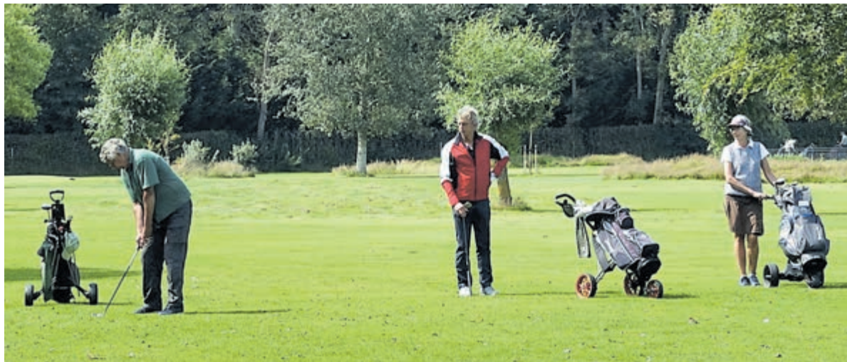
Lekker een balletje slaan? Kom eens kijken bij Marienweide.

De gemeente Bloemendaal onderstreept in haar sportnota het belang om te blijven bewegen en dit sluit aan bij het aanbod van de golfclub om ook niet-leden en geïnteresseerden uit de regio kennis te laten maken met de golfbaan en de sport. De Golfclub organiseert dan ook een