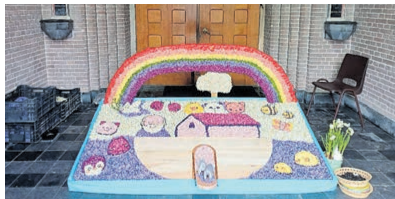
De ark van Noach bij de kerk in Vogelenzang.