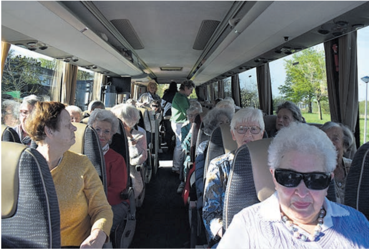
Een gezellig dagje uit per bus met De Zonnebloem.