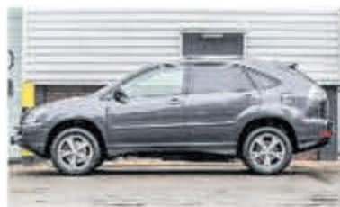
Lexus RX 400h Edition € 11.750,-