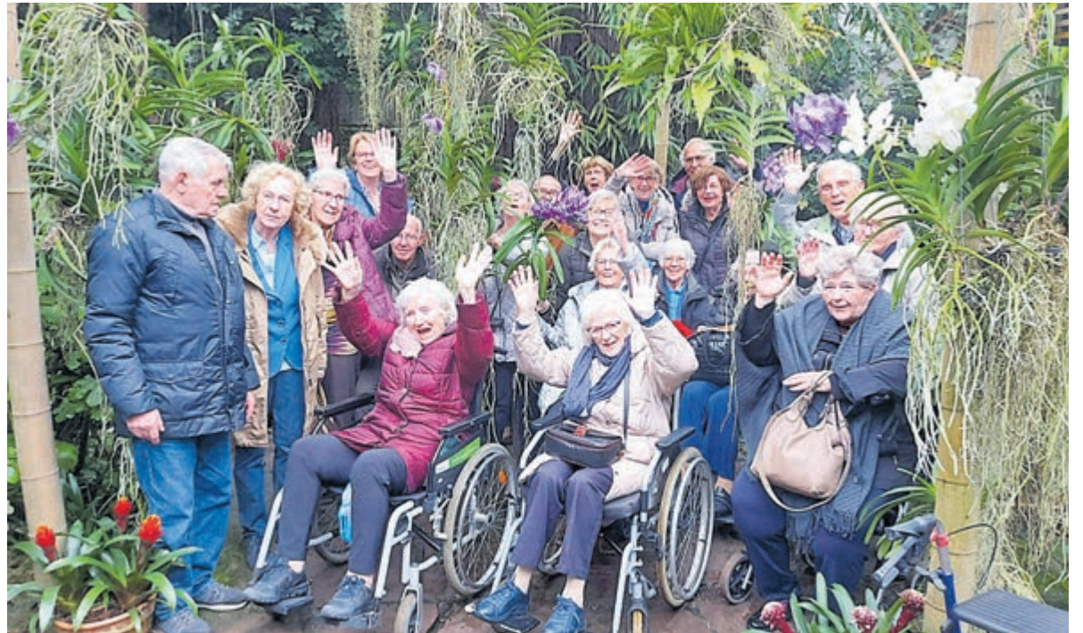
Deelnemers van dagbesteding Vogelhart samen op vakantie.

En zo ontstonden de vakantieplannen in Vogelzang, de plek waar deelnemers van ontmoetingscentrum Vogelhart elkaar regelmatig ontmoeten. Dat Vogelhart een actieve club is, blijkt wel uit andere initiatieven, zoals de wekelijkse 'Eetclub' waarbij samen gekookt en gegeten wordt, de dagtrips om tentoonstellingen en theatervoorstellingen samen te zien en de lezingen over diverse onderwerpen die er regelmatig plaatsvinden. Nadat de 14 initiatiefnemers voor de