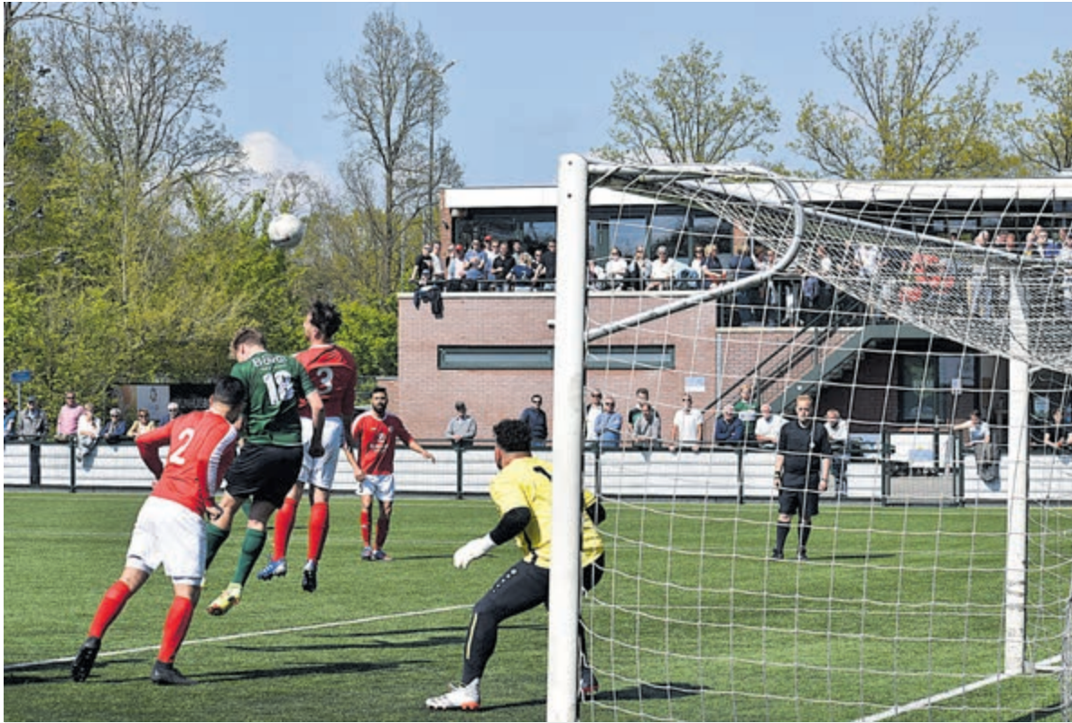
BSM vs. Rood-Wit Zaanstad.