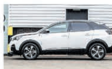
Peugeot 3008 1.2 PT Crossway € 27.900,-