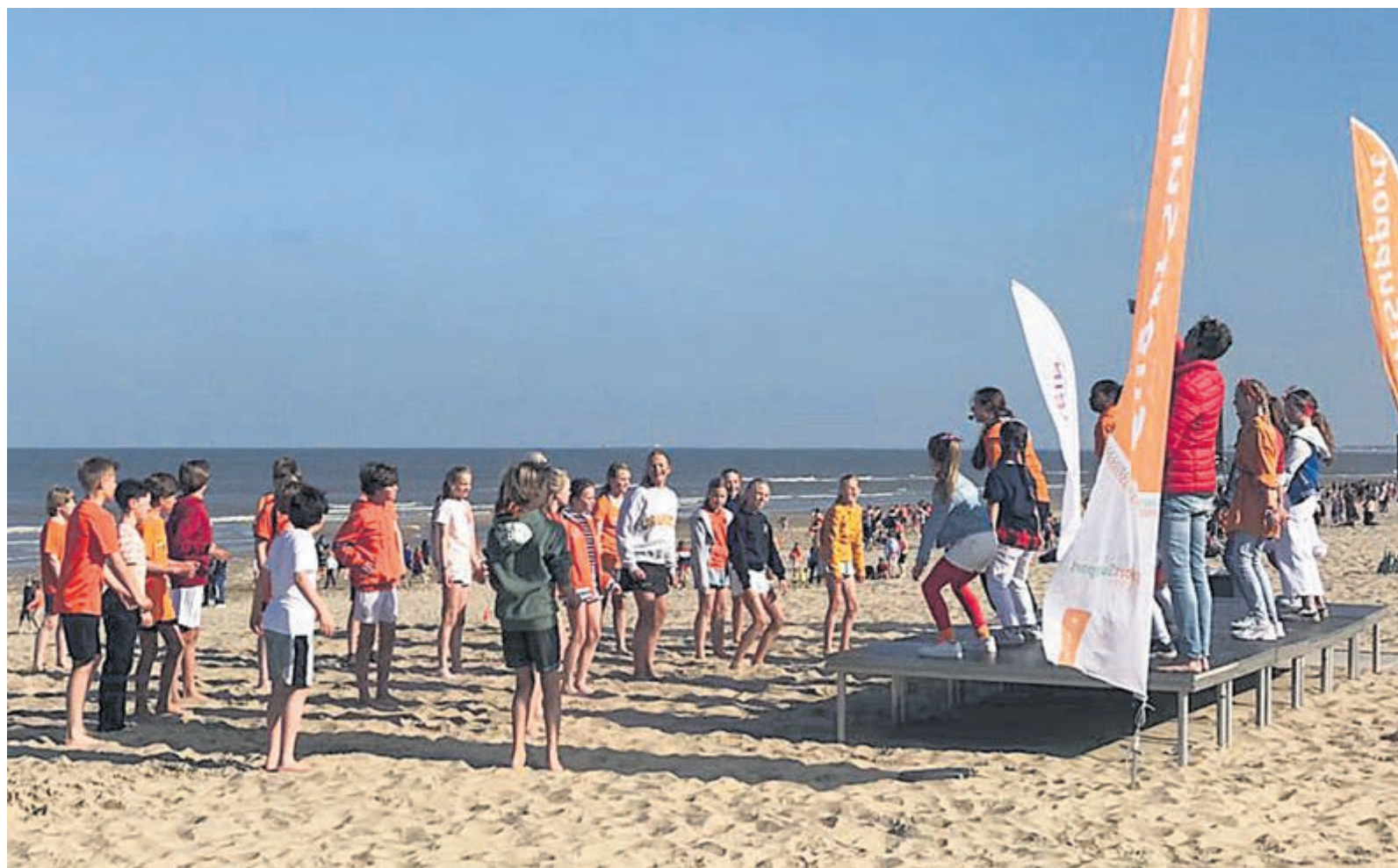
Heerlijk weer tijdens de Koningsspelen.