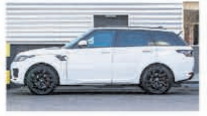
Land Rover Range Rover Sport P400e HSE € 102.950,-