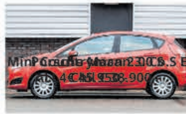
Ford Fiesta 1.0 EcoB. Vignale € 11.900,-