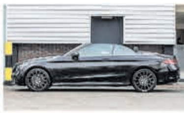
Mercedes-Benz C-klasse 220 d Cabrio Premium Pack € 48.900,-