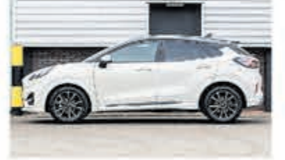
Ford Puma 1.0 EB Hyb ST-Line X € 25.750,-