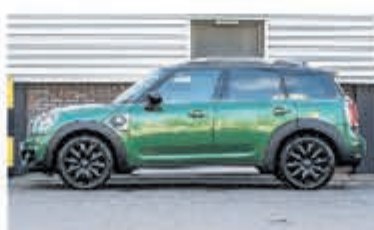
Mini Countryman 2.0 Co.S E ALL4 Chil € 38.900,-