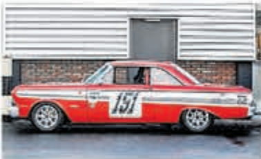
Ford Usa Falcon FUTURA SPRINT € 79.000,-