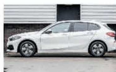
BMW 1-serie 118i € 26.900,-