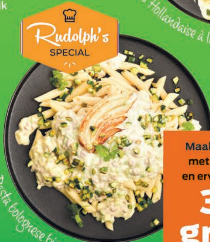
Pasta bolognese bianco à la Rudolph

Maak ook kennis met Uitgekookt en ervaar het zelf!