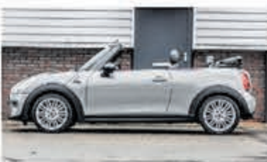
Mini Cooper Cabrio 1.5 C. Chili S. Bns € 25.950,-