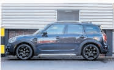
Mini Countryman 1.5 Cooper Salt € 24.950,-