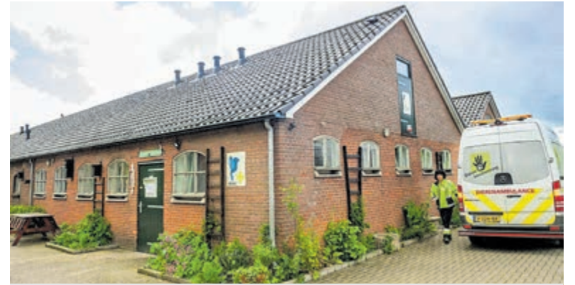
Achter de eerste groene deur mogen particulieren vogels weer brengen.

Reserveren kan ook: penningmeester@mosterdzaadje.nl of via www.mosterdzaadje.nl .