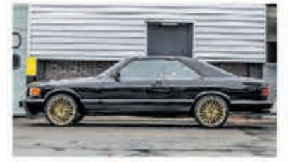
Mercedes-benz S-klasse 380 SEC € 10.950,-