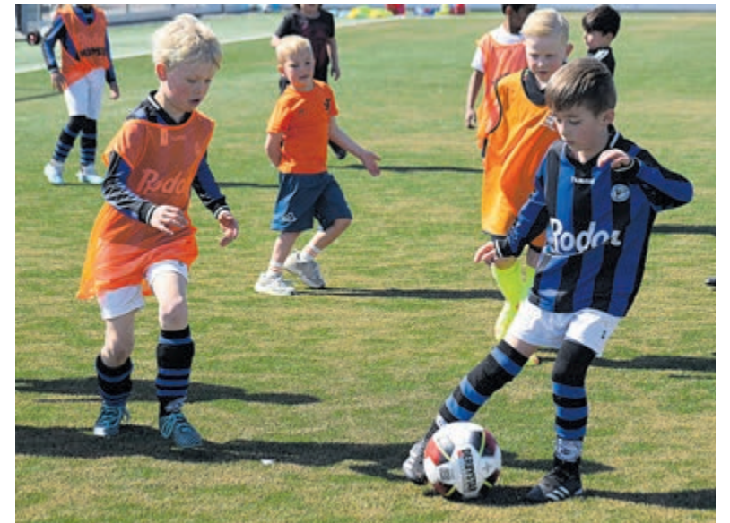
Oranjesfestival RCH.

Met de 0-0 ruststand gingen de teams verder. Opvallend was het sterke spel van Mathijs. Hij was zeer actief en probeerde als spits al direct 'hoge druk te zetten' zoals dat heet. Hij was zelfs heel dichtbij het winnen-de doelpunt, maar helaas. Overigens lukte dat niemand waardoor bij het laatste fluitsignaal alles wat Only Friends was in juichen uitbarstte. Kampioen, en daar doe je het voor. HBC was dichtbij, maar de laatste kans kon helaas niet verzilverd worden.