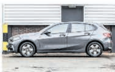
BMW 1-serie 116d Sp.Line Edition € 29.900,-