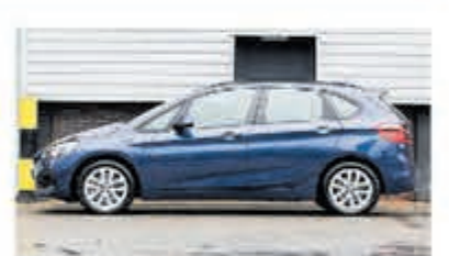
BMW 2-serie Active Tourer 225xe iP eDr. Ed. € 32.950,-