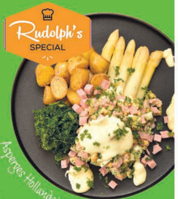
Asperges Hollandaise à la Rudolph