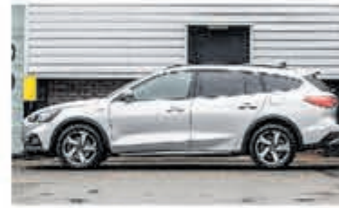
Ford Focus Wagon 1.0 EcoB. Tit. Bns € 27.900,-