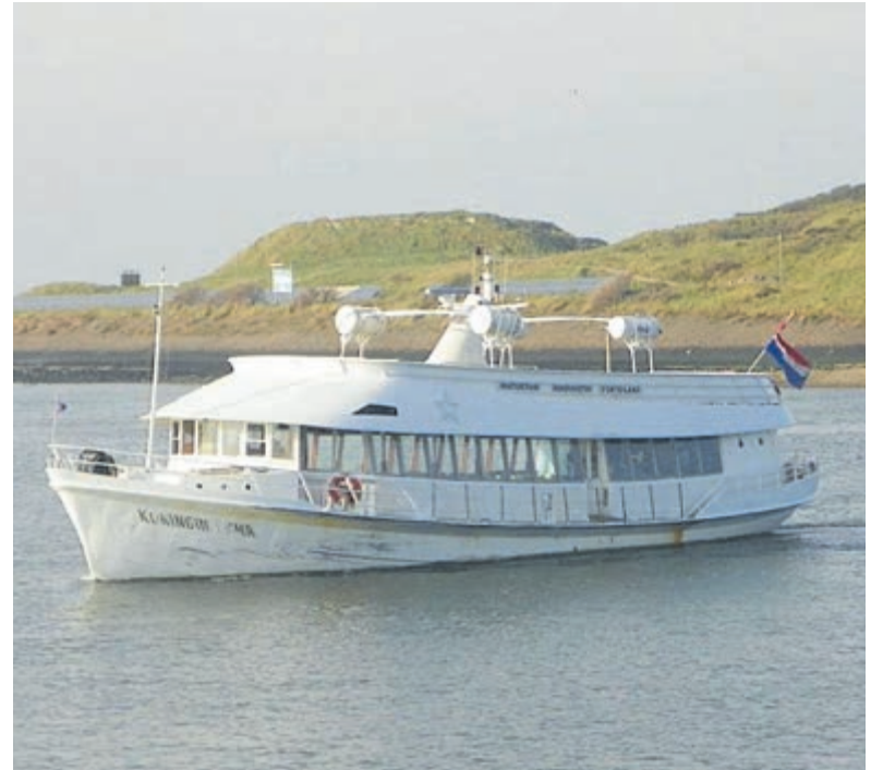
Kom naar de publieksdag Forteiland IJmuiden.