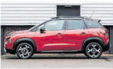
Citroën C3 Aircross 1.2 PT S&S Shine € 24.950,-