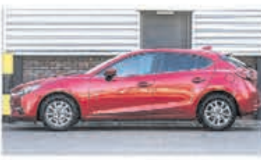
Mazda 3 2.0 S.A. 120 TS € 22.900,-