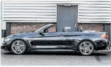
BMW 4 Serie 430i Cabrio € 49.950,-