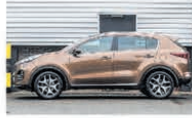
Kia Sportage 1.6 T-GDI 4WD GT-L. € 25.750,-