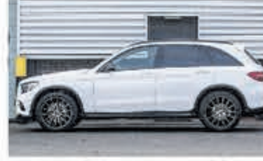
Mercedes-Benz GLC-klasse 250 d 4MATIC Luchtvering € 48.900,-