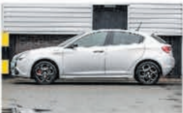
Alfa Romeo Giulietta 1.4 T Distinctive € 14.950,-