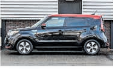
Kia E-Soul ExecutiveLine 30kWh € 19.950,-