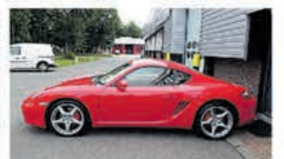
Porsche Cayman S Tiptronic Uniek 76.000 km € 29.950,-

Turenhout de occasiondealer van Heemstede en al meer dan 40 jaar uw vertrouwde onderhoudsadres.