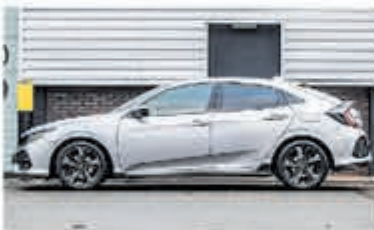
Honda Civic 1.5 i-VTEC Sport + € 24.950,-