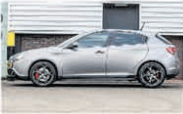
Alfa Romeo Giulietta 1.7 TBi Quad. V. € 23.950,-