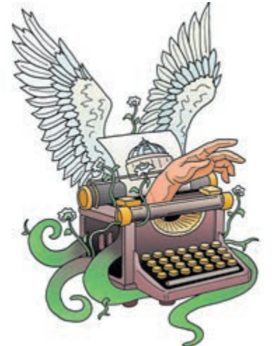
Illustratie: Eric Coolen.

Tijdens het festival is er een dichtbundel te koop met nieuw werk van alle deelnemers. Eric Coolen tekende de omslag. Een mooi aandenken aan dit gratis toegankelijke evenement dat je met de aanschaf ervan financieel steunt. Meer info op www.haarlemsedichtlijn.nl .