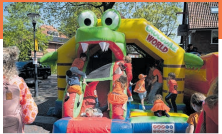
Lekker uit je dak op het springkussen. Foto aangeleverd.

Het belooft een feestelijke dag te worden in de winkelstraat.