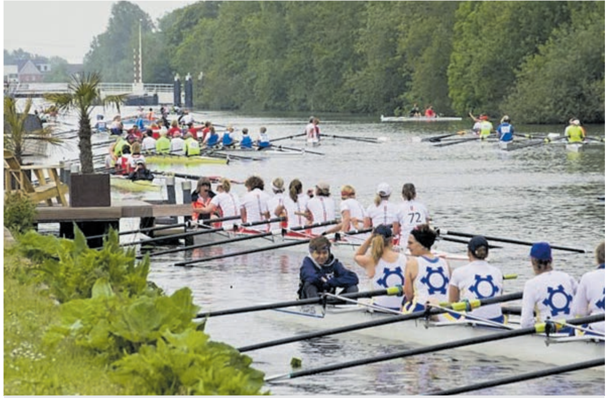
Er is weer een schitterend parcours samengesteld.

nenroeiers. Dat zijn roeiers vanaf 27 jaar oud tot ver voorbij de 70. Er is ook een wedstrijd voor junioren uitgeschreven. Het mooie parcours leent zich perfect voor deze wedstrijden. Er zijn dan ook vele oudtoproeiers die deelnemen. Traditiegetrouw leveren de deelnemende Spaarneleden een taart in als inschrijfgeld, waardoor er een heerlijk taartenbuffet aanwezig is. De buurt rond de Koninklijke Roei- en Zeilvereniging 'Het Spaarne' aan het Marisplein, tegen de grens met Haarlem, zal die dagen vol staan met botenwagens. Ook het vaargebied van de ringvaart vanaf de Bennebroekerbrug tot het Spaarne voorbij de Crayenestervaart zal per dag twee keer twee uur afgesloten zijn voor bootverkeer. De precieze tijden staan op www.hetspaarne.nl/stremming . Voor meer informatie zie: www.spaarne.lenterace.nl en www.hetspaarne.nl of volg Spaarne Lenterace op Facebook.