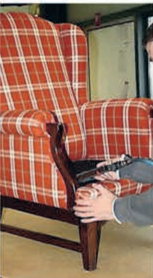
■ Stofferen gebeurt handmatig.

opknappen, gaat met veel handwerk gepaard. Als alles klaarligt, zoals de stof in mallen geknipt, dan ben ik drie tot vier dagen bezig met het stofferen van een fauteuil. Maar dan heb je ook wel weer iets moois. Ik neem het verleden eigenlijk mee naar de toekomst", zegt hij poëtisch. Zijn uitdaging zijn exclusieve meubels. "Die maken het werk spannend. Maar uiteindelijk geeft je elk modern of antiek, meubelstuk een nieuw jasje. Ik ben er trots op dat ik het kan. Er valt elke dag wat te leren. Ik kan wel zeggen dat ik een meubelstuk begrijp."