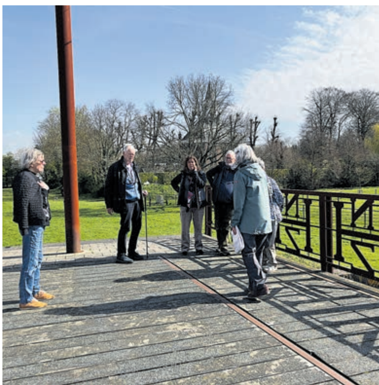
De trambrug met op de achtergrond voormalige bollenvelden.

het hele gebied verkocht en is flink verkaveld. Hartekamp bleef volledig bestaan. Er wordt gewandeld langs het historische Hofje van Van Verscheur-Brants en via voormalige bollenvelden over de trambrug, die in 2015 nog de Erfgoedprijs van de HVHB heeft gewonnen. Na 1,5 uur wandelen, altijd goed voor de beweging, is de groep een stuk wijzer geworden over hun eigen wandelgebied. De volgende wandeling is op 11 juni.