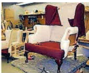
■ Een pareltje in wording.

"Een fauteuil neem je niet zomaar even mee. Als ik langs ga bij cliënten, dan kan ik het werk beter inschatten en zie ik hoe de rest van het interieur eruit ziet, zodat er meteen een mooie passende stoffering bij kan worden gekozen. Ik neem de stalen stof namelijk meteen mee." Maar voor wie liever niet thuis wil afspreken kan op afspraak naar het filiaal komen.