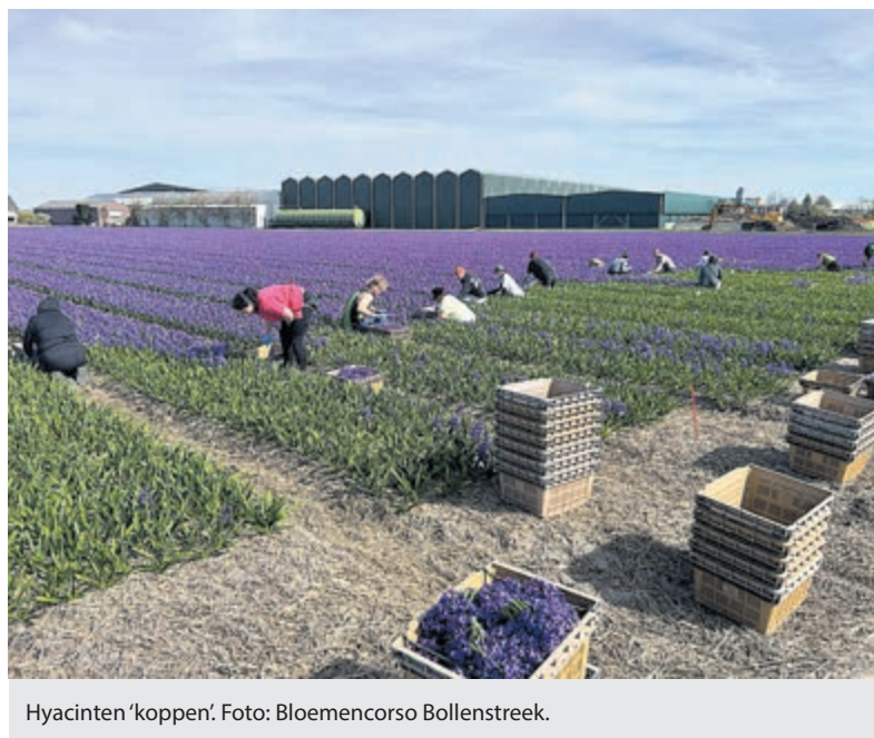
Hyacinten 'koppen'.

“Dat hield in binnen vier dagen zo’n 3.000 kratten hyacinten koppen en veilig stellen in de koelcel voor het decoreren van de praalwagens. Met een gedreven team van circa 20-25 mannen en vrouwen die de nodige inspanningen hebben geleverd is dit huzarenstukje gelukt. Het spreek voor zich dat vanuit het bestuur enorm trots zijn op deze geleverde prestatie.”