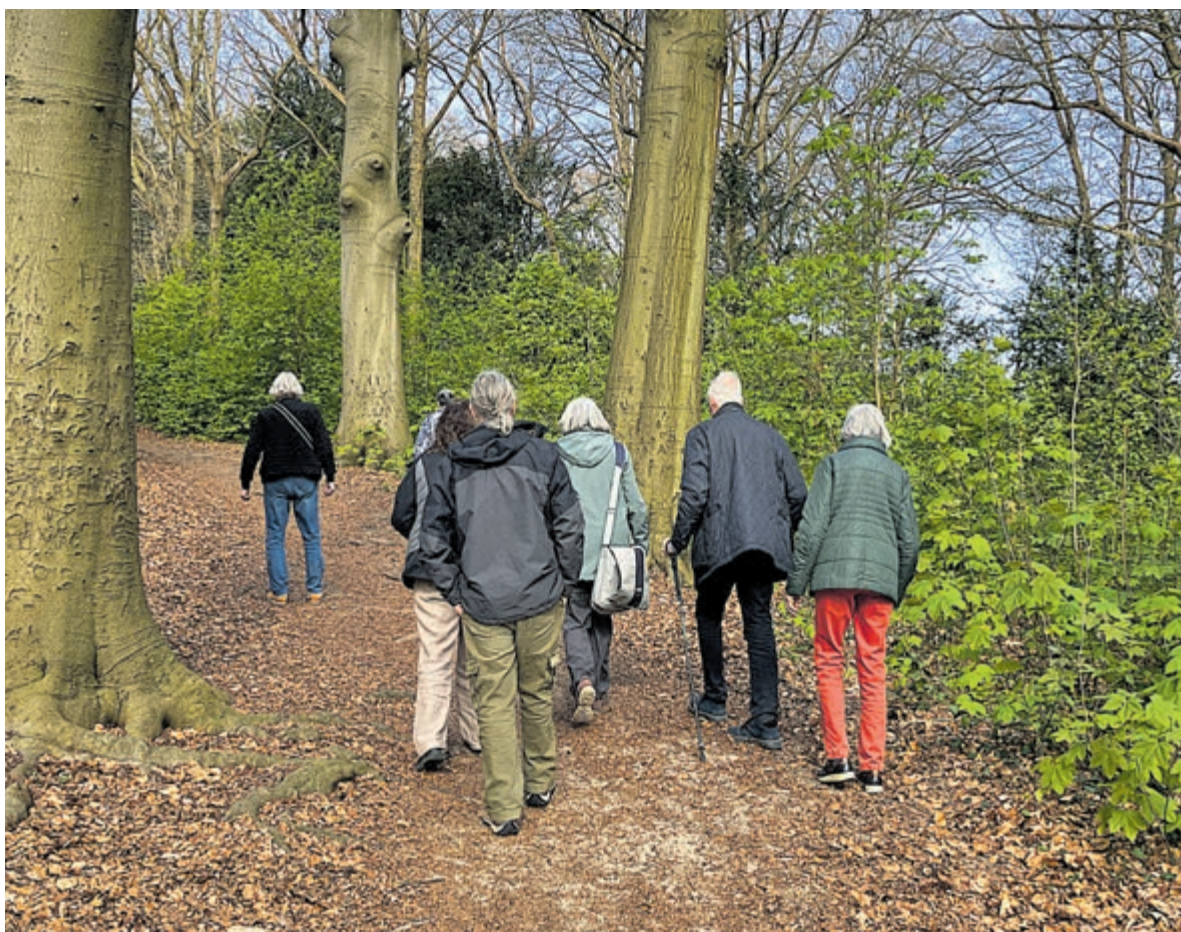
Op de route een oude 'strandwal'.

De tocht voert langs de speeltuin Linnaeushof (gesticht in 1963) waar net twee bussen vol kinderen arriveren. Op de huidige parkeerplek van de speeltuin waren vroeger bleekvelden en daarna bollenvelden. Ooit onderzocht hier Carl Linnaeus de natuur (van 13 september 1735 tot 7 oktober 1737 verbleef Linnaeus op de Hartekamp).