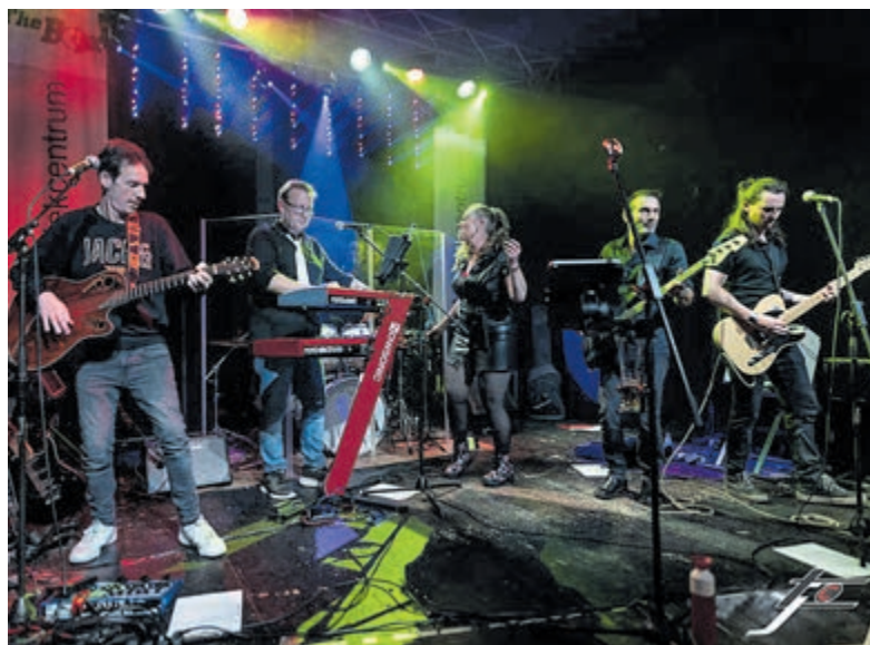
De band 'Drukke van Belang' doet Heemstede aan, live te zien tijdens Koningsdag bij Café de 1e Aanleg. Foto aangeleverd.

sche klassiekers tot modernere hits. De band bestaat uit ervaren muzikanten die hun sporen hebben verdiend in uiteenlopende projecten en formaties. Met een bezetting van zang, gitaar, toetsen, bas en drums brengen zij de muziek met zichtbaar speelplezier, muzikaliteit en overtuiging naar het podium. Door hun diverse muzikale achtergronden krijgen bekende nummers een frisse, eigentijdse live-uitvoering, zonder dat de herkenbaarheid verloren gaat.