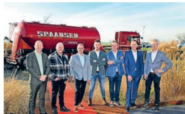
> Overdracht van de 2e naar de 3e generatie Spaansens.

Ter gelegenheid van het jubileum organiseert Spaansens zaterdag 18 april een Open Dag aan de Scheidersweg 6 in Winkel, van 10.30 tot 15.30 uur. Bezoekers kunnen rekenen op een expositie van de drie divisies, een foodtrip door de huiscaterars en activiteiten voor kinderen.