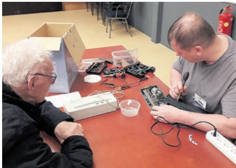
Voor al uw reparaties naar het repaircafé.

Vogelenzang - Komende zaterdag 20 april is het repaircafé in Vogelenzang weer open. Steeds meer wordt er beseft dat zomaar weggooien van defecte dingen niet meer van deze tijd is zonder een serieuze poging tot reparatie te doen. Dit blijkt ook uit de steeds drukker reparatiedagen waar een flinke ploeg reparateurs toch de handen vol heeft aan reparaties.