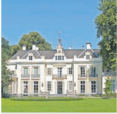
Hartekamp. Foto aangeleverd.