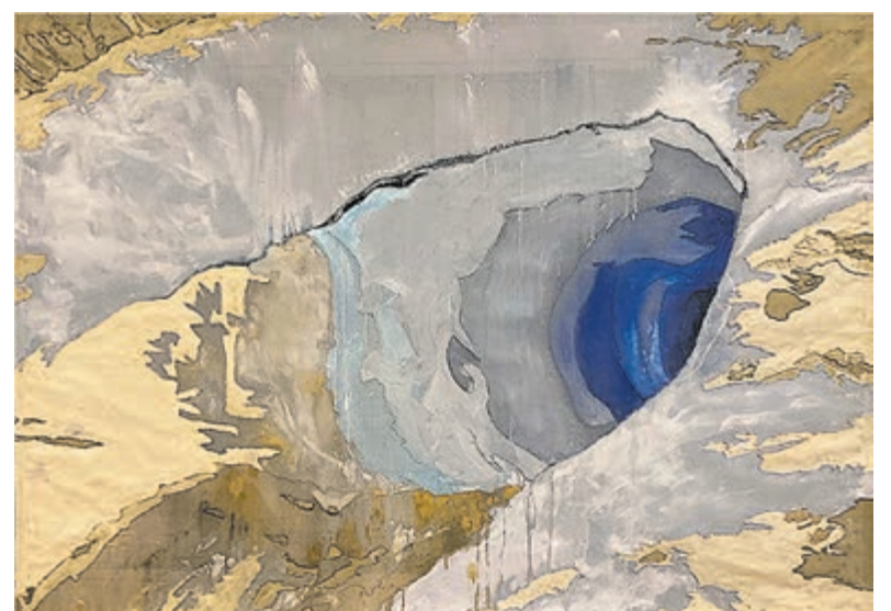
Octavie van Vloten: 'Mer de Glace Déclin Trou'. Beeld aangeleverd.

Extra open op 9 mei Hemelvaartsdag, samen met de Haarlemse Dichtlijn en Op 2e Pinksterdag 20 mei.