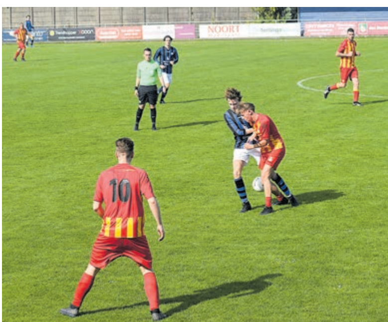
RCH pakte kansen tegen DSK.