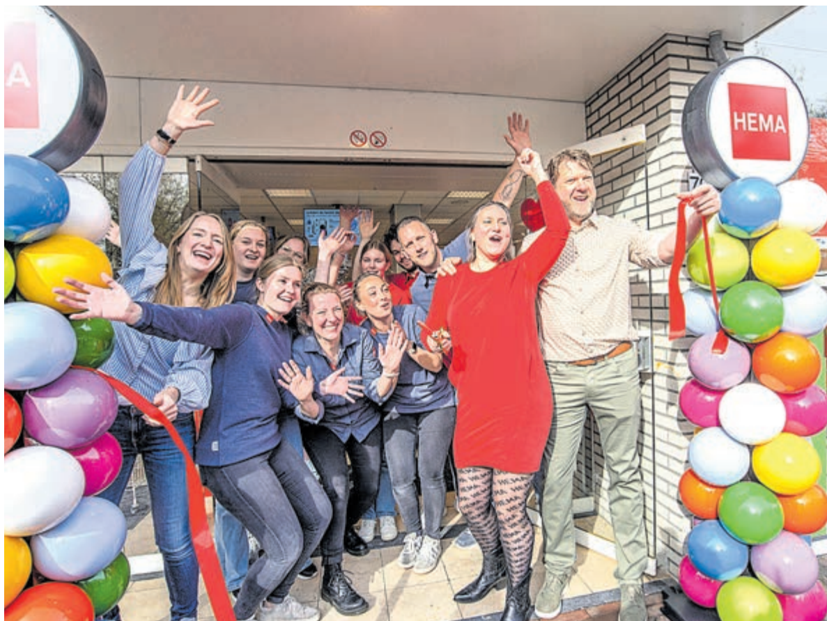
De compleet vernieuwde HEMA winkel op de Binnenweg in Heemstede werd feestelijk heropend.