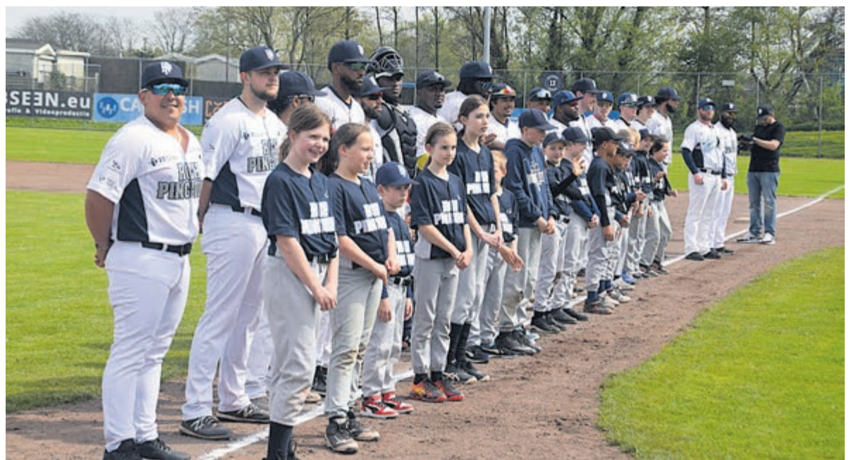
Heren 1 stelt zich voor aan het publiek.

Op 20 april gaat RCH op bezoek bij koploper en de aanstaand kampioen SC Urban Talent. Voor RCH een mooie test om te laten zien dat er ook van een topploeg gewonnen kan worden.