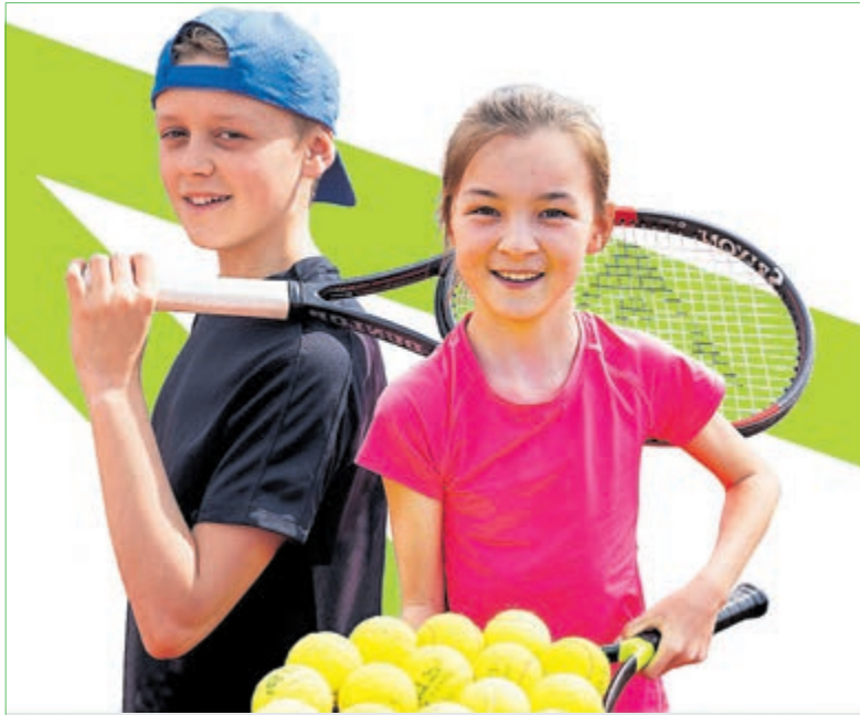
Word ook enthousiast over tennis bij TV HBC.