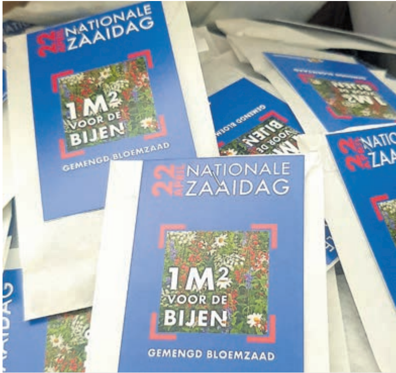
Zakjes met biologische bloemzaadjes. Foto aangeleverd.