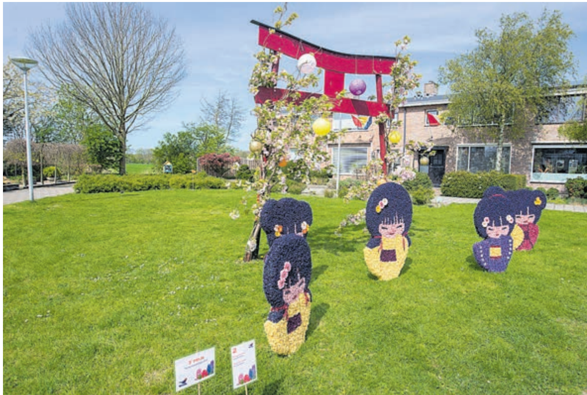
Inwoners maakten creatieve bloemmozaïeken in hun tuin waarmee ze een prijs konden winnen.