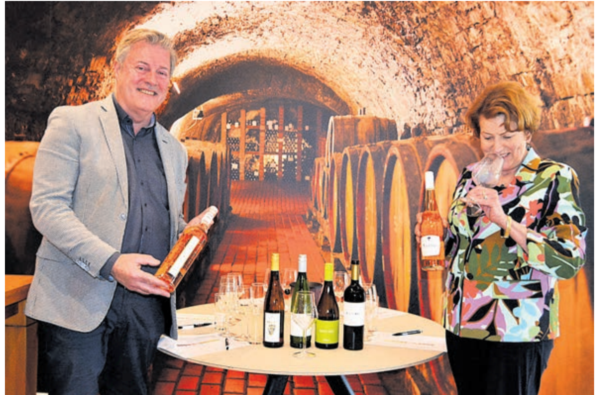
De ondernemers van WCH, zoals bij Gall & Gall Heemstede, proosten en klinken graag een glaasje met u mee bij de Wijntour.