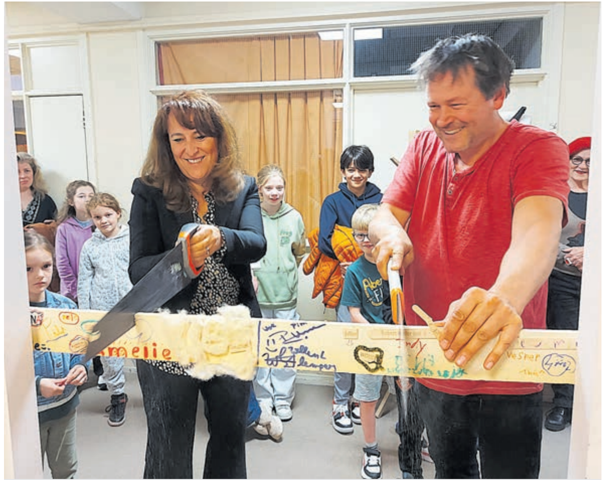
Wethouder Gamri (I) opent feestelijk Werkplaats Jeroen.

Een moeder waarvan haar twee kinderen van 9 en 12 jaar al ruim een jaar iedere woensdag bij Werkplaats Jeroen kwamen voor de verhuizing naar Overveen benadrukt de speciale plek die Werkplaats Jeroen inneemt voor kinderen. "Het is een fantastische plek voor kinderen om met hun handen te werken en zelfstandig aan de slag te gaan. Bij Werkplaats Jeroen kunnen kinde-