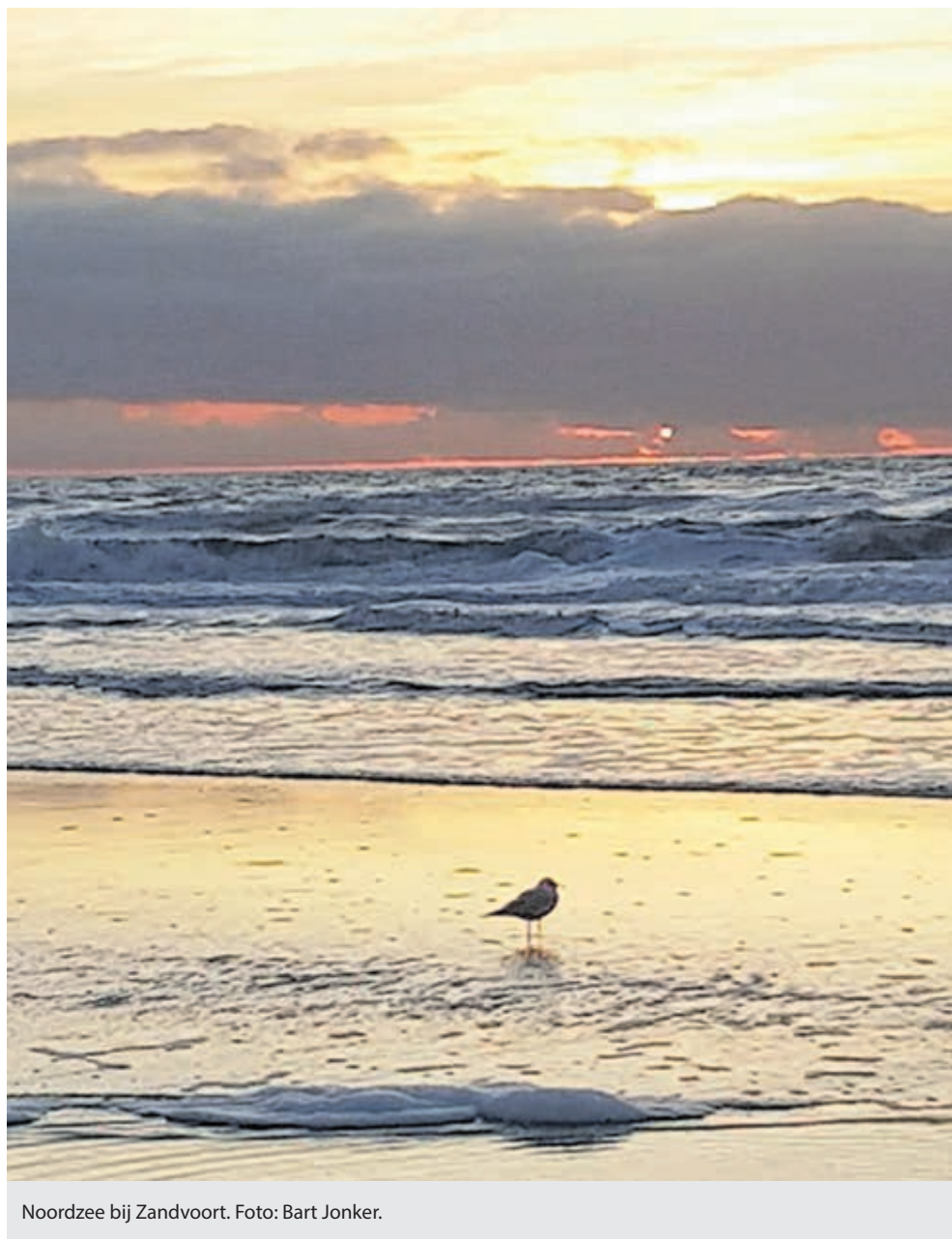
Noordzee bij Zandvoort.