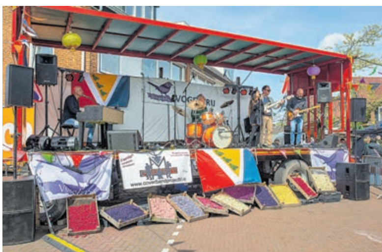
Een muzikale noot van de coverband Project M.