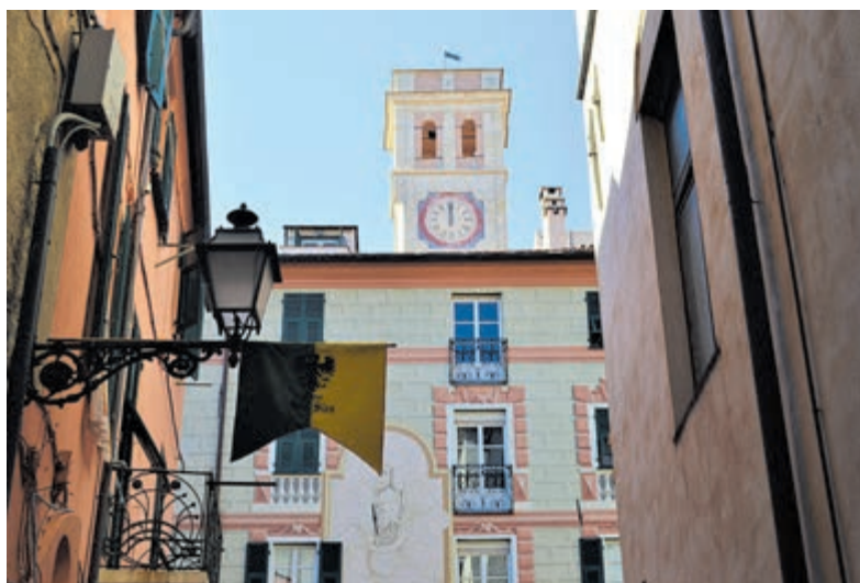
Albenga, historische parel.

Albenga is cultureel gezien best veelzijdig, waarin u de geschiedenis van de stad in al haar facetten kunt opspuiven. Voor de interne mens is Albenga tevens een culinair hoogtepunt. De vele restaurants en trattorie bieden verfijnde culinaire hoogstandjes uit de zeer diverse en authentieke Ligurische keuken aan. Natuurlijk de pesto, foccacia of bijvoorbeeld de vermaarde 'polpo alla Ligure' (octopus met aardappelen). Mocht u in Ligurië zijn, dan moet u het zelf maar eens gaan ontdekken!