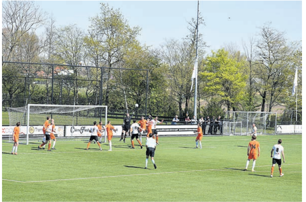
Spannende momenten in de wedstrijd HBC-Bloemendaal.

Het tweede bedrijf was nog geen minuut onderweg of Bloemendaal zette HBC voor het eerst deze competitie op achterstand. Met de punt van de schoen raakte invaller Van Veen de bal op heuphoogte en was het van dichtbij raak. HBC laat zich ook door een onverwachte tegenslag niet van de wijs brengen. Zes minuten later kwam de 1-1 op het scorebord door een mooi doelpunt van Sven Wierda. Neil van Hooff speelde als linksachter in de tweede helft heel hoog als een valse linksbuiten. Dat leverde voortdurend gevaar op voor Bloemendaal en keer op keer kwam hij goed langs zijn