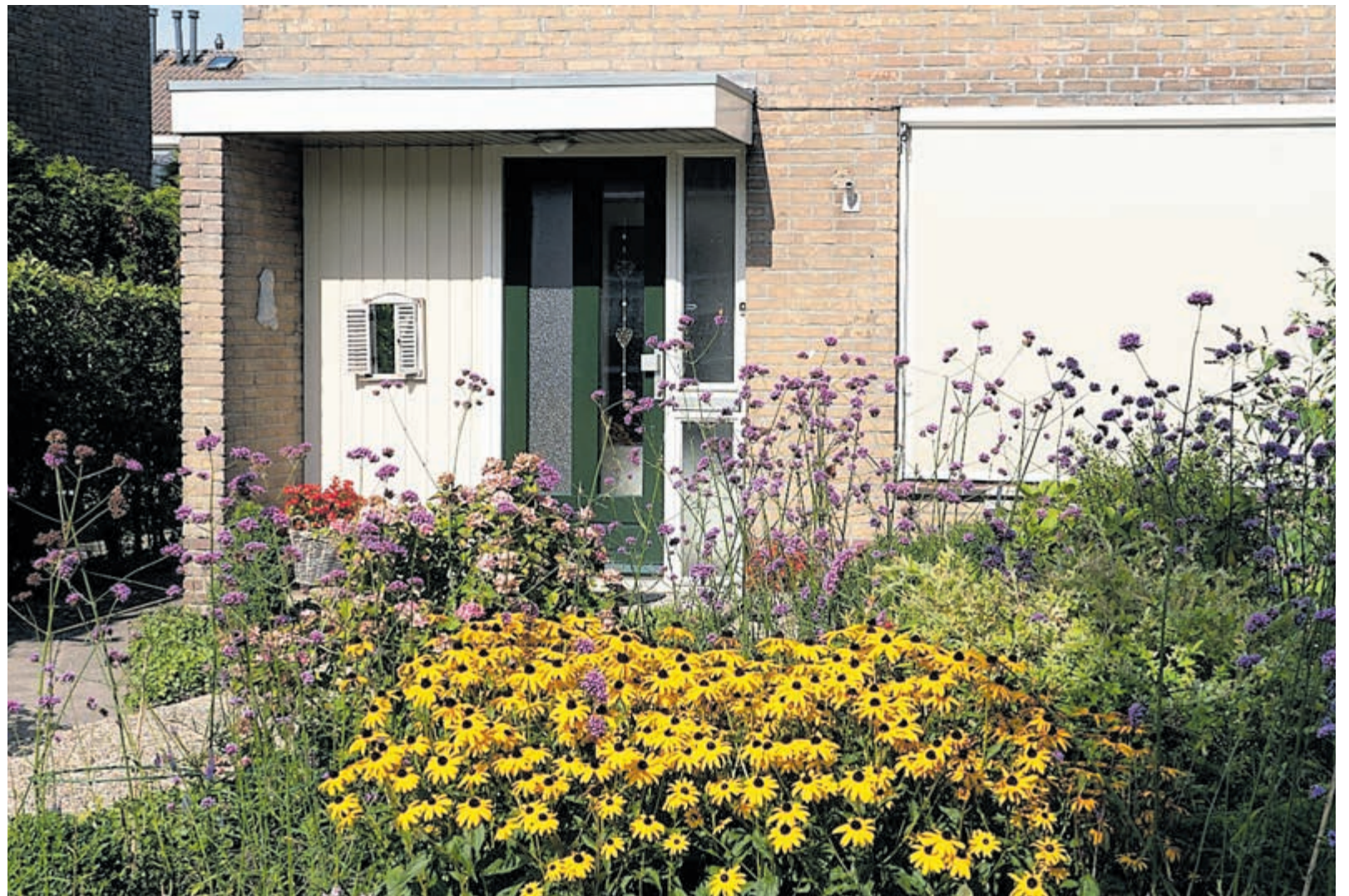
Voorbeeld van een Duintuin.

Iedereen kan een Duintuin laten maken, je hebt er geen groene vingers voor nodig. Dankzij een checklist, helder stappenplan en inspirerende plantenlijst, kunnen bewoners direct zelf aan de slag. De duintuinplanten zijn vanaf heden te koop bij diverse tuincentra rondom het Park, als onderdeel van het assortiment 'Wild en Inheems'. Op de website www.jouwduintuin.nl kunnen bewoners allerlei praktische materialen en handige informatie vinden om mee te kunnen doen. Als bewoners hun Duintuin aanmelden op de site ontvangen ze hun eigen Duintuinbordje en maken ze kans op een van de tuincheques. Zo kunnen ze hun Duintuin nog mooier maken!