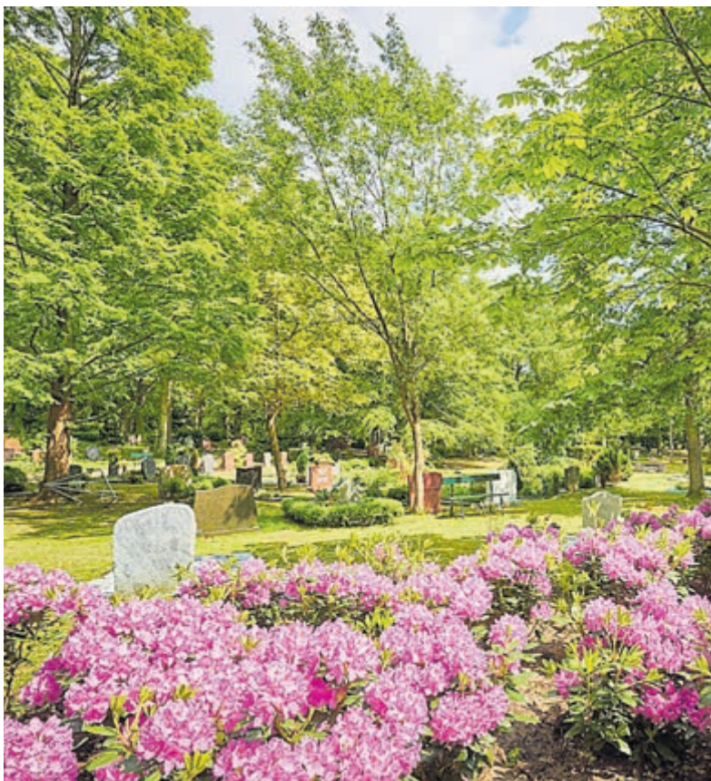
Vele vogelsoorten voelen zich thuis op Westerveld.

over de verschillende bekende en minder bekende vogelsoorten die het gedenkpark herbergt. „Westerveld heeft prachtige natuur“, vertelt Jaco Kuiper, medewerker van Westerveld én een echte natuurliefhebber. „Ik sta elke dag weer versteld van alles wat ik in het park tegenkom. Hopelijk kan ik de bezoekers dat op 1 mei ook laten zien!“ Wandelt u mee? Aanmelden kan tot 29 april via info@bc-westerveld.nl (naam en aantal personen).