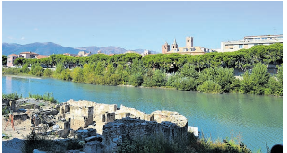
Uitzicht op rivier de Centa met op achtergrond de torens van de stad. Vooraan de opgravingen van San Clemente.

Albenga is door de eeuwen heen aanvankelijk een belangrijke stad geweest, mede in haar vroege periode door haar ligging aan zee en aan de rivier de Centa (betekent overigens ook 100). De Liguriërs, die leefden als zelfstandig volk van de steentijd tot in de bronstijd, moeten deze nederzetting ergens in deze periode als dorp hebben gesticht, dat uitgroeide tot hun hoofdplaats. Wanneer dit precies was, is niet helemaal duidelij-