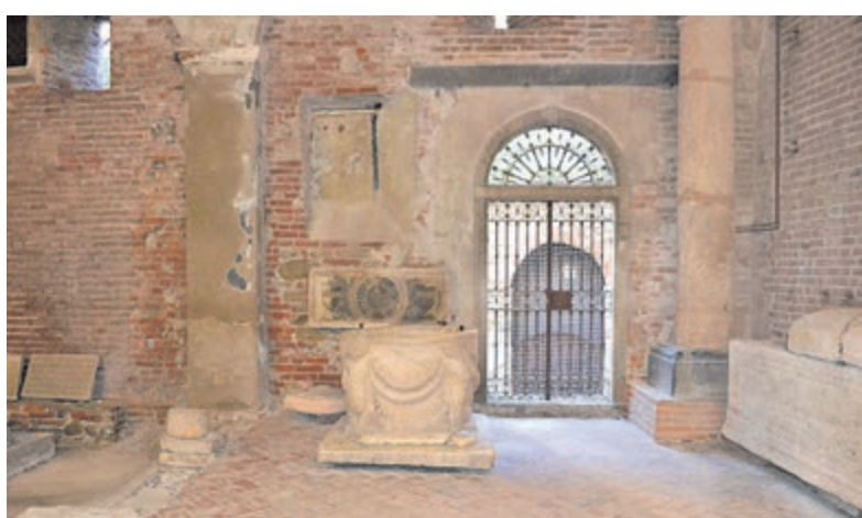
Archeologen komen aan hun trekken in Albenga.