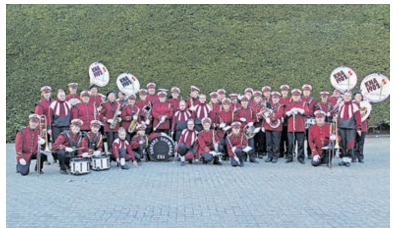
Corsokorps Bij De Konijnenberg in 2019.

Diverse muzikanten van verenigingen in en rond Kennemerland die normaliter in een zittend orkest spelen hebben ingeschreven voor het project 'Corsokorps' van KNA. Het corsokorps uit Heemstede-Bennebroek zal als eerste muziekgroep in de stoet door Heemstede naar Haarlem marcheren. Naast leden van KNA en leden van het Klijn Orkest lopen in dit projectkorps spelers uit diverse plaatsen tussen Hillegom en Heiloo mee. De slagwerkgroep komt bijvoorbeeld helemaal van boven het kanaal vanuit uit Beverwijk en van FSH uit Heiloo.