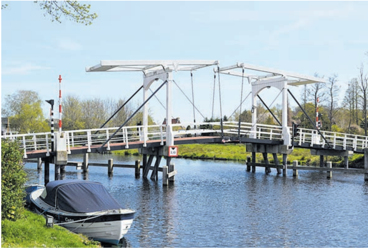
De Kwakelbrug.