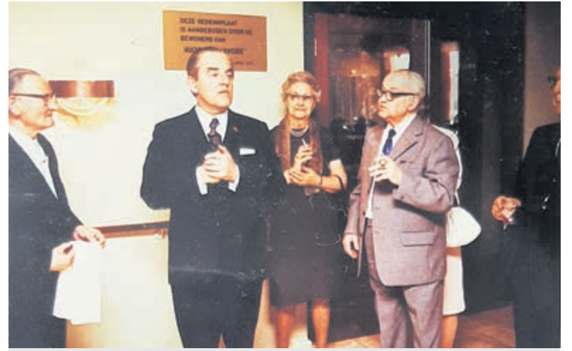
Opening van Schalkweide in 1972.

Sinds 1995 hoort Schalkweide bij Sint Jacob, de overkoepelende ouderenzorgorganisatie met zeven woonzorgcentra en een revalidatiekliniek