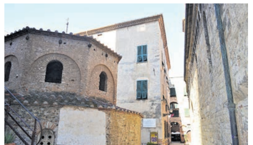
Doopkapel (Il Battistero, bouw vijfde eeuw).