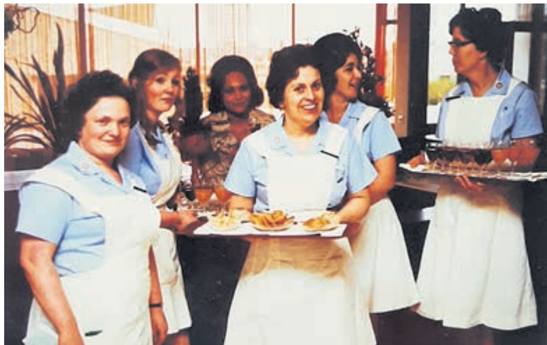
Oude foto van personeel in Schalkweide.

Op de jubileumdag 19 april stond de bewoners en medewerkers van Schalkweide een feestelijke dag te wachten. Met vrolijke versiering, gebak bij de koffie en rond de lunch een echte food market met allerlei lekkers. Als klap op de vuurpijl maakt een professionele fotograaf portretten van iedereen die dat wil. "Eigenlijk maken we in Schalkweide van iedere dag een feestje", besluit Boonstra. "Maar op de jubileumdag geven we het extra glans."