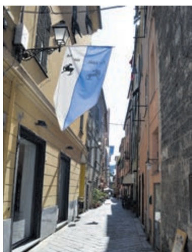
Je proeft de middeleeuwen.