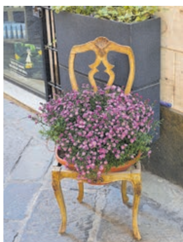
Gezellige straatjes in het centrum.