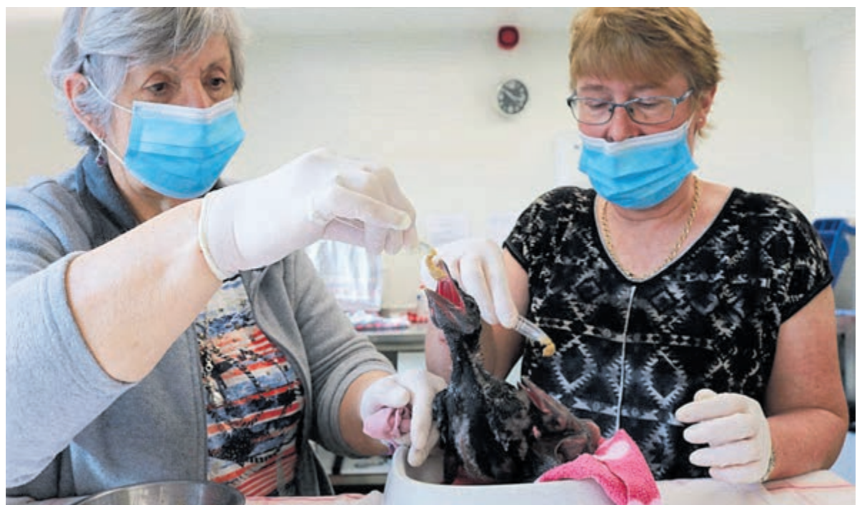
Vrijwilligers aan de slag in het Vogelhospitaal.