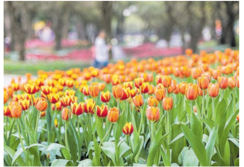
Bloemenfestival: tulpen.

Zoek een plekje in een van de gezellige horecagelegenheden of bij een buitenbar en geniet van de muziek die overal klinkt. Want u wilt het bloemencorso natuurlijk niet missen! Vanaf 20.15 uur rijdt het Bloemencorso Bollenstreek vanaf het gemeentehuis over de Raadhuisstraat en Binnenweg naar de Lanckhorstlaan. Parkeerverbod centrum vanaf 17 uur De straat wordt vanaf 17.00 uur volledig afgesloten voor verkeer. In de winkelstraat geldt vanaf 17.00 uur een parkeerverbod met afsleepregeling. Kom bij voorkeur lopend, op de fiets of met het openbaar vervoer.