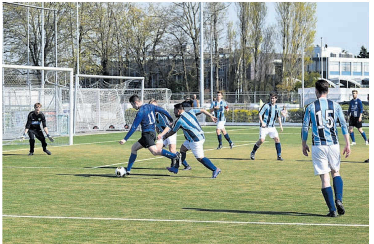
VEW vs. UNO.

Hoewel de wedstrijd al gespeeld was, bleef VEW tot het einde strijden voor meer doelpunten. Doelpunten die aan het einde van de rit nog wel eens de doorslag konden geven. De eerste periode is al in de knip, zodat VEW in ieder geval terug te zien is in de nacompetitie. Tenzij het rechtstreeks promoveert. Een kampioenschap behoort nog altijd tot de mogelijkheden. Met nog acht wedstrijden te gaan staat VEW op de tweede plaats met één punt minder dan Parkstad. VEW heeft nog wel een wedstrijd in