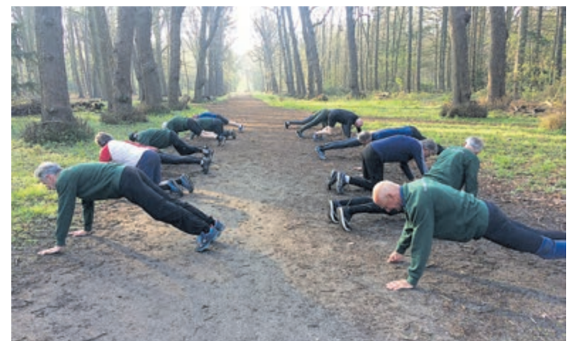
Trimmen met E.M.W.G.

Lijkt het u wat, kom dan vrijblijvend op de zaterdagmorgen tegen acht uur naar Groenendaal op de parkeerplaats naast de tennisclub en doe lekker mee. Wellicht wordt u een vaste deelnemer.