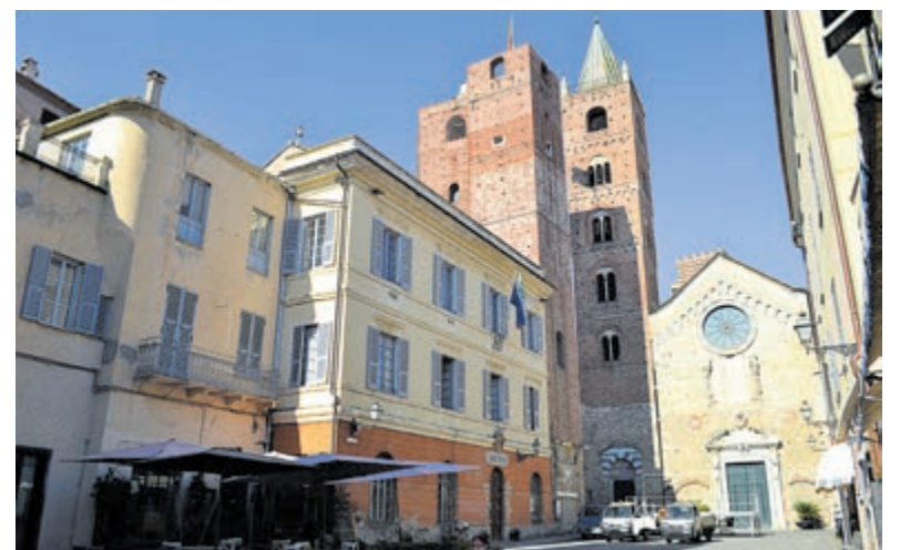
In het midden het stadhuis van Albenga, met op de achtergrond rechts de San Michele kathedraal en de drie torens.