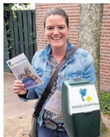
Alle kleine en grote beetjes helpen.

Meer informatie: www.vogelhospitaal.nl/help-mee/word-vrijwilliger/collectanten/ . Aanmelden via e-mail: n.bromet@vogelhospitaal.nl .