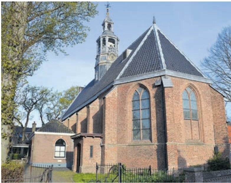
De Oude Kerk in de lente.

Het internationale muziekgezelschap dat op deze zondagmiddag in de Oude Kerk aan het Wilhelminaplein in Heemstede optreedt, kijkt uit naar uw komst en met hen de Heemstedse Kunstkring. Na afloop is er een lentereceptie om elkaar weer te ontmoeten onder het genot van een hapje en een drankje. Aanvang: 14 uur. Toegang voor leden is vrij, voor niet-leden €10,-.