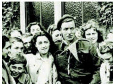
Canadese soldaat omringd door Heemstedse meisjes en kinderen.

De tentoonstelling is geopend op elke zaterdag en zondag in de periode van 16 april tot en met 6 mei, van 12 tot 16 uur, en op vrijdag 5 mei van 12 tot 17 uur. De toegang is gratis. Zolang de voorraad strekt is de speciale uitgave van HeerlijkHeden 'Tweede Wereldoorlog en Bevrijding' uit 2020 tijdens de openingsuren gratis voor bezoekers verkrijgbaar.