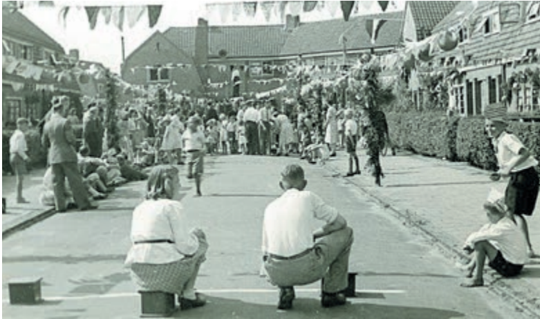
Bevrijdingsfeest op het Heemstedeplein in 1945.