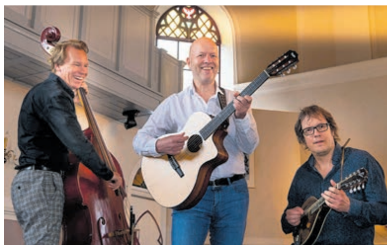
De Corte en Consorten.

Vanaf half uur voor aanvang is de zaal open. Toegang vrij, na afloop collecte met richtlijn €10,-.