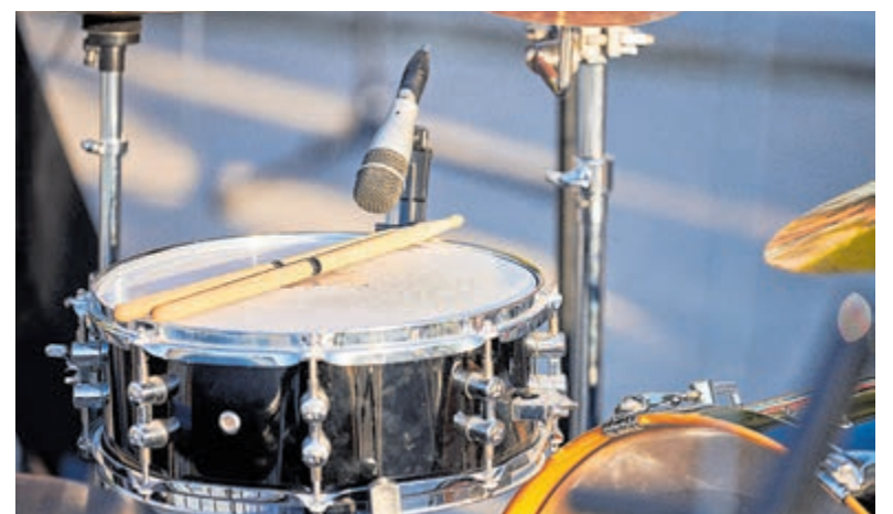
Percussie.