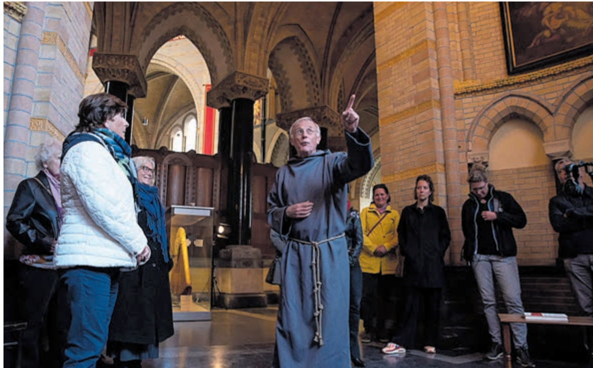
Theatrale rondleiding in De KoepelKathedraal.

De 14 heiligen zijn in 1989 vereeuwigd door kunstenaar Henk Hilterman. Daarmee werd de KoepelKathedraal, naar ontwerp van Joseph Cuypers, weer een stukje verder 'voltooid'. Onder deze 'heiligen' zijn Titus Brandsma en een Haarlems Klopje, oftewel een 'geestelijke