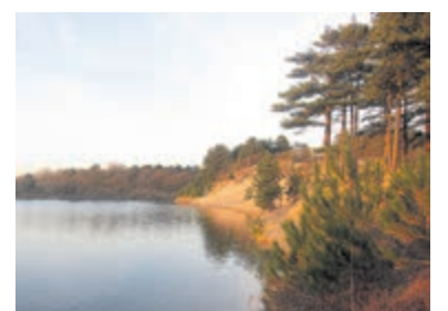
De Oosterplas.

Bloemendaal - Op zondag 23 april om 09:30 uur houdt IVN Zuid-Kennemerland een excursie rondje Oosterplas. Tijdens deze excursie genieten van het duinlandschap. Hoe zijn de duinen ontstaan en welke veranderingen hebben zich in de afgelopen eeuw voorgedaan. Wie zijn hier bij betrokken geweest en welke invloed hebben de exoten op de biodiversiteit in de duinen. En welke invloed hebben de mensen gehad op de duinen. Ieder jaargetijde heeft zijn schoonheid en er is altijd genoeg te zien. In de lente ontwaakt de natuur uit zijn zogenaamde winterslaap. Welke bloemen, struiken en bomen later hun bladeren zien en hoe verspreiden zij hun stuifmeel. In ieder jaargetijde is er dus voldoende te leren over de duinen. Vanaf het uitzichtpunt Starrenberg heb je een mooi gezicht op de duinen. Zowel de binnenduinrand als het strand zijn vanaf dit punt te zien. Start: bij het informatiebord ingang Bleek en Berg aan de Bergweg in Bloemendaal. Dit is een excursie in het Nationaal Park Zuid-Kennemerland. Reserveren/aanmelden (verplicht) via www.np-zuidkennemerland.nl . Informatie di. t/m zo. via 023-5411123.