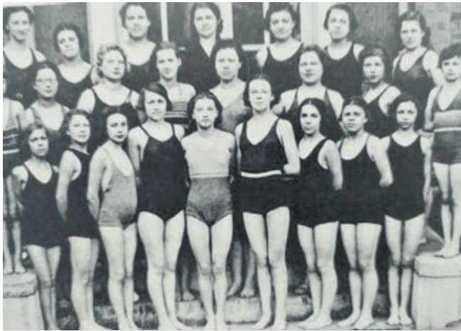
Oude foto uit jaren dertig van een dameszwemteam in La Piscine.