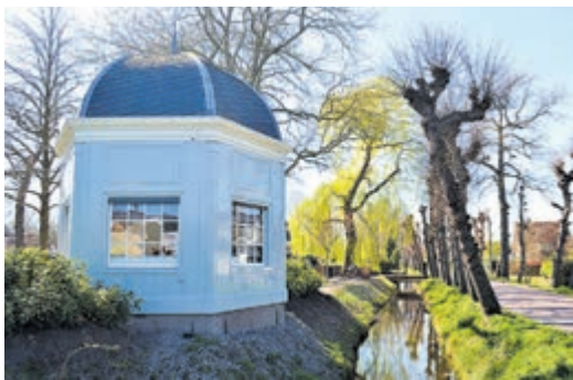
Een van de theekoepeltjes in Loenen.

Kortom: een korte dagtrip naar Loenen aan de Vecht is zeker niet 'lou loene'. Het schilderachtige dorp is absoluut uw bezoek waard. En neem vooral als dit kan uw fiets mee om de route langs de mooie Vecht te ontdekken.