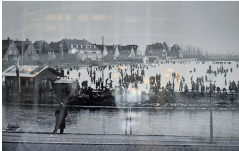
De weilanden rond het Spaarne met de IJsbaan de Volharding.

De tentoonstelling in het Raadhuis is tot 10 mei op werkdagen te bezichtigen. In Bennebroek in het Centraal Servicepunt Kerklaan 6 tot 14 mei. Het Pomphuis is open op zaterdag en zondag van 11 tot 15u behalve de Paasdagen en sluit op 10 mei. Zie ook de website van de HVHB.