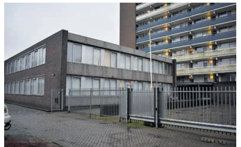
Opvanglocatie Kerklaan 61.