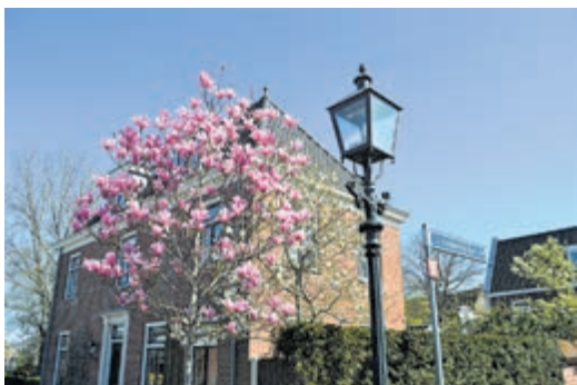
Lente in Loenen.