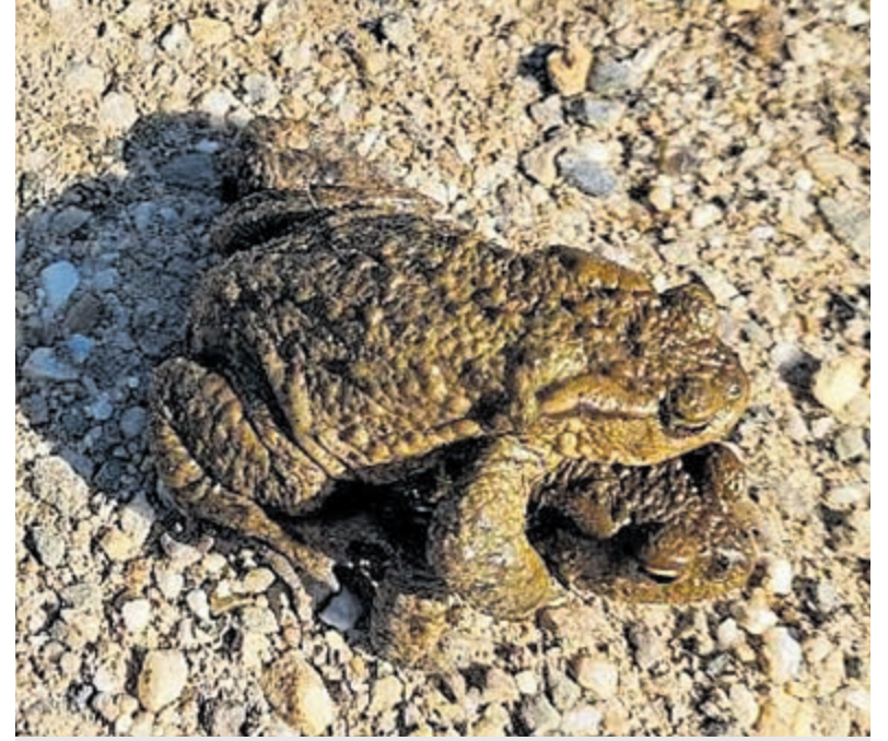
Mannetje op de rug van het vrouwtje tijdens de paddentrek in Leyduin.

De pad is zeer kieskeurig in het kiezen van water en kan kilometers afleggen tot het water van hun gading is gevonden. Dit heeft waarschijnlijk te maken dat ze naar hun eigen geboorteplaats trekken. Dit geschiedt niet zonder risico. Tijdens deze reis komen veel padden om in