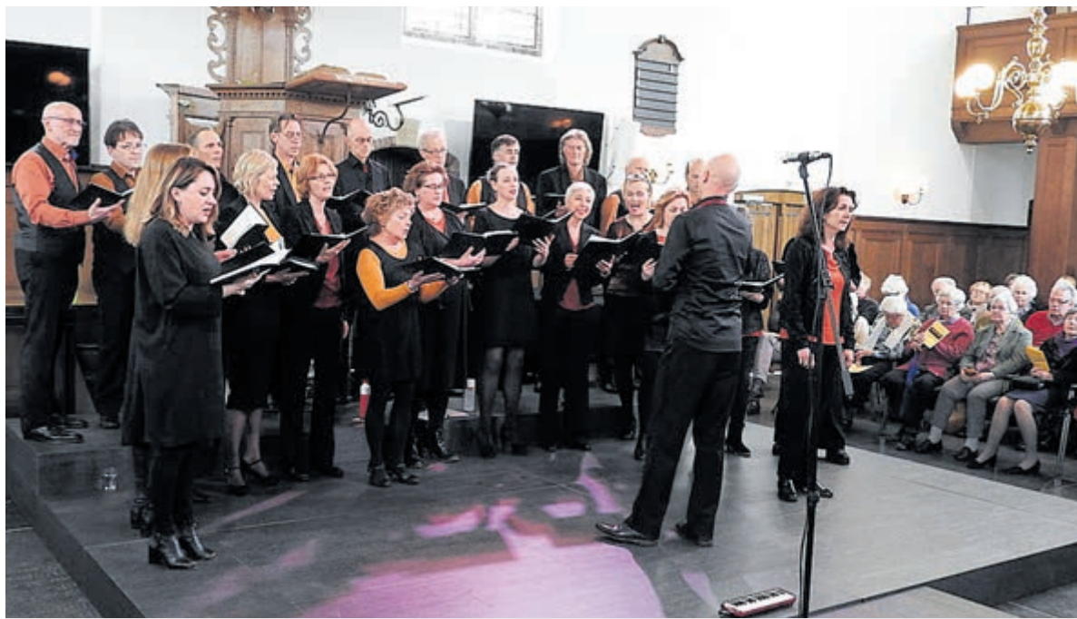
Vierstemmig koor Slavuj.

is een tentoonstelling ingericht t/m dinsdag 10 mei naar aanleiding van het 75-jarig bestaan van de vereniging. Aan de hand van foto's en voorwerpen laat de tentoonstelling zien hoe rijk en divers het culturele en sportieve leven in Heemstede sinds 1947 was. Bekende namen komen aan bod: van RCH-voetbalclub Heemstede en de Koninklijke Roei- en Zeilvereniging Het Spaarne tot Theater Minerva en Studio Bovema - maar ook de internationale bloemententoonstelling Flora van 1953. Vooraf aanmelden is verplicht: www.wijheemstede.nl , info@wijheemstede.nl of 023 - 5483828.