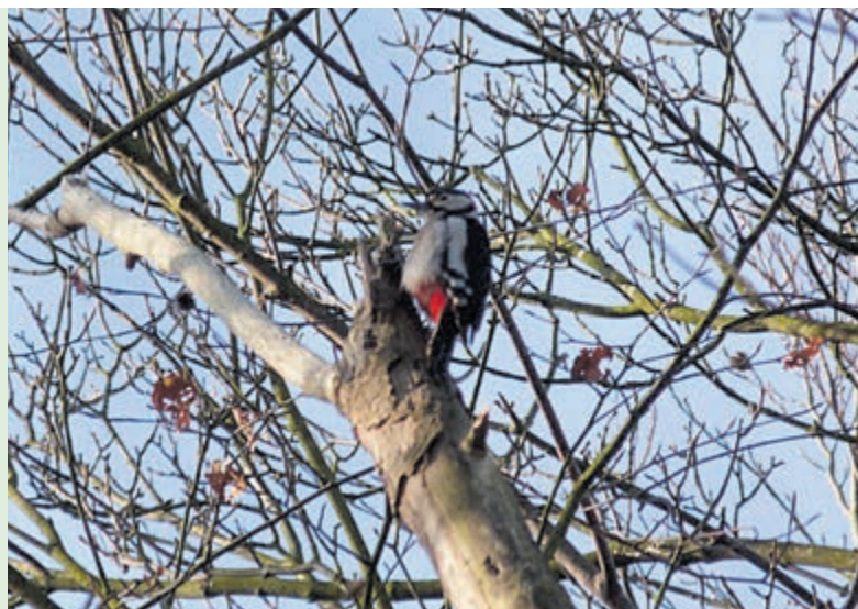
Bonte specht.

Vertrek vanaf ingang buitenplaats Elswout, Poortgebouw, Elswoutslaan 12a, Overveen.