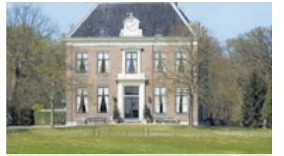
Huis te Vogelenzang.

Stinsenplanten zijn met name bol-, knol- en wortelstokgewassen die vanaf de 18e eeuw zijn ingevoerd (vaak uit Midden-Europa/nabije oosten) en aangeplant zijn rondom buitenplaatsen, kastelen en kloosters (stinsen – stenen gebouwen). Wil je ook nog weten welke familie hier al meer dan 200 jaar woont? Wat maakt het park en de gebouwen zo bijzonder dat het een Rijksmonument is? Ben je nieuwsgierig naar de invloed van de grootgrondbezitters op de ontwikkeling van het duingebied en van Zandvoort?