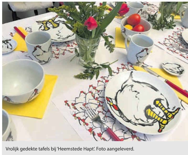
Vrolijk gedekte tafels bij 'Heemstede Hapt'.

Creëer een wereld voor iedereen www.ikziejewel.nl .