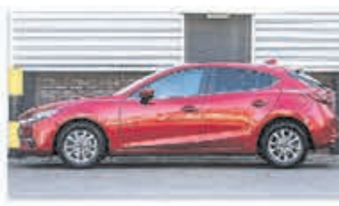
Mazda 3 2.0 S.A. 120 TS € 22.900,-