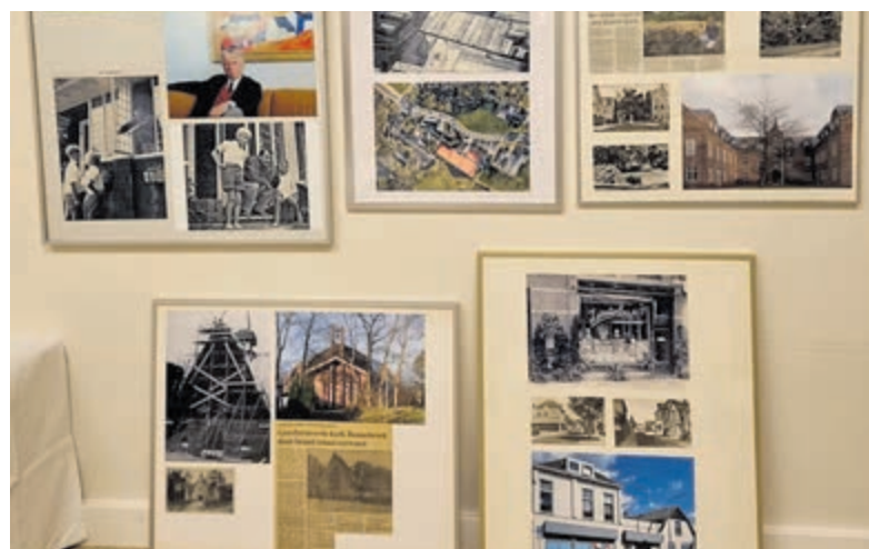
Tentoonstelling HVHB in Bennebroek.

van 24 maart tot en met 14 mei tijdens de openingstijden van Welzijn Bloemendaal en de bibliotheek.