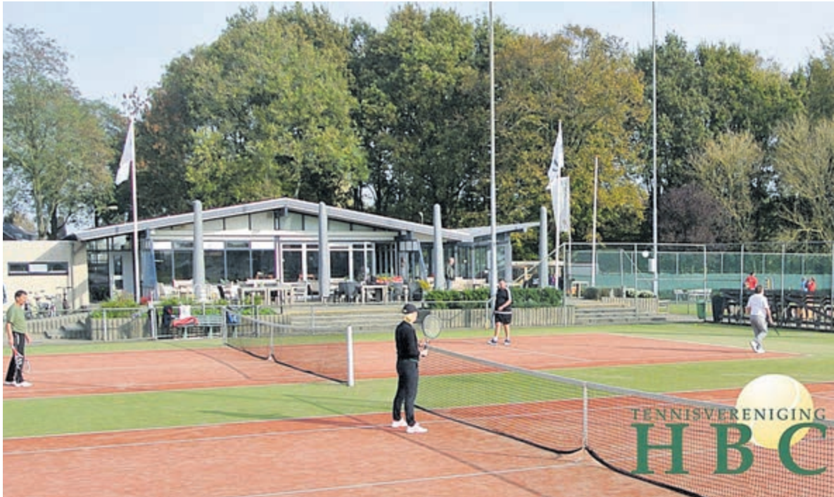
Gezellig tennissen op TV HBC.