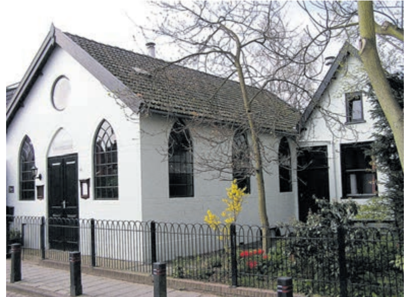
't Mosterdzaadje. Foto aangeleverd.

't Mosterdzaadje, Tel.: 023-5378625 www.mosterdzaadje.nl. Reserveren is mogelijk: penningmeester@mosterdzaadje.nl. Ook toegang zonder reserveren. Collecte met richtlijn 10 euro. Vanaf een half uur voor aanvang is de zaal open.