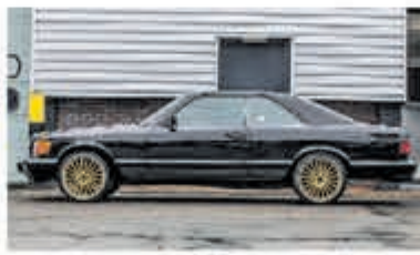
Mercedes-benz S-klasse 380 SEC € 10.950,-