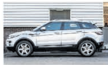
Land Rover Range Rover Evoque 2.2 eD4 2WD Prestige € 18.900,-