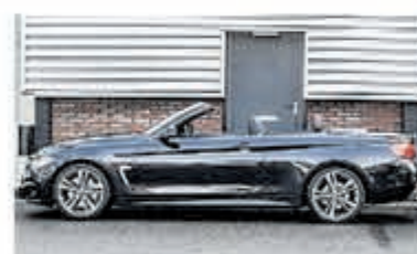
BMW 4 Serie 430i Cabrio € 49.950,-