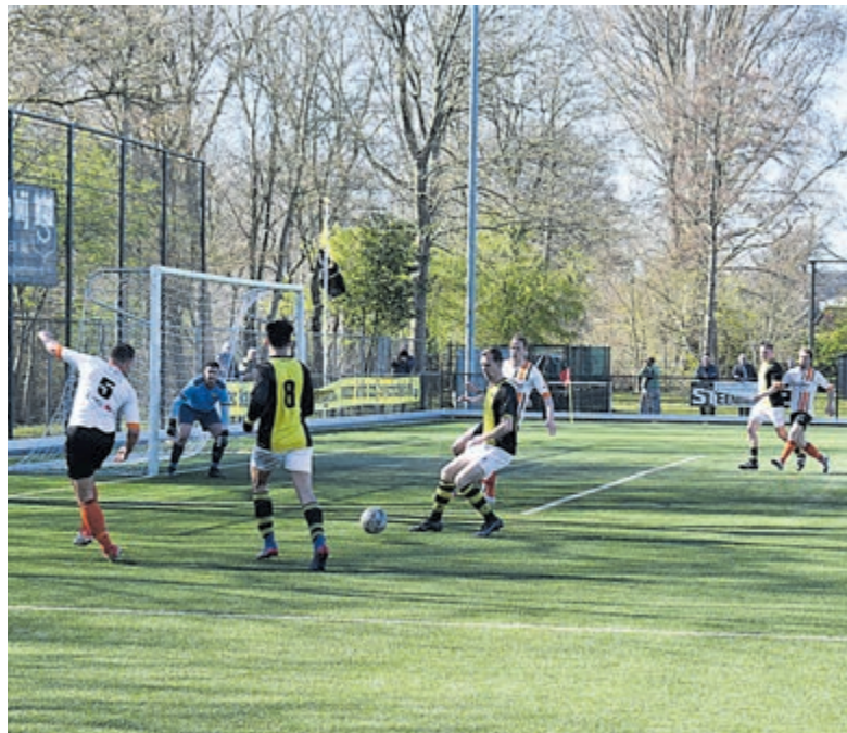
HBC tegen Schoten.

Schoten staat stijf onderaan, al is er nog hoop. Er staan nog drie verenigingen boven schoten met slechts drie punten meer. HBC lijkt af te stevenen op het kampioenschap met respectievelijk 9 en 14 punten voorsprong op de nummers twee en drie. Op 3 april speelt HBC thuis tegen de nummer vier SV DIOS.