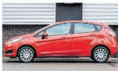
Ford Fiesta 1.0 EcoB. Vignale € 11.900,-