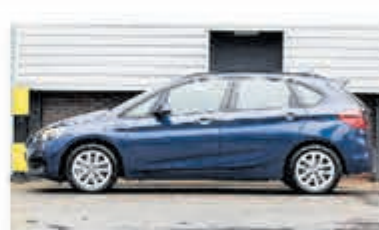
BMW 2-serie Active Tourer 225xe iP eDr. Ed. € 32.950,-