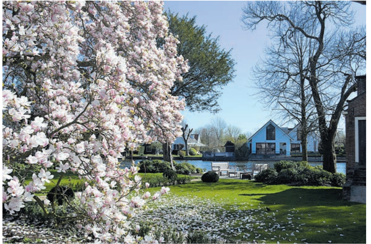
Loenen met gezicht op de Vecht.

Opvallend is dat deze buitens vaak voorzien werden van een extern theekoepeltje of theepaviljoen, waarvan er nog steeds enkele te zien zijn. Zo'n theepaviljoen, wel of niet gevestigd langs de Vecht, was een teken van status en natuurlijk een uitgelezen en chique ambiance om met elkaar te keuvelen en thee te drinken. De ligging was eveneens praktisch als je met de boot wilde aanleggen. Veel buitenplaatsen werden ook voorzien van een orangerie of koetshuis, die eveneens gezien werden als pronk- en statussymbolen.