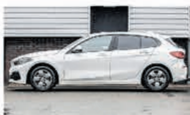
BMW 1-serie 118i € 28.900,-