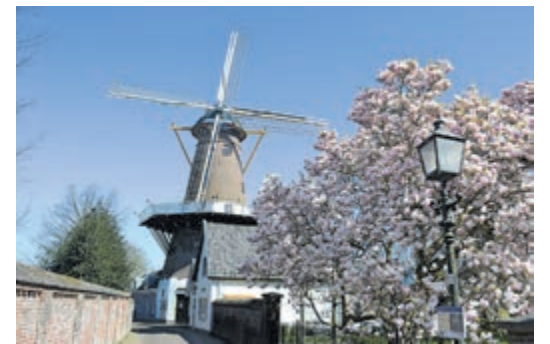
Korenmolen De Hoop.