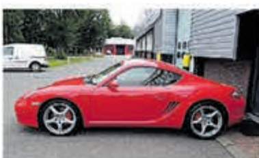
Porsche Cayman S Tiptronic Uniek 71.000 km € 31.950,-