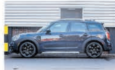
Mini Countryman 1.5 Cooper Salt € 26.950,-