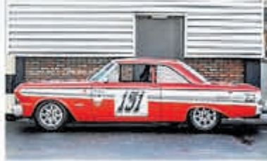
Ford Usa Falcon FUTURA SPRINT € 79.000,-