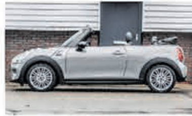
Mini Cooper Cabrio 1.5 C. Chili S. Bns € 25.950,-