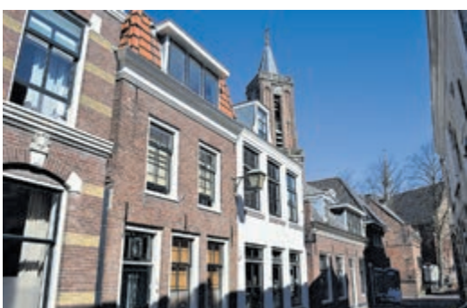
Schattige straatjes in Loenen.