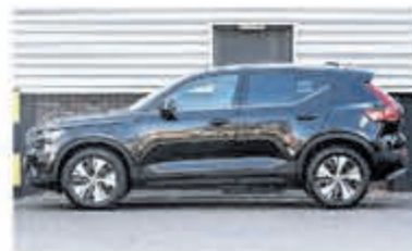
Volvo XC40 1.5 T5 Rech. Inscr. € 43.950,-

Turenhout de occasiondealer van Heemstede en al meer dan 40 jaar uw vertrouwde onderhoudsadres.