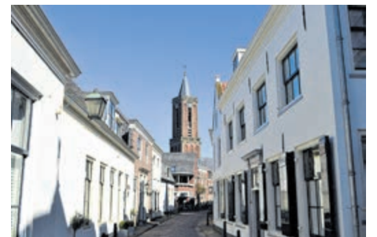
Slenteren door het oude centrum van Loenen.