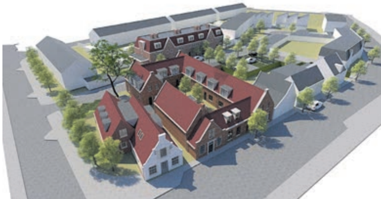
Plan van de te realiseren woningen. Beeld aangeleverd.

Heemstede - Op vrijdag 1 april, van 19-21 uur is er weer Kinderdisco (6-10 jaar), bij Plexat in de Luifel, Herenweg 96 in Heemstede. Lekker dansen en springen voor de kinderen van de basisschool met een échte DJ. Bij binnenkomst worden naam en telefoonnummer van het kind genoteerd, zodat ouders hun kind zorgeloos kunnen achterlaten. Ouders kunnen eventueel intussen in de naastgelegen foyer van WIJ Heemstede in de Luifel een kopje koffie drinken. Kosten: 3 euro inclusief iets lekkers en 2 limo. Wilt u uw kind wel van tevoren aanmelden via: plexat@wijheemstede.nl.