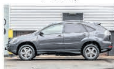
Lexus RX 400h Edition € 11.750,-