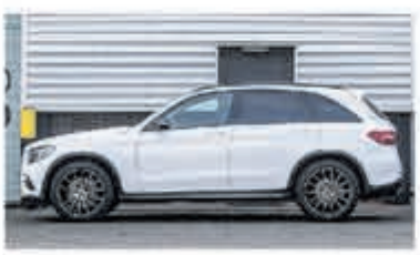
Mercedes-Benz GLC-klasse 250 d 4MATIC € 48.900,-