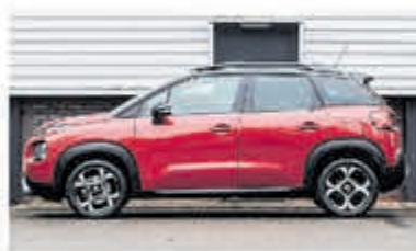
Citroën C3 Aircross 1.2 PT S&S Shine € 24.950,-