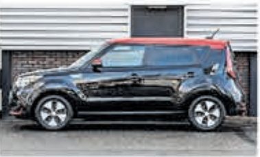
Kia E-Soul ExecutiveLine 30kWh € 21.950,-