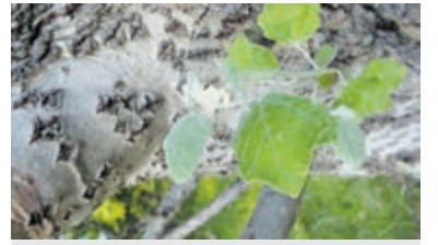
Bomenexcursie op Duin en Kruidberg.

Santpoort-Noord – Op zaterdag 9 april organiseert IVN Zuid-Kennemerland om 14 uur een bomenexcursie op Duin en Kruidberg. Wist u dat een beukenbos vroeger ook wel 'Heilige Hallen' werd genoemd? En een eikenboom in de zomer 'de koning van de natuur'? Welke eigenschappen maken echter dat u een beuk van een eik kunt onderscheiden? Of een berk van een witte abeel die ook een witte stam heeft? Door te kijken naar blad en bloem komt u heel wat aan de weet. Er staan diverse inheemse boomsoorten zoals de eik of taxus; maar ook later aangeplante soorten zoals de witte abeel, een populierensoort, komt u er tegen. Samen met een gids leert u de bomen herkennen aan de hand van een speciaal daarvoor ontwikkelde bomenkaart. Doordat het bos afgewisseld wordt met open terrein met struiken als meidoorn en duindoorn, krijgt u tijdens de wandeling bovendien de kans om de veelzijdigheid en geschiedenis van het gebied te ervaren.