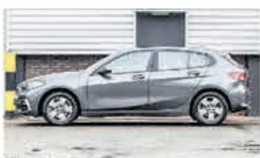
BMW 1-serie 116d Sp.Line Edition € 34.950,-