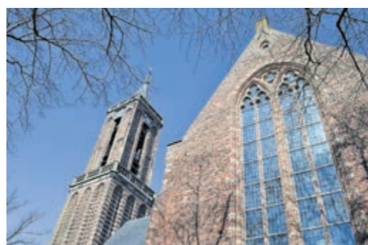
Grote of Nederlands Hervormde Kerk.