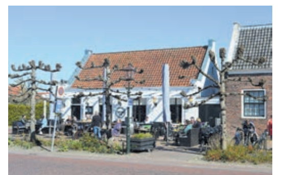
Loenen is geliefd bij fietsers.