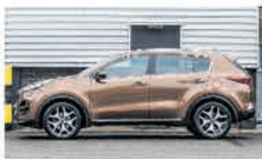
Kia Sportage 1.6 T-GDI 4WD GT-L. € 25.750,-