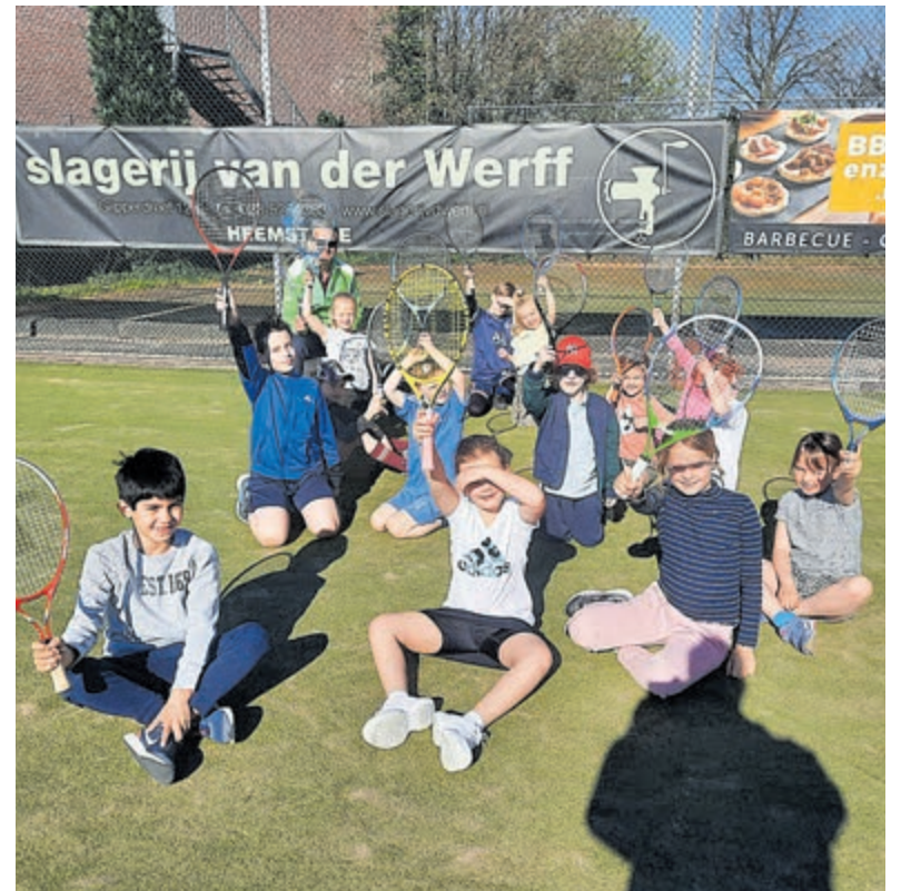
Jeugd tijdens Tennisfeest op TV HBC.

Kijk dan op de website www.tvhbc.nl voor alle informatie over de tennisvereniging.