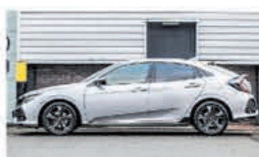
Honda Civic 1.5 i-VTEC Sport + € 24.950,-