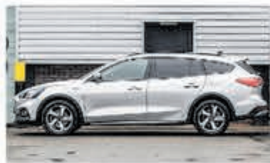
Ford Focus Wagon 1.0 EcoB. Tit. Bns € 27.900,-