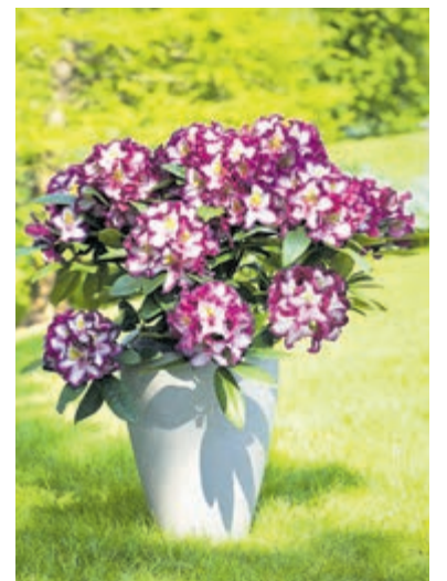
Happydendron. Foto aangeleverd door Happydendron.

De Happydendron is vanaf april verkrijgbaar in diverse potmaten bij tuincentra en online vanaf € 30,-. Kijk voor meer informatie op: www.inkarho.de/nl/happydendron .