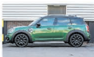
Mini Countryman 2.0 Co.S E ALL4 Chil € 38.900,-