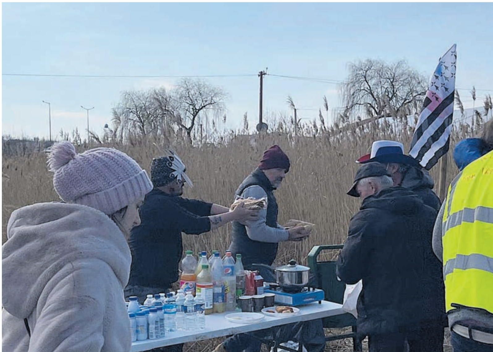
Oekraïense vluchtelingen bij Pools/Oekraïense grens.