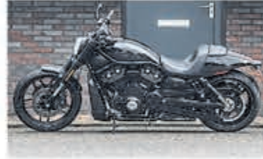
Harley Davidson Chopper VRSCDX Night-Rod Sp. € 18.950,-