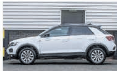
Volkswagen T-Roc 1.5 TSI Style Bns € 28.900,-