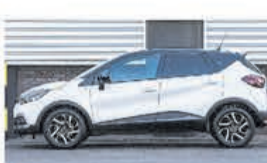
Renault Captur 1.2 TCe Bose € 17.950,-