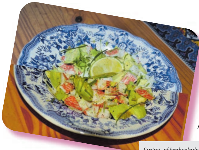
Surimi- of krabsalade met avocado, peper, limoensap en bieslook.

Nu de lente in aantocht is, ontstaat de behoefte om de zware winterkost in te ruilen voor frivole en verfrissende lentege-rechten. Het voorjaar kent weer andere verrassende smaken en kleurrijke ingrediënten ter afwisseling. De nieuwe modetinten roze, wit en pastelgroen komen terug in deze heerlijk frisse salade van avocado, (gekookte) krab- of surimi (imitatiekrab van witvis), limoen, zwarte peper en gehakte verse bieslook. Hoe toepasselijk. Niet moeilijk te maken, lekker en gezond!