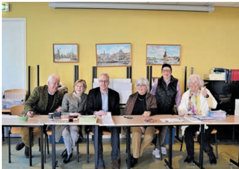
Vrijwilligers op het stembureau op het Kerkplein in Bloemendaal.

Kijk voor de volledige verkiezingsuitslagen en het stemgedrag in de gemeente Bloemendaal op: www.bloemendaal.nl/over-de-gemeente/verkiezingen/uitslagen .