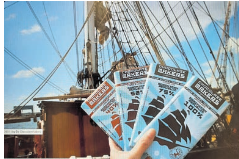
Chocolade van Chocolatemakers.

Bij de Wereldwinkel vindt u een tiental verschillende smaken, uitgesteld in een leuke display. We nodigen u uit om te komen