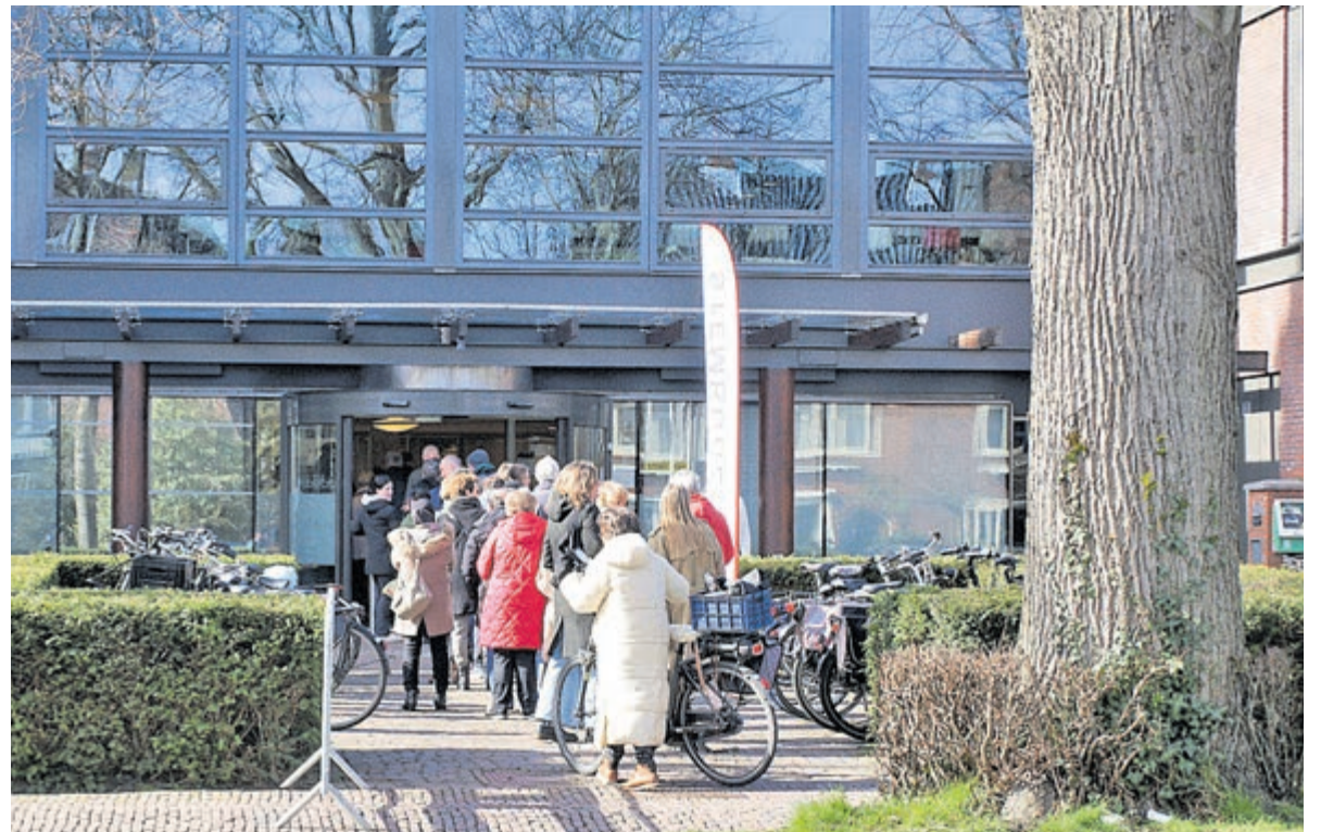
Rijen bij het Raadhuis.

Bij het stemlokaal van het Drinkwatermuseum Waternet Heemstede daarentegen heerst een serene rust. Het uit 1853 stammende voormalig pompstation is een bezienswaardigheid op zich, ook voor kinderen. Vorig jaar was dit stembureau nog een portocabin, maar nu is het museum zelf opengesteld. Wie geïnteresseerd is kan een rondleiding en uitleg krijgen van de beheerder. Het pompstation, thans een provinciaal monument, dateert uit de tijd toen de Amsterdamse