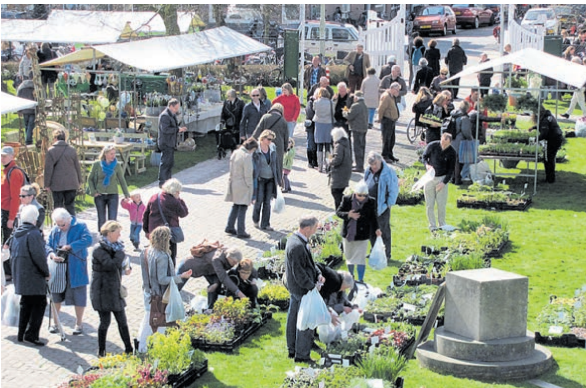
Bio Lentemarkt.

Voor informatie zie: www.haarlemmerkweektuin.nl https://www.facebook.com/Biomarkt-Haarlemmer-Kweektuin-zaterdag-286238091775380/ .