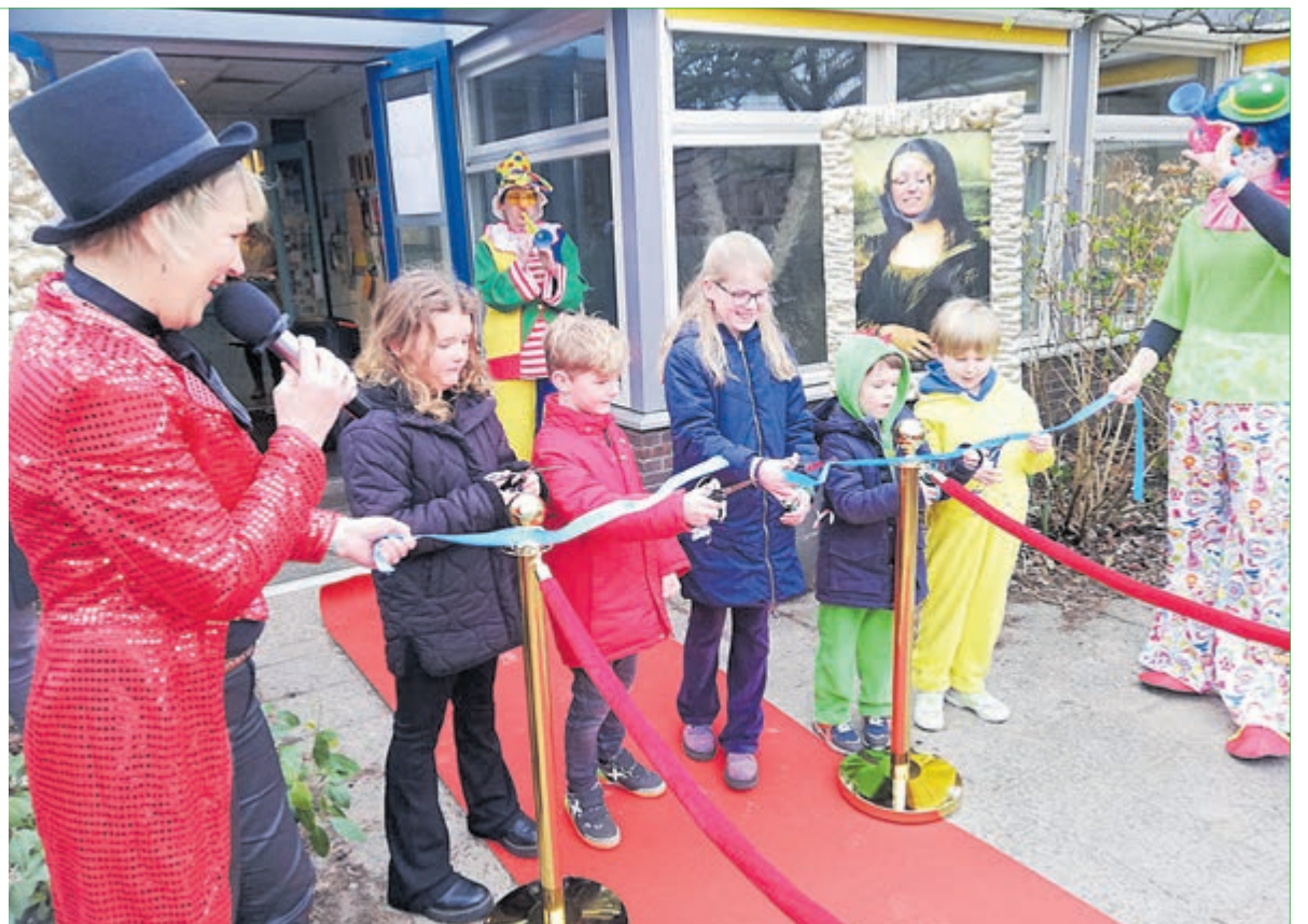
Opening van project 'Komt dat zien!' op De Evenaar.

De jongste leerlingen werden al getraakteerd op een spannende poppen-(kast) voorstelling gepresenteerd door theater Koekla. De oudere kinderen gaan een bezoek brengen aan het Rijksmuseum. Kortom, een project met voor ieder wat wils!