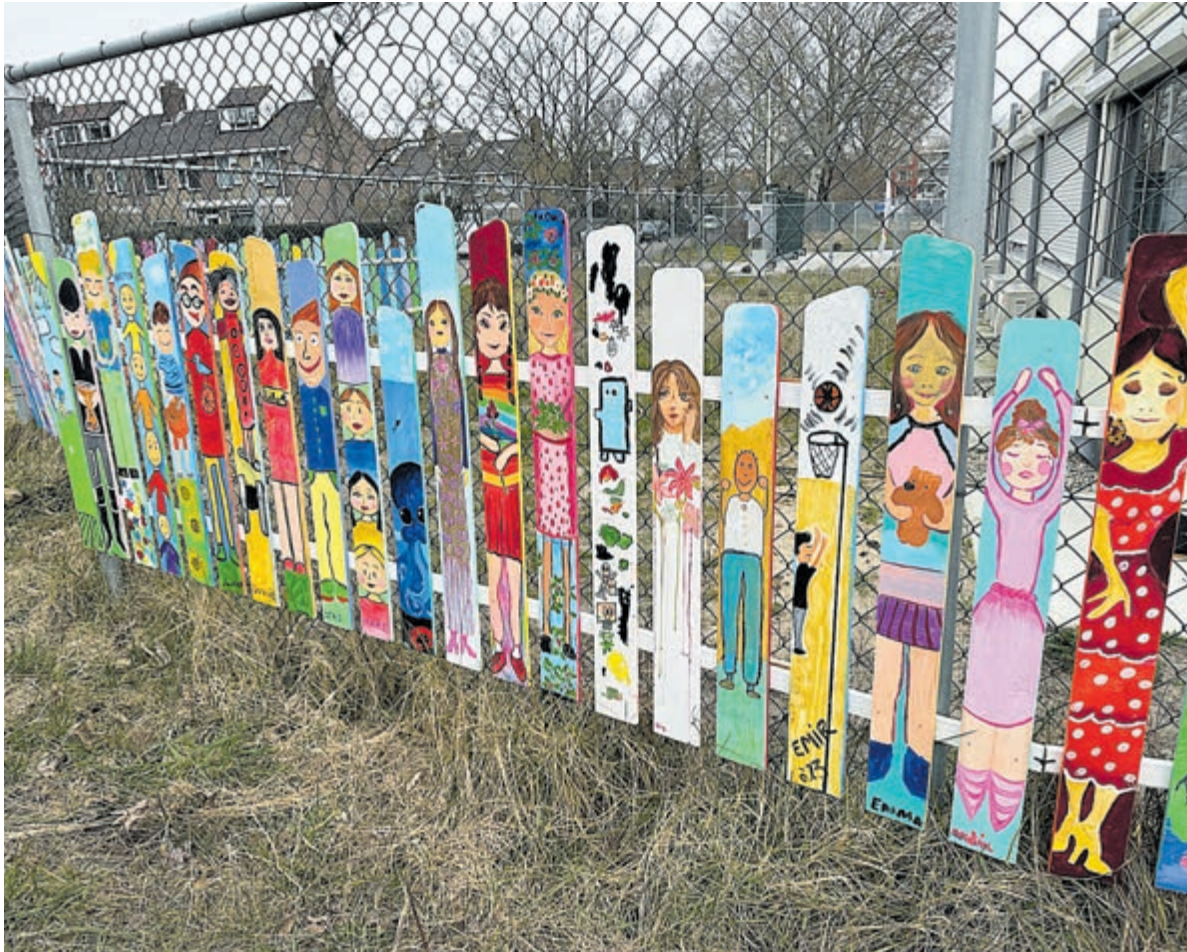
De kunstwerken door kinderen voor Opvanglocatie Curiedex.