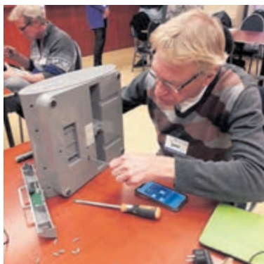
Drukte bij reparaties in het repaircafé.

Vogelenzang - Zaterdag 25 maart kan men daar weer terecht in het Dorpshuis van Vogelenzang (Henk Lensenlaan 2A in Vogelenzang). Afgelopen maand waren daar maar liefst 40 aangebrachte klussen met ook nog een topscore van 80% geslaagde reparaties. Het gemiddelde ligt doorgaans op zo'n 70% maar omdat een aantal zeer gedreven reparateurs een paar lastige klussen mee naar huis heeft genomen om daar in alle rust aan te werken werd de score extra hoog. Het is de laatste maanden steeds drukker bij repaircafé Vogelenzang, maar ook bij andere repaircafés. De trend zet duidelijk door om te proberen defecte apparaten en producten een tweede leven te geven in plaats van af te schrijven en weg te gooien. Denk hierbij aan keukenapparatuur, speelgoed, werktuigen, kleine kledingherstellingen