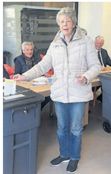
“Ja hoor, ik poseer wel even”, aldus deze sympathieke Bennebroekse die haar stembiljet in de rolemmer deponert.

Het heerlijke zonnetje zal wellicht bijgedragen hebben in een gang naar de stembureaus. Er zijn er duizenden in ons land. Meest in publieke ruimten als gemeentehuizen, scholen, buurthuizen en sporthallen. Of in een wooncomplex, zoals ‘De Voghelsanck’ aan de Teylingerweg in Vogelenzang. Ook hier is