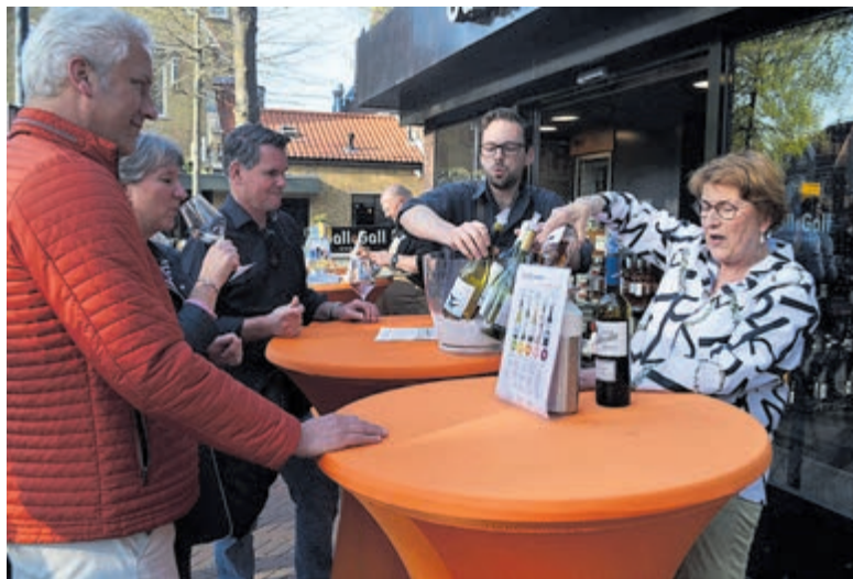
Wijnloop vorig jaar in Winkelcentrum Heemstede.

Wijn proeven tijdens De Wijnloop? Op de website www.dewijnloop.nl koopt u glazen à €17,95 per glas (+ €1,- reserveringskosten) die u de hele avond gebruikt. Op de site van De Wijnloop Heemstede klikt u meteen door naar de aankoop website. Tot en met vrijdag 21 april a.s. kunt u glazen kopen. Wees er snel bij, het