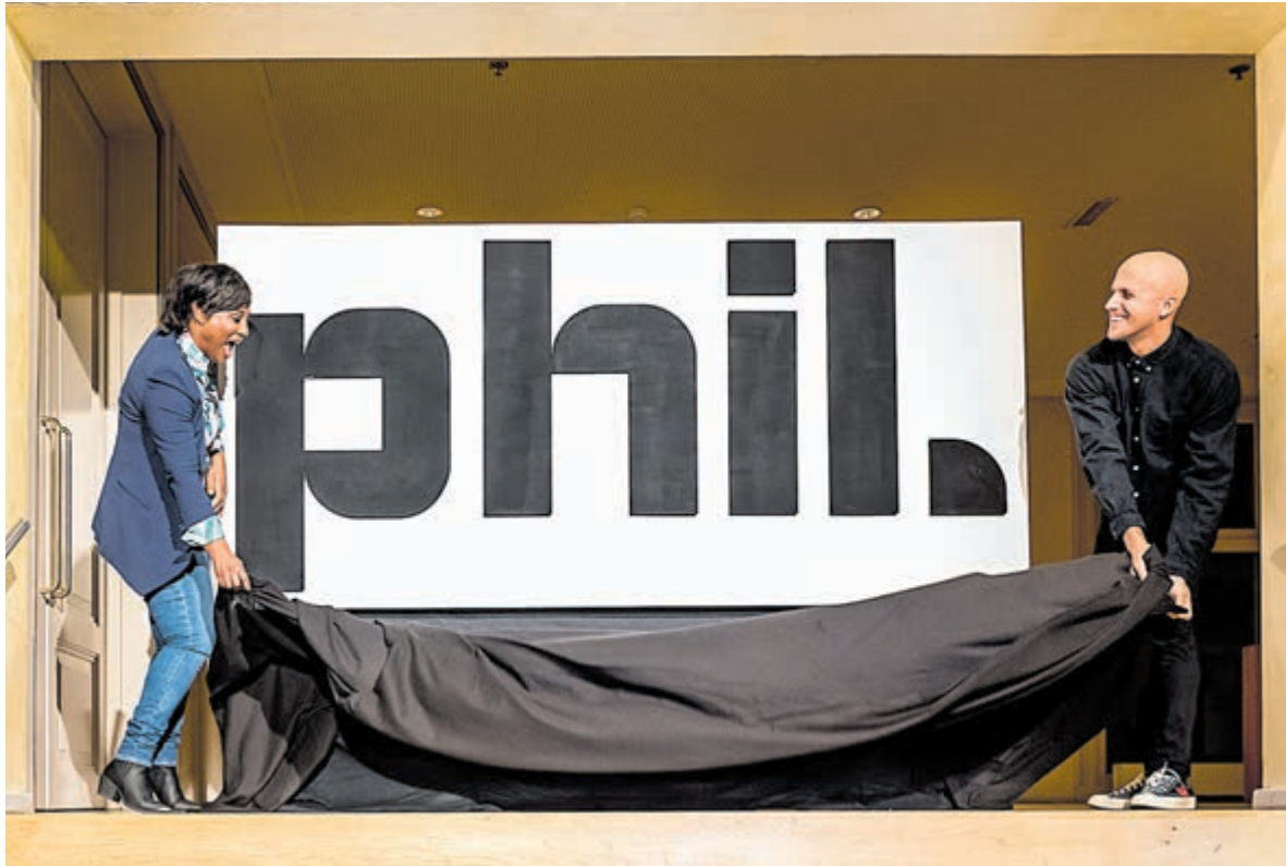
Onthulling nieuw logo door Edsilia Rombley (l) en Milow (r).

Overveen - Op zaterdag 1 april tussen 13-16 uur is het Repaircafé Overveen geopend in gebouw Tinholt van de Buurvereniging Overveen aan de Vrijburglaan 17 in Overveen. U kunt weer langskomen met uw defecte apparaten. Vakkundige reparateurs staan voor uw klaar om te kijken of reparatie mogelijk is; ruim 70% van alle aangeleverde defecte apparaten kon tot nu toe worden gerepareerd. Van defecte tuinscharen, bladblazers, boormachines, speelgoed tot defecte lampen en CD-spelers. Defecte koffiezetapparaten kunnen vrijwel nooit worden gerepareerd omdat de fabrikant dat onmogelijk maakt. Dat geldt ook voor TV-schermen. Wel kunt u langskomen met defecte klokken, oude pendules, horloges e.d. Er is een uitstekende klokkenmaker om u daarbij te helpen. Reparaties aan sieraden (geen gietwerk) kunnen eventueel worden ingeleverd om elders gerepareerd te worden. Ook kleine kledingreparaties zijn welkom; echter geen ritsen, de kleding dient schoon te zijn en maximaal twee kledingstukken per bezoeker. Voor vragen over reparaties kunt u mailen naar repaircafe@duurzaamoverveen.nl of bellen met 0651-160.881. Informatie over het Repair Café, het Kledingruil Café en over Vereniging Duurzaam Overveen vindt u op de website https://duurzaamoverveen.nl . Verzoek: kom niet vóór 13 uur, dan worden de ruimtes nog ingericht. Graag parkeren in de Willem de Zwijgerlaan.