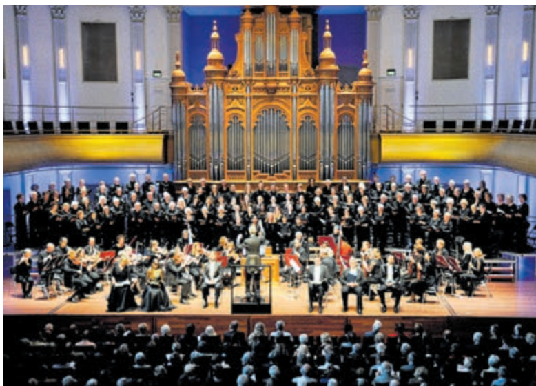
Het COV Haarlem.

Johann Sebastian Bach heeft met zijn Matthäus Passion, een verhaal van hoop, vertrouwen, vechtlust en liefde willen vertellen en vandaag de dag, bijna drie eeuwen later, klinkt zijn