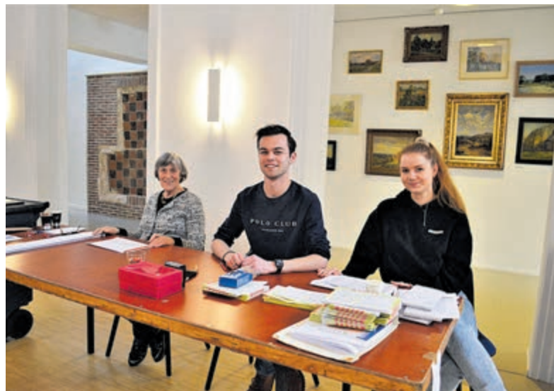
Vrijwilligers op het stembureau op het gemeentehuis in Overveen.