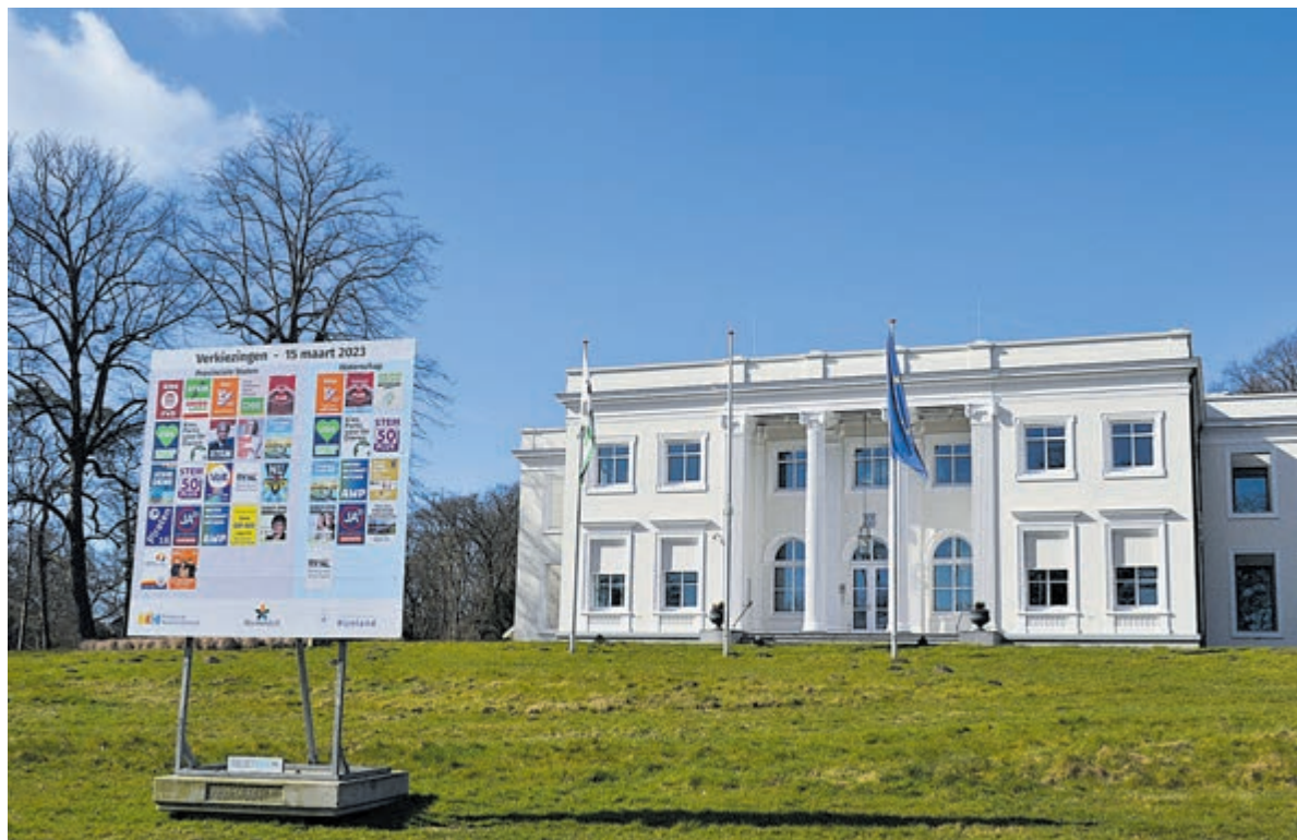
Verkiezingsbillboard bij het gemeentehuis van Bloemendaal.

De opkomst van de Waterschapsverkiezingen was dit jaar 71,8% tegen een opkomst van 65,1% in 2019. Ook bij de Waterschapsverkiezingen