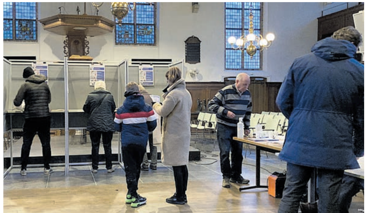
Ook in de Oude Kerk aan het Wilhelminaplein werd flink gestemd.