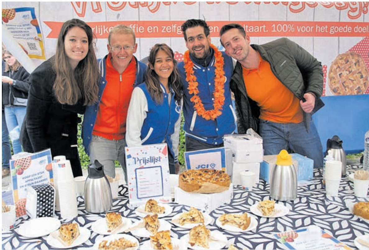
Koningsdag vorig jaar in Heemstede.