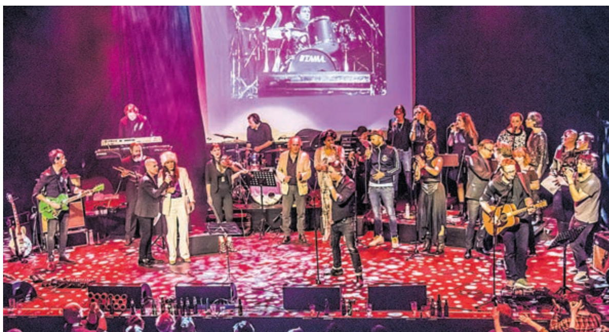
Finale RipLive 2018.