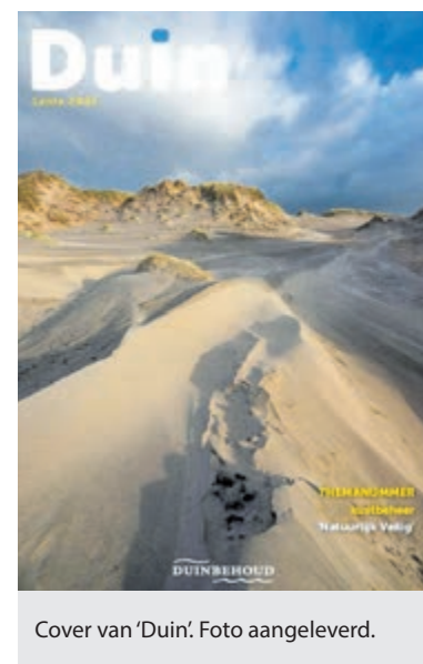
Cover van 'Duin'. Foto aangeleverd.