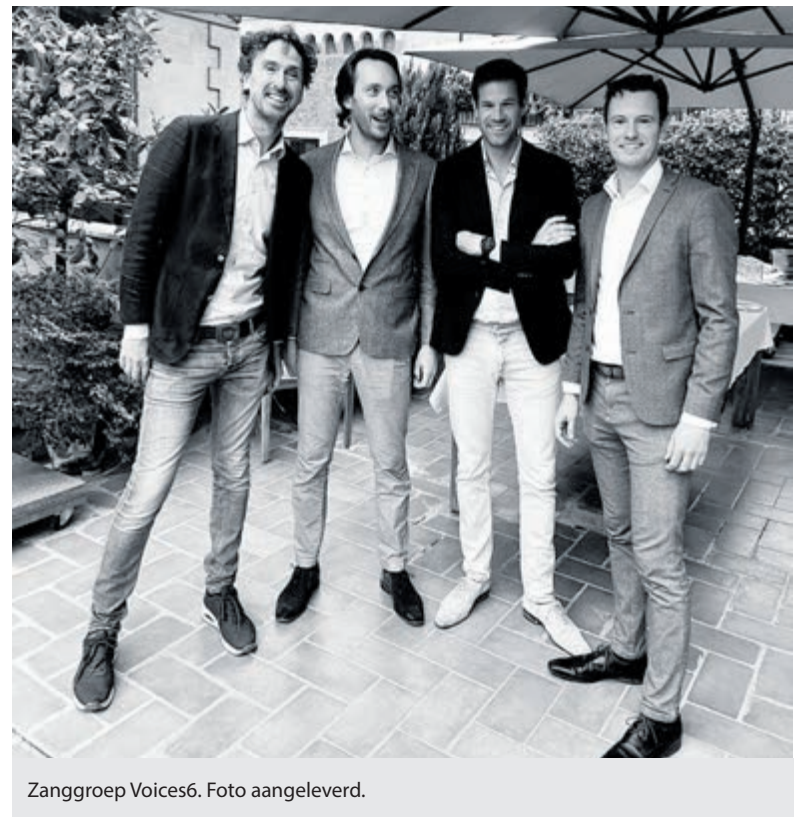
Zanggroep Voices6.

Meer informatie via 023-5378625 of via www.mosterdzaadje.nl . Vanaf een half uur voor aanvang is de zaal open. Toegang vrij, na afloop collecte met richtlijn €10,-.