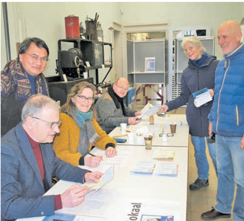
Stemmen in het Drinkwatermuseum.

De uitslag van de provinciale verkiezingen is in bovenstaand artikel te lezen. Eén ding is duidelijk. De partij van de vrouw die een jaar geleden haar entree maakte op het Binnenhof met een trekker heeft ook hier impact gemaakt.