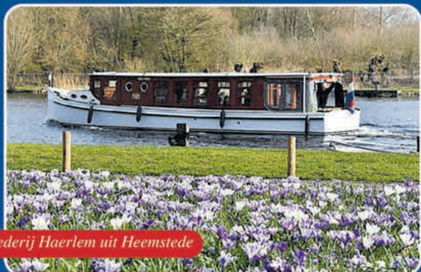
Rederij Haerlem uit Heemstede

Varen in Holland met de luxe salonboot 'Heerlijkheid'