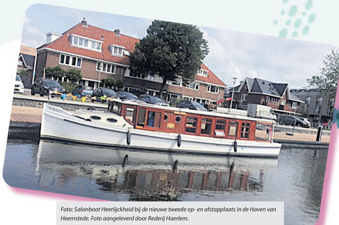
Foto: Salonboot Heerlijkheid bij de nieuwe tweede op- en afstapplaats in de Haven van Heemstede.

pardoes terug in de tuin, maar plaats ze regelmatig overdag buiten en 's nachts binnen. Zodra de temperatuur ook 's nachts stabiel boven het vriespunt blijft, kun je ze weer dag en nacht buiten laten staan. Meestal is dat pas vanaf mei het geval. Wil je graag rozen in je tuin? Dan heb je de komende weken nog een laatste kans om ze te planten. Als je er voldoende op tijd bij bent, zullen ze deze zomer