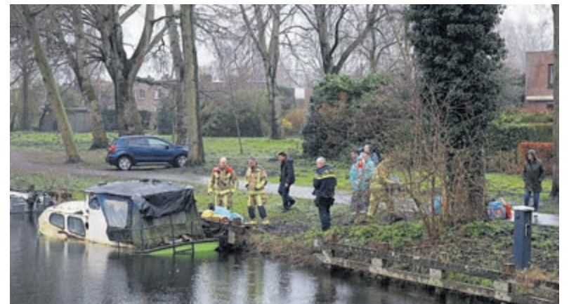
Inter Visual Studio / Kyrlian de Bot.